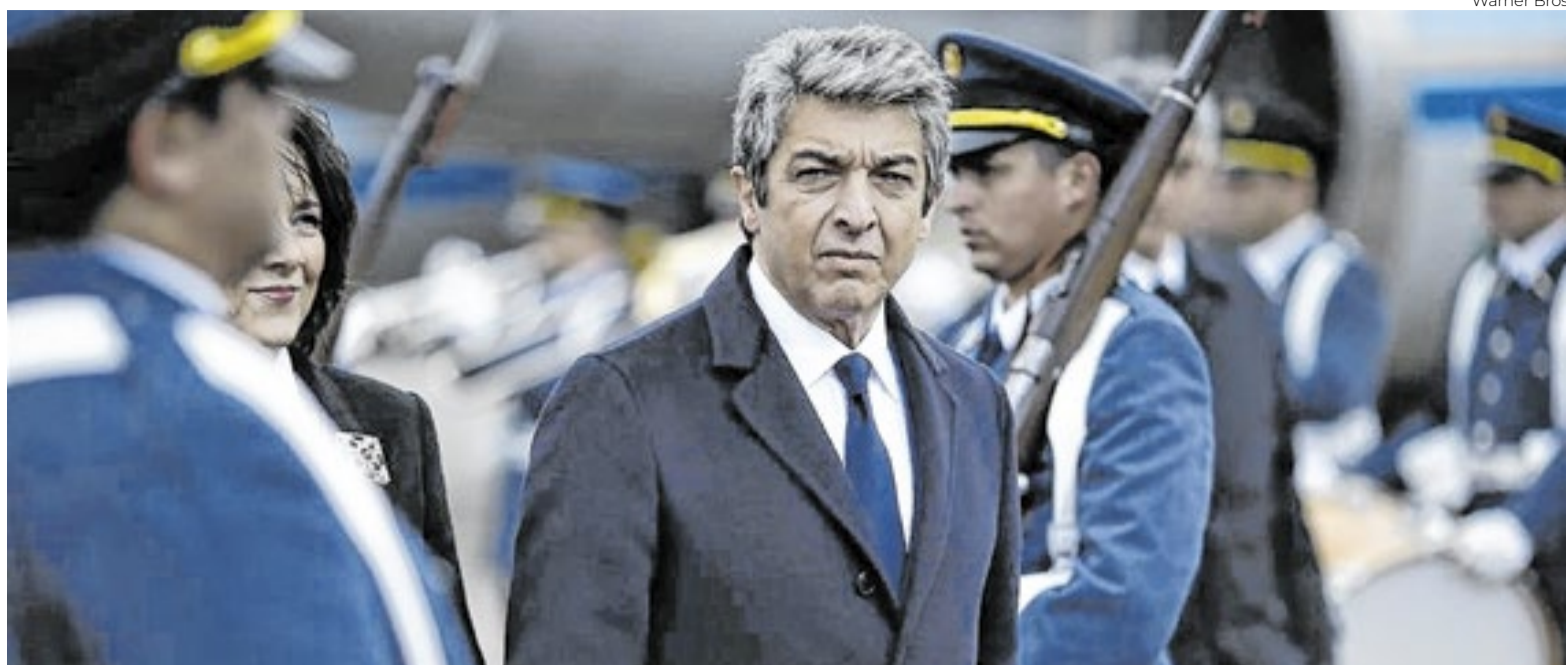
‘A Cordilheira’ concorreu em Cannes, em 2017, na mostra Un Certain Regard

O evento vai até o dia de abril e apresentará os primeiros longas de prestígio comercial de Darín, como “El Mismo Amor, La Misma Lluvia” (1999), que determinou a força de sua parceria com o realizador Juan José Campanella. Os dois ajudaram o país a conquistar um Oscar, em 2000, com “O Segredo