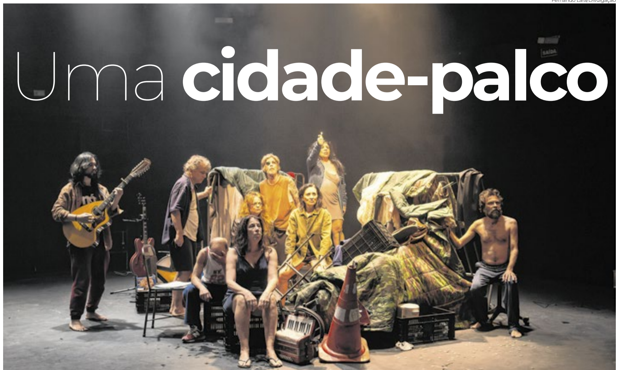
(Um) Ensaio Sobre a Cegueira