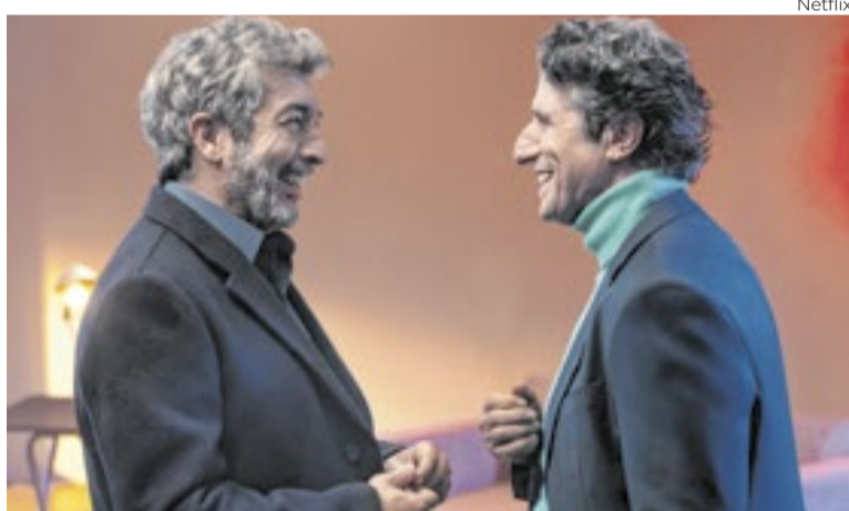
Darín e Diego Peretti em ‘Lo Dejamos Acá’, o trabalho mais recente