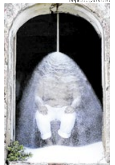
Luiz Pizarro - Coração Partido (1995)