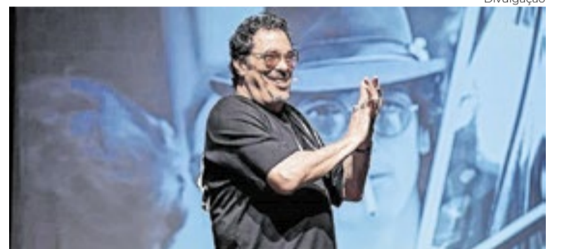
Na Marca do Pênalti

GUAÍRA - GUAIRÃO - Maracanã do nosso teatro, o Guáira - Guairão receberá espetáculos como a estreia nacional de “Na Marca do Pênalti”, em que o comentarista esportivo, jornalista e ex-futebolista brasileiro Walter Casagrande Júnior revisita sua carreira e também encara os clássicos mais difíceis de sua vida. Por lá passa também o aclamado