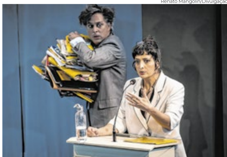
Like a Clown