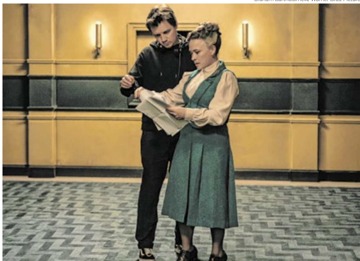
Kirill Sokolov dirigiu a fantástica Patricia Arquette, que interpreta a governanta Lily Woodhouse

A trama é ambientada no Hotel Virgil, prédio secular de Nova York que viu o bairro prosperar com o passar dos anos e virou um grande monumento secreto ao demônio do coração da cidade que nunca dorme. O diretor revelou que, por mais inacreditável que pareça, a trama foi inspirada em um fatos reais. "Há uma história real que inspirou a do filme. Há oito anos, minha esposa e eu nos mudamos para um