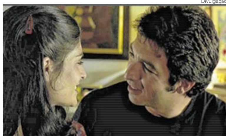
Soledad Villamil e Darín em ‘O Mesmo Amor, A Mesma Chuva’