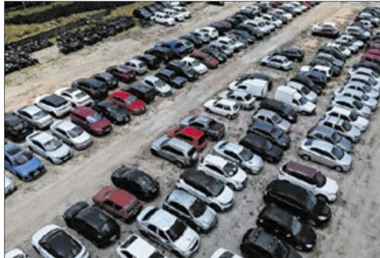
Procura por veículos usados segue como tendência estrutural

A maior procura por veículos usados segue como tendência estrutural. Sales explica que o alto impacto tributário sobre carros zero quilômetro torna os usados