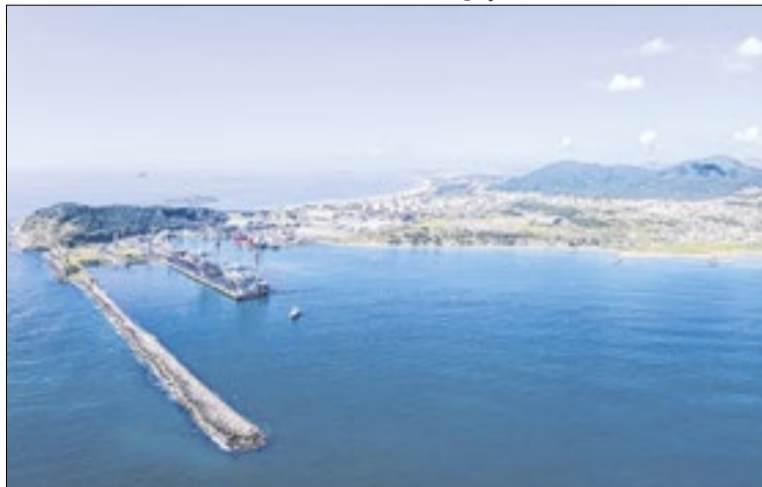
As exportações cresceram 135% em relação a 2025

O Porto de Imbituba, em Santa Catarina, movimentou mais de 641 mil toneladas em fevereiro de 2026 e registrou 27 atracações. O resultado está entre os maiores já verificados para o período e mantém a sequência de crescimento observada no início do ano. As exportações somaram 392,5 mil toneladas.