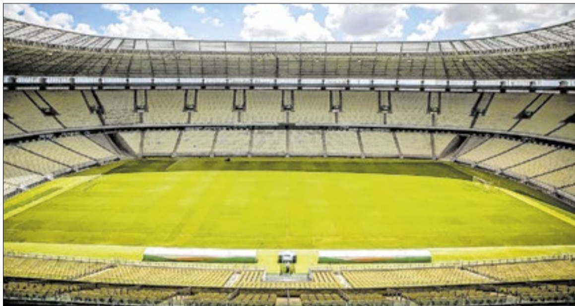
O programa vai ao ar todas as segundas-feiras

Atuando com uma formação alternativa e dando oportunidade