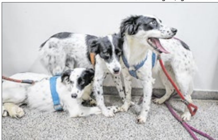
O governo estuda cadastrar novas clínicas para o programa

Outra mudança é a inclusão do exame de hemograma antes da intervenção. A medida per-