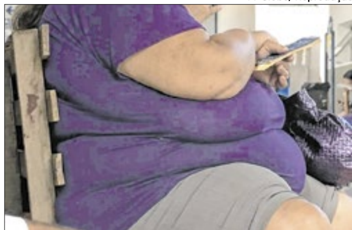
Pessoa obesa aguarda em posto de saúde no DF