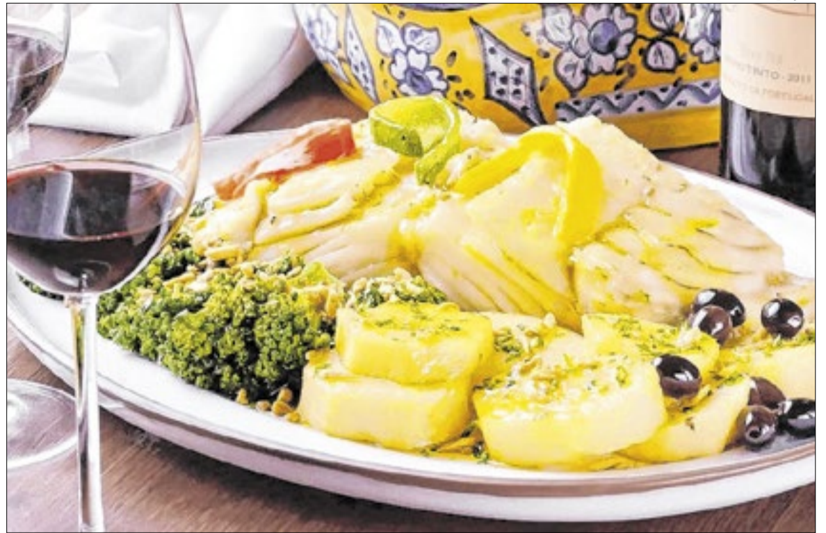
Bacalhau, produto importado, registrou alta, com preço médio de R$ 116,31 por quilo em 2025

Além dos chocolates, a pesquisa incluiu produtos da mesa de Sexta-Feira Santa. Uma posta de bacalhau de 1 kg variou de R$ 89,90 a R$ 139,90 (55,6% de diferença) e o salmão fresco de 1 kg foi encontrado entre R$ 52,50 e R$ 89,90 (71,2%). Produtos como camarão médio 500 g também mostraram grande variação, custando de R$ 34,90 a R$ 59,90. A cesta média de Páscoa passou de R$ 200 em 2025 para R$ 233,70 em 2026, alta de 16,85%, influenciada pelo aumento do preço internacional do cacau, estratégias comerciais sazonais e o reposicionamento de