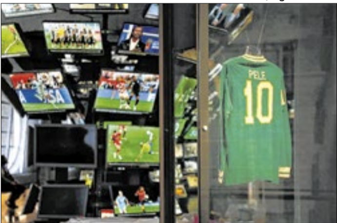
Museu do Futebol lança audioguia em formato de rádio