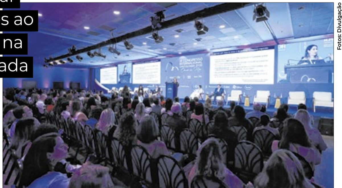
Congresso aconteceu no último fim de semana no Rio