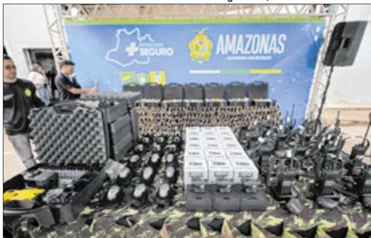
Equipamentos se integram ao Sistema Paredão

O governador do Amazonas, Wilson Lima (União Brasil) entregou, nesta segunda-feira (30) um novo pacote de tecnologias para reforçar a segurança pública no Amazonas, com foco na ampliação do monitoramento, da resposta rápida às ocorrências e da integração das Forças de Segurança.