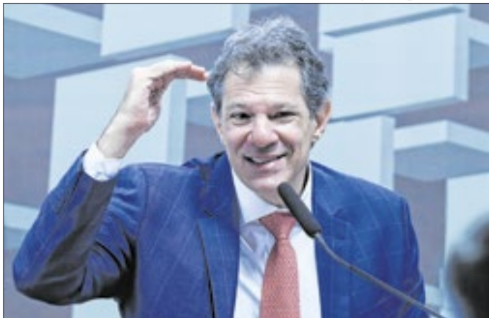
Ex-ministro lidera entre eleitores de até 34 anos