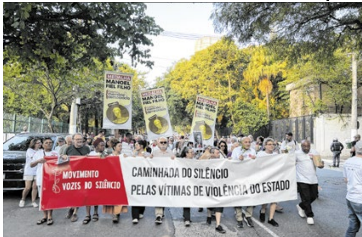
O cortejo seguiu rumo ao Monumento em Homenagem aos Mortos e Desaparecidos Políticos

“O lema da caminhada traz essa discussão: tentar entender quais são os impactos do período da ditadura militar no presente, no período contemporâneo, pra gente pensar um pouco o futuro”,