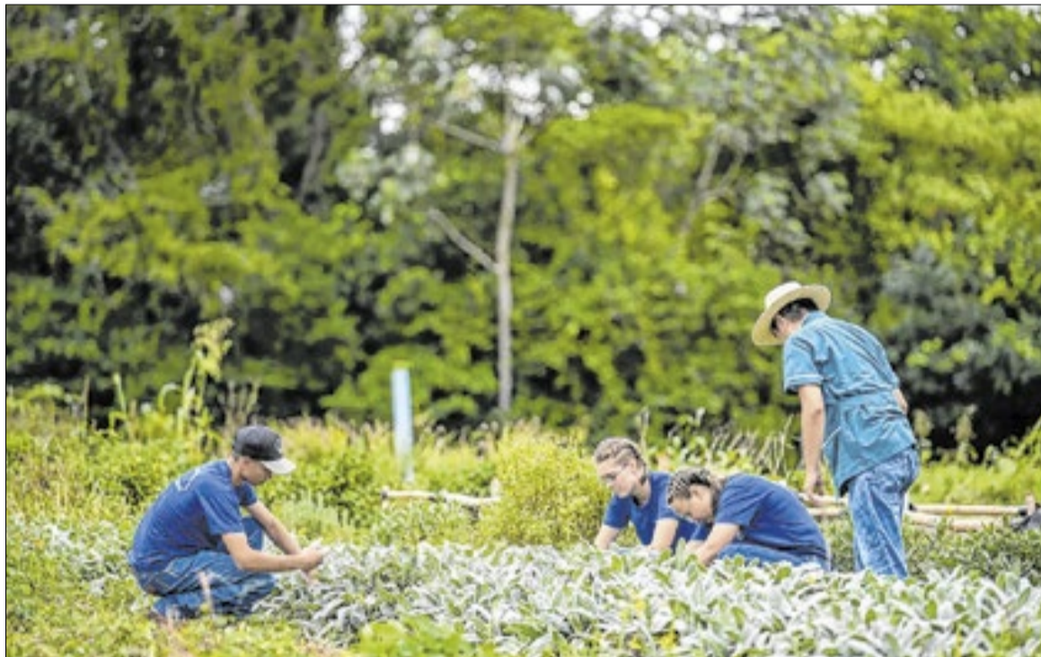
Escola tem 150 alunos em internato e mantém metade da área como reserva legal

A comercialização ocorre por meio de cooperativa escolar, em