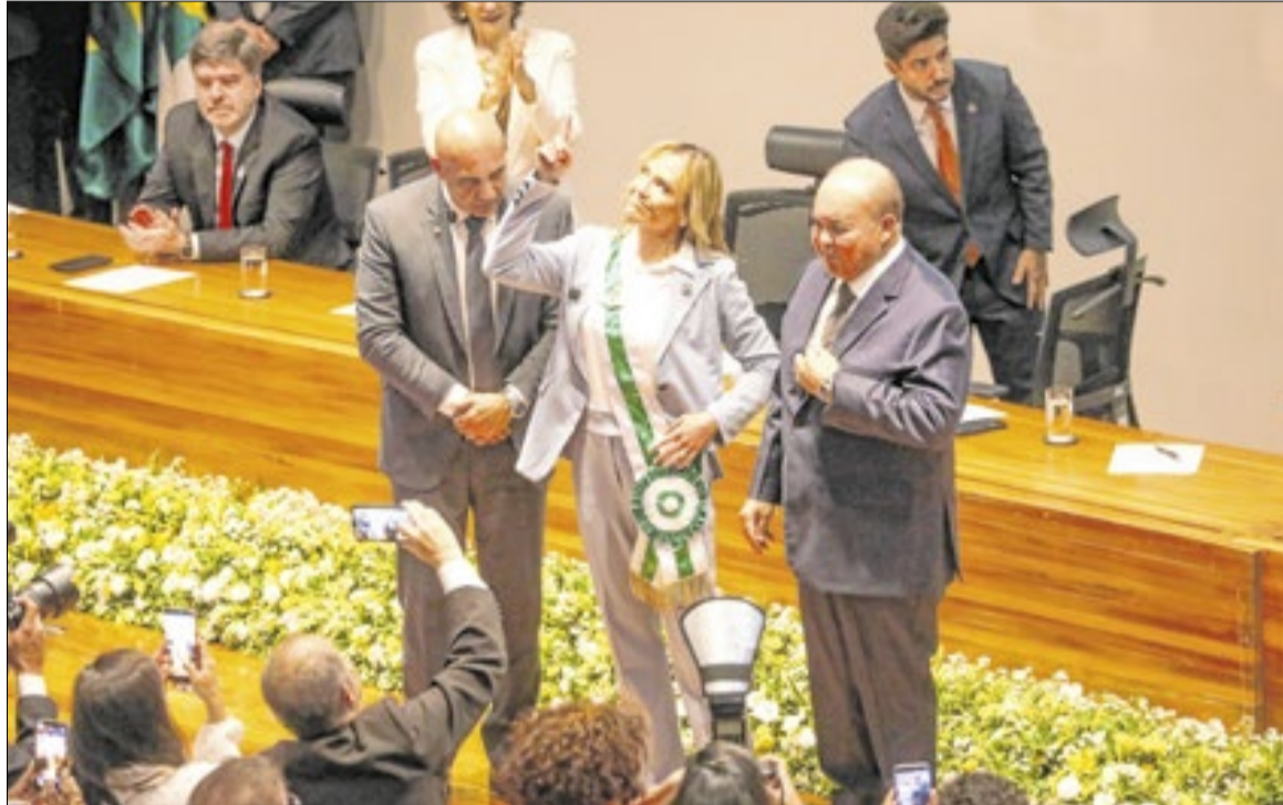
Celina assume governo para disputar a reeleição

Celina Leão assumiu o Governo do Distrito Federal (GDF) ontem (30) em solenidade realizada na Câmara Legislativa do Distrito Federal (CLDF). A solenidade contou com a participação de representantes dos Três Poderes, parlamentares e representantes do Senado, deputados, desembargadores além de familiares e amigos da atual governadora. Celina tomou posse após Ibaneis Rocha renunciar ao cargo, no sábado (28), a fim de cumprir o prazo de desincompatibilização exigido pela legislação eleitoral, visando às eleições de 2026. A governadora cumprirá mandato até o dia 6 de janeiro