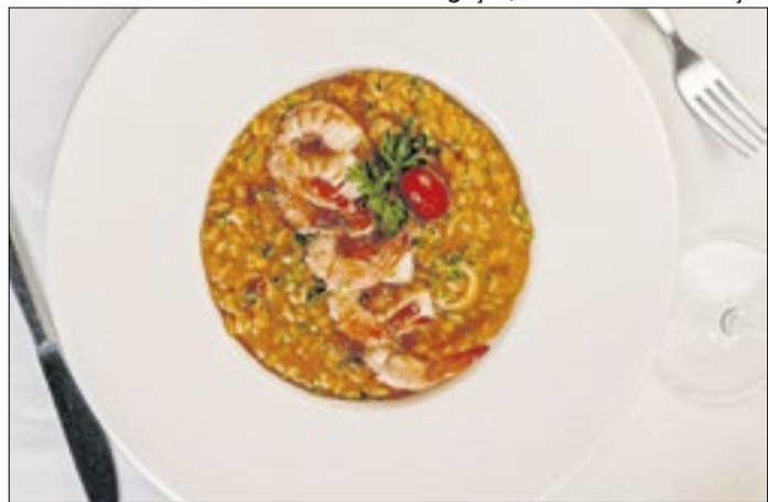
Como prato principal, o destaque é o Risoto al Mare