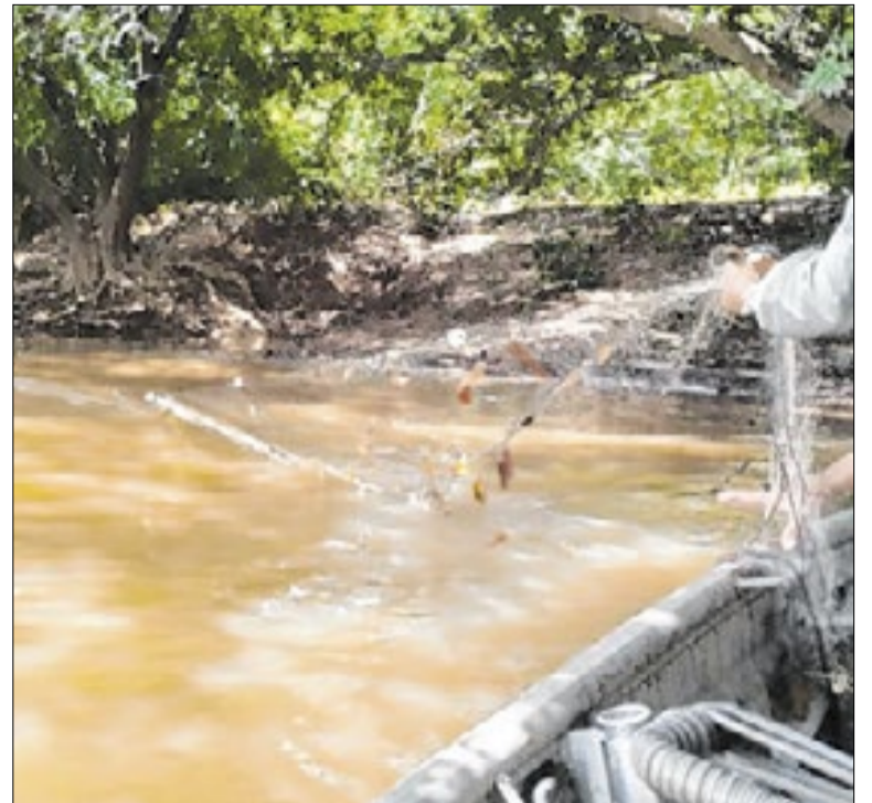
Redes encontradas durante a operação

A Prefeitura de Porto Velho (RO) informa que o Parque da Cidade será fechado temporariamente a partir desta segunda-feira (30) para montagem da estrutura da programação de Páscoa. O parque será reaberto no dia 1º de abril e funcionará até o dia 5 em horário especial, das 16h às 22h.