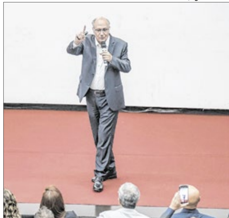
Mesmo Alckmin teria desempenho pior que Haddad