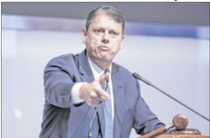
Governador de SP, Tarcísio de Freitas