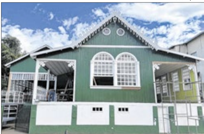
Obra revitalizou prédio histórico de Rio Branco