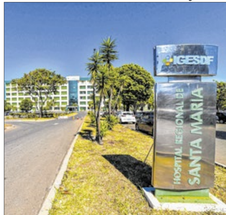
IGES-DF informou que colaboradora foi afastada

O lançamento reafirma o compromisso do grupo em beber das matrizes do samba e, ao mesmo tempo, experimentar novas fusões sonoras.