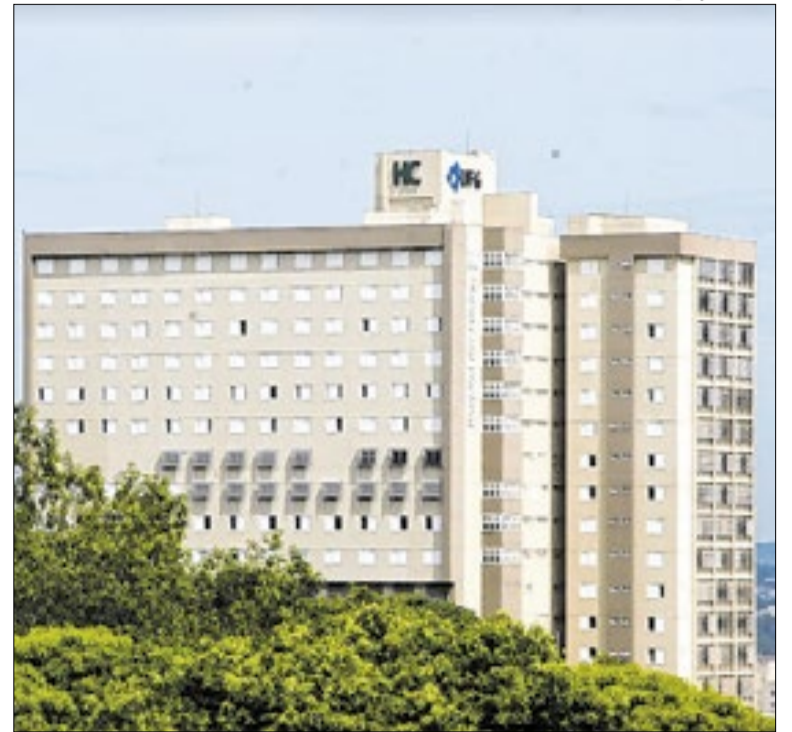
Hospital da Universidade Federal de Goiás é afetado pela greve

O Governo de Sergipe encaminhou à Assembleia Legislativa projetos de lei que preveem reajustes salariais entre 4,26% e 7% para cerca de 66 mil servidores ativos e inativos. As propostas contemplam diversas carreiras do funcionalismo e integram a política estadual de valorização profissional.