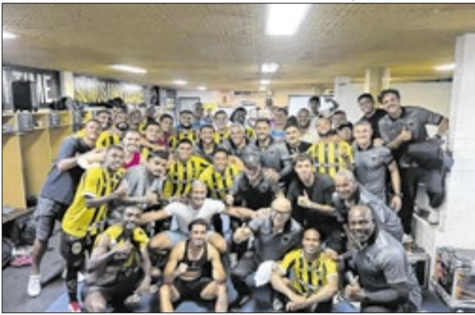
Sampaio Corrêa e Volta Redonda se destacaram