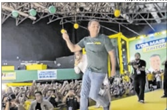
Entrada de Caiado pode estancar subida de Flávio