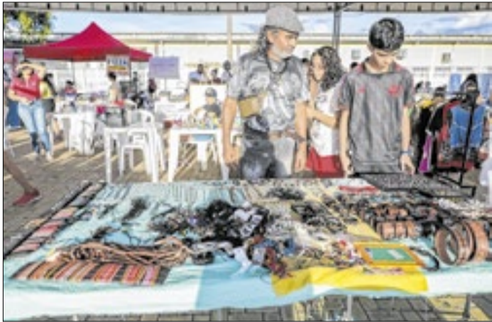
Feira reuniu mais de 80 expositores