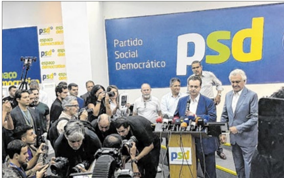
Kassab fez escolha mais à direita para o pleito presidencial com Caiado