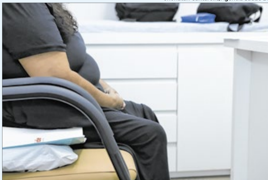
Em 2023, 60,3% dos brasilienses já apresentavam sobrepeso