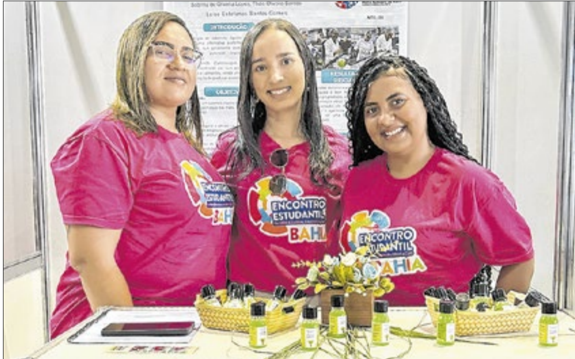
A próxima etapa do projeto é focada na aprimoração

A iniciativa deu tão certo que o produto desenvolvido foi destaque no Encontro Estudantil da Secretaria da Educação, evento que reúne projetos inovadores produzidos por estudantes