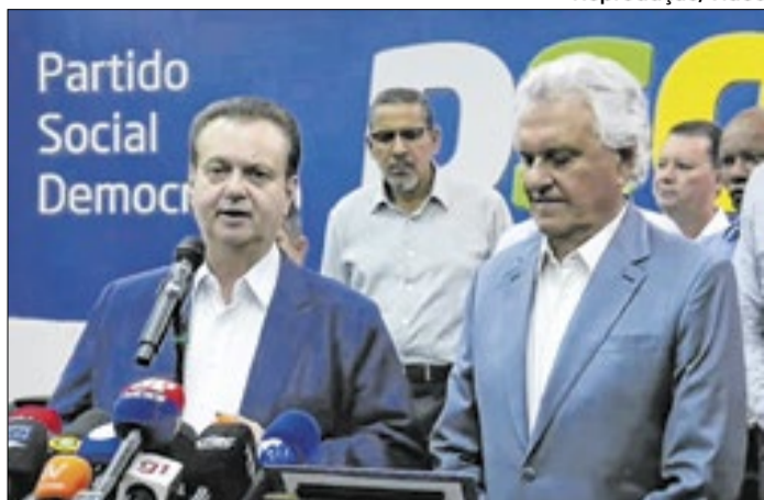
Caiado deve tirar votos de Flávio na disputa