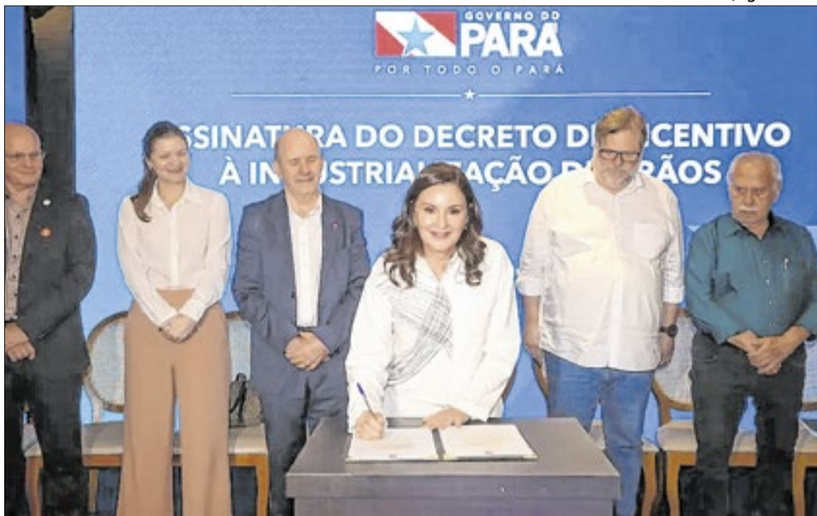
A vice-governadora assinou o termo que adia a cobrança do imposto

“Sou da área financeira, da área de planejamento e fico muito feliz de participar de eventos como este que tratam do desenvolvimento do nosso estado.