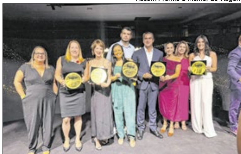
Cerimônia de entrega foi realizada no Rio de Janeiro

Além do reconhecimento como Melhor Estado para Lazer, Alagoas também venceu em outras cinco categorias: Melhor Cidade, com Maceió; Melhor Destino de Praia, com Maragogi; Melhor Pousada de Praia, com a Antunina; Melhor Resort, com o Japaratinga Lounge Resort; e na categoria inédita Top of Mind, com o Grupo Amarante,