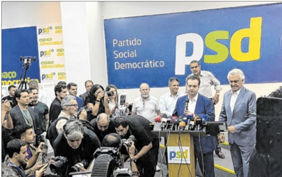
Kassab fez escolha mais à direita para o pleito presidencial com Caiado