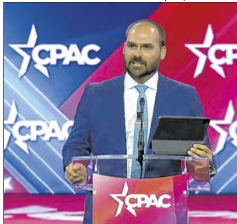
Eduardo: "Estou mostrando ao meu pai"

Pelo lado do PL de Flávio, porém, há uma leitura de que Caiado o ajudaria na tarefa de tentar se apresentar como um Bolsonaro mais moderado. Caiado iria para o ataque, preservando Flávio. O presidente do PL, Valdemar Costa Neto, inclusive, tem aconselhado Flávio Bolsonaro a não atacar Lula diretamente.