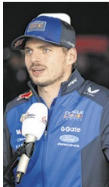
Max Verstappen é o maior crítico do atual regulamento da Fórmula 1

tentei otimizar a corrida de hoje, mas o carro continua sendo o mesmo”, reclamou a alguns jornalistas, depois de terminar longe dos primeiros colocados em Suzuka.