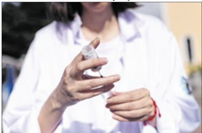
Campanha contra a gripe no município