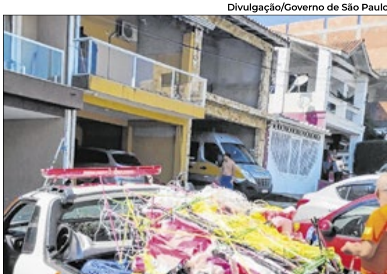
Combate a incêndios e soltura de balões

A Defesa Civil do Estado de São Paulo aproveitou e reforçou os riscos de estiagem e incêndio e, além disso, destacou que a soltura de balões é considerado um crime