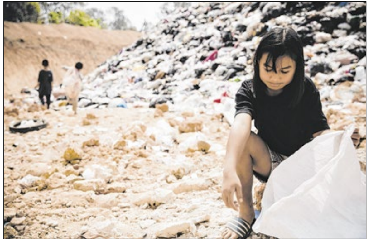
Segundo dados do órgão, as denúncias cresceram 46% entre 2024 e 2025 na região

A Prefeitura de Campinas, no entanto, afirma que esteve presente. Em nota, o Executivo informou que foi representado por um coordenador pedagógico da Secretaria de Educação e confirmou a adesão ao projeto neste ano, assim como em