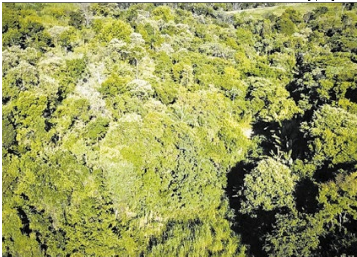
O monitoramento fortalece a preservação e ajuda na recuperação do território paulista

Com o avanço do monitoramento, a Semil conseguiu identificar 2.741 alterações na vegetação nativa entre 2023 e 2025, o equivalente a 5.392 hectares com algum tipo de intervenção am-