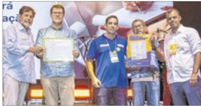
O deputado e ex-secretário recebeu diversas homenagens durante a ExpoRio Turismo 2026