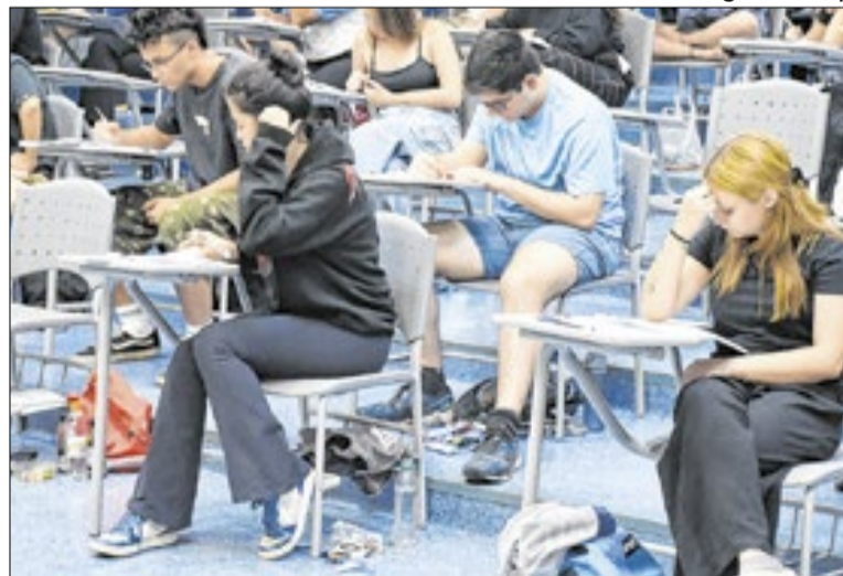
A primeira fase será em 18/10, a 2ª nos dias 29 e 30/11

O calendário do Vestibular 2027 foi definido conjuntamente entre os responsáveis pelos vestibulares