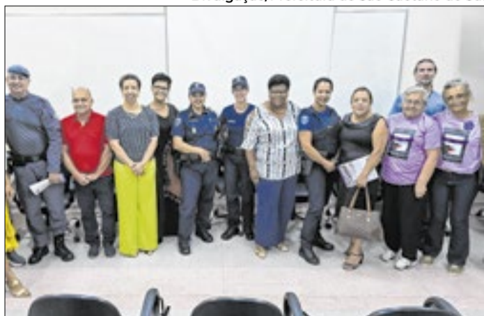
Encontro reuniu forças de segurança e rede de proteção