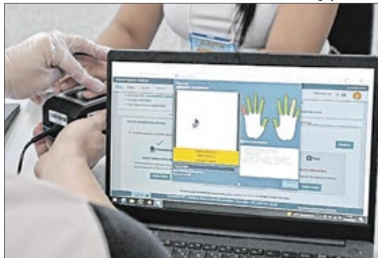
Mobilização busca facilitar regularização antes do fim do prazo

Ao longo do mês de abril, a mobilização se intensifica com a