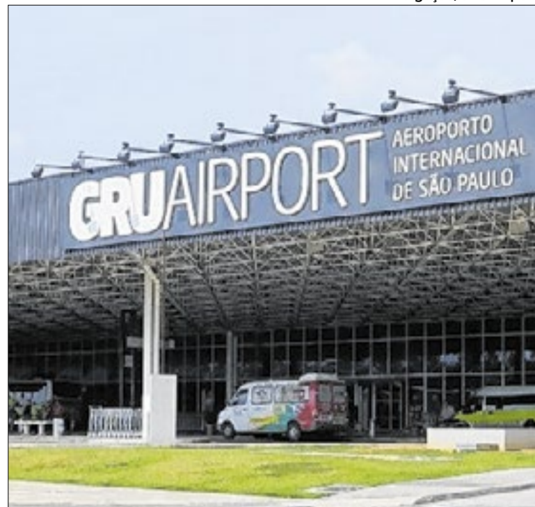
272 passageiros e 14 tripulantes ficaram em segurança

A UBS será construída na Rua Cerro Largo com a Rua Ozias Teodoro de Souza. A unidade será de Porte III, e contará com equipes de Saúde da Família, Saúde Bucal e Multiprofissionais. Isso amplia o acesso aos serviços de Atenção Primária em Saúde e o torna mais humanizado e acessível. O prazo de entrega é um ano.