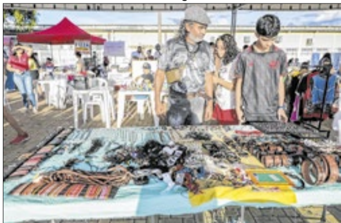
Feira reuniu mais de 80 expositores