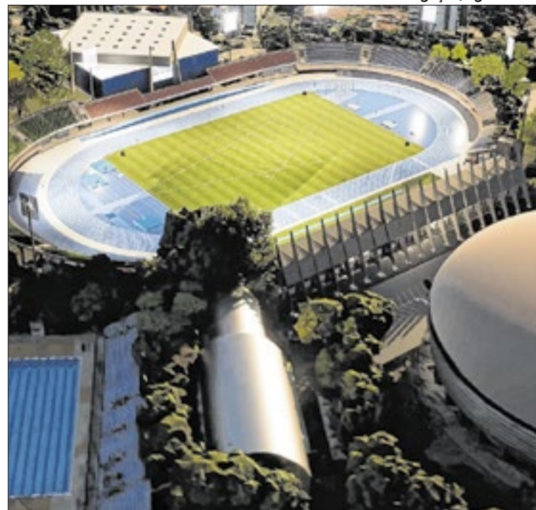
Representação artística do Complexo Esportivo do Ibirapuera

A Câmara Municipal de SP promoveu nesta segunda-feira (30) a Sessão Solene para entrega do Prêmio Marielle Franco de Direitos Humanos. Realizada anualmente no mês de março, a premiação, que está em sua 3ª edição, busca valorizar personalidades que atuam em prol dos direitos humanos.