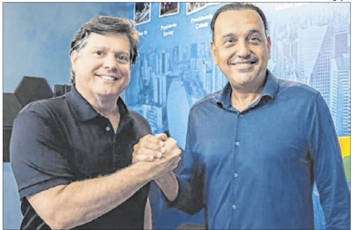
Vice-governador Ramuth filiou-se ao MDB após convites de Baleia Rossi, presidente nacional

A ida do vice-governador para o MDB tem efeitos que vão além da dinâmica estadual.