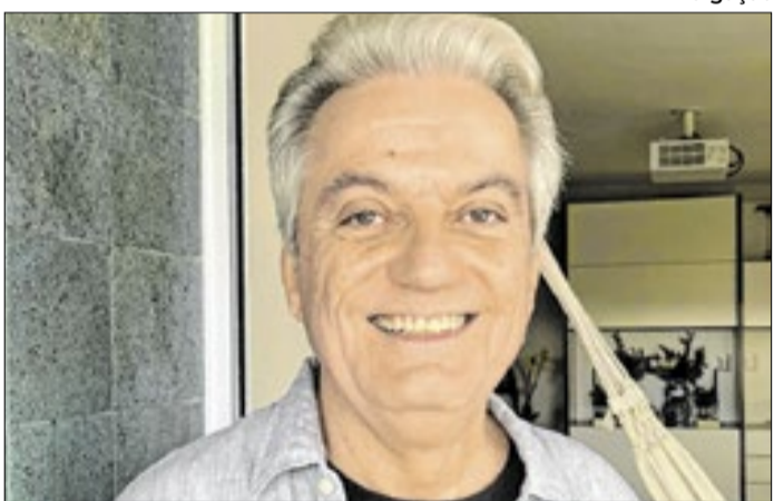
O músico brasileiro Pedro Noleto