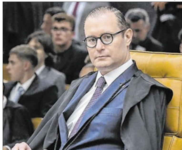
Zanin pediu destaque e levou a questão plenário físico

"Esta UBS vai levar a saúde para mais perto da casa dos moradores dos bairros Nações, Nações II, Nova América e Flamboyant", disse o governador Mateus Simões.