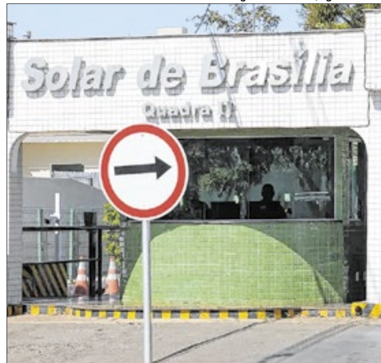
Bolsonaro cumpre domiciliar em condomínio de Brasília

Ao renunciar na véspera da provável cassação de seu mandato para forçar uma eleição indireta, Castro irritou parte do STF. O atropelo na eleição de Douglas Ruas (PL) para presidente da Assembleia Legislativa piorou tudo — ele é candidato à sucessão de Castro. O STF mandou parar tudo e vai definir as regras.