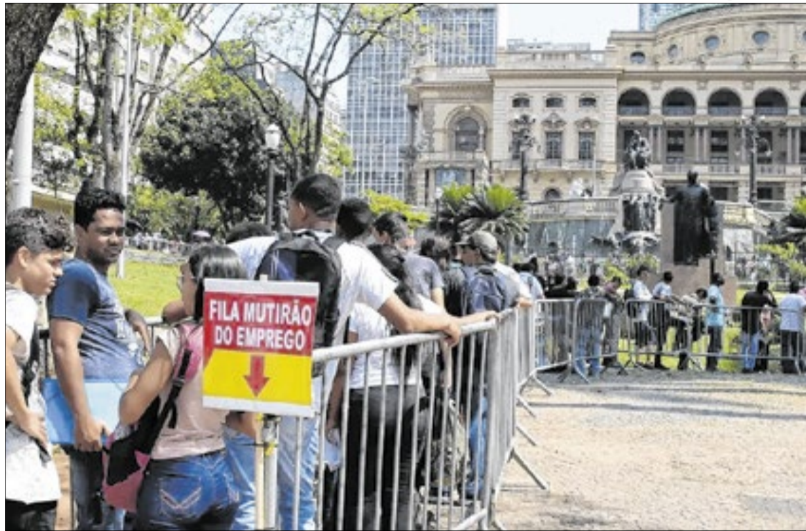
Saúde, Educação e Construção Civil foram mais responsáveis pelas demissões no início do ano

O número de trabalhadores do setor privado com carteira assinada permaneceu estável, em 39,2 milhões, representando