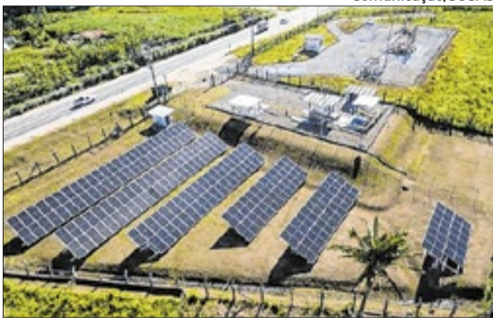
Projeto gerou energia e reduziu emissões