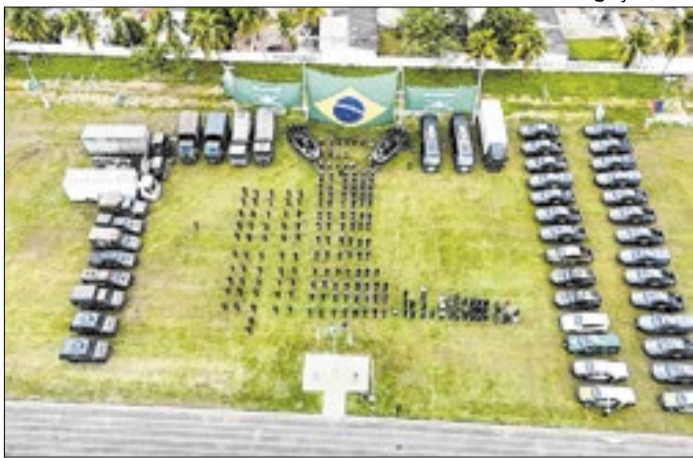
Diversos órgãos atuam na Terra Indígena Sararé