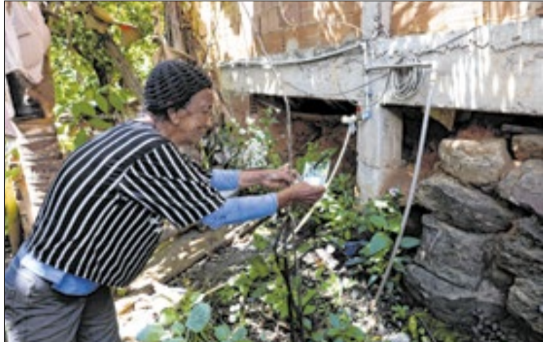
Espaço doa para moradores e ajuda a amenizar calor

A área de plantio é uma das 84 hortas mantidas pelas comunidades com o apoio da Prefeitura do Rio, por meio do programa Hortas Cariocas, criado há cerca de 20 anos. Em 2025, de acordo com a Secretaria de Ambiente Clima, a produção dessas