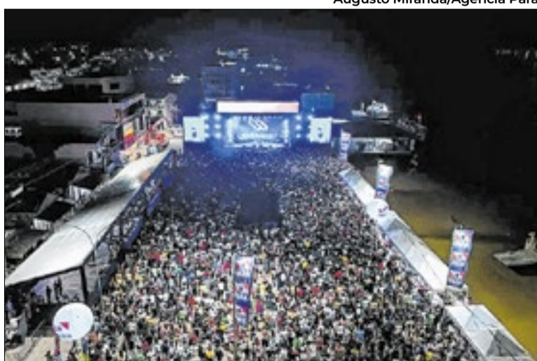
Braves foi o palco do evento gospel no Marajó

“Nessa primeira etapa, estamos realizando o festival em municípios-polo do Estado. Estivemos em Belém, agora estamos em Breves, no mês de abril estaremos em Marabá e, em seguida, em Santarém. Aquilo que dá certo a gente fortalece e amplia”, afirmou.