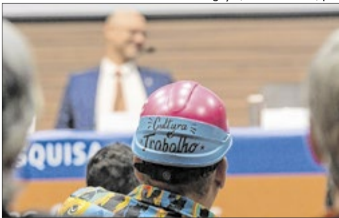
Grupo discute proposta legal para trabalhadores