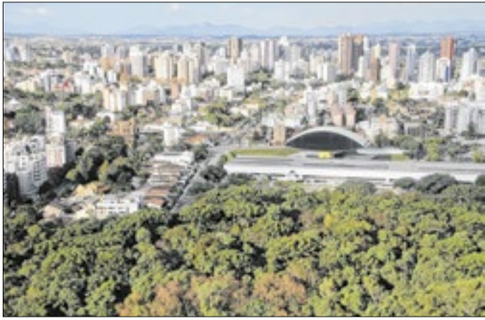
Seminário discute investimentos e gestão pública