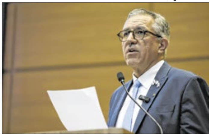
Ministro convocou a população para se imunizar