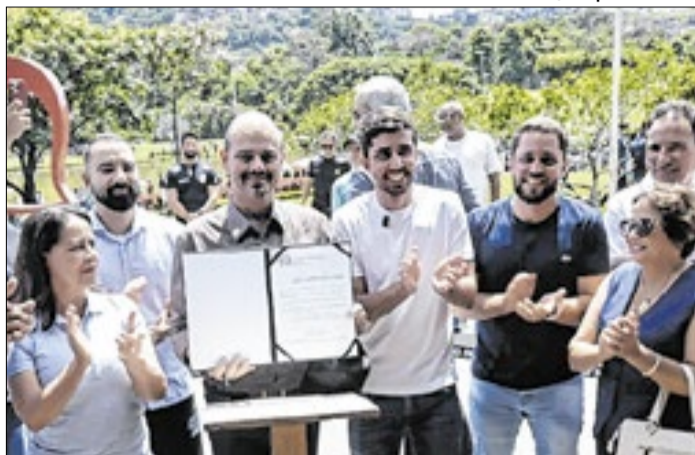
Atenção à mobilidade urbana para o Vale do Aço