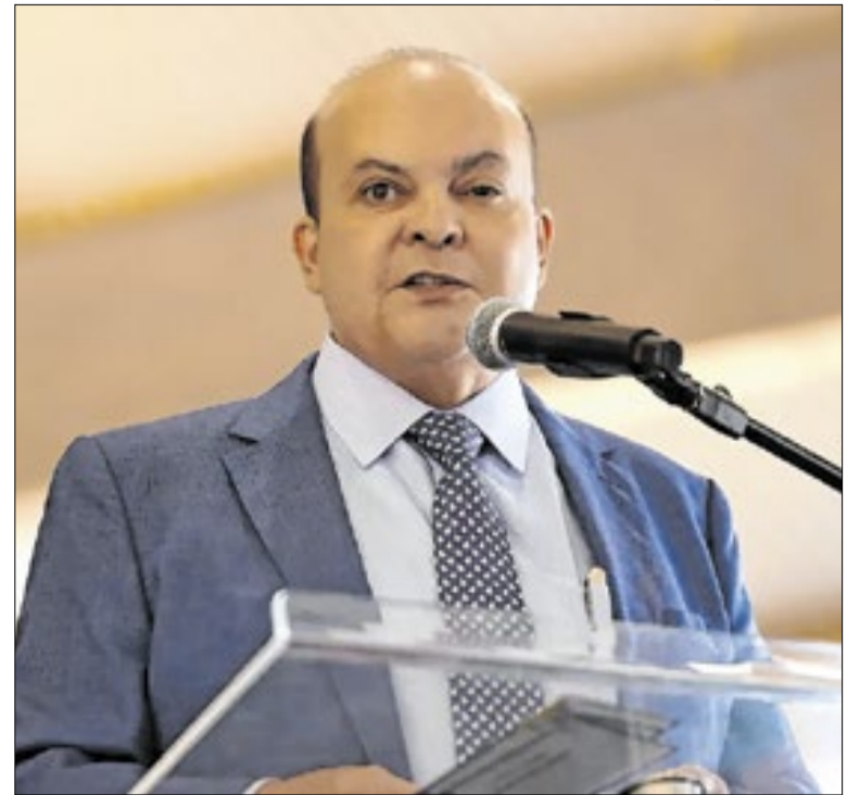
Governo tenta aportar recursos no BRB