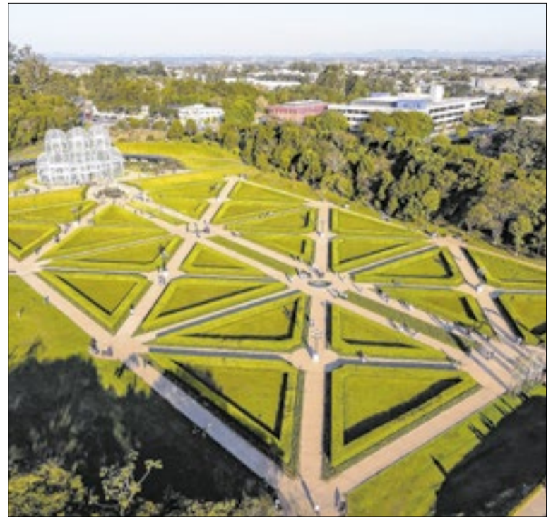
Estado aparece em rankings nacionais e internacionais

O Teatro da Reitoria da Universidade Federal do Paraná (UFPR) recebe na segunda-feira (30), em Curitiba (PR), a aula inaugural com uma palestra de Márcia Tiburi sobre "História do ódio às mulheres". O evento é gratuito e aberto ao público, com recepção, apresentação do Coro da UFPR e sessão de autógrafos.