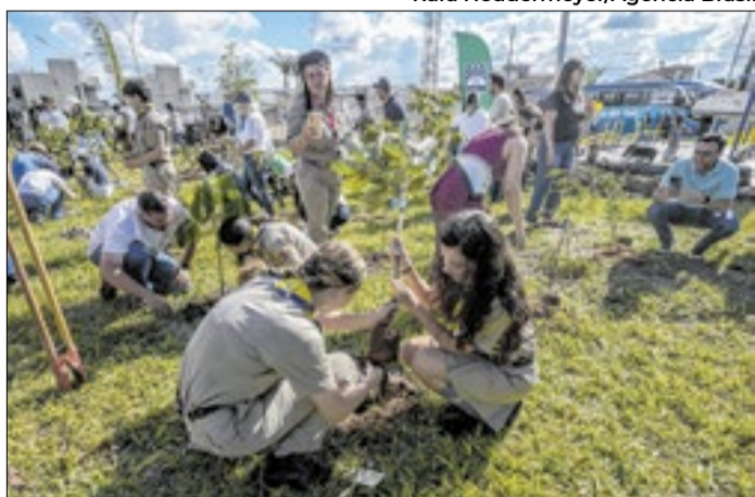
Representantes de diversos países plantaram 250 mudas