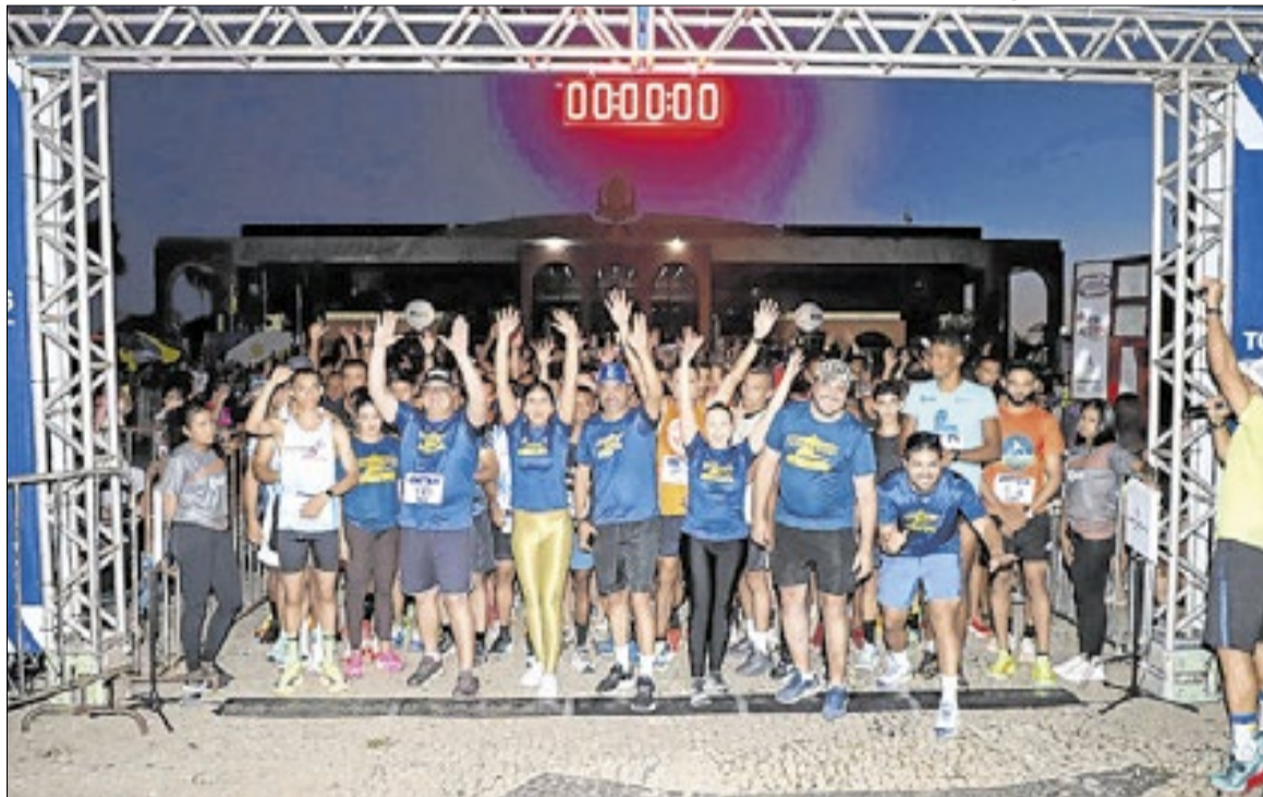
O governador participou da Corrida do Palácio Araguaia