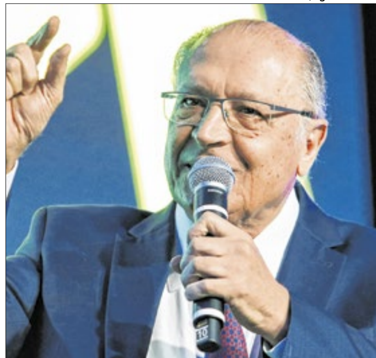
Destino de Alckmin é uma das incógnitas

Como mostramos aqui na quinta, cálculos semelhantes estão sendo feitos pela esquerda no DF, com a confusão em torno da situação do governador que sai, Ibaneis Rocha (MDB), e da governadora que entra, Celina Leão (PP), com a chapa pura para o Senado com Michelle Bolsonaro e Bia Kicis.