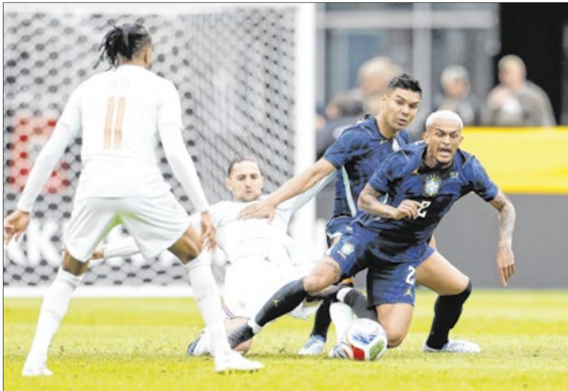
Derrota da Seleção Brasileira no amistoso contra a França ficou marcada por lesões

Aos 34 anos, longe de seu auge físico e com dificuldades para ajudar o Santos neste início de temporada, Neymar segue como esperança de parte da torcida brasileira após mais de dois anos desde sua última aparição com a camisa amarela, em