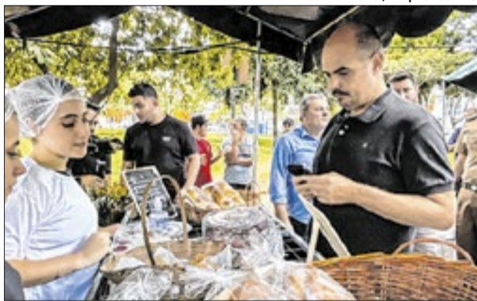
Projeto monta estrutura em 20 cidades do interior