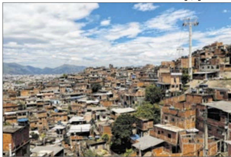
Observatório chegará a Manguinhos e Salgueiro

A força de trabalho que fará as medições de temperatura será contratada na própria comunidade.