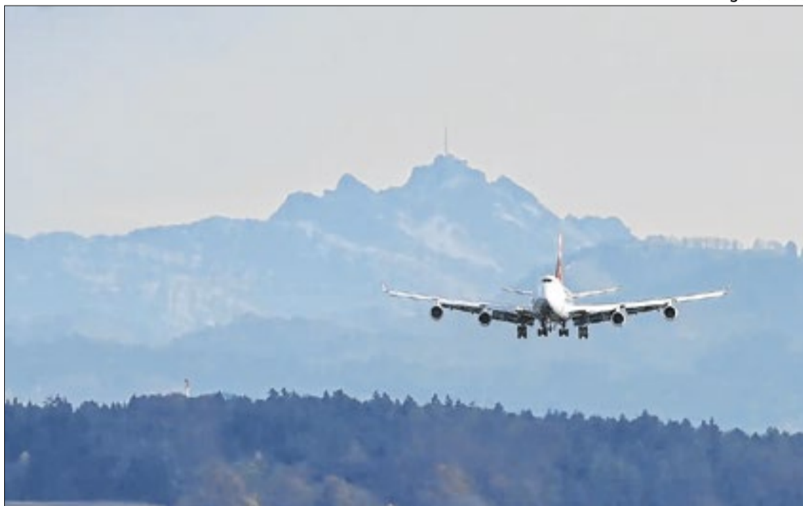
Dados são da plataforma de passeios Civitatis

A lista inclui ainda atrativos culturais e equipamentos turísticos, como beach parks, além de excursões ao Quilombo dos Palmares e à Foz do Rio São Francisco, que também se destacam na escolha dos visitantes. Esses roteiros reforçam o interesse crescente por experiências que combinam