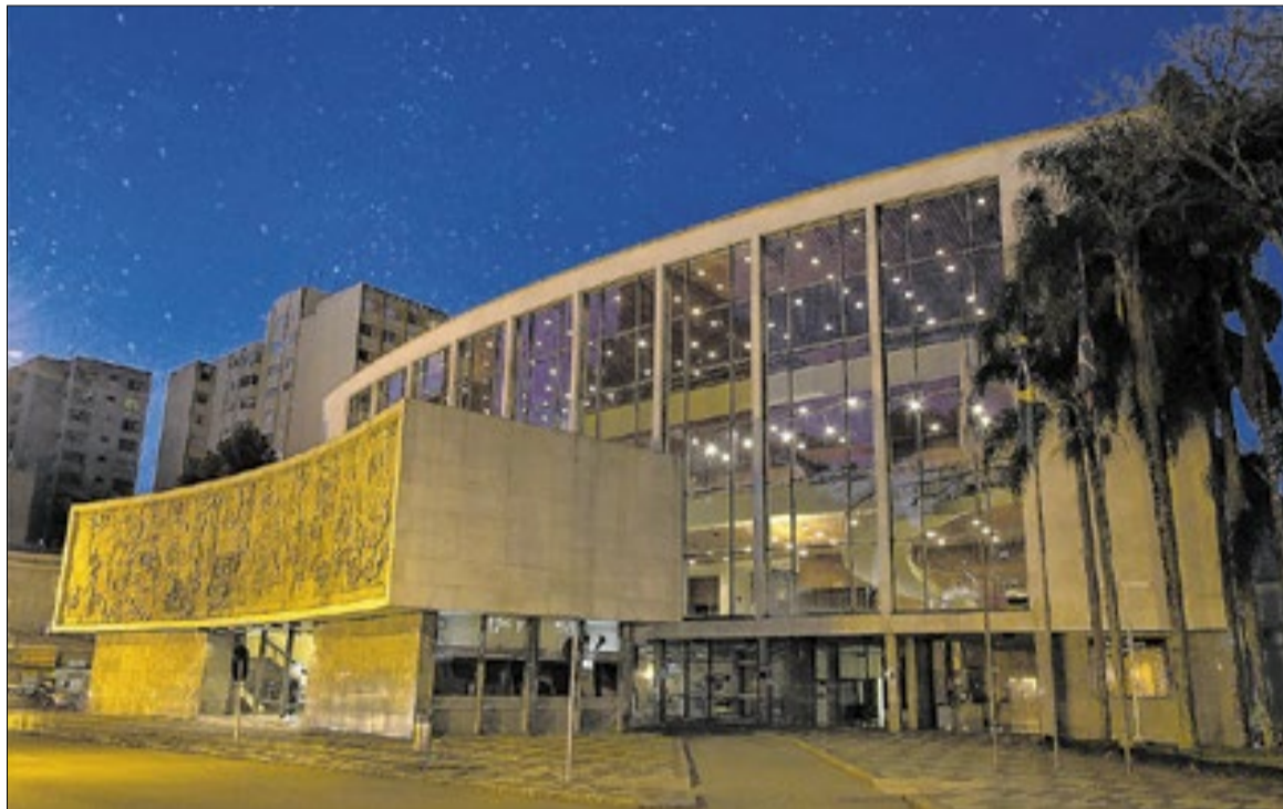
Público de diferentes regiões da capital acompanha atividades culturais em diversos espaços

Dados do Sindicato Empresarial de Hospedagem e Alimentação indicam que a ocupação