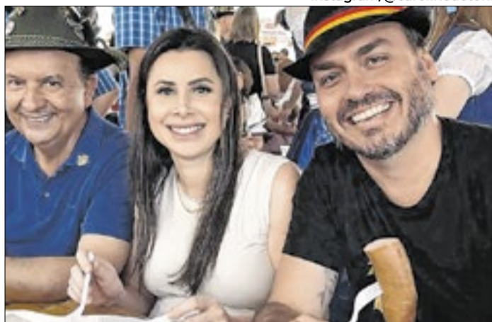
Os preteridos se uniram contra a chapa pura catarinense