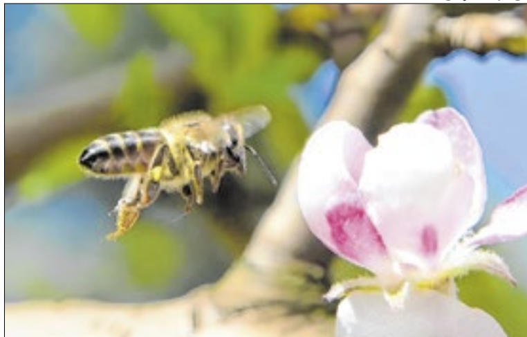
Encontros reúnem produtores do Extremo-Oeste catarinense

A proposta também inclui a formação de uma rede de apoio