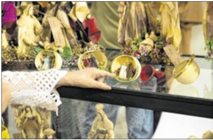
Artesanato de Goiás