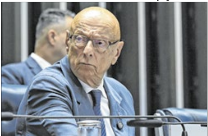
Amin será candidato único ao Senado na chapa