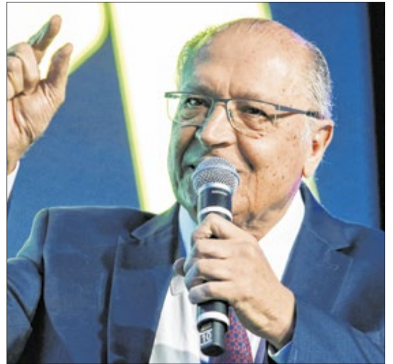
Destino de Alckmin é uma das incógnitas

Como mostramos aqui na quinta, cálculos semelhantes estão sendo feitos pela esquerda no DF, com a confusão em torno da situação do governador que sai, Ibaneis Rocha (MDB), e da governadora que entra, Celina Leão (PP), com a chapa pura para o Senado com Michelle Bolsonaro e Bia Kicis.