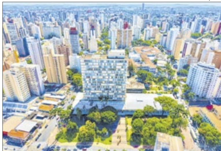
Prefeitura enviou à Câmara projeto de que cria Refis ISSQN

Para quem optar pelo parcelamento, as parcelas deverão ser pagas durante o ano de 2026.