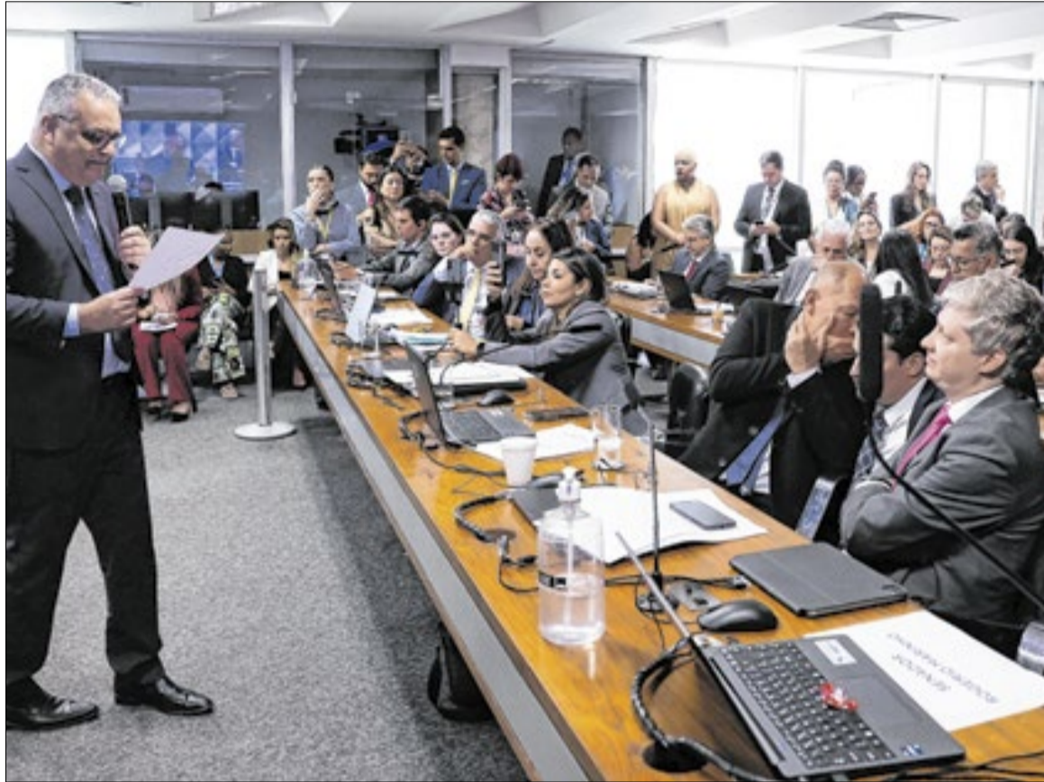
Relatório de Gaspar acabou rejeitado ao final da CPMI

Entre os pontos mais sensíveis, o texto lista 216 indiciamentos — incluindo parlamentares, ex-dirigentes do INSS, operado-