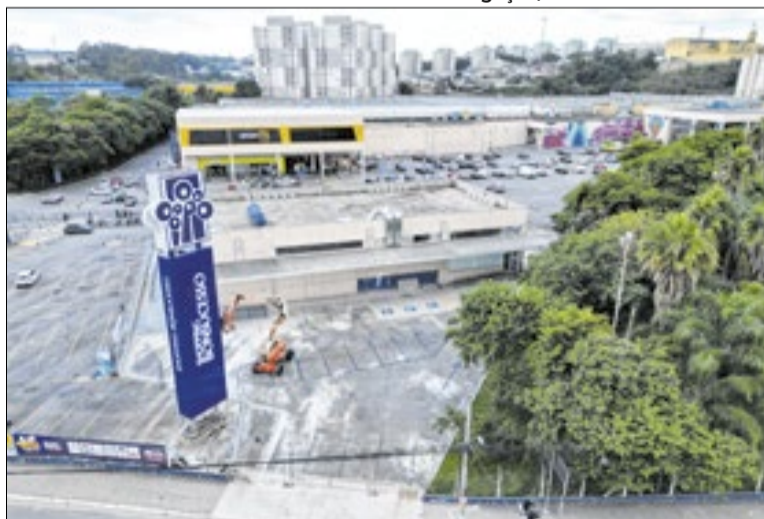
UPA Pimentas-Bonsucesso com obras quase finalizadas

salas de acolhimento e classificação de risco, curativas, medicação, inalação, raio-x e eletrocardiograma, além de áreas administrativas e acessibilidade aos que precisam.