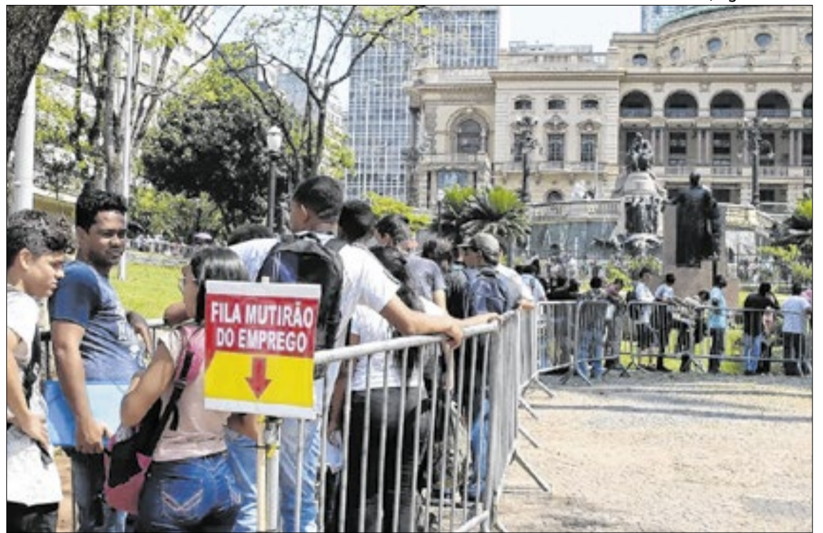
Saúde, Educação e Construção Civil foram mais responsáveis pelas demissões no início do ano

O número de trabalhadores do setor privado com carteira assinada permaneceu estável, em 39,2 milhões, representando