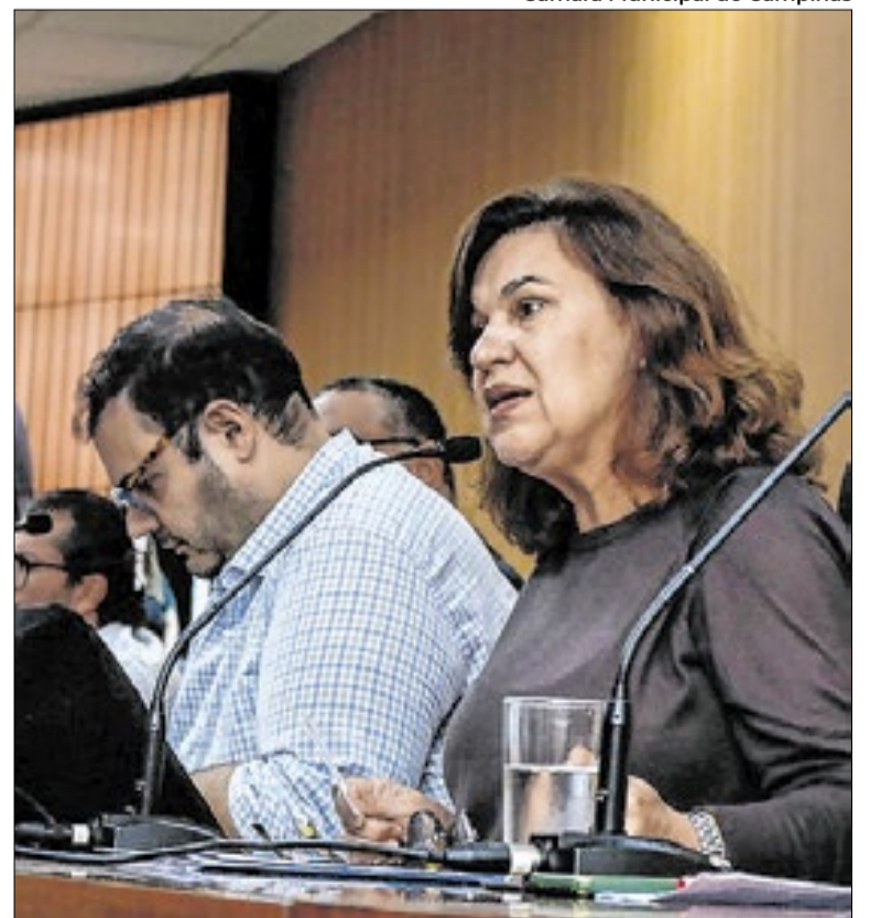
Equali-EJA poderá ser modelo para novo programa municipal