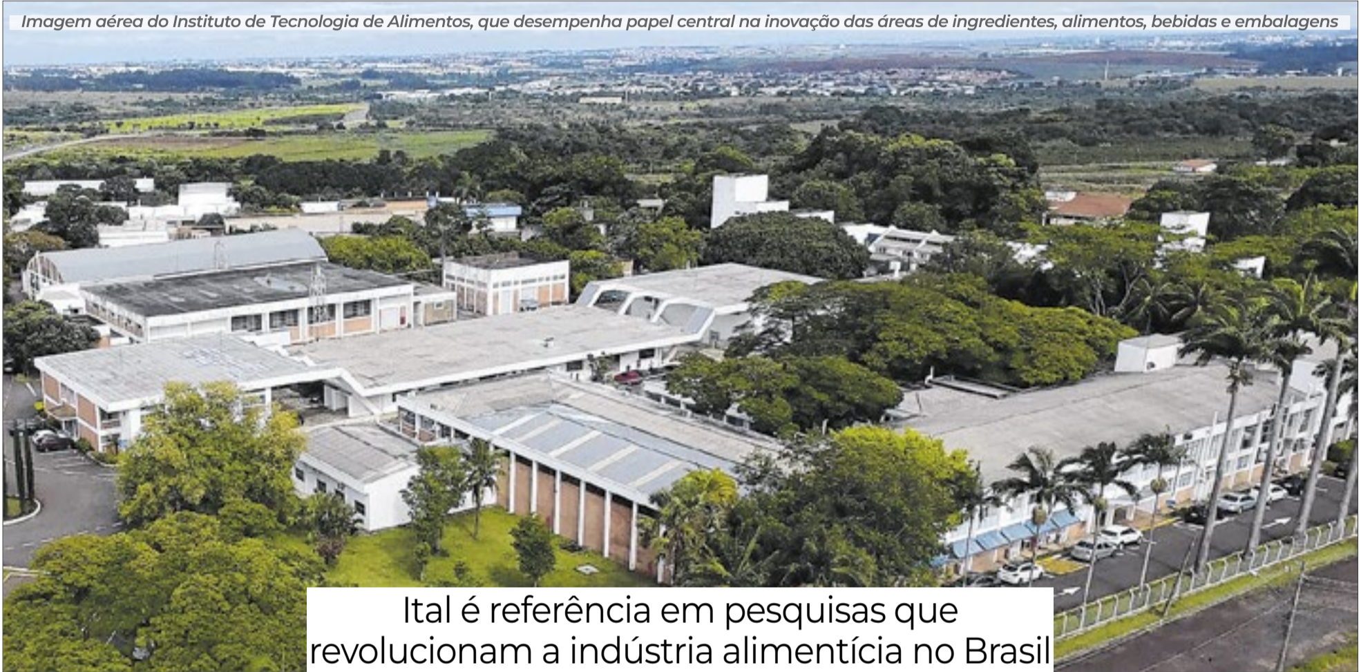
Imagem aérea do Instituto de Tecnologia de Alimentos, que desempenha papel central na inovação das áreas de ingredientes, alimentos, bebidas e embalagens

Ital é referência em pesquisas que revolucionam a indústria alimentícia no Brasil