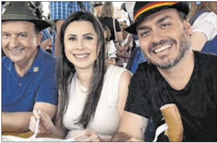
Os preteridos se uniram contra a chapa pura catarinense