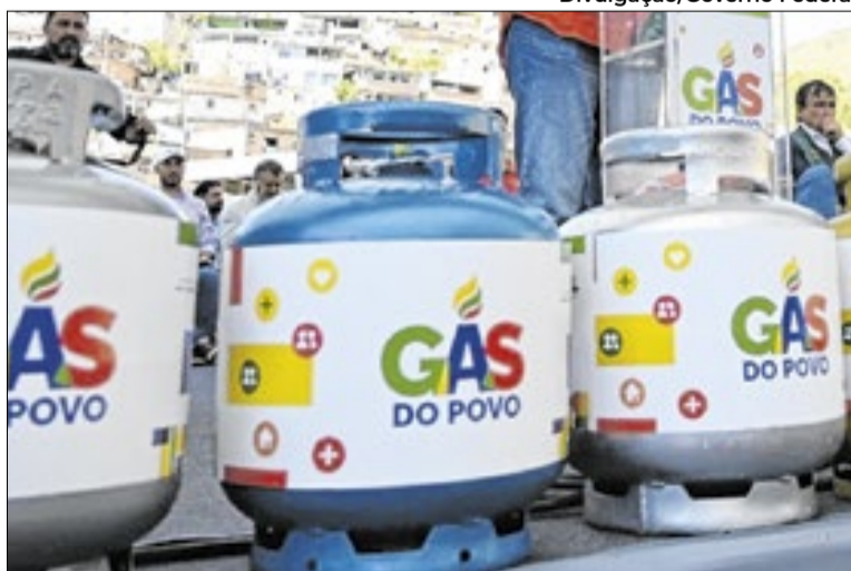
Programa assegura a recarga gratuita do botijão de 13 quilos

Pelas regras do programa, famílias com duas ou três pessoas podem receber até quatro recargas por ano, ou seja, um vale a cada três meses. Já as famílias com quatro ou mais pessoas podem receber até seis recargas por ano, o equivalente a um vale a cada dois meses. Das mais de 1,1