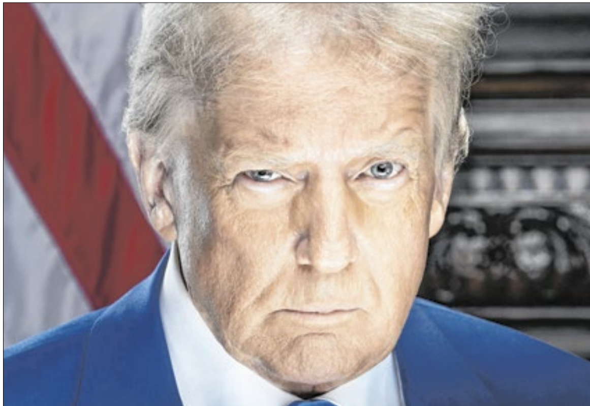
Instituto sueco, referência na pesquisa sobre o tema, alerta para declínio acentuado sob Trump

No mais recente relatório, Brasil e EUA dividem o status de “democracia eleitoral” —as eleições são livres e justas, o voto é universal, há liberdade de expressão e associação. Por outro lado, alguns aspectos das de-