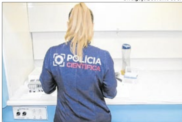
Proposta amplia benefício a peritos criminais e médicos legistas

Na mesma votação, os deputados da Alesp aprovaram o projeto de lei que reorganiza o plano de carreira da Polícia Ci-