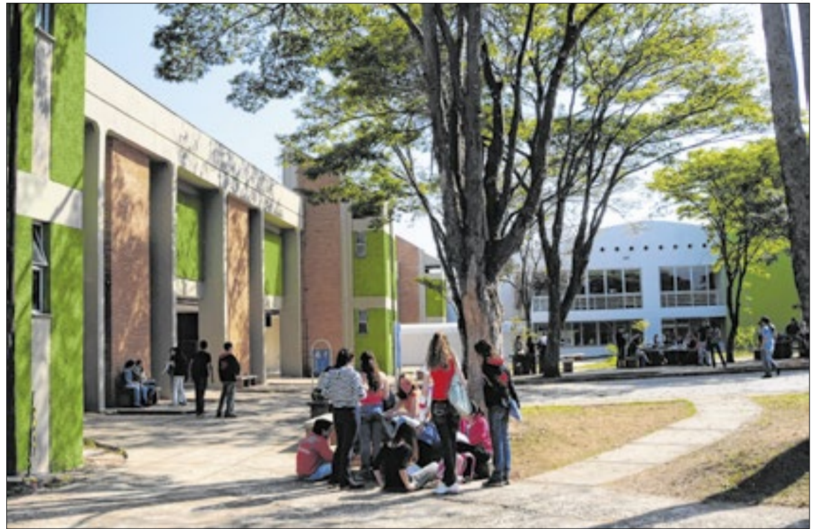
Polícia Federal instaurou um inquérito para investigar o crime

De acordo com a Unicamp, a comunicação imediata do caso à Polícia Federal e à Agência Nacional de Vigilância Sanitária (Anvisa) permitiu a rápida localização e apreensão dos materiais. As amostras foram encaminhadas ao Ministério da Agricultura