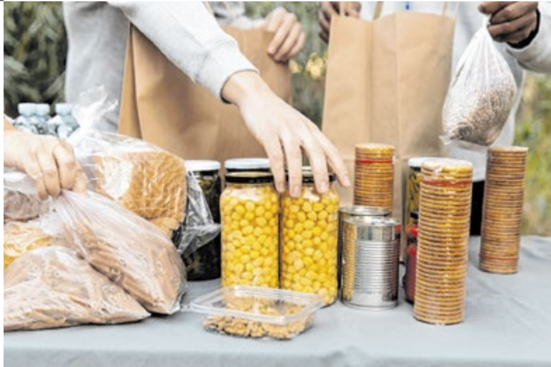
Instituto é estruturado em centros tecnológicos especializados e laboratórios de referência

Após mais de seis décadas de existência, o Ital permanece como uma instituição que opera nos bastidores da vida cotidiana. Raramente aparece nas manchetes, mas influencia o que se come, como se produz e de que forma os alimentos são preservados e distribuídos.