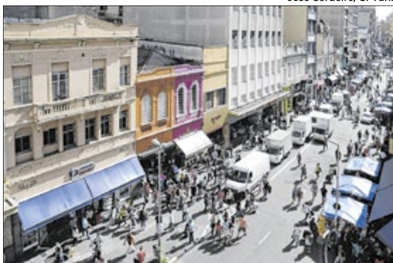
Rua 25 se tornou referência nacional no varejo popular

A celebração coincidiu com a Festa da Anunciação, uma das datas mais relevantes do calendário cristão, o que reforça a relação cultural e religiosa entre a comunidade e a região central. A cerimônia foi