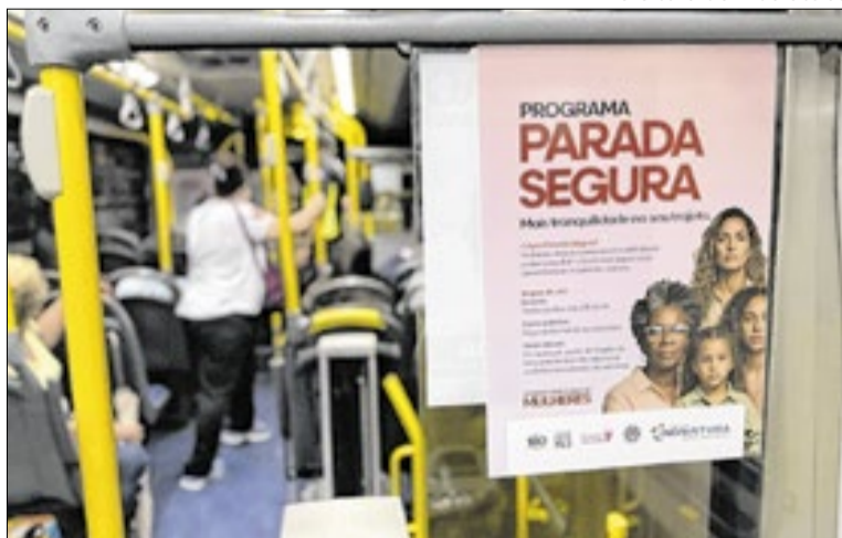
Programa permite desembarque seguro entre 22h e 5h

O principal objetivo do programa é oferecer mais tranquilidade durante os deslocamentos. A medida busca reduzir riscos, principalmente no período noturno, quando a circulação de