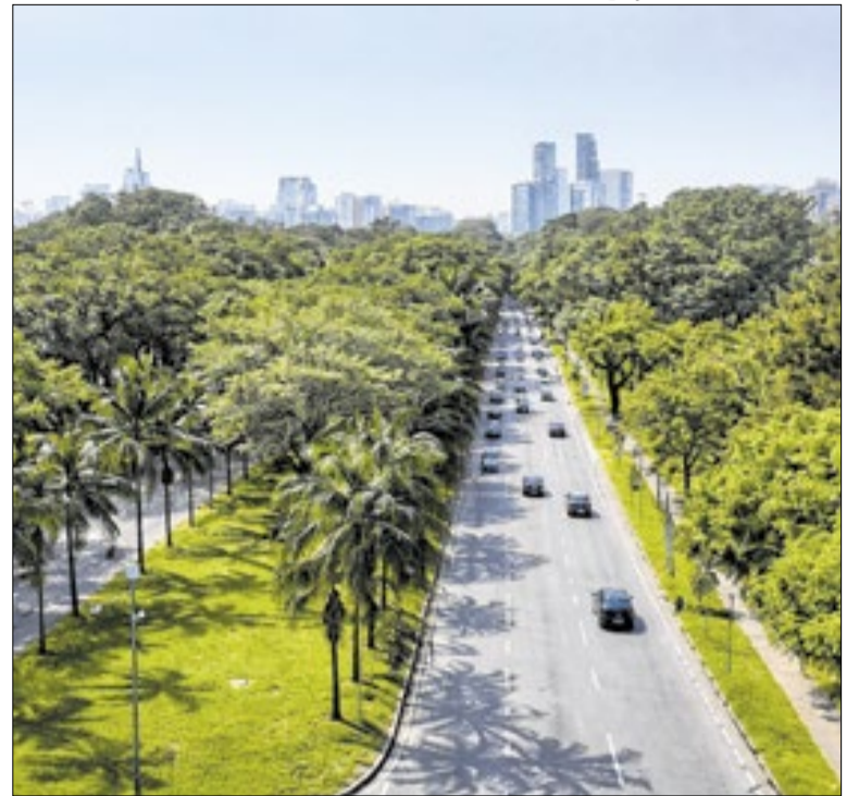
1,7 quilômetro que atravessa ruas e praças do Butantã

O Congresso da Saúde da População Negra e o Fórum da Doença Falciforme serão realizados no dia 31, das 10h às 13h, na Sala Oscar Pedroso Horta, no 1º subsolo da Câmara. Encontro reúne especialistas para discutir políticas públicas, acesso à saúde e desafios da população negra, com foco na doença falciforme.