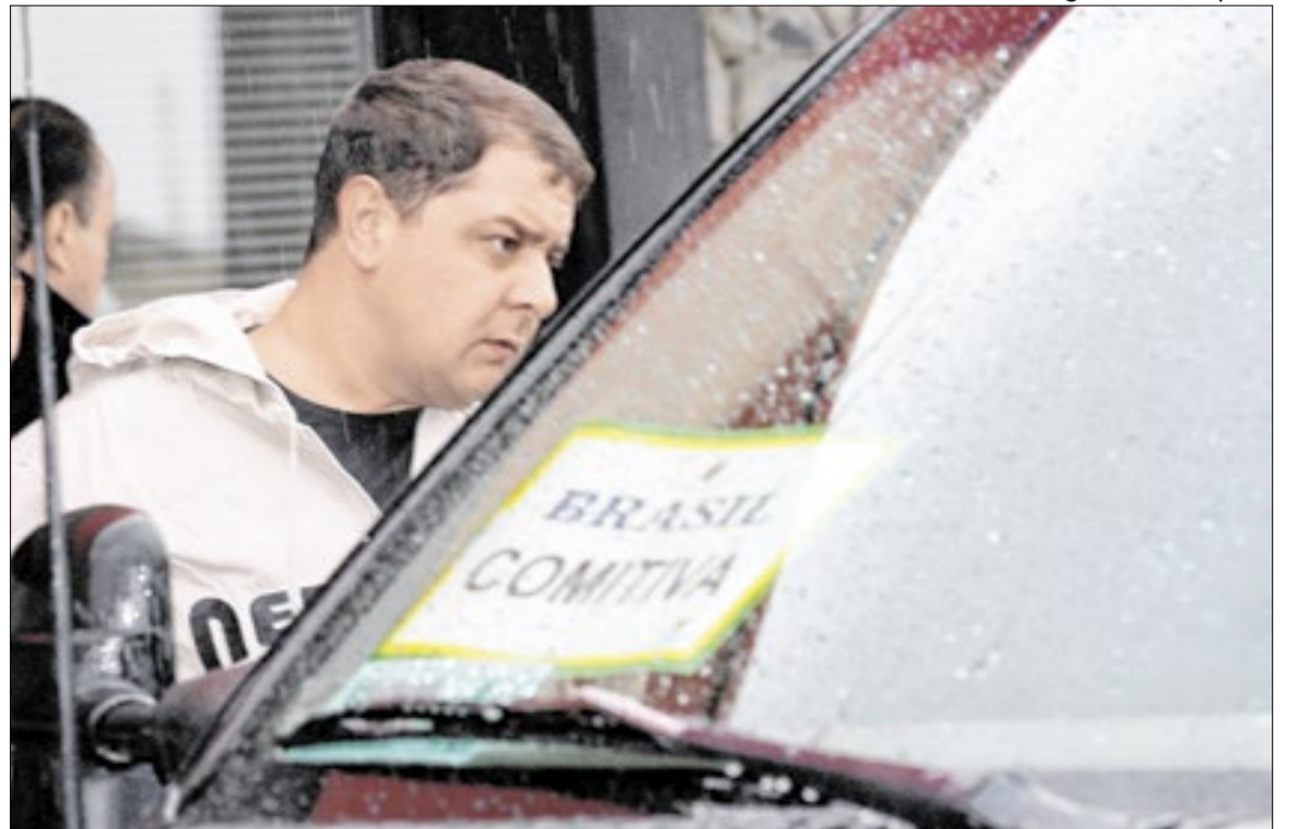
Lulinha era um dos nomes indiciados por Gaspar