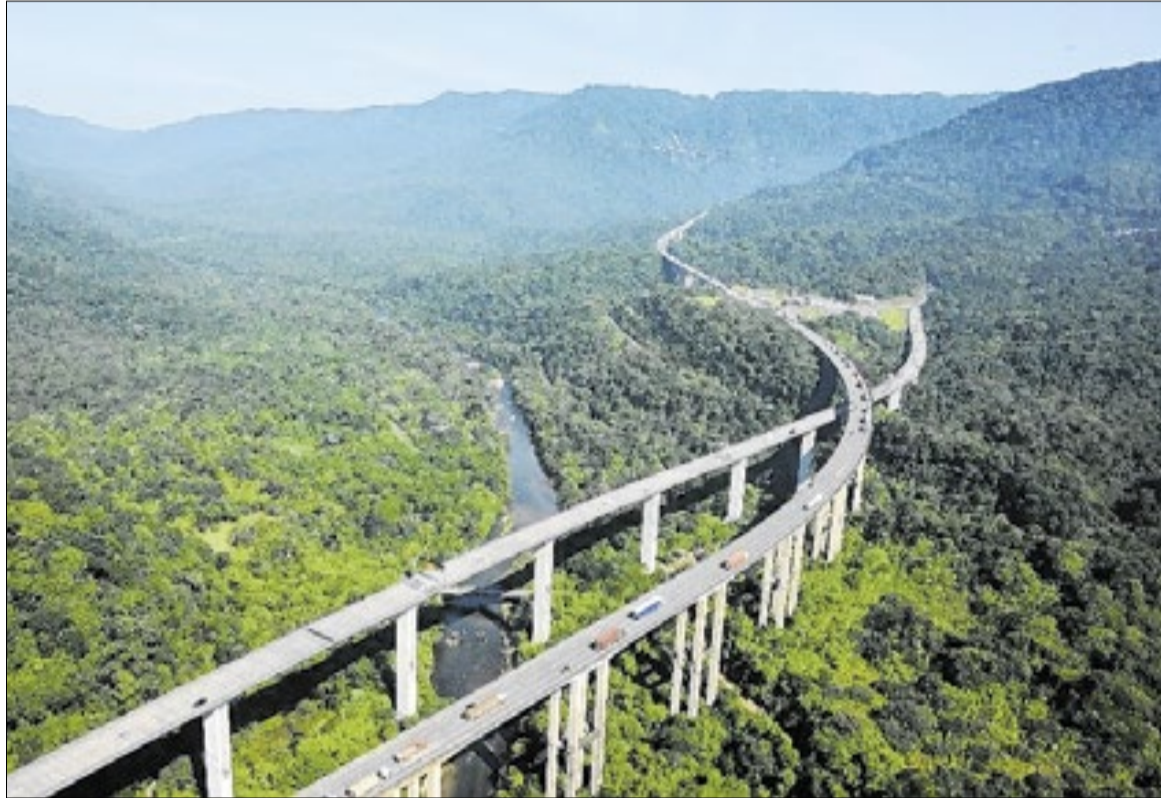
Vova via vai ligar o km 43 da Rodovia dos Imigrantes ao km 265 da Cônego Domênico Rangoni