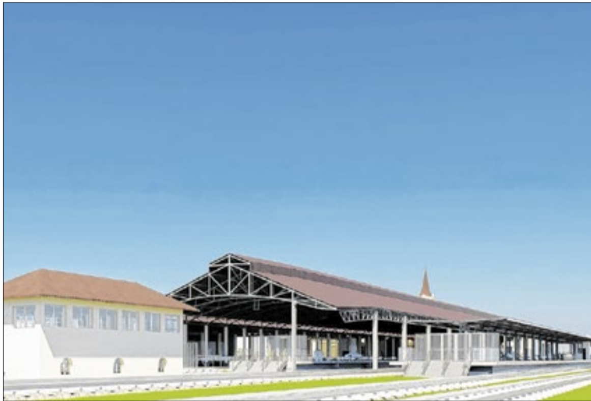
Estação ferroviária em Campinas de onde partirá e chegará o trem intercidades

Já “o TIC é um sistema previsível, e isso é fundamental. O sistema rodoviário nunca oferece previsibilidade nenhuma. Há