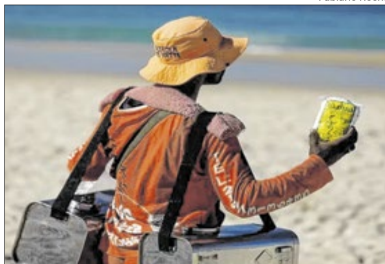
Parte dos trabalhadores brasileiros segue na informalidade

O taxa de desemprego do trimestre passado, de 5,4%, indicava que de 5,9 milhões de pessoas desocupadas no período encerrado em janeiro, refletindo a melhora do mercado de trabalho no início de 2026 — cenário que serve de base de estudo para a discussão apresentada pelos pesquisadores. Mesmo com o indicador em níveis reduzidos, os autores afirmam que “a taxa de desemprego, isoladamente, não é suficiente para indicar um mercado de trabalho plenamente aquecido”.