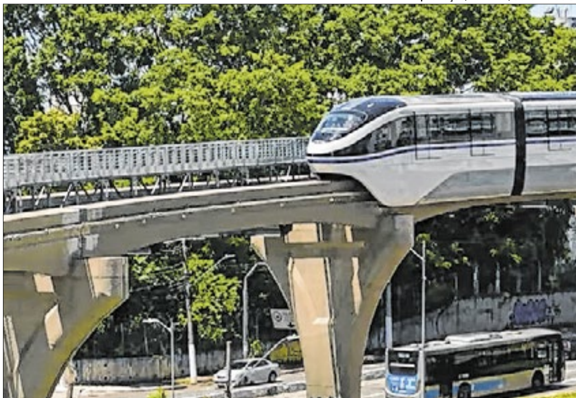
Estação Aeroporto de Congonhas integra o primeiro trecho da Linha

A estação conta com uma plataforma central com cerca de 60 metros de extensão, dimensio-