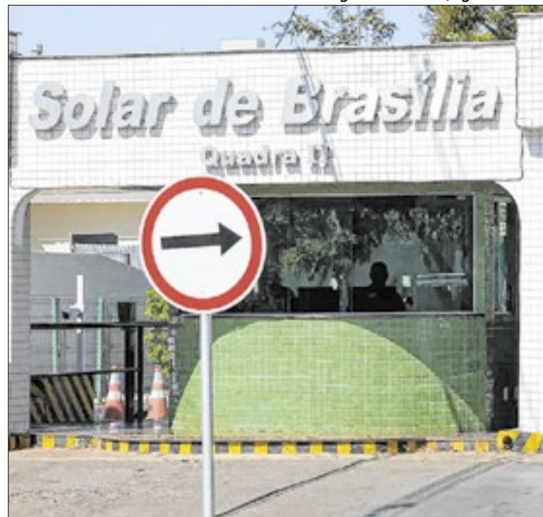
Bolsonaro cumpre domiciliar em condomínio de Brasília

Ao renunciar na véspera da provável cassação de seu mandato para forçar uma eleição indireta, Castro irritou parte do STF. O atropelo na eleição de Douglas Ruas (PL) para presidente da Assembleia Legislativa piorou tudo — ele é candidato à sucessão de Castro. O STF mandou parar tudo e vai definir as regras.