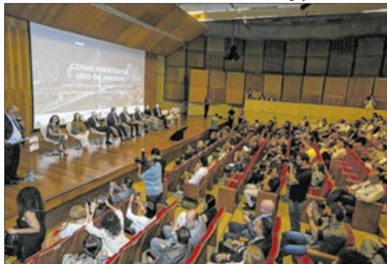
O CCD faz parte de um grande programa financiado pela Fapesp

O estudo será coordenado pelo cientista político e professor