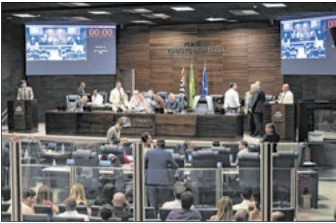
Vereadores durante a Sessão da Câmara de Guarulhos