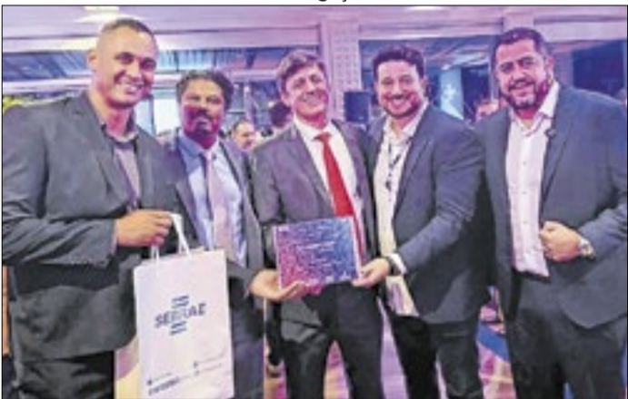
Representantes de Taboão da Serra durante a cerimônia