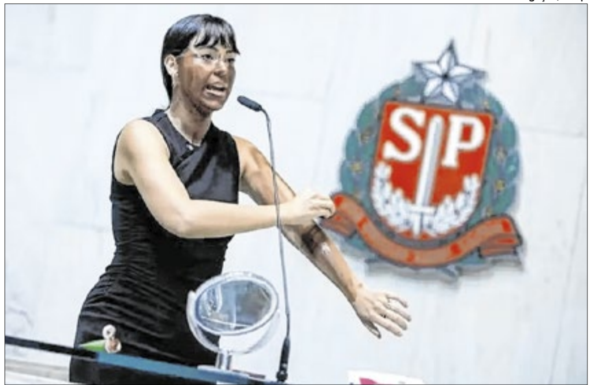
Apuração cita indícios de racismo, transfobia e misoginia e aponta possível dano moral coletivo

No texto, o órgão ressalta que a liberdade de expressão, embora garantida pela Constituição Federal, não é absoluta e deve ser exercida dentro de limites legais, especialmente quando há indí-