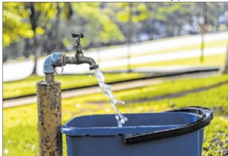
Outra novidade é videochamada com atendente especializado

Além da notificação, os clientes terão acesso a suporte remoto para auxiliar na verificação do problema. Por meio de videochamada, técnicos orientam sobre como identificar possíveis vazamentos e quais medidas podem ser adotadas para corrigir a situação. A empresa também disponibiliza, em seus canais digitais, conteúdos com instruções para