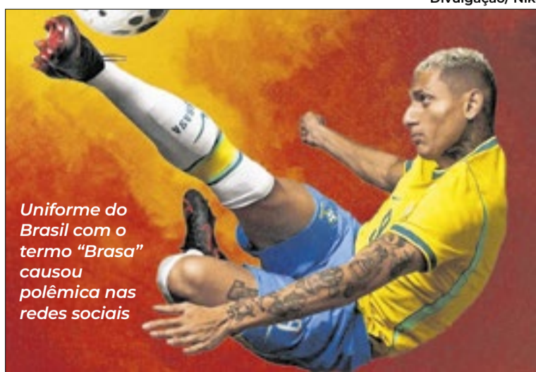
Uniforme do Brasil com o termo “Brasa” causou polêmica nas redes sociais

Apesar de afirmar que não tinha conhecimento da escolha feita pela patrocinadora, o dirigente