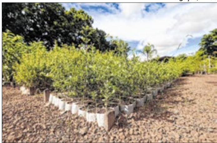
Município mostra infraestrutura verde e habitats