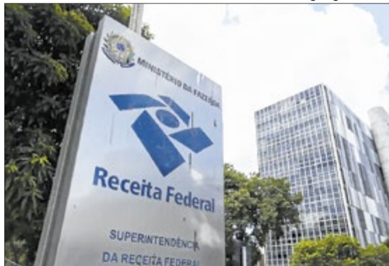
Receita Federal divulga mensalmente as arrecadações

Entre os principais impulsionadores do resultado estão as contribuições previdenciárias, que financiam a aposentadoria e a assistência social, e tributos ligados ao consumo e operações financeiras. O PIS/Cofins, tributo cobrado sobre a produção e circulação de bens e serviços, cresceu devido ao bom desempenho dos setores de comércio e serviços. O Imposto de Renda Retido na Fonte (IRRF) sobre rendimentos de capital também avançou, influenciado pelo aumento de juros, e o Imposto sobre Operações Financeiras (IOF) registrou elevação, impulsionado por mudanças na legislação que aumentaram a cobrança em certas operações. Os valores arrecadados são usados para pagar os gastos do governo, como saúde,