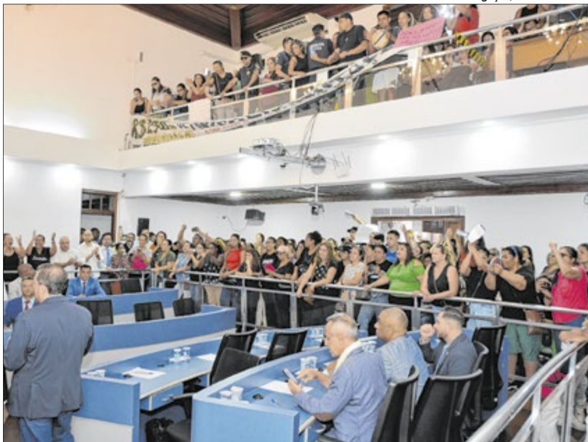
Vereadores e público durante a 8ª Sessão Ordinária da Câmara Municipal de Cotia

Outro projeto aprovado foi o PL nº 192/2025, de autoria do Poder Executivo, que altera a Lei nº 1.425, de 18 de setembro de 2007, que trata do Conselho Municipal dos Direitos da Pessoa