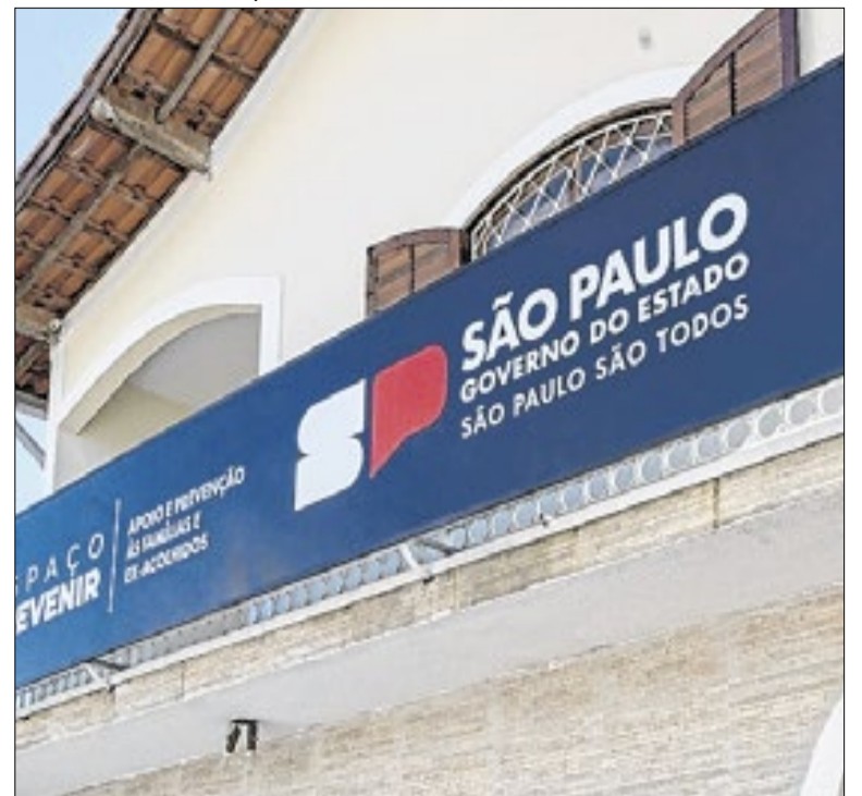
Novas estruturas reforçam o atendimento à população

O novo totem conta com 10 câmeras de alta tecnologia, capazes de realizar leitura automática de placas (OCR), reconhecimento facial e monitoramento em longo alcance. O equipamento possui botão de emergência, que permite o acionamento direto das forças de segurança, garantindo mais rapidez no atendimento.