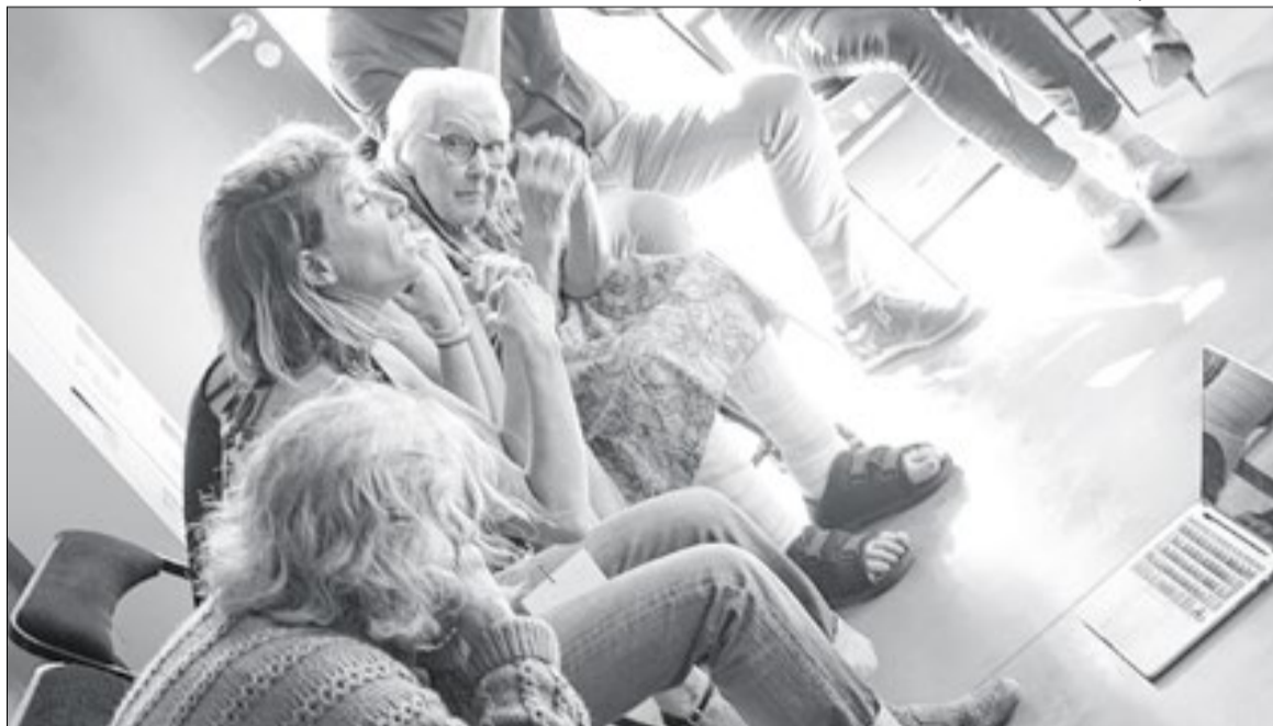
Pacientes com demências participam de grupo de estudo e convivência

diagnóstico e acompanhamento, muitos deles vinculados a universidades e hospitais de ensino.