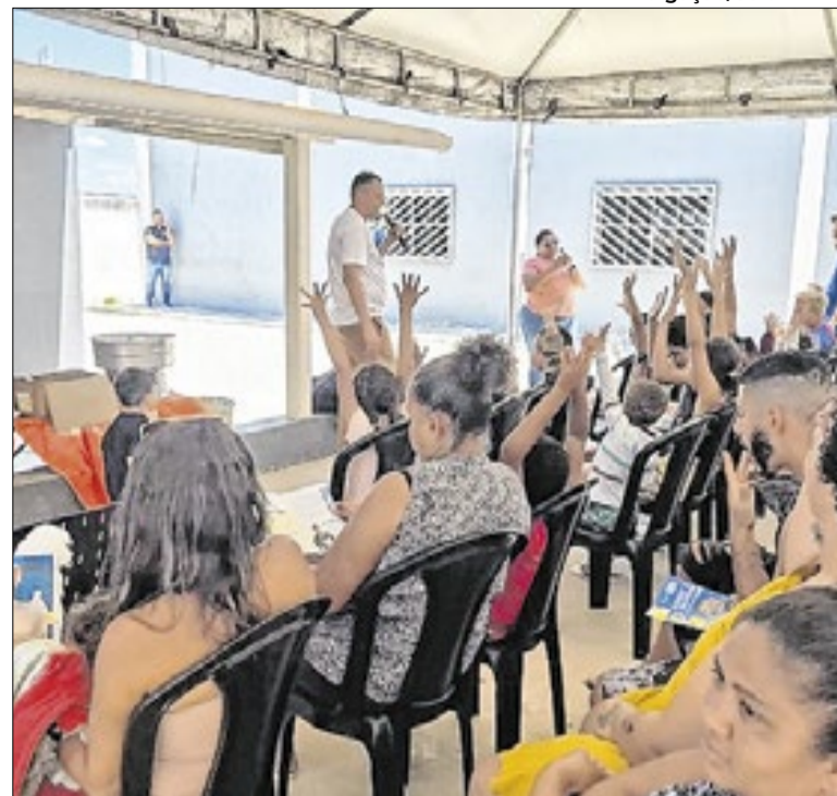
Organizações apoiarão iniciativa em diversas regiões

A prefeitura de Campo Grande (MS) iniciou a adoção da Conta Gov.br como login para acesso aos serviços digitais municipais. A mudança unifica sistemas e integra plataformas. A medida faz parte da modernização tecnológica para ampliar acesso, organização e controle no atendimento ao público.