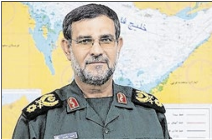
Israel matou comandante da Guarda Revolucionária