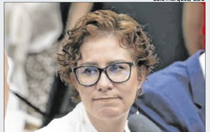
Plano de fuga de Zambelli começa a dar errado