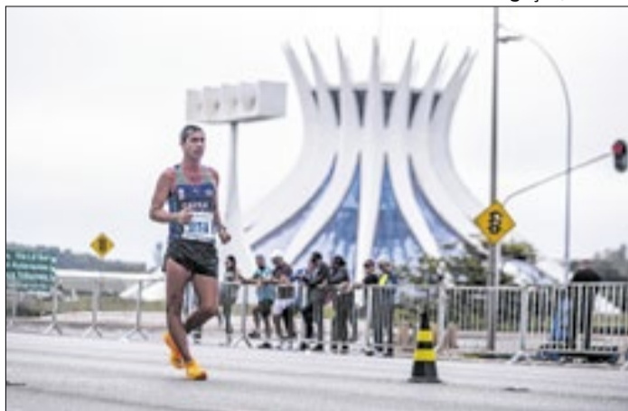
Evento reúne delegações e atletas na Esplanada