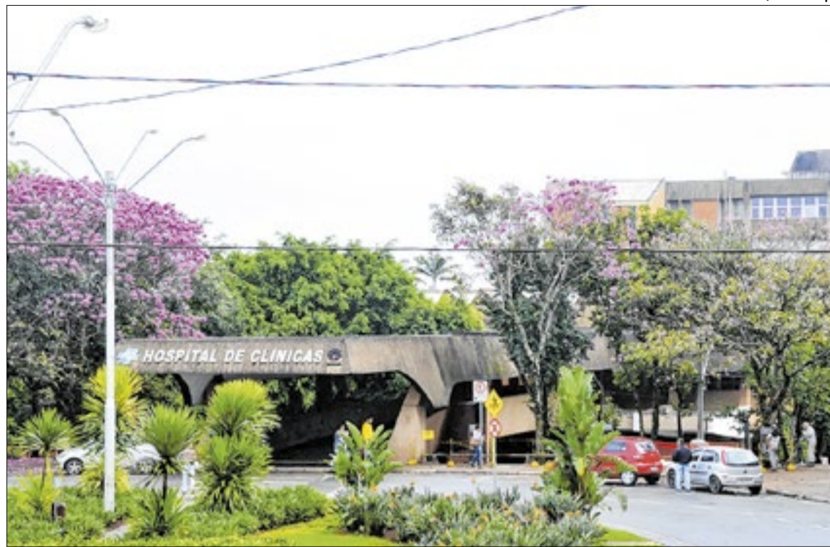
MP-SP denunciou dois médicos do HC da Unicamp como responsáveis por liderar esquema

A fila para cirurgias no Sistema Único de Saúde (SUS) é organizada por meio do Sistema de Regulação (SIS-REG), que define o acesso dos pacientes com base em critérios clínicos e na ordem de inscrição. Após consulta, o médico responsável solicita o procedimento e insere o caso no sistema, acompanhado de laudos e exames. A prioridade é determinada pela gravidade: situações urgentes, com risco de agravamento ou morte, têm atendimento preferencial. A gestão da fila é feita pelas Secretarias de Saúde, que distribuem as vagas conforme a disponibilidade de leitos, equipes e estrutura hospitalar. Idosos, gestantes, lactantes e pessoas com deficiência têm prioridade legal. Em caso de demora ou dúvidas, o paciente pode recorrer à Ouvidoria do SUS.