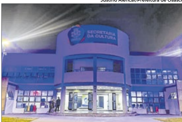
O Centro de Eventos valoriza a cultura da cidade

As melhorias também ocorreram no prédio anexo da Secretaria de Cultura, que passou por re-