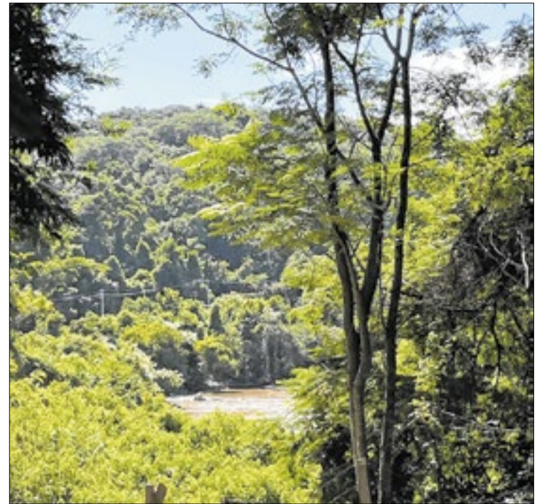
APA abriga remanescentes relevantes de Mata Atlântica

O sistema de arquivos organizado é uma ferramenta de transparência, mas a transparência só tem valor se o que é produzido for útil. A Câmara de Campinas precisa focar em simplificar a vida do contribuinte, ao em vez de acumular regramentos que apenas criam obstáculos.