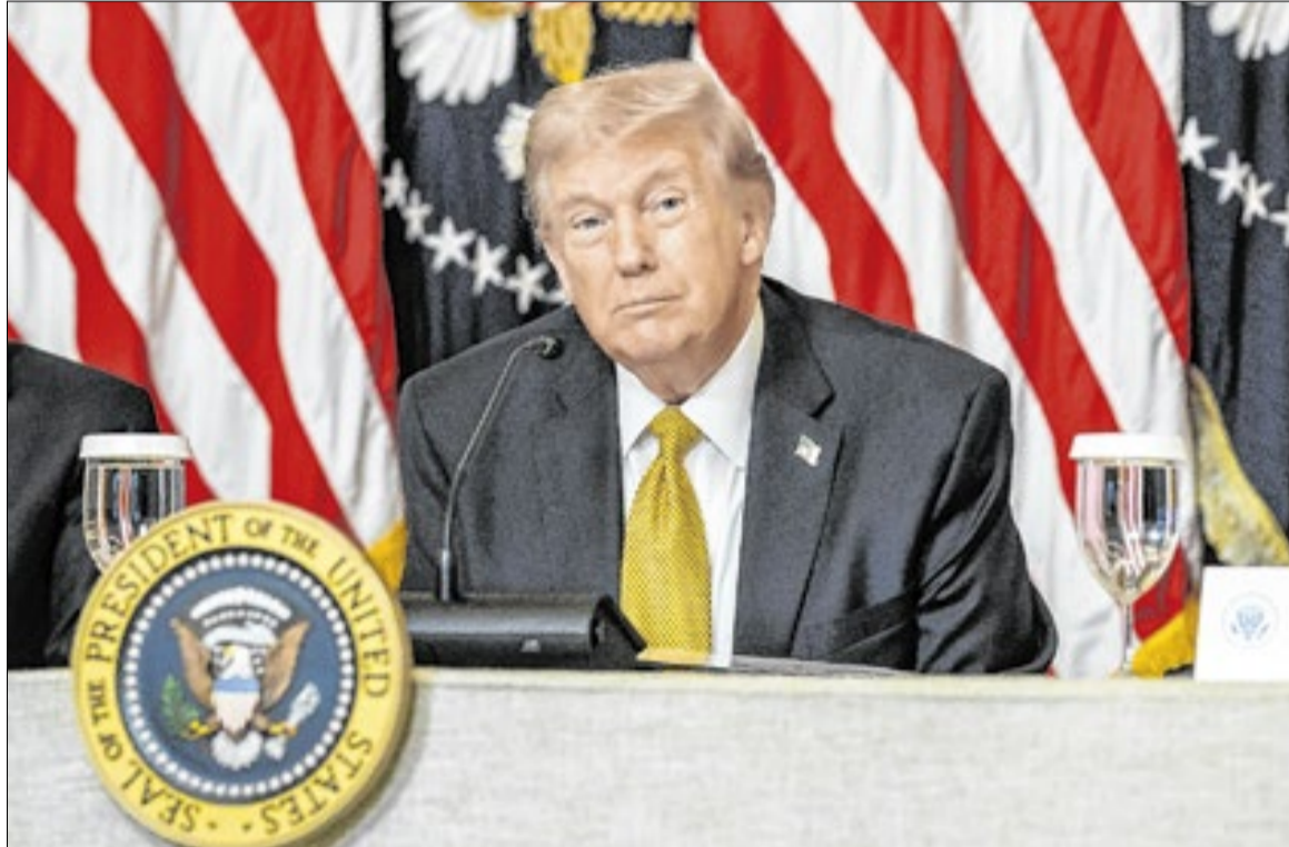
Joyce N. Boghosian/ Casa Branca

Nesta quinta, o Irã deixou claro rejeitar a proposta.