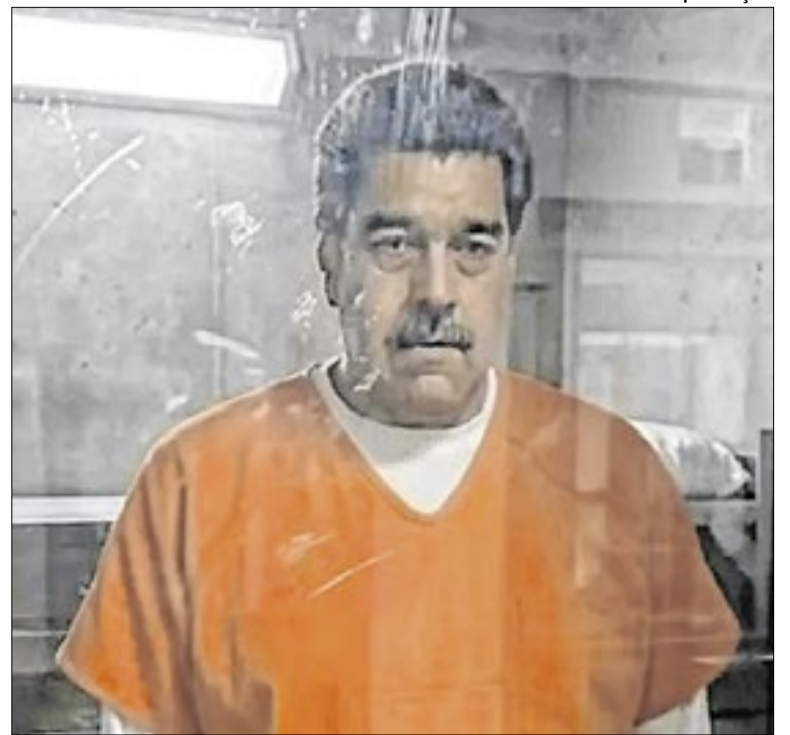
Chavista e sua mulher estão presos há quase três meses