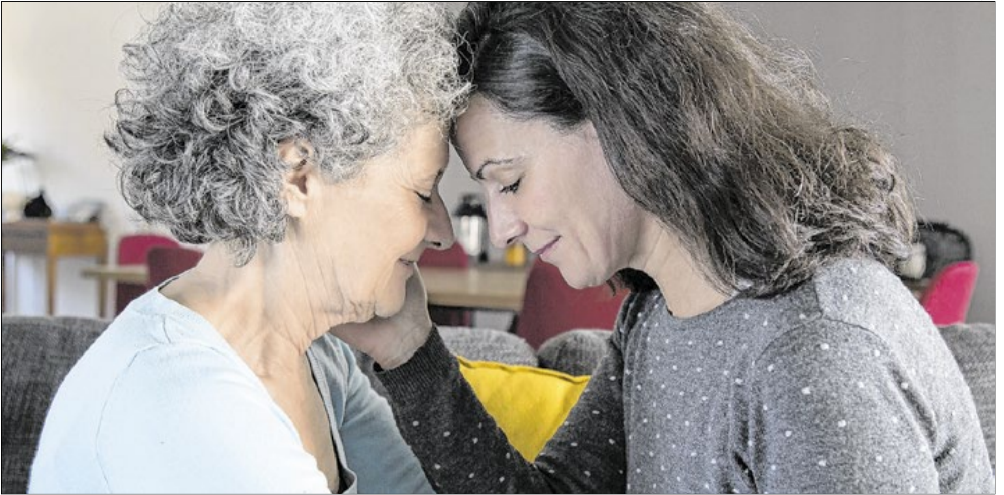
O acometimento das demências entre os idosos cresce: é preciso ouvir e respeitar a vontade de quem sofre com ela, antes que mergulhe no esquecimento total