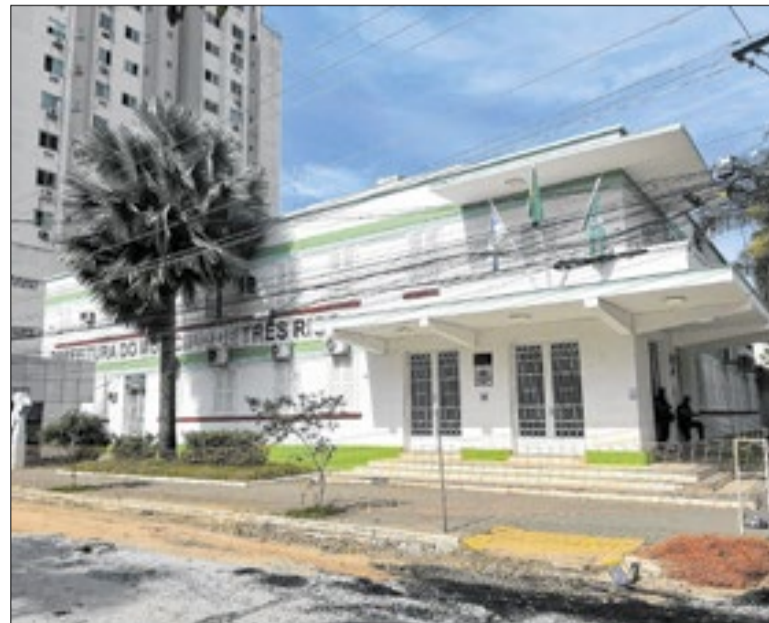
Inscrições serão realizadas entre os dias 13 e 17 de abril

as regras e critérios de participação, está disponível para consulta desde a sua publicação, no boletim informativo oficial municipal de 20 de março, a partir da página 151. A iniciativa reforça o compromisso da administração municipal com a transparência, a participação social e o fortalecimento das políticas culturais, garantindo espaço para que a sociedade civil contribua ativamente na construção das ações do setor em Três Rios.