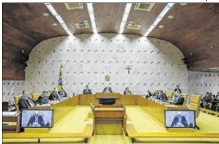
STF aprovou limites a benefícios