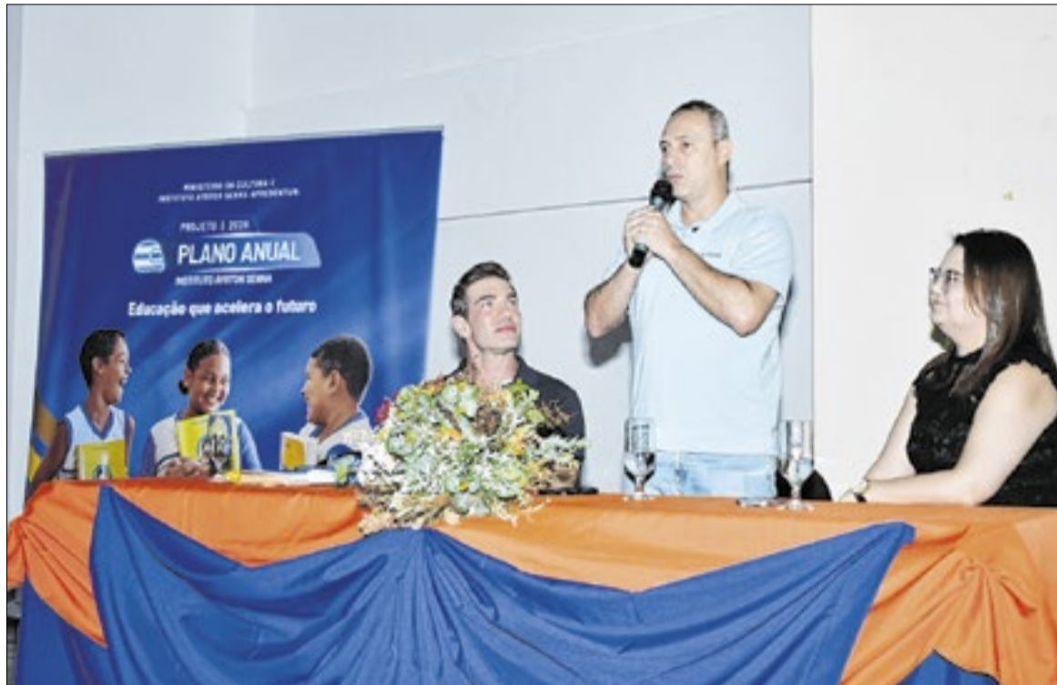
Parceria com o Instituto Ayrton Senna tem impulsionado a rede municipal na aprendizagem

“Só conseguimos corrigir rotas quando conhecemos os dados.