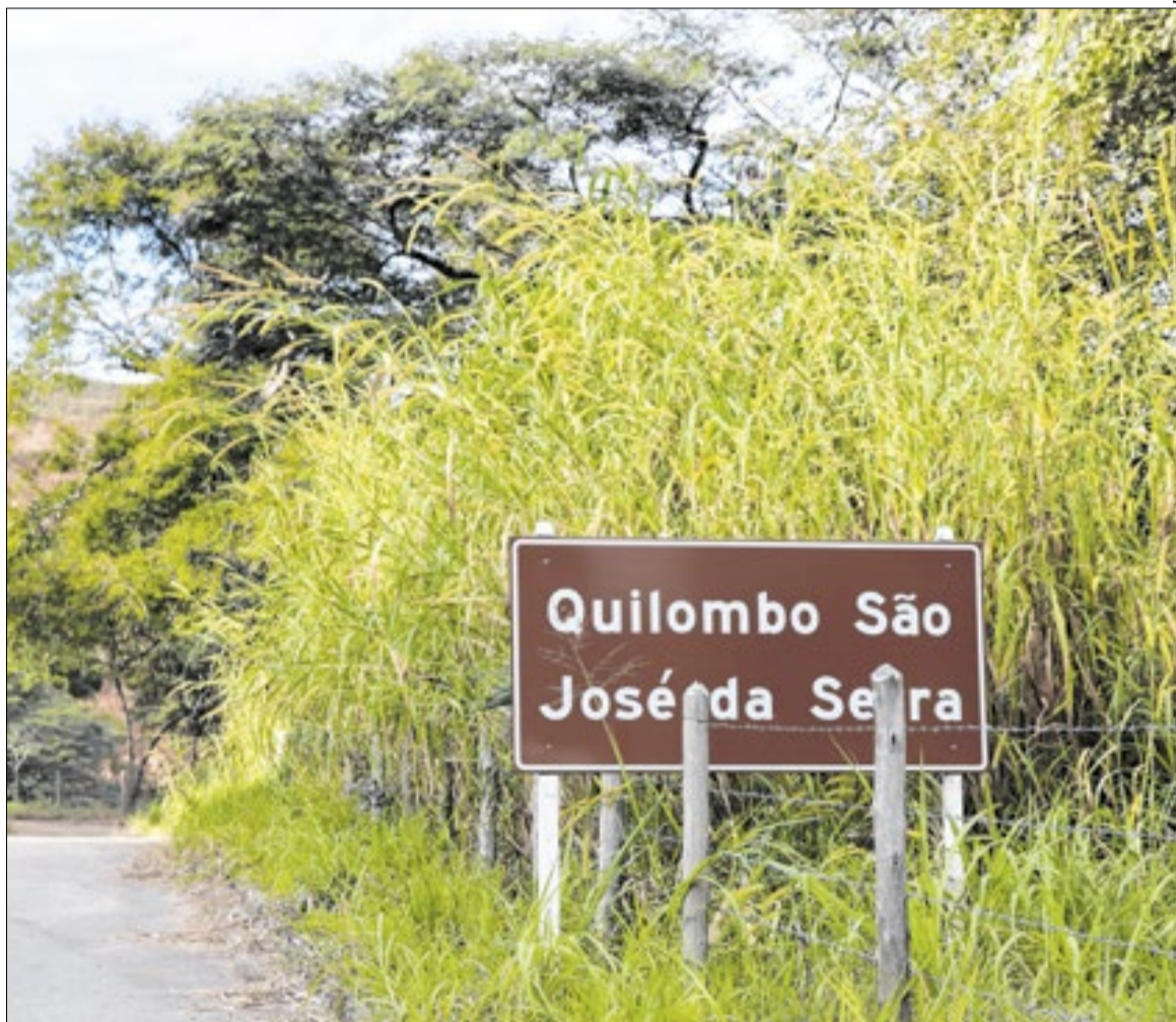
Comunidade vive no distrito de Santa Isabel do Rio Preto, a a cerca de 180 km da capital Rio

Desde a chegada dos negros escravizados na fazenda, em 1850, a comunidade do Quilombo São José da Serra, o mais anti-