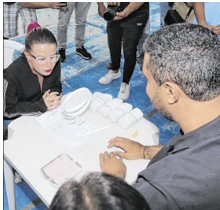
Entregas aconteceram no Ginásio Poliesportivo Pedro Jahara

Durante a capacitação, foram abordados conteúdos essenciais ao exercício das funções dos cuidadores no âmbito do acolhimento institucional, com ênfase na garantia de proteção, cuidado, escuta qualificada e promoção do desenvolvimento integral de crianças e adolescentes.