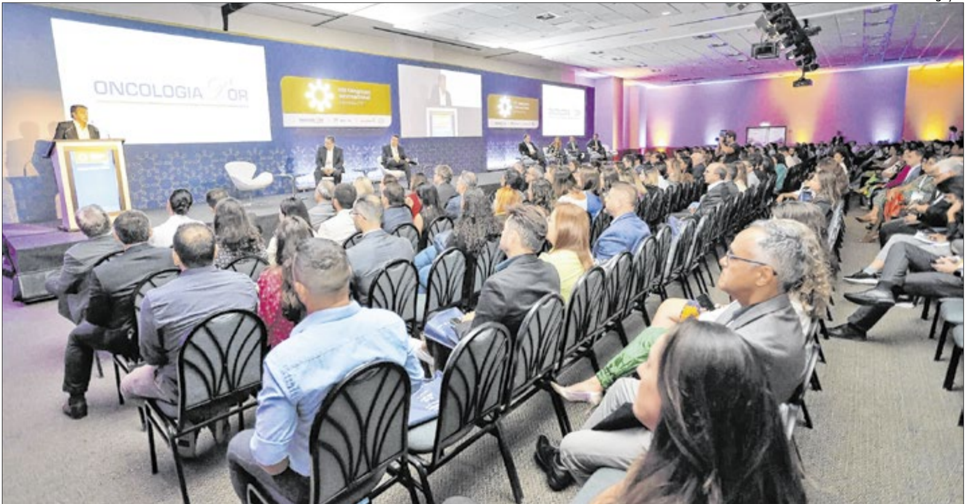
Onco in Rio vai receber mais de 13 mil pessoas, superando o número de inscritos do ano passado

C omeça na sexta (27) e termina no sábado (28), no Windsor Oceânico, a 11ª edição do Congresso Internacional Oncologia D'Or. Considerado o maior evento de oncologia do país, o Onco in Rio já ultrapassa 13 mil inscritos, superando o recorde da edição anterior, que reuniu mais de 11 mil participantes. Ao longo dos dois dias, especialistas nacionais e internacionais vão debater inovação, tecnologia e os principais avanços no diagnóstico e tratamento do câncer, como o uso de inteligência artificial.