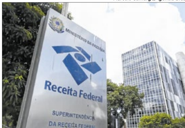
Receita Federal divulga mensalmente as arrecadações

Entre os principais impulsionadores do resultado estão as contribuições previdenciárias, que financiam a aposentadoria e a assistência social, e tributos ligados ao consumo e operações financeiras. O PIS/Cofins, tributo cobrado sobre a produção e circulação de bens e serviços, cresceu devido ao bom desempenho dos setores de comércio e serviços. O Imposto de Renda Retido na Fonte (IRRF) sobre rendimentos de capital também avançou, influenciado pelo aumento de juros, e o Imposto sobre Operações Financeiras (IOF) registrou elevação, impulsionado por mudanças na legislação que aumentaram a cobrança em certas operações. Os valores arrecadados são usados para pagar os gastos do governo, como saúde,