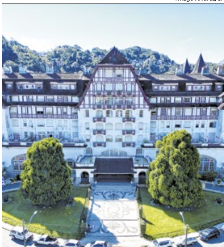
Iniciativa surgiu durante encontro sobre a Nova Subida da Serra

“Nosso objetivo é transformar o Quitandinha em um ecossistema de inovação e turismo. A proposta une crescimento econômico, controle urbano e respeito ao patrimônio da