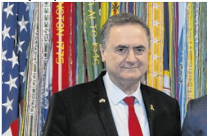
Ministro da Defesa Israel Katz deu a notícia da morte