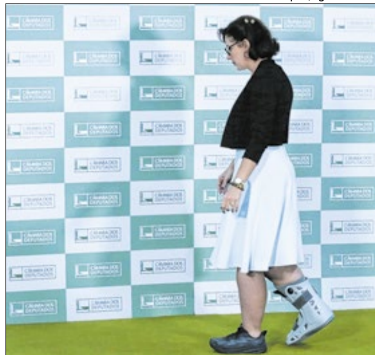
Plano de fuga de Zambelli para a Itália começa a dar errado

Ainda assim, há uma percepção no entorno de Grass de que Arruda, mesmo de volta, não retorne com a mesma força. Avalia-se que o caso Master pode respingar nele. Não diretamente, porque não há nada nesse sentido. Mas indiretamente, por ter sido condenado em um processo que envolveu corrupção.