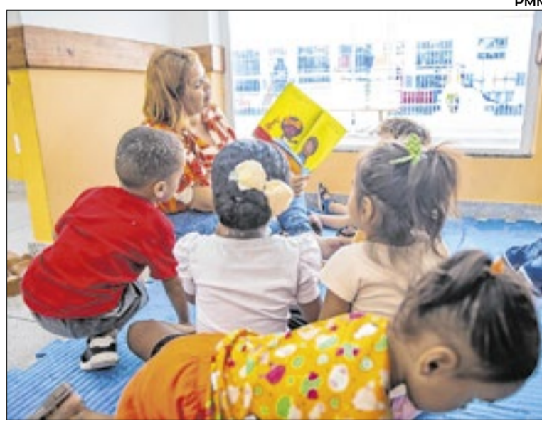
Com estrutura aprimorada, unidade oferece mais conforto