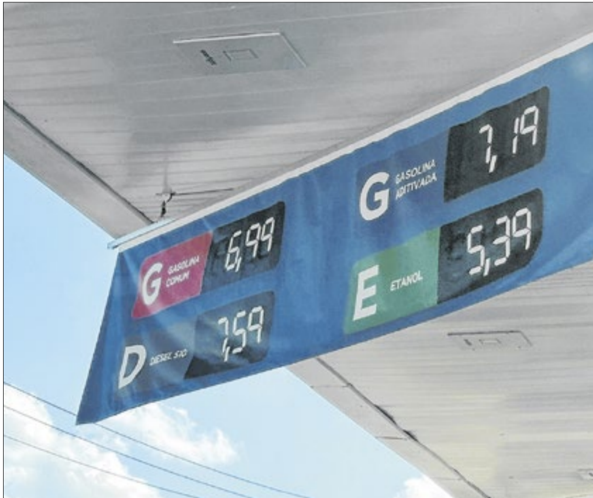
Na última semana, motoristas encontraram bombas vazias em alguns postos de gasolina

Já em outro posto, também no Aterrado, que funciona sem bandeira, a situação é bem diferente. Este foi um dos primeiros estabelecimentos a ficar sem gasolina desde o início do conflito no Oriente Médio. No sábado (21), as bombas, assim como os funcionários, ficaram paradas devido à falta de combustível. Frentistas revelaram ainda que o volume comercializado foi reduzido pelas distribuidoras após o início da guerra. Antes, era possível adquirir, por exemplo, até 90 mil litros; com as mudanças, o limite passou para cerca de 10 mil litros. Com isso, os postos passaram a enfrentar restrições no abastecimento, o que resultou em bombas vazias. A expectativa é de que a distribuição seja normalizada ao longo desta semana, ainda que com volume reduzido.