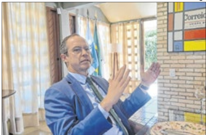
Capelli: "Vou ganhar esta eleição"