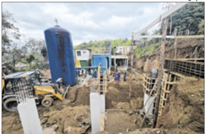
Sistema vai permitir levar água tratada a 100% do distrito