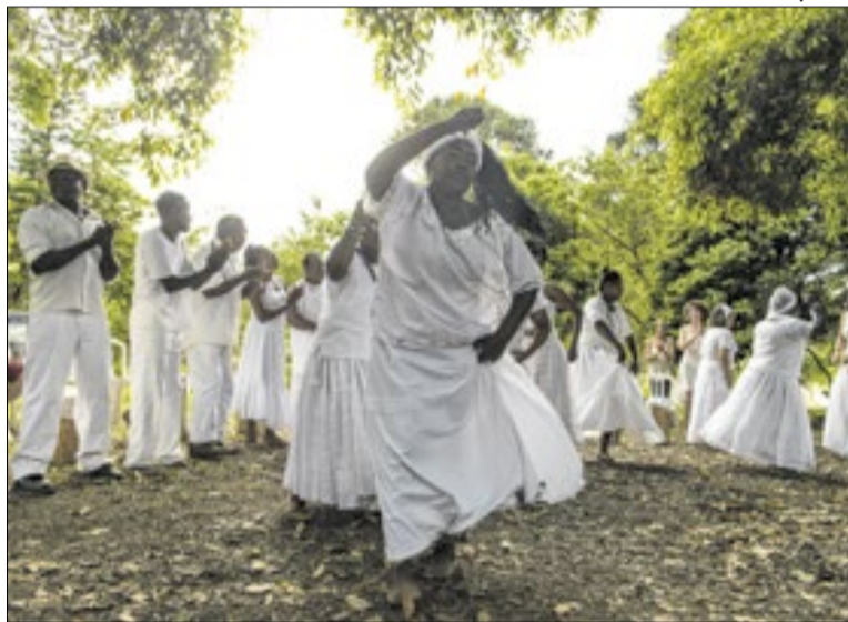
Festa do Jongo é evento tradicional conhecido nacionalmente

go do Rio de Janeiro, tem sua história marcada pelo combate ao preconceito racial e a intolerância religiosa e, após a Abolição, somaram-se a resistência e luta constante pelo direito à terra.