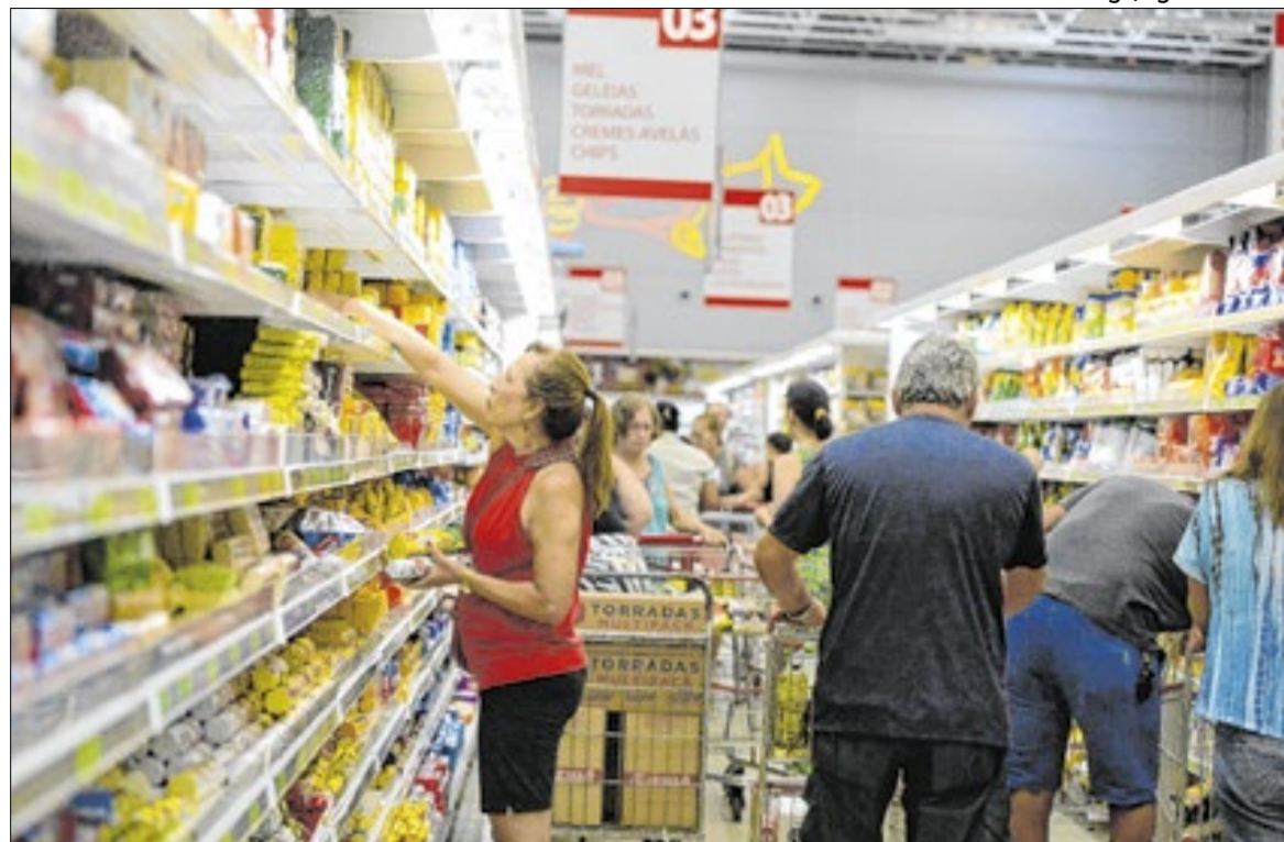
Consumo segue moderado no início do ano, refletindo cautela nas decisões de compra.

O IPCA-15 funciona como uma prévia do IPCA, índice oficial de inflação, calculado com base nos preços coletados durante todo o mês, refletindo a variação completa dos produtos e serviços e servindo de referência para contratos, reajustes e políticas econômicas.