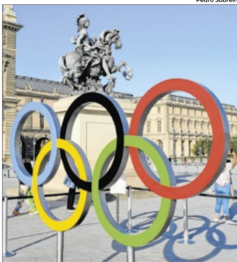
‘A política que anunciamos é baseada em ciência’, disse a presidente do Comitê Olímpico

de direitos humanos e de defesa do esporte pediram ao COI que abandone os planos de introduzir testes genéticos universais de sexo para atletas femininas e impor uma proibição geral a competidores transgêneros e intersexuais.