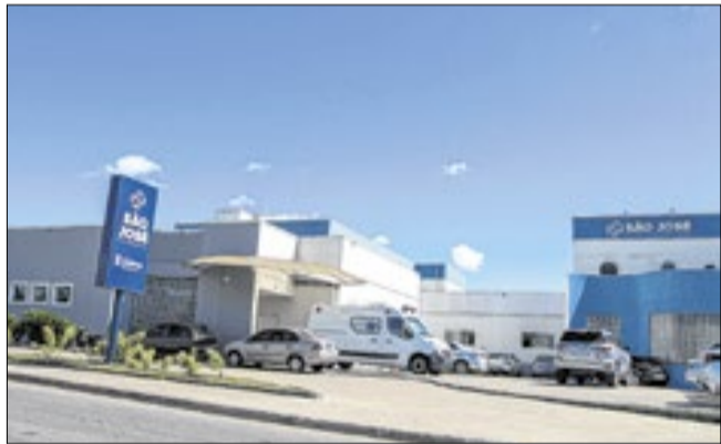
Diretora do hospital alerta para os cuidados