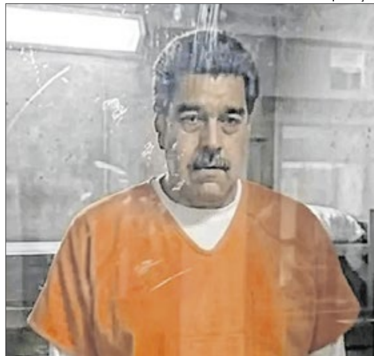
Chavista e sua mulher estão presos há quase três meses