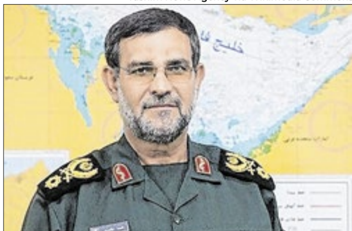
Israel matou comandante da Guarda Revolucionária