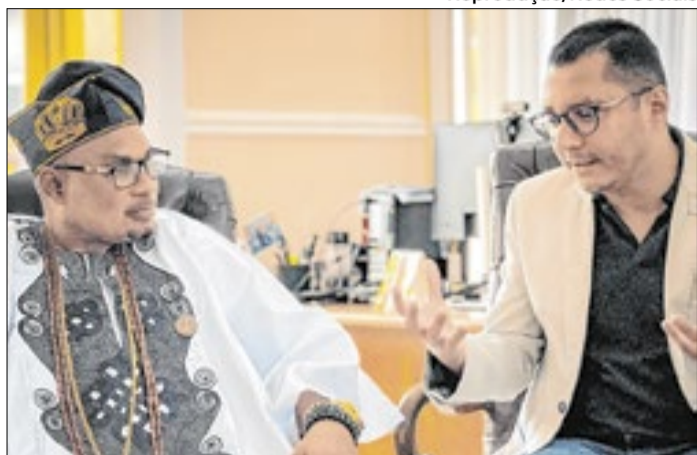
Oba Hameed Adejoro Ajjola durante visita ao Brasil