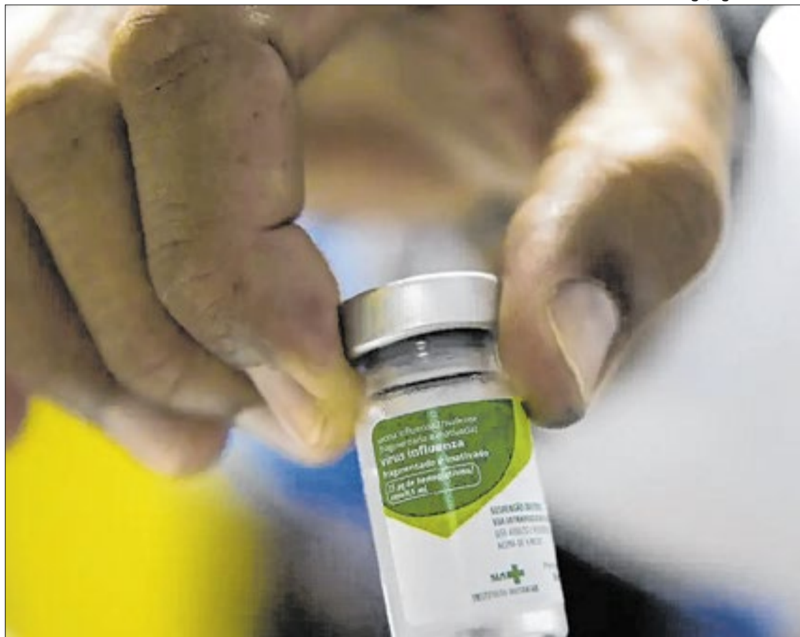
O grupo com menor adesão é o de gestantes, com cerca de 43% do público imunizado

O chamado "Dia D" será realizado na mesma data, e a cam-