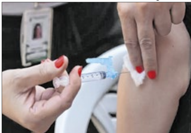
Vacinação para crianças, idosos e gestantes