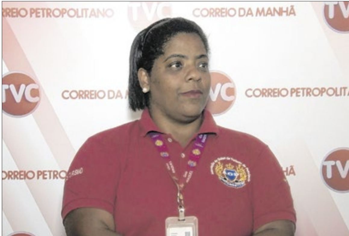
Categoria celebra medida e afirma que nova lei valoriza os guias de turismo

Conforme o decreto, a contratação de ‘Guia de Turismo Regional’ será exigida quando houver a realização de passeio turístico, visita guiada a atrativos turísticos ou utilização de equipamentos turísticos situados no território do Estado. Nessas ocasiões, entre outras funções, eles devem atuar como mediadores sociais, comunicando às autoridades competentes a ocorrência de condutas que possam acarretar danos ao meio ambiente, ao patrimônio