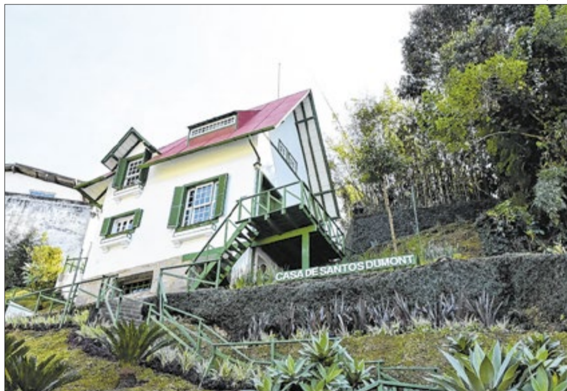
“A Encantada” foi uma residência de verão de Alberto Santos Dumont no Centro Histórico