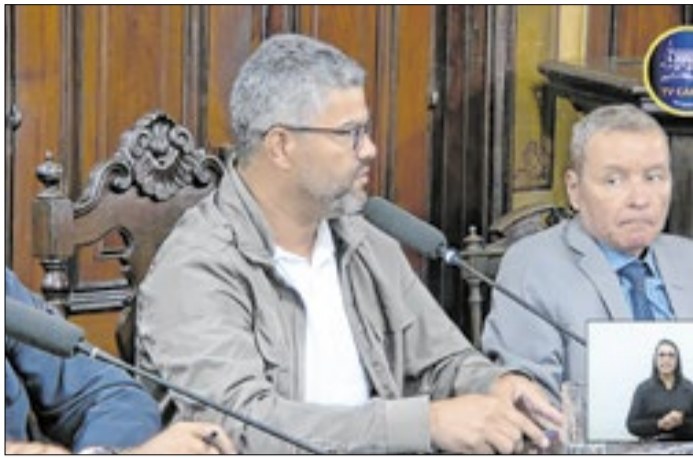
Secretário não soube explicar o superávit