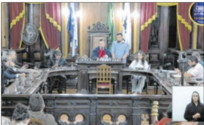
Principal pergunta ficou sem resposta