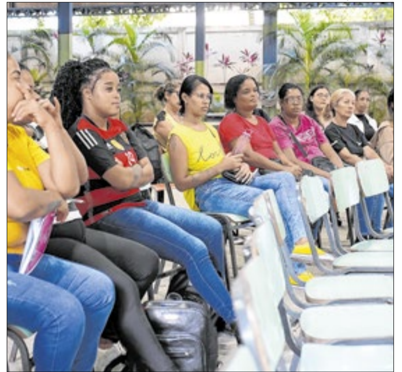
Mais de 100 mulheres participarão de cursos de construção civil

A medida integra a política municipal de defesa agropecuária e busca preservar a base produtiva da pecuária, atividade estratégica para a economia rural do município. A proteção do rebanho é condição essencial para garantir produtividade, previsibilidade e acesso a mercados exigentes quanto a critérios sanitários.