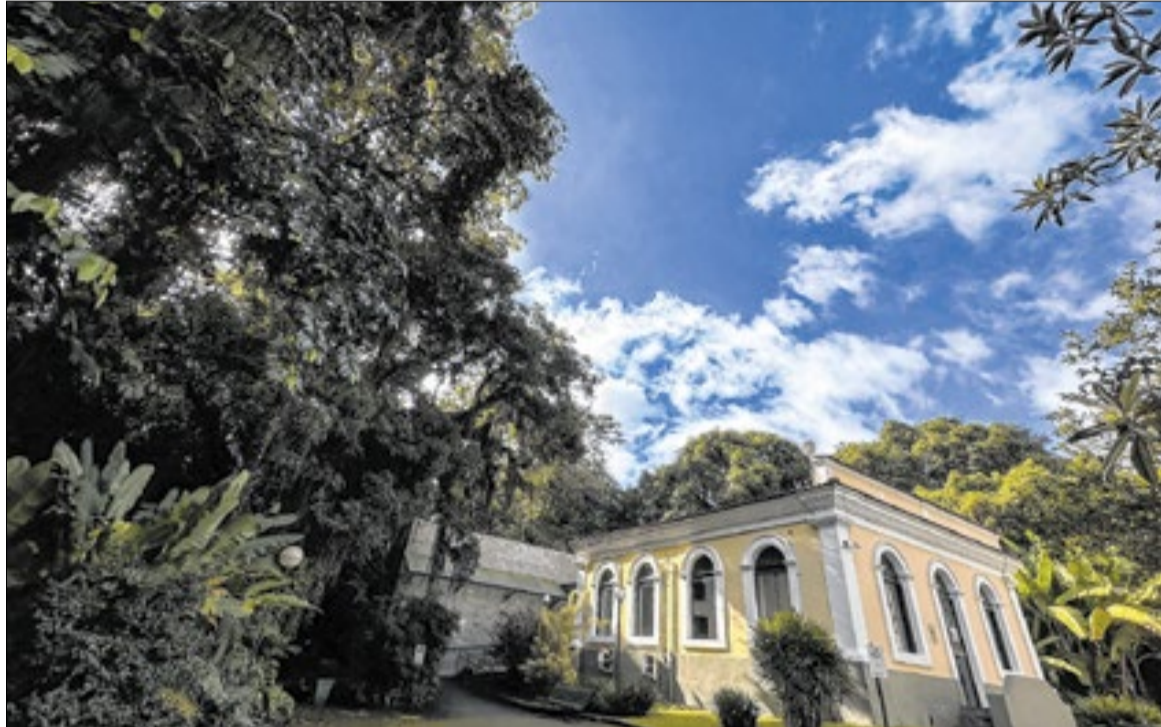
Parque Natural de Saudade está em Catálogo das Unidades de Conservação