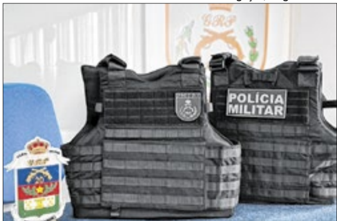
Coletes balísticos dão maior proteção aos policiais