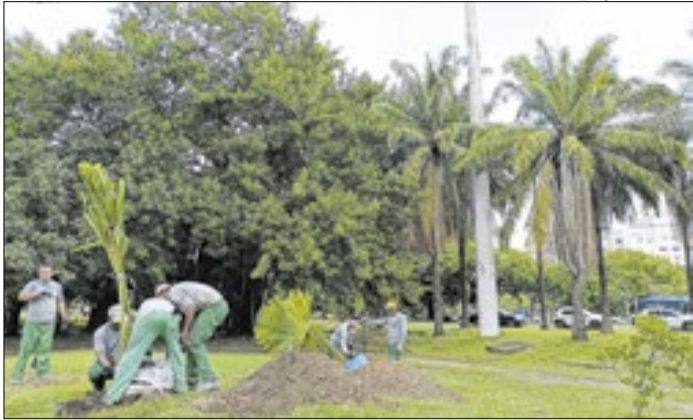
Espécie faz parte do projeto original do parque