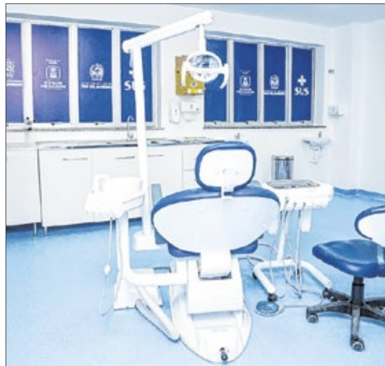
Unidade tem 21 mil pessoas cadastradas e 6 equipes de Saúde

Para tornar a experiência ainda mais imersiva, réplicas de dinossauros estarão espalhadas pelo shopping, surpreendendo o público e garantindo fotos incríveis. Com estrutura pensada para oferecer segurança e entretenimento, a atração é ideal para crianças que adoram desafios e atividades que estimulam a coordenação motora.