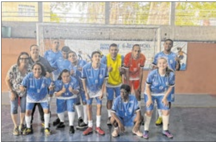
Ação oferece novas modalidades para PCDs