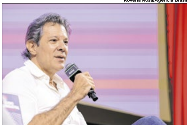
Haddad nega proximidade entre o presidente Lula e Vorcaro

Haddad destacou que o Banco Central já iniciou a revisão das regras de segurança do sistema financeiro para evitar novos casos semelhantes. “As brechas que permitem ao Banco Master fazer essa operação não podem existir mais. Algumas normas já foram alteradas pelo Banco Central. O Banco Central está fazendo a revisão das