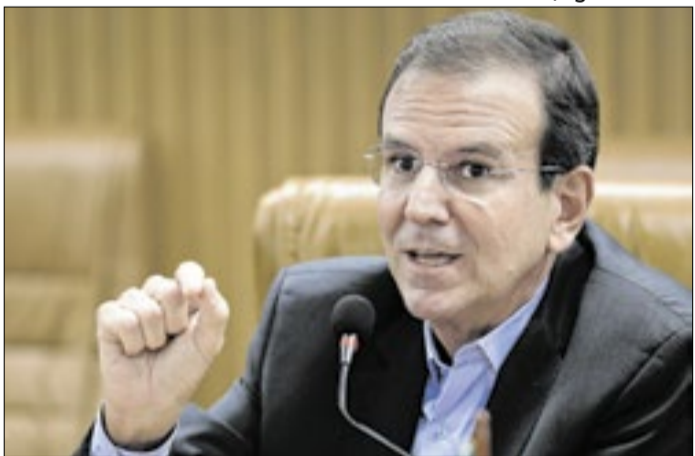
Lula poderá contar com a ampla chapa de Paes?