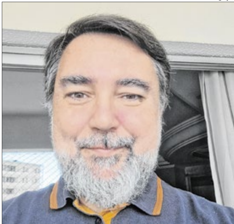
Engenheiro explica previsão do clima para março

No Sudeste e no Centro-Oeste, a característica predominante deve ser a irregularidade. Mesmo quando o volume total de chuva ficar dentro da média, a tendência é de temporais isolados e intensos, principalmente no período da tarde, concentrando grande quantidade de água em curto espaço de tempo.