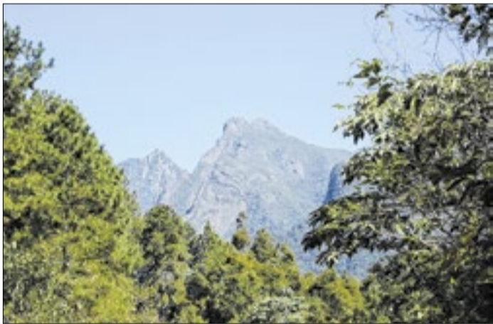
Serrinha do Alambari, um dos destinos mais procurados