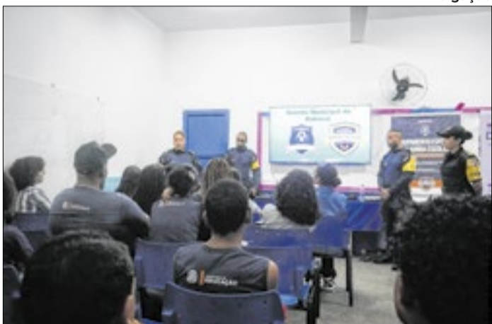
Bate-papo com alunos abordou tipos de violência