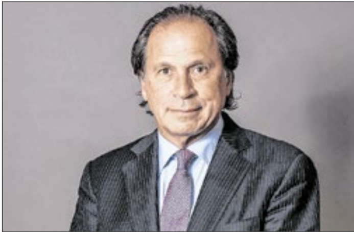
Steinbruch precisa mostrar disposição ao mercado