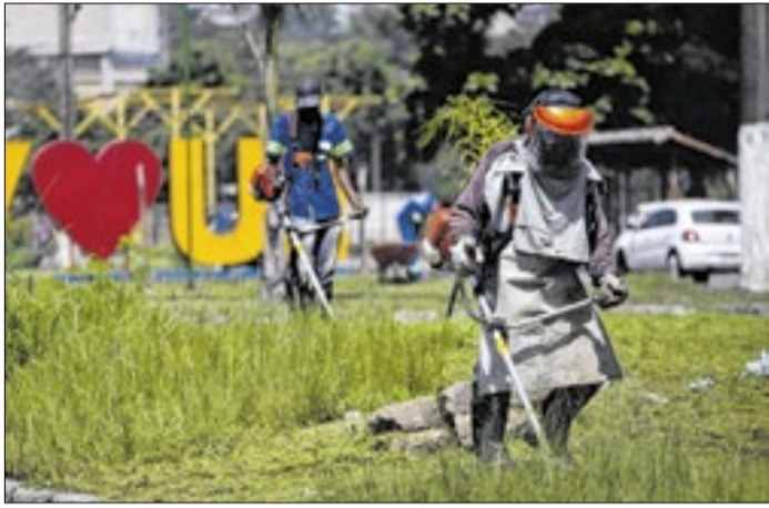
Ação inclui serviços de capina, roçada e retirada de entulho