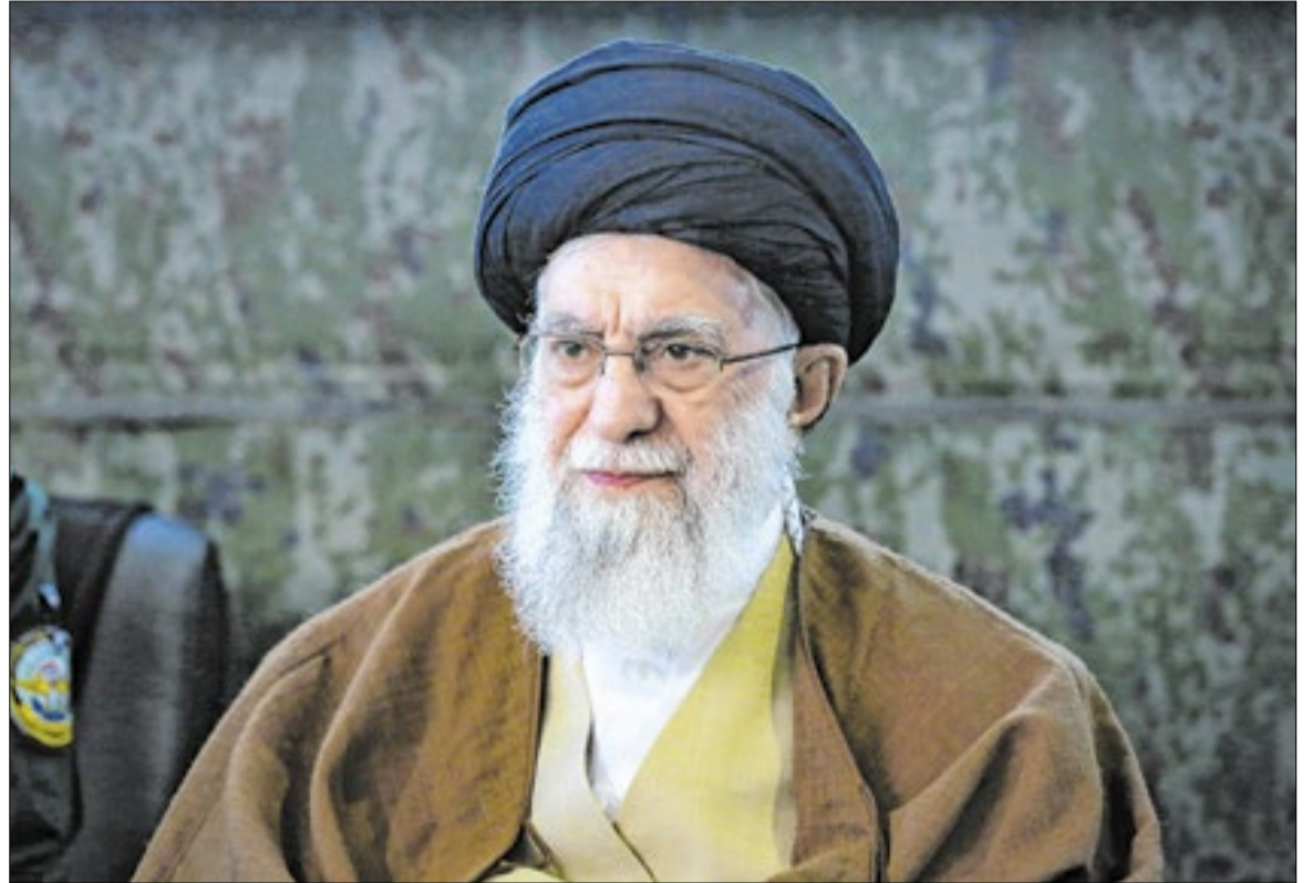
Aiatolá Ali Khamenei, de 66 anos, foi morto pelos ataques dos EUA e de Israel no sábado (28)

O Qatar, que apesar de sediar a maior base americana região tinha uma relação boa com Teerã que até lhe valeu um bloqueio por parte dos vizinhos na década