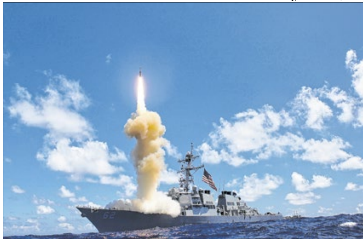
Ofensiva dos EUA e Israel que matou lideranças iranianas provoca uma onda de instabilidade

No entanto, alerta que a repetição de precedentes pode alterar cálculos estratégicos no médio prazo. “Geopolítica é, em grande medida, gestão de expectativas. Se a percepção global for de que as normas são flexíveis para alguns e rígidas para outros, o sistema tende a se tornar mais volátil e menos previsível”, conclui.