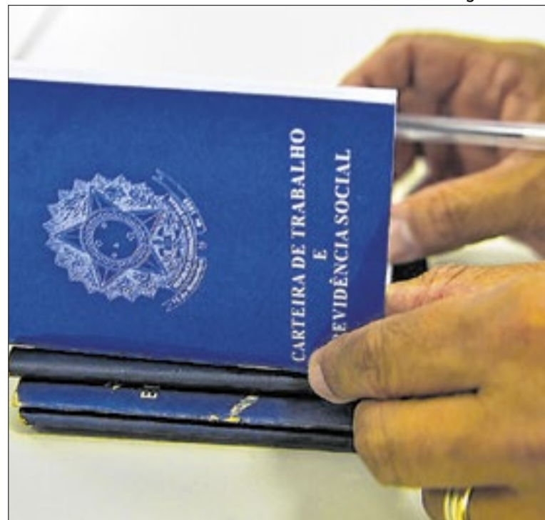
São 673 posições com carteira assinada e 1.841 para estágio

Todos os veículos entregues contam com ar-condicionado e são equipados com motorização padrão Euro 6, o mais avançado do país no controle de emissões para veículos a diesel. A tecnologia reduz em até 80% as emissões de óxidos de nitrogênio (NOx) e praticamente elimina a emissão de material particulado, contribuindo diretamente para a melhoria da qualidade do ar e para a redução dos impactos à saúde pública.