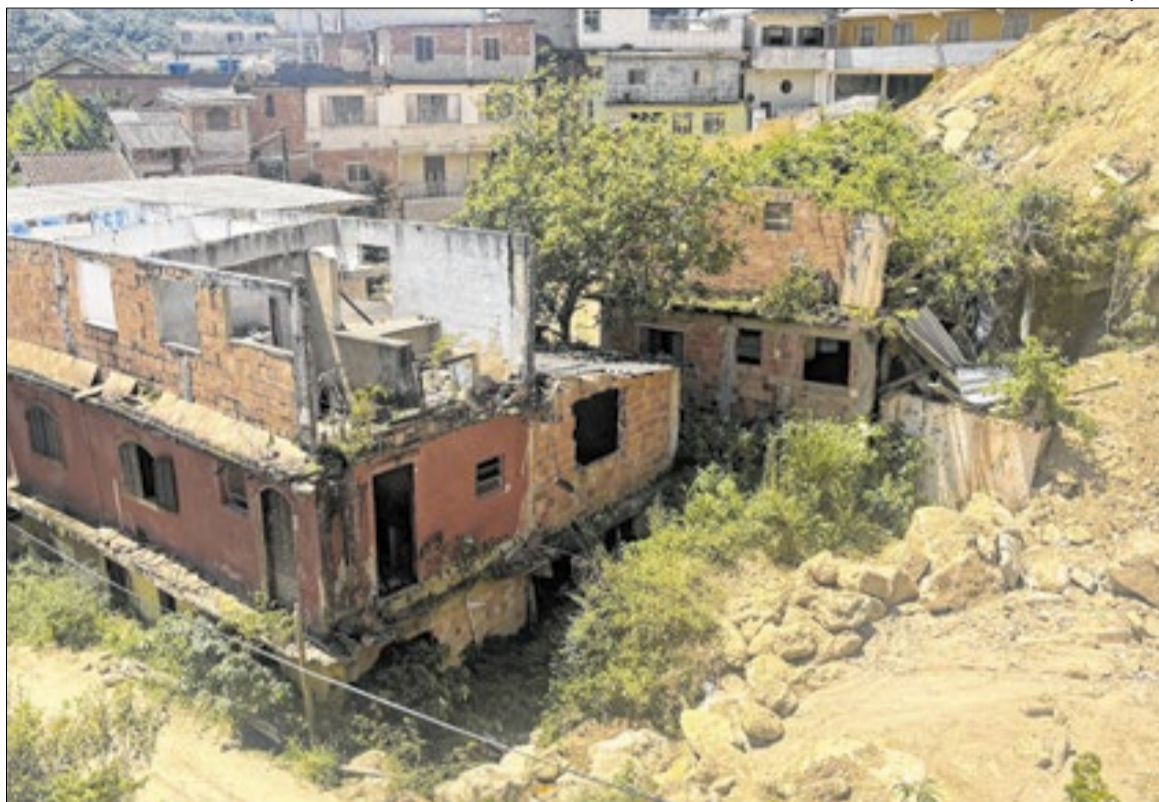
Relatório é da Frente Parlamentar de Prevenção às Tragédias e Moradia Digna da Alerj

A Região Serrana registra aproximadamente 1.364 mortes em razão de tragédias socioambientais, considerando o período entre 1991