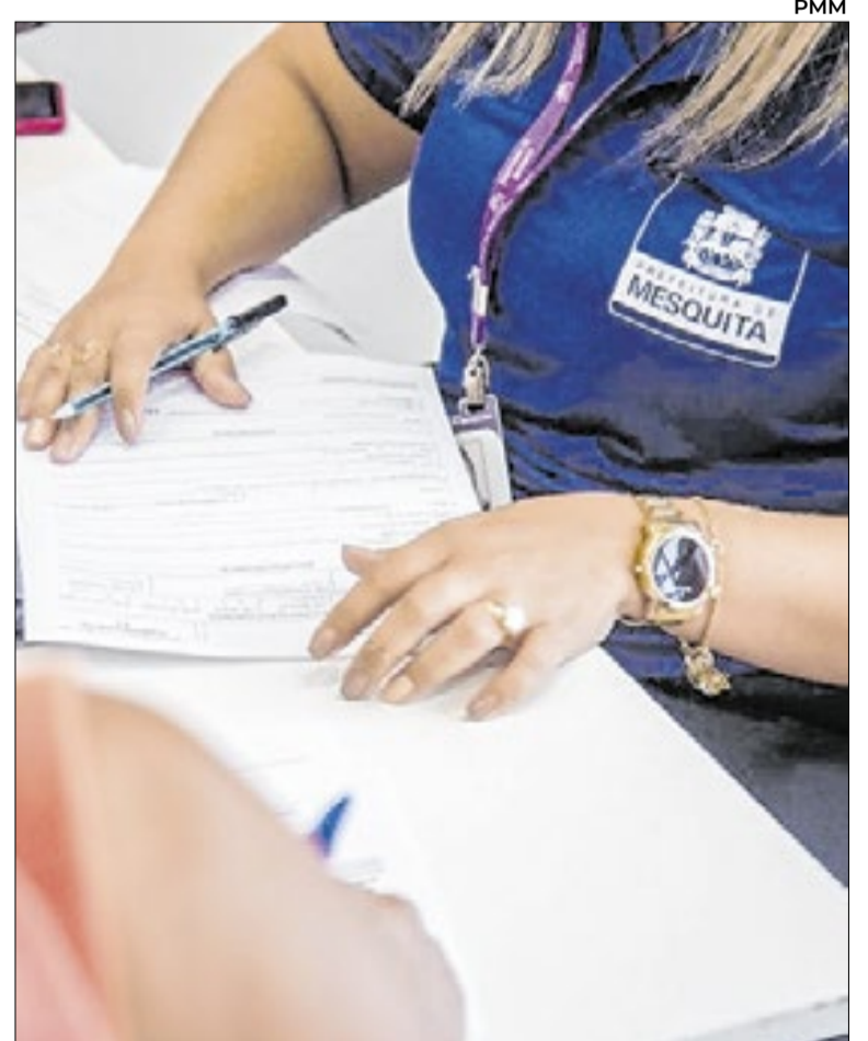
Prefeitura promove isenção para segunda via de documentos e atendimento às famílias afetadas pelo temporal

Vale frisar que os Centros de Referência de Assistência Social seguem funcionando de segunda a sexta-feira, das 9h às 17h. Com a publicação do decreto municipal nº 3.853, que declarou Situação de Emergência, Mesquita iniciou articulação com os governos estadual e federal para avaliação e possível liberação de benefícios socioassistenciais, conforme critérios técnicos estabelecidos pelos órgãos competentes.