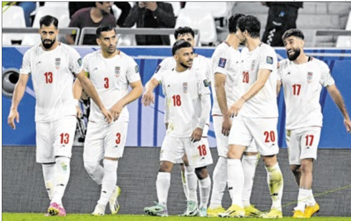
Irã está classificado para a Copa do Mundo, mas torcedores estão vetados de entrar no país

“É um sistema onde o líder acumula um grande poder. En-