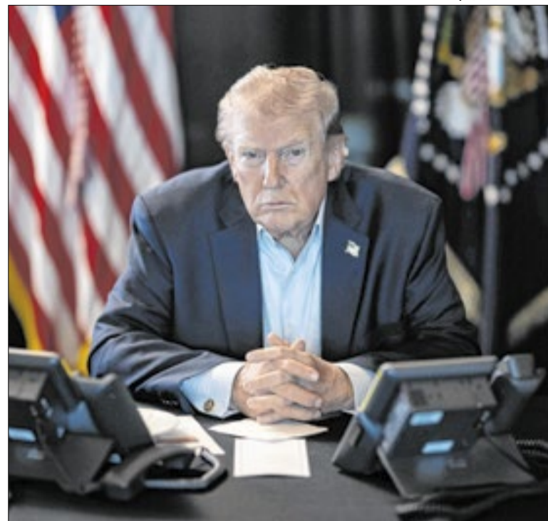
Americano disse que a maior onda de ataques “está por vir”

Em entrevista a jornalistas do mundo inteiro, Marco Rubio, chefe da diplomacia americana, afirmou que o ataque ao Irã foi um tipo de defesa antecipada. “A ameaça iminente era que sabíamos que, se o Irã fosse atacado, e acreditávamos que seria, eles viriam imediatamente atrás de nós”, afirmou.