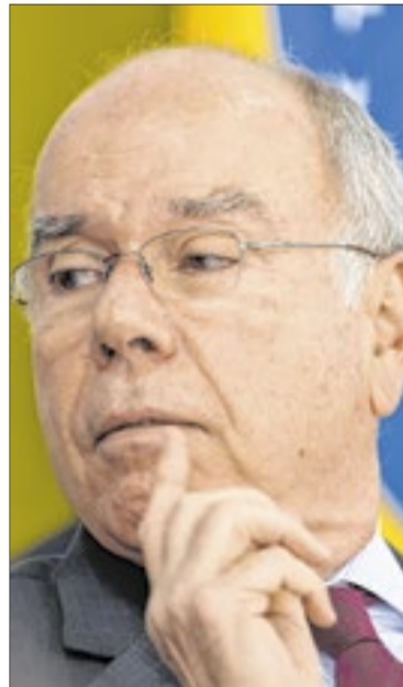
Mauro Vieira: diplomacia brasileira mantém postura de cautela

meio a um processo de negociação entre as partes, que é o único caminho viável para a paz, posição tradicionalmente defendida pelo Brasil na região”, manifestou o Palácio do Itamaraty.