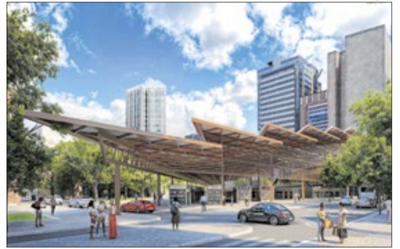
Projeção de como ficará o mercado da Uruguiana

O Galpão das Artes Urbanas Helio G. Pellegrino, na Gávea, abre as portas para trabalhos e obras variadas de garis e funcionários artistas da Comlurb nesta quinta-feira (5). Além de homenagear os trabalhadores da limpeza urbana, a mostra é inspirada no Ano Internacional dos Voluntários para a Sustentabilidade e Um Mundo Melhor, da Organização das Nações Unidas (ONU), celebrado este ano.