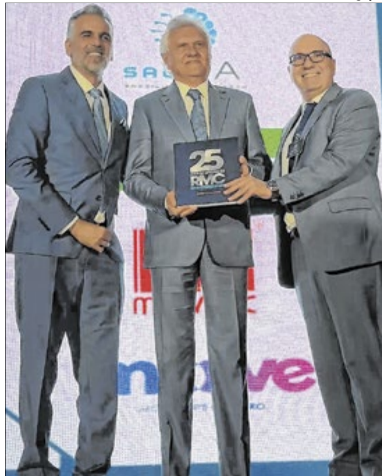
Homenageado, o governador de Goiás, Ronaldo Caiado, com o anfitrião Gustavo Reis (e), ex-prefeito de Jaguariúna e vice-presidente da APM; e o prefeito de Campinas e presidente da RMC, Dário Saad (d)