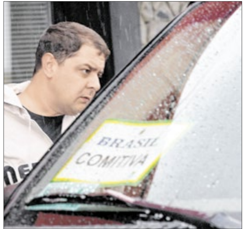
CPMI pretende investigar relações do filho de Lula

Já Flávio terá como candidato ao governo o secretário de Cidades, Douglas Ruas (PL), tendo para o Senado o governador Claudio Castro (PL) e o prefeito de Belford Roxo, Marcio Canella (União Brasil), com apoio do PP. Os três partidos elegeram 51 prefeitos em 2024. O problema: a pouca experiência de Ruas.