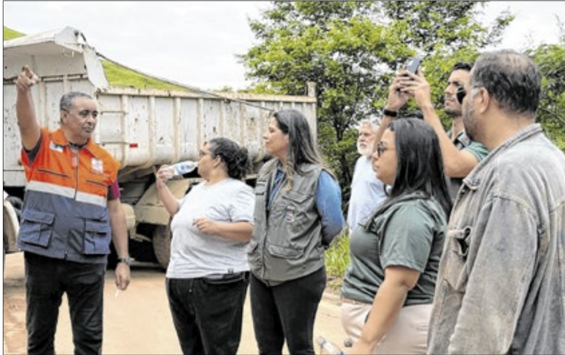
Gabinete de Crise reúne prefeita, vice-prefeito e secretariado para coordenar ações nas áreas mais atingidas

“Estamos trabalhando com responsabilidade e sensibilidade, fortalecendo nossa rede de proteção social e colocando as pessoas sempre em primeiro lugar. Por isso decretamos o estado de Emergência. Fiz questão de percorrer os pontos mais afetados para acompanhar de perto cada ação realizada. Nosso compromisso é proteger vidas e garantir assistência a quem mais precisa”, afirmou a prefeita.