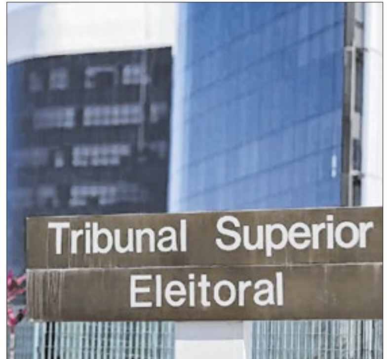
Resolução do TSE prevê o tempo que cada legenda terá

O vereador destaca que a medida vai contribuir para a redução das filas de espera nas unidades médicas da Grande Alegria. “Além de dar mais comodidade aos moradores, a implantação de um posto de saúde no Mirante da Serra vai ajudar a desafogar as unidades da Grande Alegria”, disse o vereador.