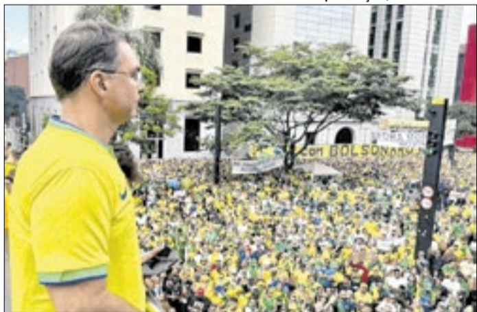
Flávio Bolsonaro disse que subirá a rampa ao lado do pai