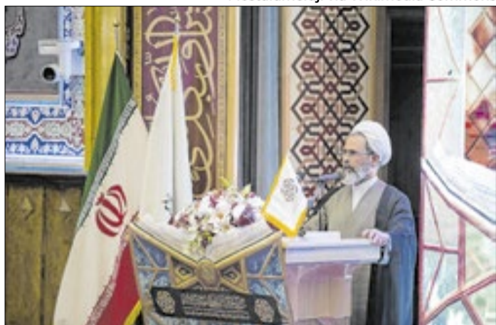
Alireza Arafí assume o cargo de aiatolá interinamente