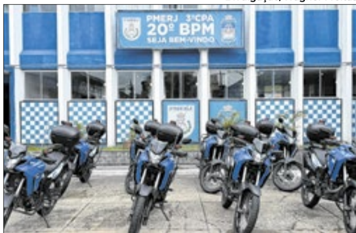
Motos já estão sendo utilizadas no patrulhamento da PM