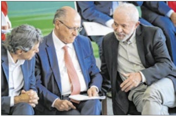
Haddad e Alckmin: o xadrez de Lula em São Paulo