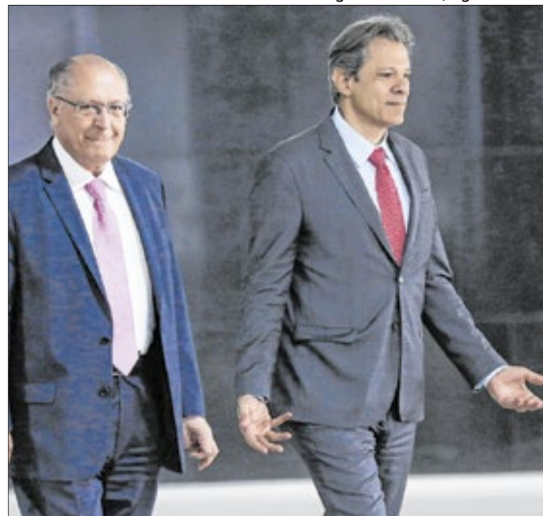
Lula quer Alckmin e Haddad no xadrez paulista

A balança comercial com o Irã foi bem favorável ao Brasil em 2025. Os país exportou um total de US$ 2,9 bilhões e importou apenas US$ 84 milhões. Vendemos, principalmente, produtos que são destaque da agricultura daqui: milho e soja, usados, principalmente, na alimentação de animais.