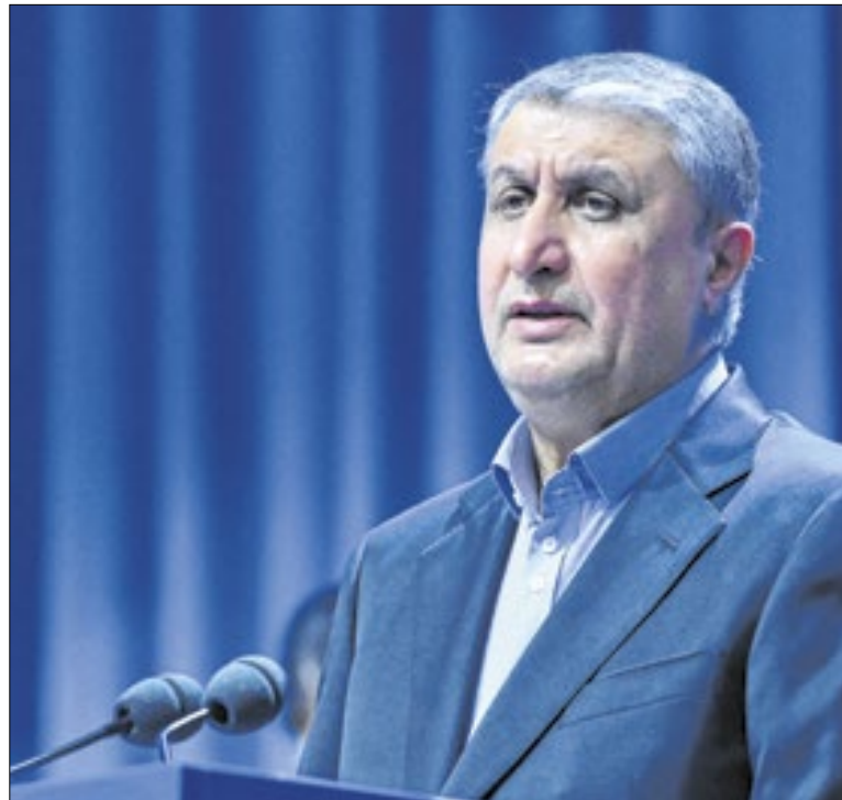
Mohammad Eslami fez a primeira oferta pública de negociação

Em nota, o Ministério Público da Venezuela informou ter pedido a prisão domiciliar de Guanipa por descumprir as condições da liberdade. Muitos dos presos políticos libertados desde a captura de Maduro pelos EUA estão proibidos de fazer pronunciamentos públicos. Guanipa fez motociata e discursou após soltura.