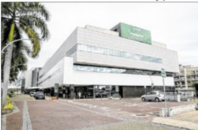
Certificado atesta padrões elevados de segurança e gestão