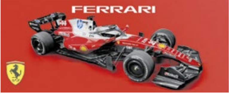
Com visual ousado, Ferrari adota o branco como cor secundária