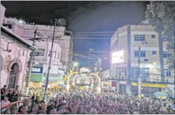
Valença confirma sucesso da festa mesmo com chuva