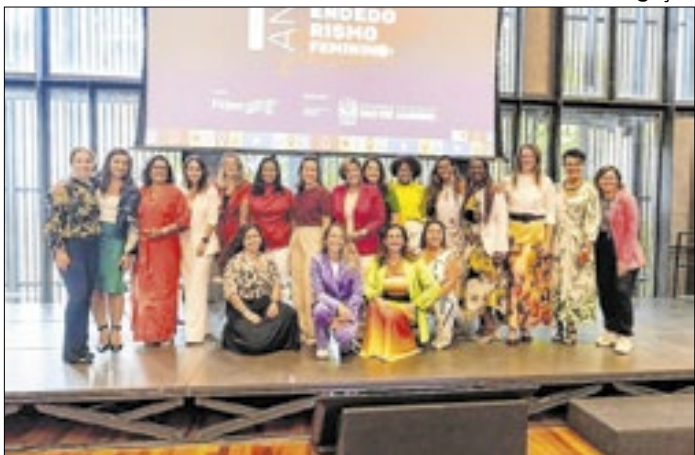
Município permanece no conselho até 2028