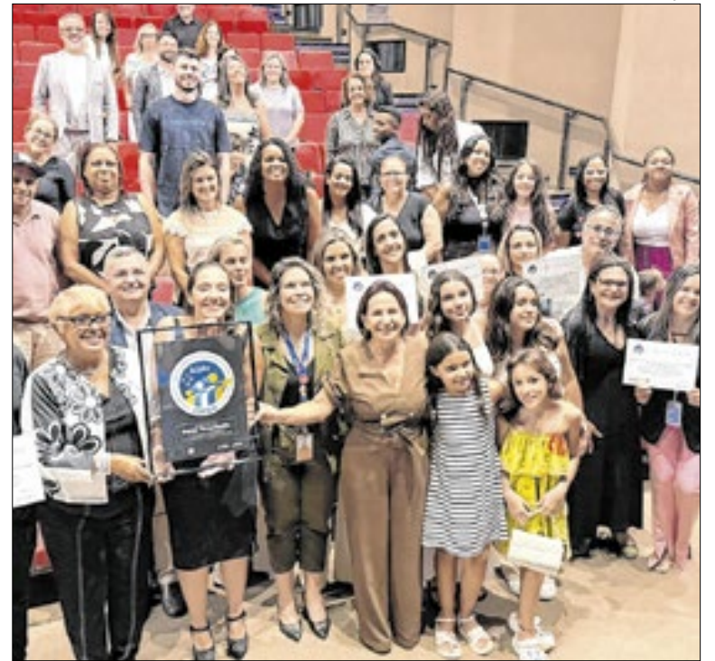
Certificação reconhece instituições que atendem a critérios