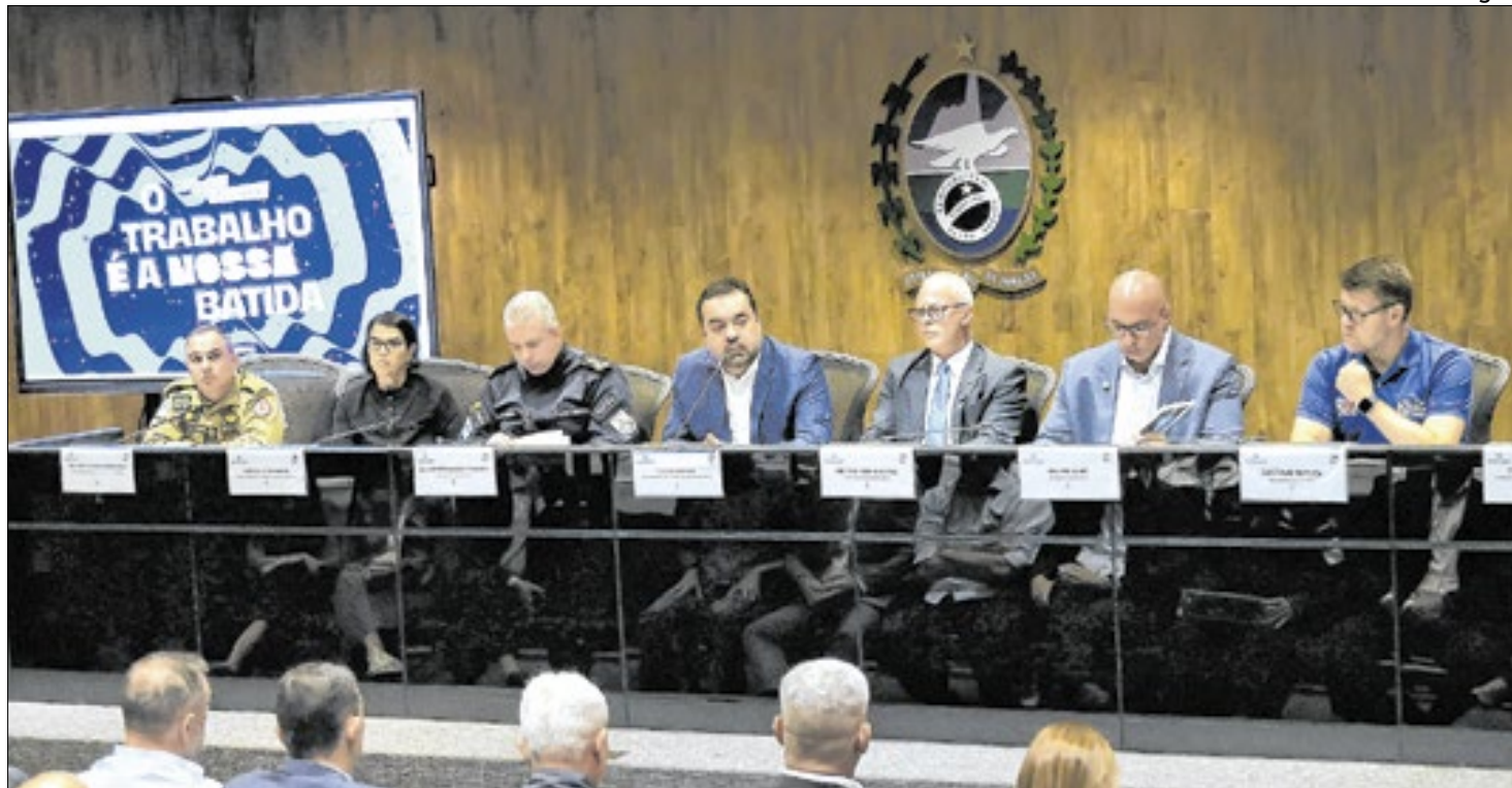
Governador Cláudio Castro com sua equipe na coletiva de imprensa do Carnaval

Os agentes vão realizar ações educativas e de segurança. As equipes também vão fiscalizar os carros alegóricos antes da entrada na avenida, e seus condutores serão submetidos ao teste de alcoolemia e, em caso de positivo, poderão responder criminalmente. Mais de 240 profissionais estarão empenhados nas