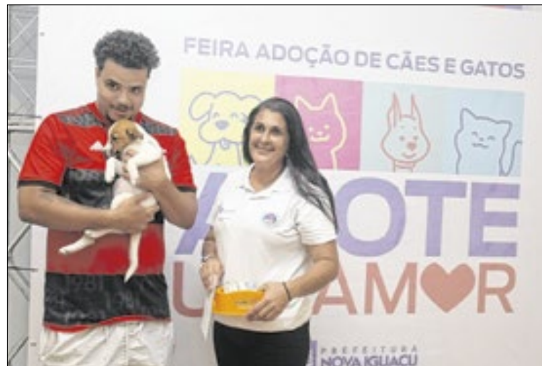
Prefeitura de Nova Iguaçu promove feiras de adoção responsável