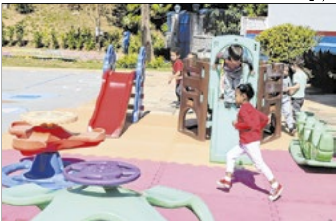
Matrícula deve ser efetivada até a próxima sexta