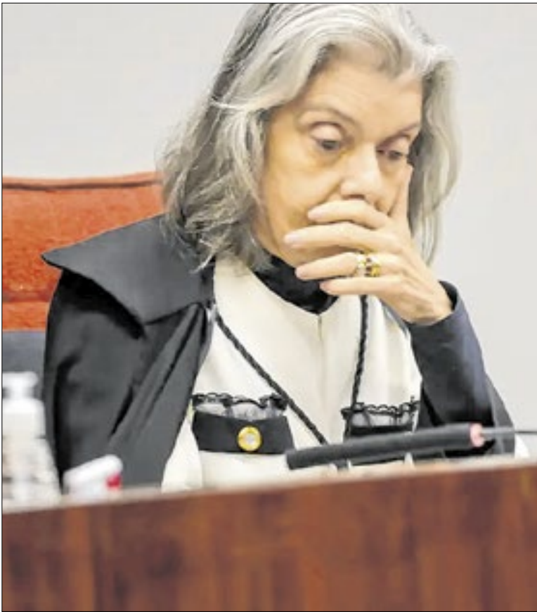
Cármen Lúcia tenta reduzir resistência ao Código de Ética