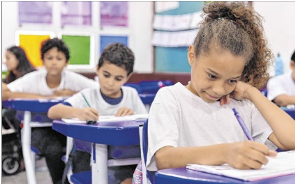
Helio Melo/Prefeitura do Rio

Um dos pilares deste avanço é o Novo Programa de Aceleração do Crescimento (Novo PAC). Entre os anos de 2023 e 2027, o estado receberá um montante total de R$ 746,9 milhões destinados exclusivamente à infraestrutura da educação básica. Esses recursos já financiam 16 obras essenciais, que incluem tanto a construção de novas escolas e creches quanto a conclusão de unidades que estavam paralisadas. Além das edificações, a mobilidade escolar foi reforçada com a aquisição de 18 novos ônibus para as re-