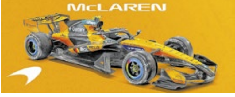
Campeã geral de 2025, McLaren repete a mescla laranja e preta