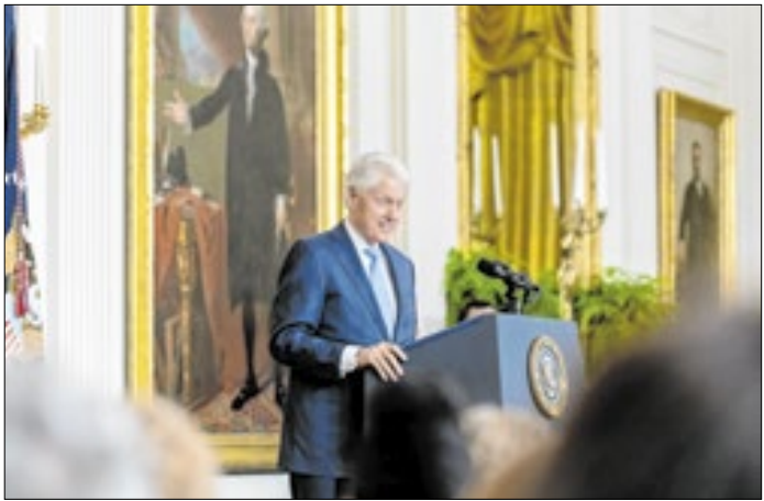
Ex-presidente Bill Clinton também apareceu nas imagens