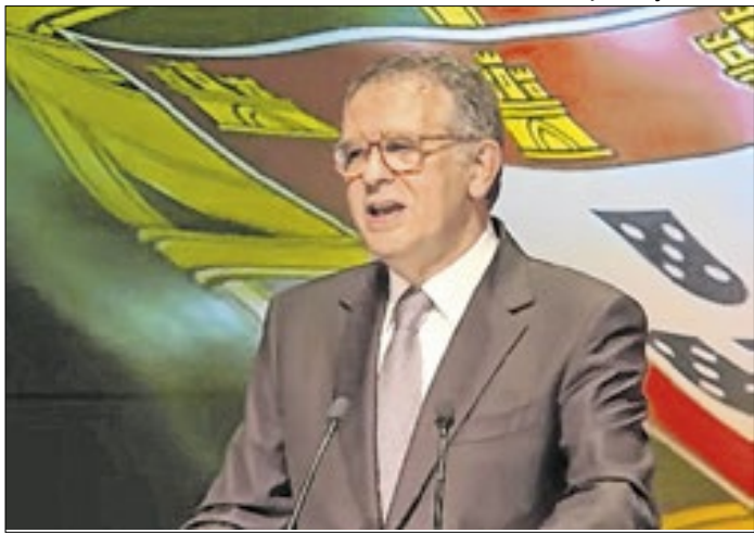
Seguro obteve os votos dos moderados em Portugal