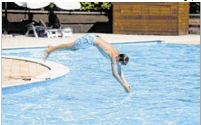
Servidores podem fazer a inscrição presencialmente