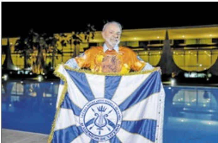
Presidente será homenageado no Sambódromo