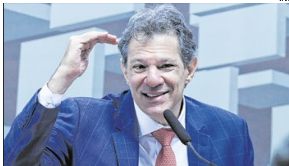
Pasta comandada por Fernando Haddad é contrária às obras

Em caso de continuidade da obra, os custos serão arcados pela própria companhia, mediante a contratação de novos financiamentos, e depois embutidos nas tarifas cobradas do consumidor, com menor risco de impacto imediato para o Tesouro.