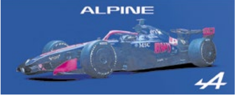
Alpine chama atenção com seu belíssimo carro azul e rosa