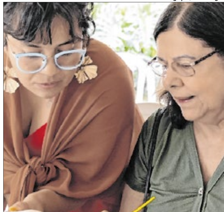
Ações focaram educação de qualidade, saúde e bem-estar

Aconteceu no último domingo (8), a aplicação da prova do Concurso Público para Auxiliar de Creche de Resende. Mais de 2 mil candidatos foram distribuídos em seis locais, todos em escolas da rede municipal. O gabarito preliminar já está disponível no site oficial do Instituto Consulpam.