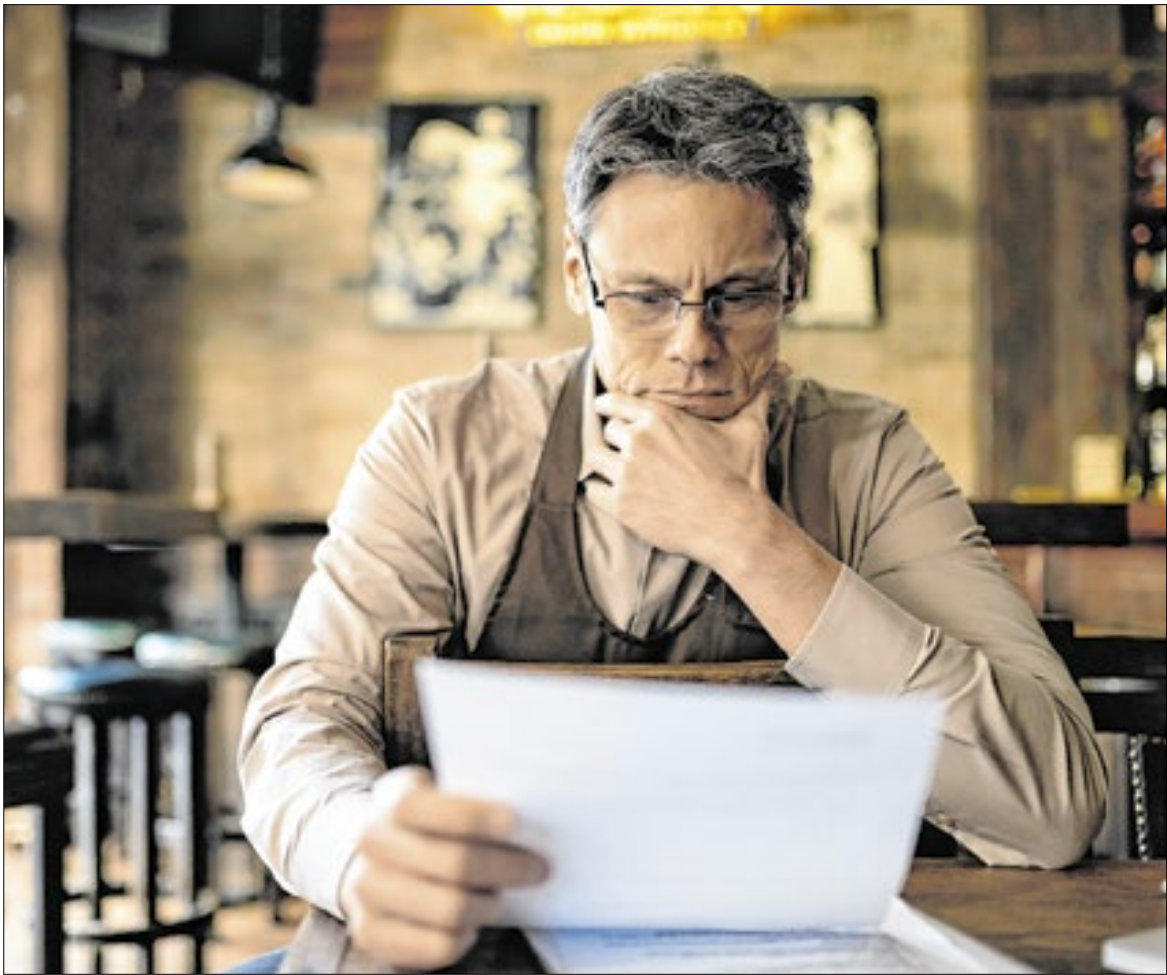
Caminho para se livrar de dívidas, segundo especialista, é inverter a lógica do consumo

Além disso, o estudo aponta que 6 a cada 10 brasileiros afirmam que saber sobre educação financeira resolveria os problemas atuais e, consequentemente, abriria caminho para juntar dinheiro. Não por acaso, 86% acreditam que primeiro é preciso guardar