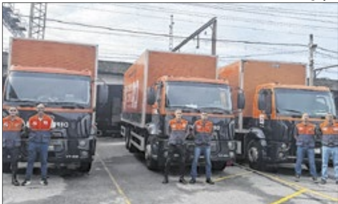
Pelo menos 700 materiais de assistência serão entregues