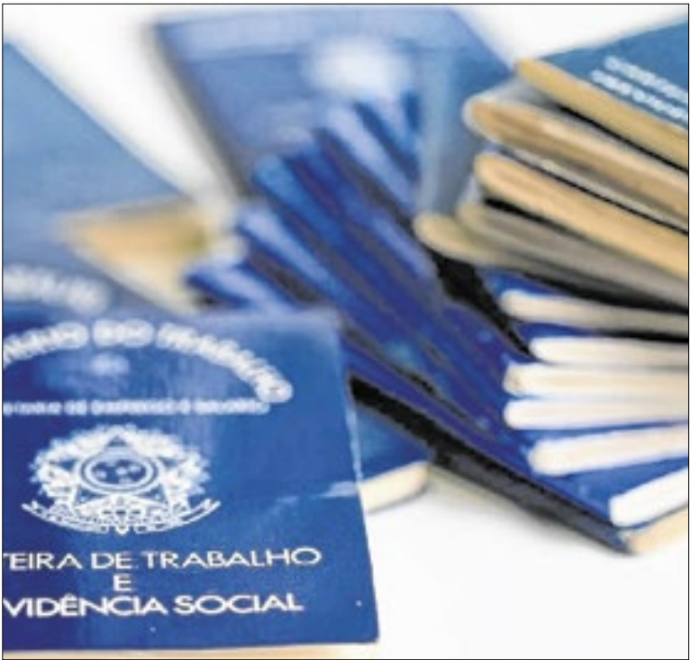
Parte das vagas de emprego exige experiência

A iluminação cênica deu um brilho especial à noite. Além de realçar os carros alegóricos e fantasias, o sistema iluminou os monumentos projetados por Oscar Niemeyer ao longo do Caminho, criando um espetáculo visual inédito na cidade. As escolas mostraram força, empolgação e muito samba no gogó.