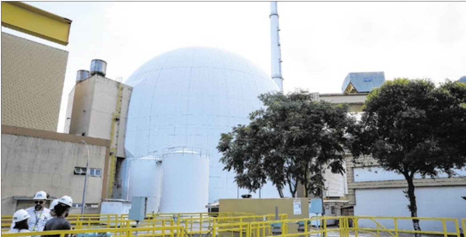
Obras de usina em complexo nuclear de Angra dos Reis-RJ podem finalmente serem aprovadas pelo governo Lula