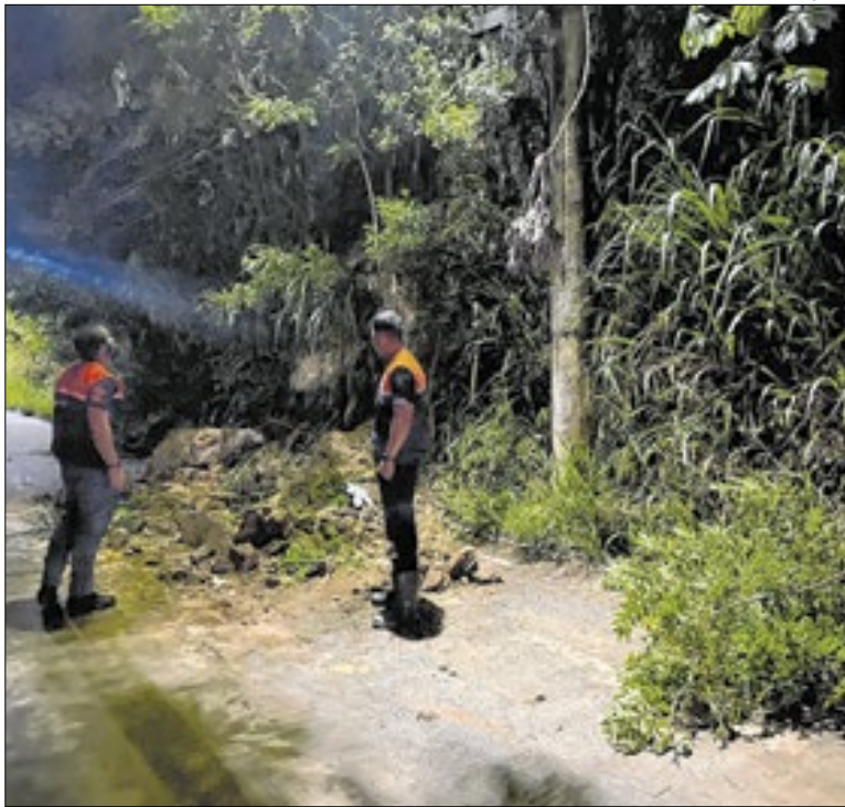
No momento, o volume dos rios apresentam redução gradual

Também foram anunciadas novas oportunidades de emprego para o distrito de Ipiabas, nas funções de peixeira, atendente de lanchonete, padeiro e salga-deira. Além de vagas para os distritos de Dorândia e Vargem Alegre nas funções de borracheiro e atendente de borracharia.