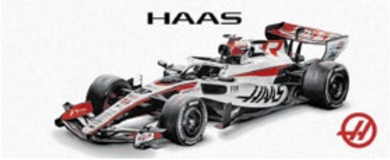
Haas mantém a paleta de 2025, com branco, vermelho e preto