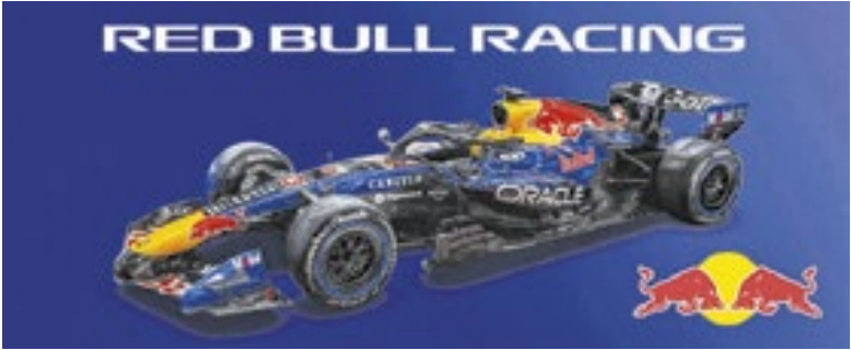
Red Bull aposta em um azul brilhoso e no amarelo mais vivo