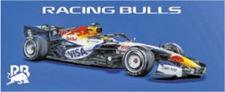
Racing Bulls adota o preto como cor secundária junto ao azul

A pré-temporada começa nesta quarta (11), no Bahrein, com a temporada começando oficialmente no GP da Austrália, em 16 de março.