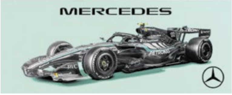
Mercedes aposta em seu tradicional carro preto, prata e verde