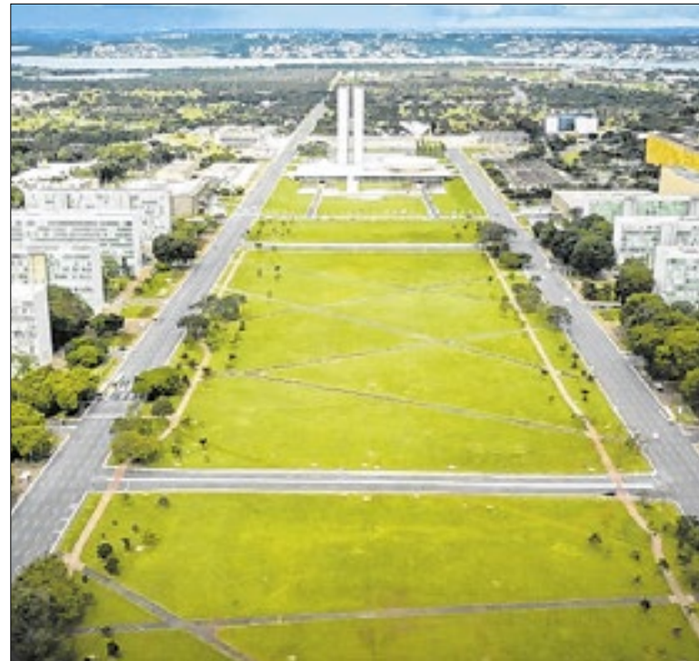
Servidores estão dispensados até o dia 18, às 14h

Outras condutas inadequadas de conotação sexual e discriminação também são foco do programa contra o feminicídio. "A Comissão de Mulheres apoia todas as iniciativas que buscam o respeito mútuo, a dignidade e a inclusão de todas as Analistas-Tributárias e Analistas-Tributários" finaliza o SindiReceita.