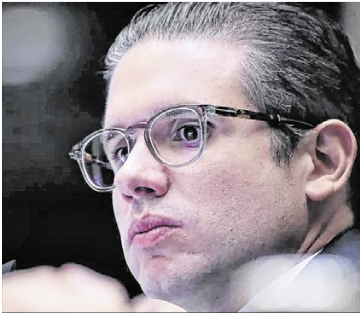
Presidente da Câmara, Hugo Motta defendeu projeto que dá vantagens a servidores

Segundo o presidente da Câmara, o aumento é necessário por causa do reajuste dos servidores. Como justificativa, Motta diz que sem o aumento da verba, os gabinetes teriam que demitir funcionários.