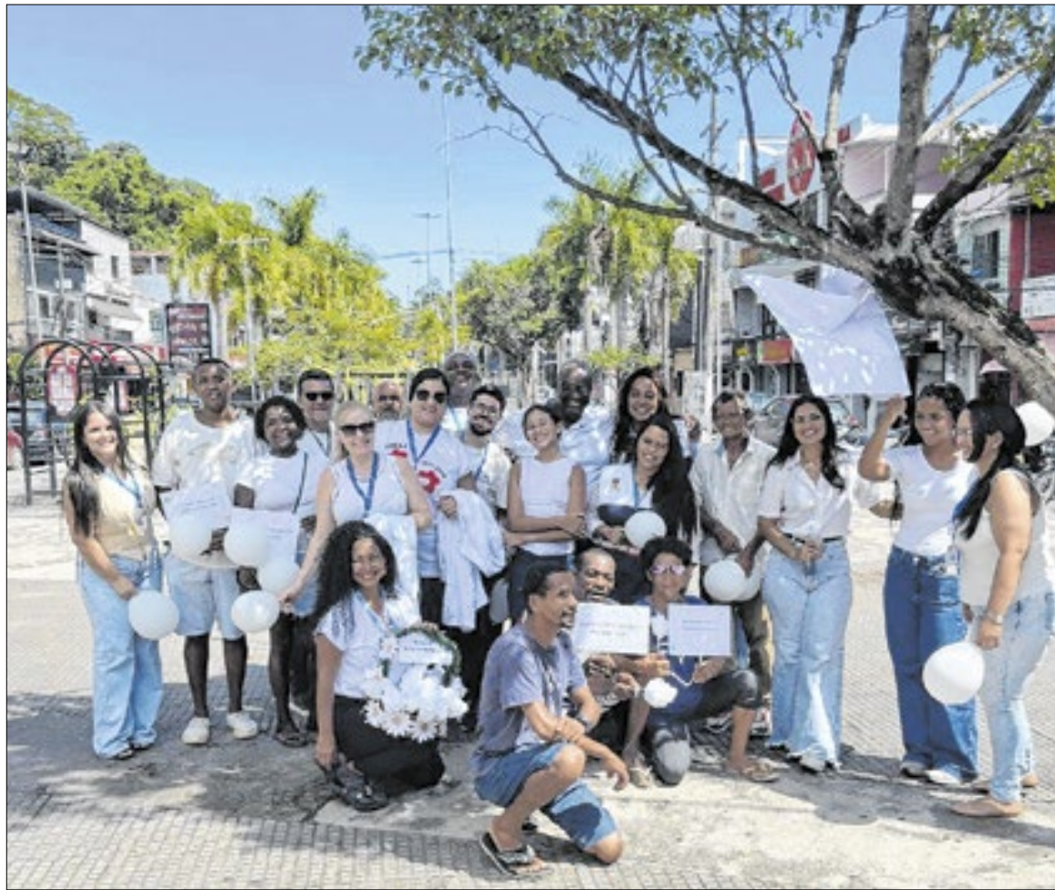
Evento reafirma a importância de iniciativas que aproximam os serviços de saúde da população, fortalecendo vínculos e ampliando o acesso à informação e ao cuidado.

As ações do Janeiro Branco, desenvolvidas pela Secretaria Municipal de Saúde de Duque de Caxias, por intermédio do Departamento de Atenção à Saúde Mental, aconteceram em diversas unidades do município, entre elas, no Hospital Municipalizado Adão Pereira Nunes (HMAPN); UPH Imbariê; Hospital Municipal Dr. Moacyr Rodrigues do Carmo (HMMRC); CAPS Imbariê; UPH Parque Equitativa; CAPS