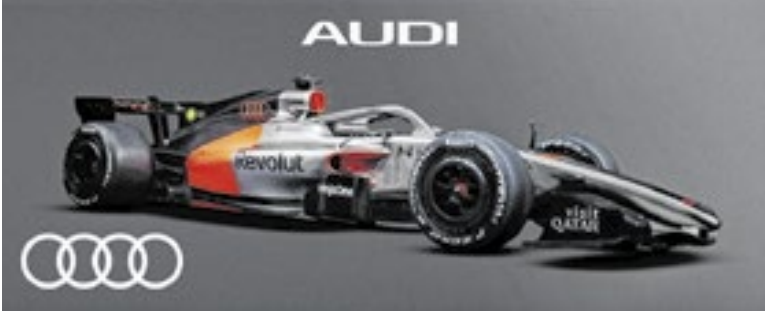
Estreante, a Audi vem com um carro prata, preto e vermelho