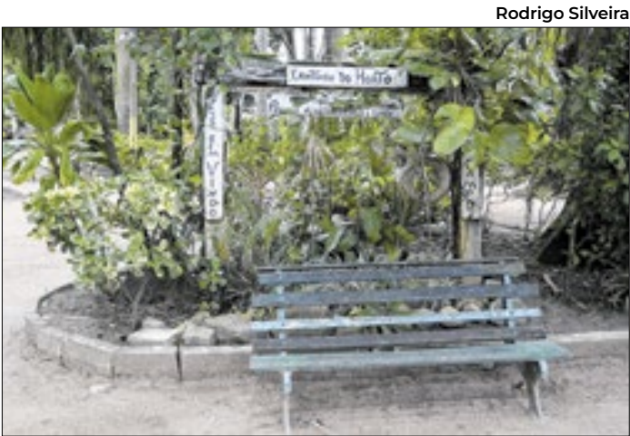
Obras estão previstas para o próximo mês

Já a Guarda Marítima e Ambiental registrou 12 ocorrências, incluindo o resgate de quatro animais silvestres — duas gaivotas, um gambá e um mico —, atendimento a um princípio de incêndio, fiscalizações de som alto e apuração de uma suposta venda irregular de passeio. O grupamento também participou de duas operações, uma relacionada à construção irregular e outra voltada à fiscalização e preservação ambiental no Pontal do Peró.