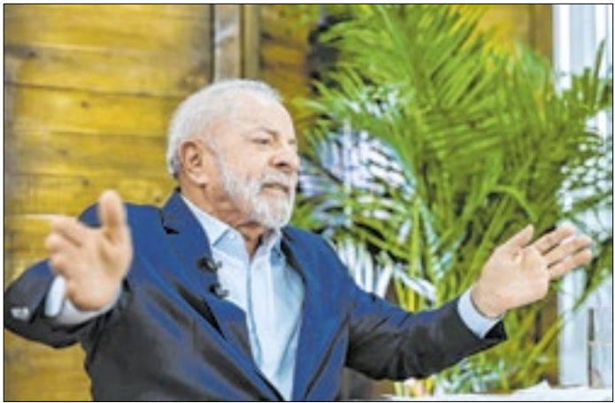
Lula vislumbra um clima de guerra nas eleições