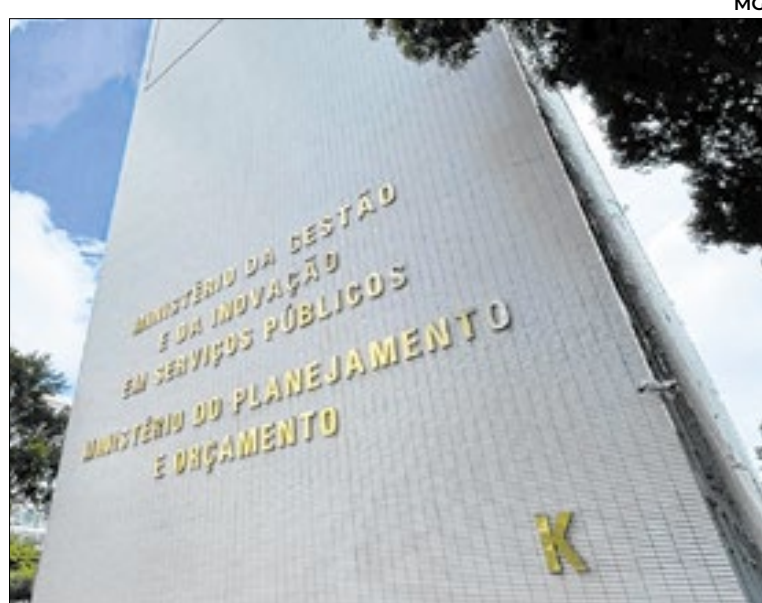
Ministério da Gestão e Inovação em Serviços Públicos (MGI) calcula que o impacto orçamentário do projeto relativo ao Poder Executivo pela Câmara é de até R$ 5,3 bilhões

“O texto reúne medidas estruturantes para enfrentar a fragmentação histórica do sistema de carreiras, reduzir distorções remuneratórias e atualizar instrumentos de gestão da força de trabalho no Executivo federal, alinhando organização de carreiras, valorização profissional e capacidade de entrega do Estado”, defendeu o MGI.