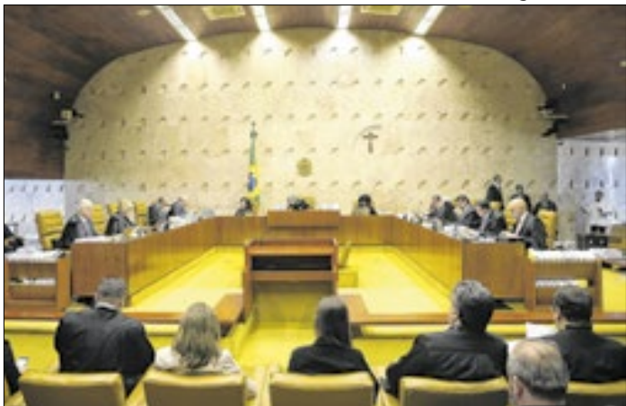
Supremo votou pela constitucionalidade da norma