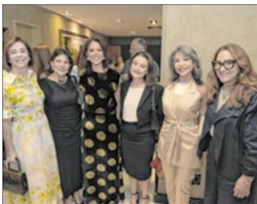
Cerimônia de posse da juíza Eunice Haddad como presidente da AMAERJ reuniu autoridades e amigos no Plenário Ministro Waldemar Zveiter, do Tribunal de Justiça do Rio de Janeiro

Prestigiaram a posse os desembargadores José Carlos Murta Ribeiro, presidente do TJ-RJ de 2007 a 2008, e Luiz Zveiter, presidente do Tribunal no biênio 2009-2010.