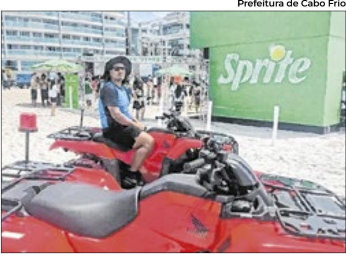
Corporação reuniu ações nas praias, orlas, trânsito