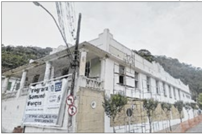
Equipes avaliam a liberação do trecho