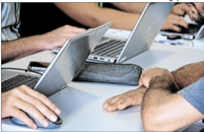
Pela primeira vez, a parceria ofertou atendimentos jurídicos