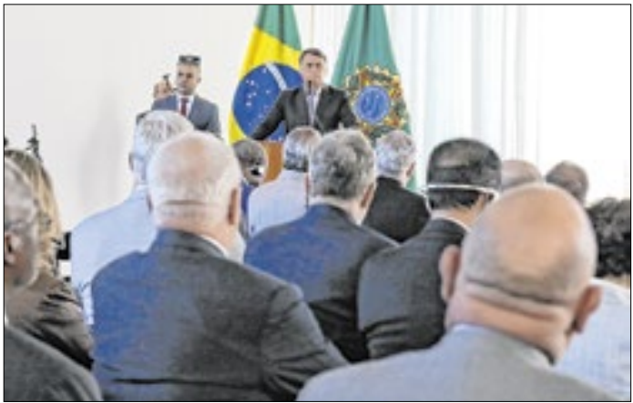
TV Brasil transmitiu fala do então presidente