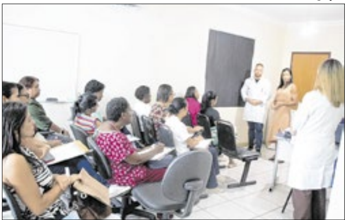
Curso foi direcionado a Auxiliares de Saúde Bucal (ASB)