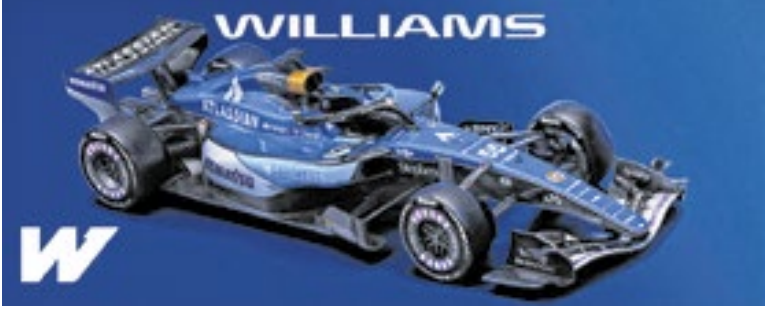
Williams traz dois tons de azul, junto ao preto, branco e laranja