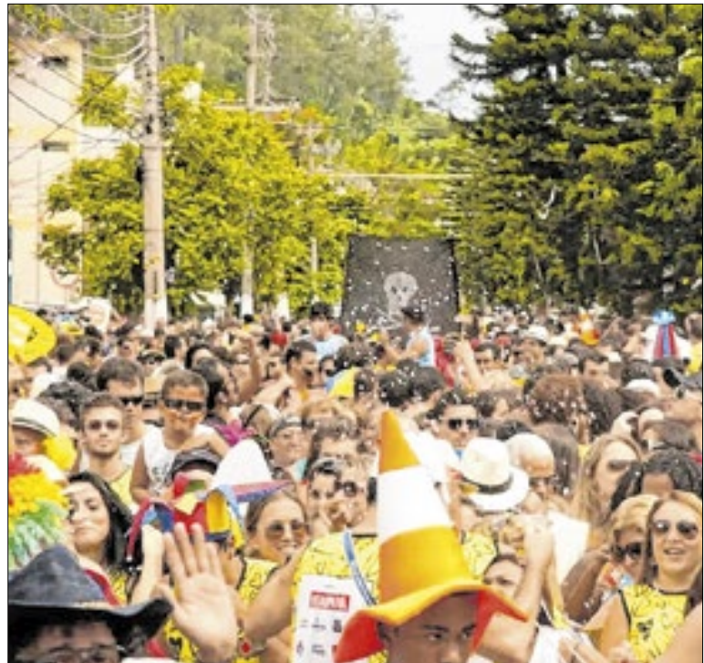
Ações estão sendo promovidas em Volta Redonda

A corrida contará com premiação em dinheiro na categoria geral, totalizando R$ 1.400,00, além de troféus por faixa etária e medalhas de participação para todos os concluintes. A iniciativa tem como objetivo incentivar a prática esportiva, promover saúde e fortalecer a integração da comunidade.