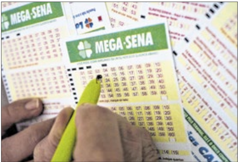
Sorteios são realizados três vezes por semana pela Caixa

A ideia é criar uma aposta mais abrangente. Historicamente, os resultados dos sorteios da Mega-Sena raramente apresentam sequências óbvias ou números concentrados apenas em um quadrante do volante. Distribuir