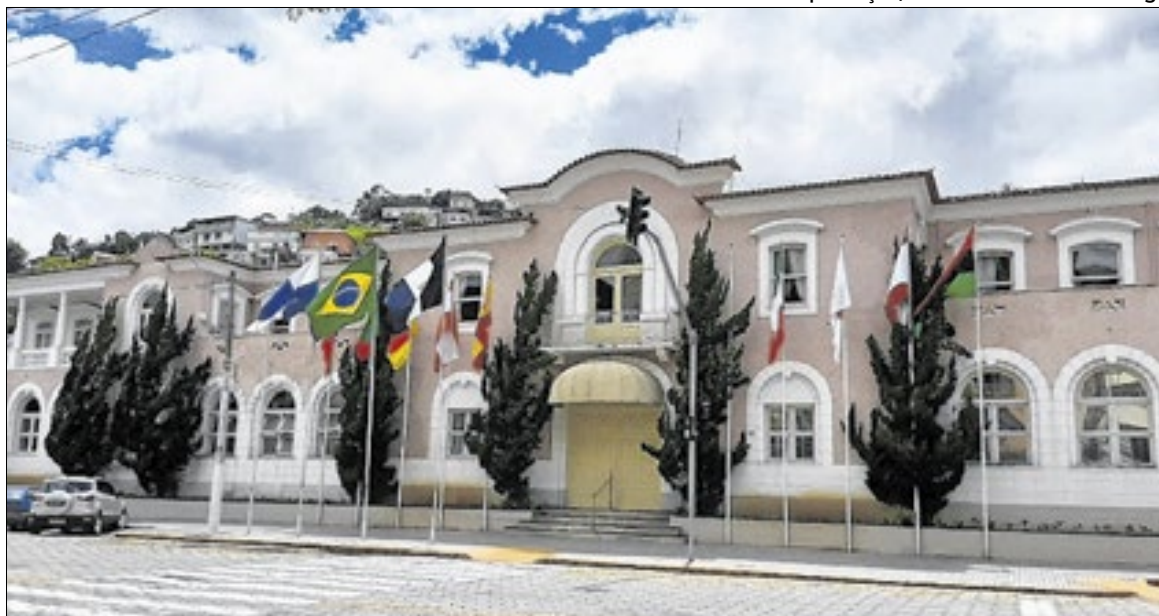
O fato propulsor da ação foi relatos e denúncias de pais e responsáveis ao MPRJ

Segundo o MPRJ, o município deveria assegurar as mesmas quantidades de vagas e carga horária estendida que era oferecida em 2024 e em anos anteriores, que eram cerca de 10 a 12 horas diárias para as turmas de pré-I e pré-II, que atendem crianças de quatro a cinco anos de idade.