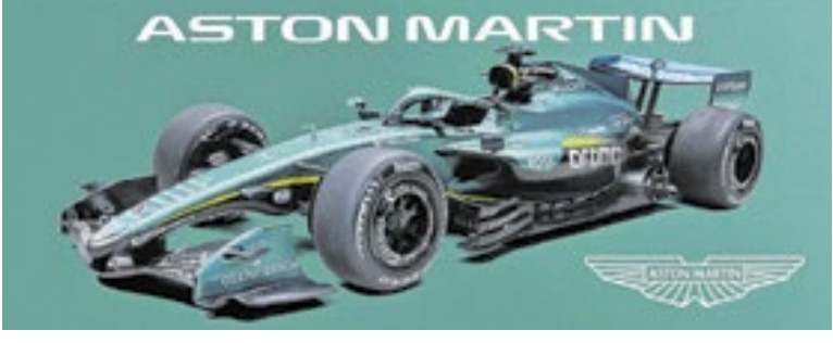
A Aston Martin mantém seu padrão de verde, preto e amarelo