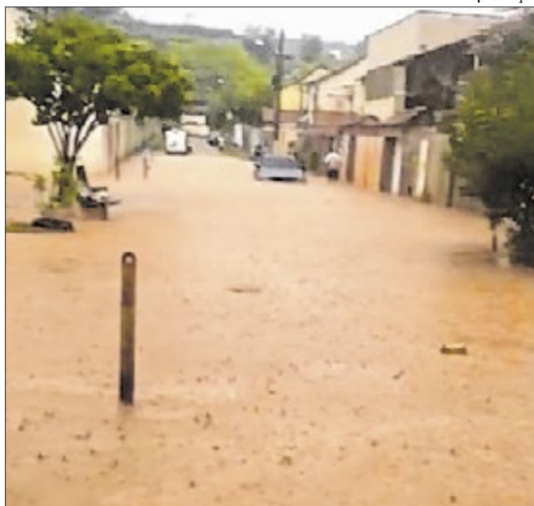
Estado de alerta Nível II segue em vigor para municípios

Diante do cenário, o Governo do Estado está enviando ajuda humanitária aos atingidos como resposta emergencial. Em Paty de Alferes, houve envio de maquinário para limpeza urbana e desobstrução de vias, em parceria com a Cedae e a Defesa Civil municipal.