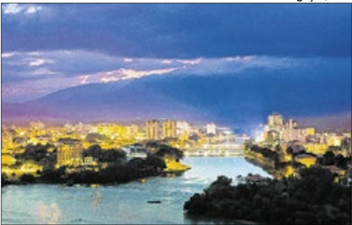
Proposta é defendida para mobilidade urbana