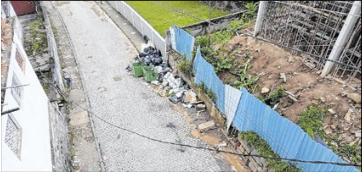
Moradores alegam transtornos diário por falta de sinalização e buracos na via

A Secretaria de Obras realizou serviço de limpeza de ralos e desobstrução de rede nesta semana, medida tomada para garantir