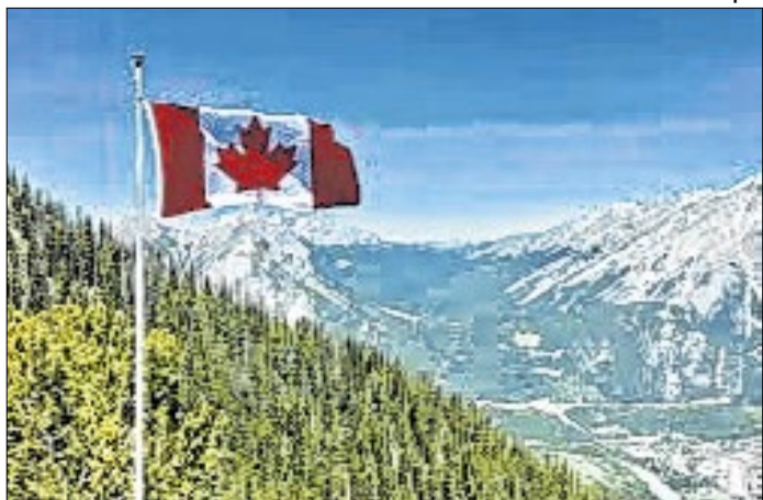
Canadá tem acordo bilateral previdenciário com o Brasil