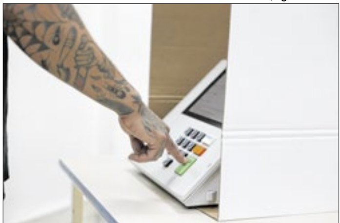
O voto, de fato, na eleição proporcional pouco importa