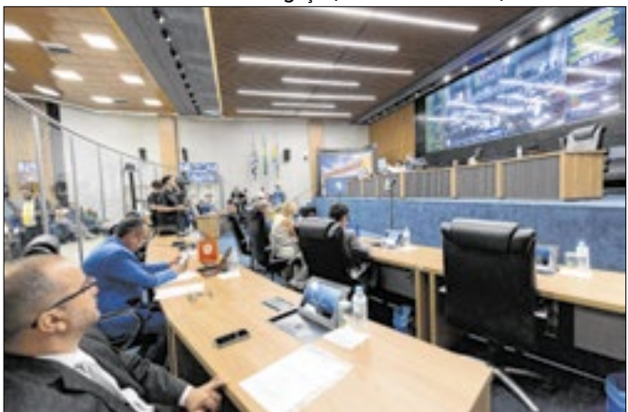
População da Grande SP terá novas regras