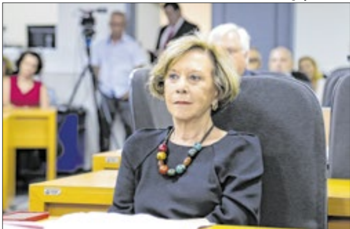
Sessão marcou último ato da carreira da procuradora