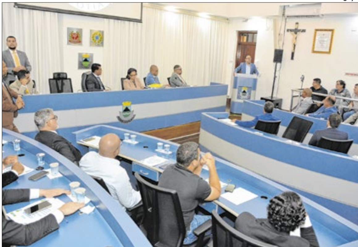
Momento da reunião na Câmara Municipal de Cotia, com a presença do prefeito da cidade

“O Brasil tem um modelo diferente de governabilidade. Os presidentes que tentaram governar sozinhos, sem ouvir o Poder Legislativo, não avançaram. É importante respeitar o Judiciário e entender a grandeza do Poder