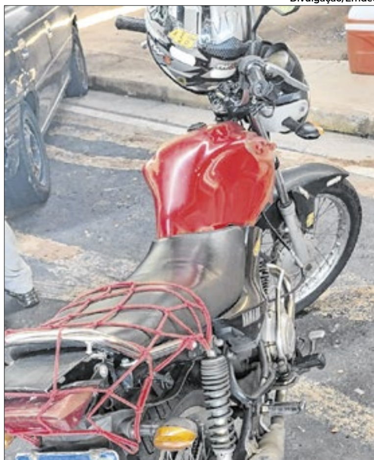
Multas: licenciamento vencido e excesso de velocidade