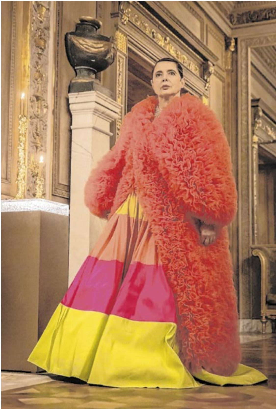
Isabella Rossellini interpreta a personagem Franny Forst

Assinada pelo produtor Ryan Murphy (American Horror Story), "The Beauty" é uma nova produção original do Hulu que chegou ao Brasil pela Disney Plus. Uma adaptação dos quadrinhos de mesmo nome, ela retrata a realidade de um mundo no qual a beleza está a somente uma seringa de distância.