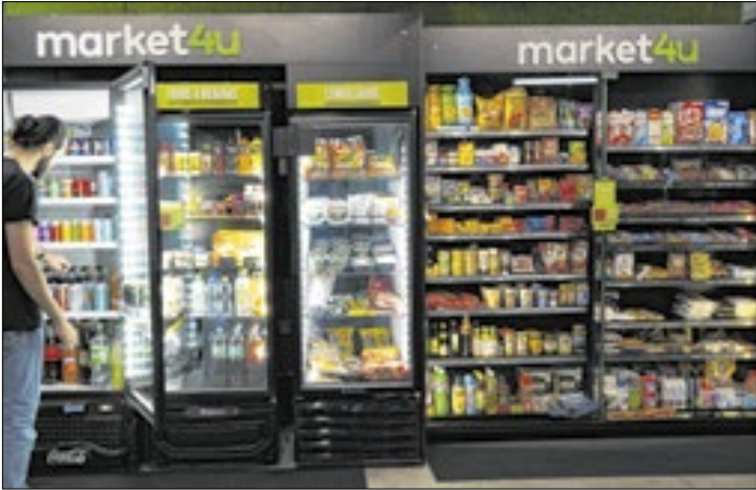
Grupo conta com 2,5 mil lojas em 180 cidades brasileiras