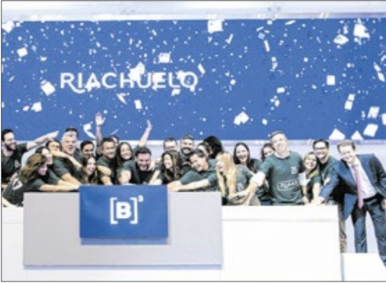
Companhia substitui código de negociação na bolsa

A alta do preço do café acabou fazendo com que o consumo caísse em 2025. Dados da Associação Brasileira da Indústria de Café (Abic), o consumo da bebida caiu 2,31% entre os meses de novembro de 2024 e outubro de 2025 ante igual período anterior, passando de 21,9 milhões de sacas de 60 kg em 2024 para 21,4 milhões.