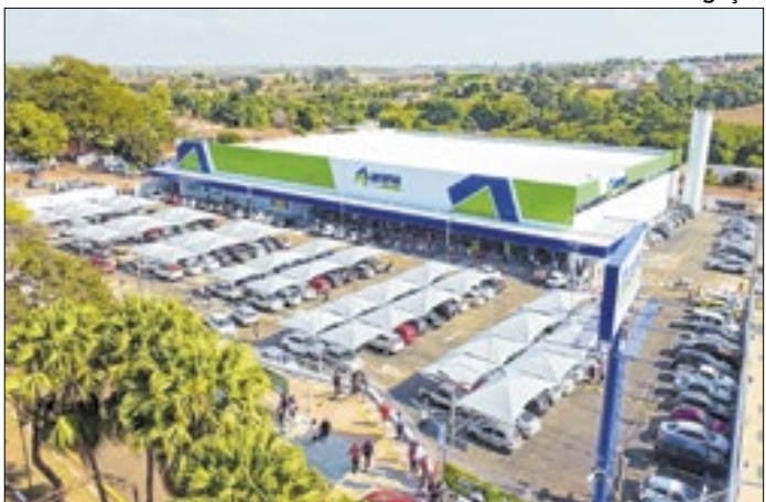
Projeto avalia jornada e bem-estar dos funcionários