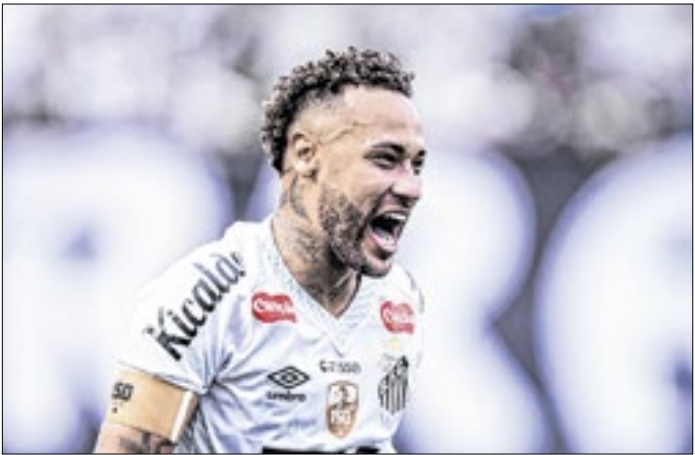
Cirurgia de correção do joelho de Neymar foi bem-sucedida