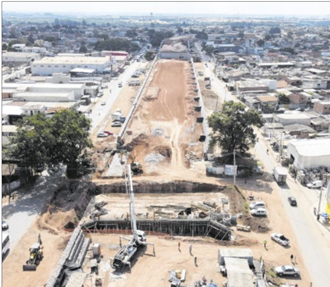
Rodovia Miguel Melhado de Campos recebeu serviços de duplicação, viaduto entre outras obras Augusto César Silva Santos Gandolfo

Solicita esclarecimentos - sobre as diretrizes da agência ambiental - para assegurar que todas as atividades estejam em conformidade com a legislação e com as exigências técnicas para a proteção do ecossistema afetado, tais como: identificação das espécies, metodologias de translocação