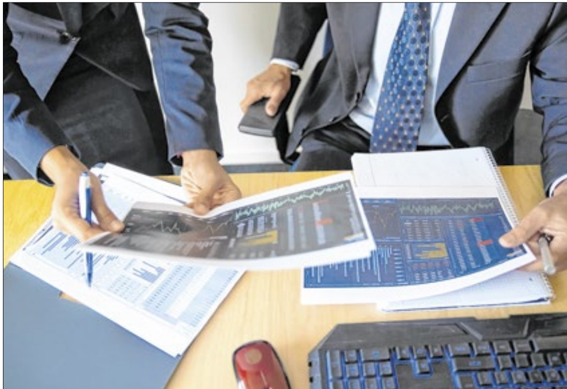
As denúncias incluem gestão fraudulenta, desvio de dinheiro e formação de quadrilha

Outro cliente, que investiu R$ 600 mil, só percebeu o retorno prometido no 1º mês de operação. Ao tentar reaver seu capital, não obteve qualquer resposta da instituição. Muitos desses investidores, acreditando na legitimidade do negócio, chegaram a recomendar a empresa para familiares e amigos, ampliando o rastro de perdas financeiras.