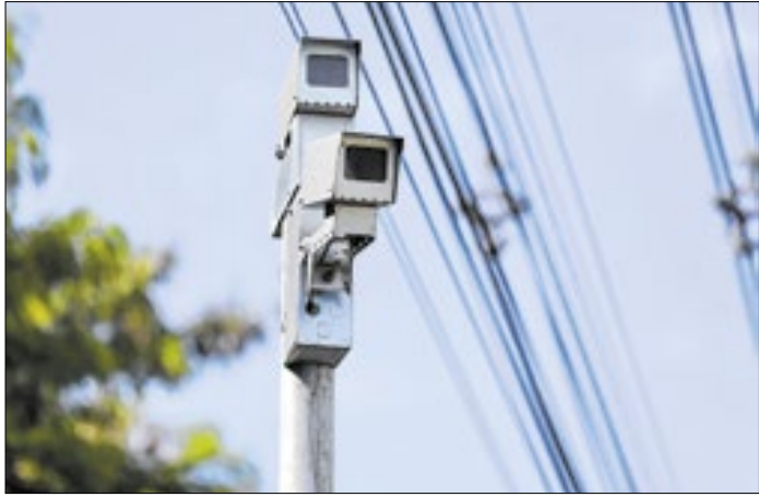
Consórcio fará instalação e manutenção do sistema