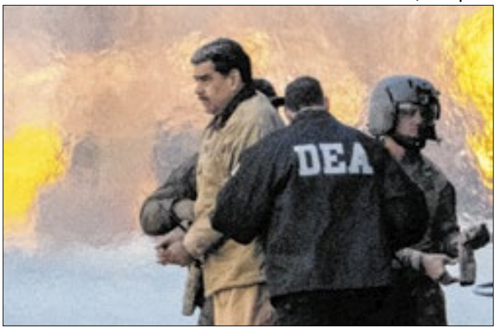
Nicolás Maduro está preso nos EUA desde janeiro