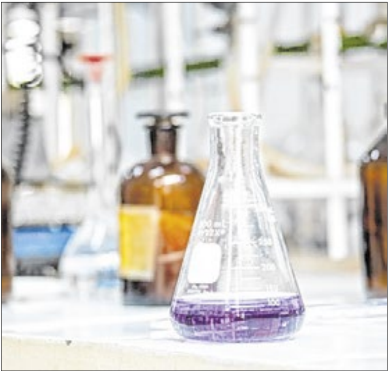
Reagentes alteram a cor e detectando a presença de metanol