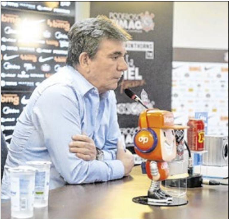
MP apura possível descumprimento de medidas cautelares