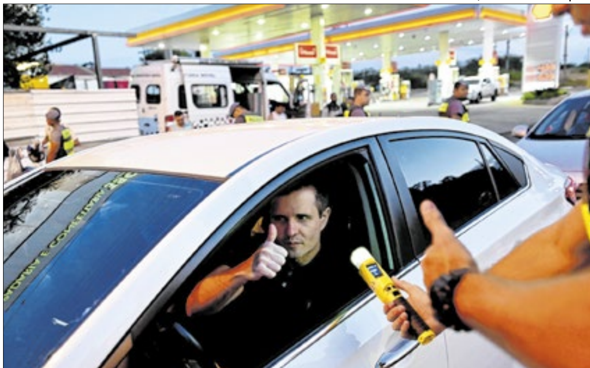
Foram 82 autuações: 81 por recusa ao teste de bafômetro e uma por álcool e direção

Foram 379 autuações aplicadas a motocicletas, 323 a automóveis e 10 infrações cometidas por outros tipos de veículos (vans e caminhões). Os agentes abordaram, nas operações de janeiro, quase 2,2 mil veículos (1.218 carros e 913 motocicletas). Foram retirados das ruas e removidos ao Pátio Municipal mais de 139 veículos em situações que feriam a legislação (86 motocicletas, 51