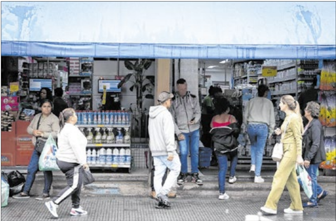
A variação do custo de vida em dezembro refletiu reajustes em serviços essenciais

O encarecimento dos transportes atingiu de forma mais intensa as famílias de menor renda. Em dezembro, a variação do grupo chegou a 1,74% para a classe E e a 1,52% para a classe D. Entre as famílias da classe A, a alta foi de 0,48%. Apesar do avanço no mês, o grupo de transportes acumulou elevação de 3,39% em 2025, uma das menores variações entre os grupos analisados e abaixo da média geral do índice.