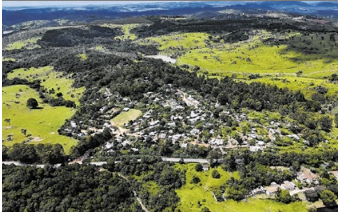
Prefeitura de Valinhos

O decreto municipal, no entanto, vai além dessas duas propriedades. Além do Sítio Lajeado e da Fazenda Eldorado, a medida inclui o Sítio Trombetta, o imóvel rural remanescente da Fazenda Bela Aliança, a Chácara São Patrício e um imóvel localizado