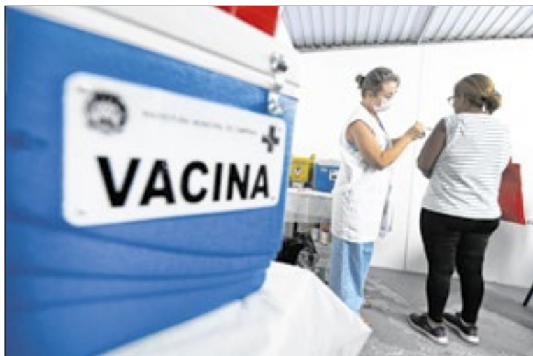
Em 2025, foram 547 casos e 67 mortes de SRAG por influenza

Em 20 de maio do último ano, a Saúde ampliou a vacinação para a população a partir de 6 meses de idade, e ainda está disponível em alguns Centros de Saúde en-