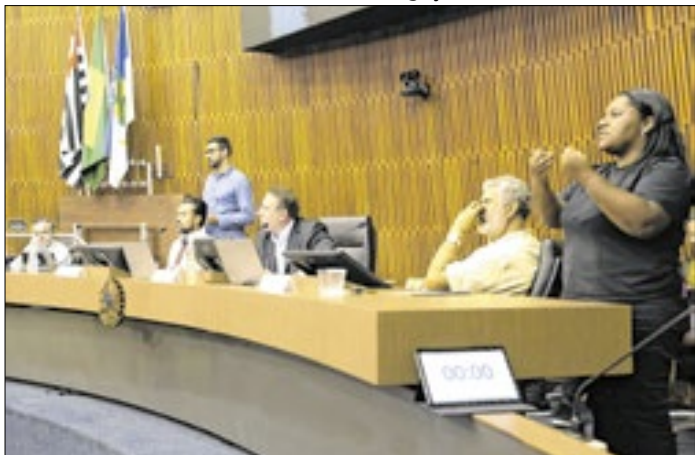
Vereadores retomaram os trabalhos legislativos