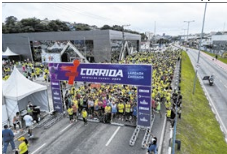
Participantes em largada de corrida oficial do município

As inscrições presenciais para moradores e para a caminhada ocorrem nos dias 5, 6 e 7 de fevereiro, no Parque da Cidade, na Vila Nova Itapevi. Nos dias 5 e 6, o atendimento será das 13h às 21h; no dia 7, das 10h às 18h. Já os atletas