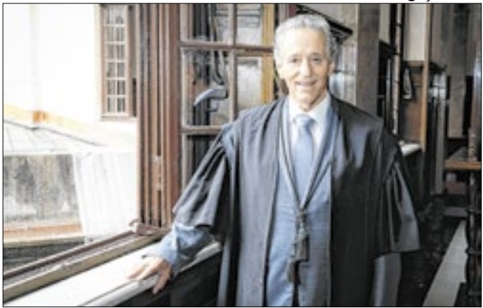
Magistrado vai se aposentar após 38 anos no TJSP