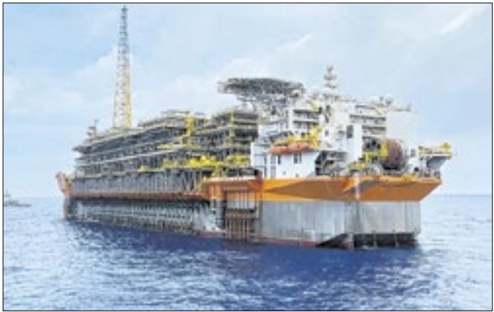
Perfuração na foz será feita por navio-plataforma