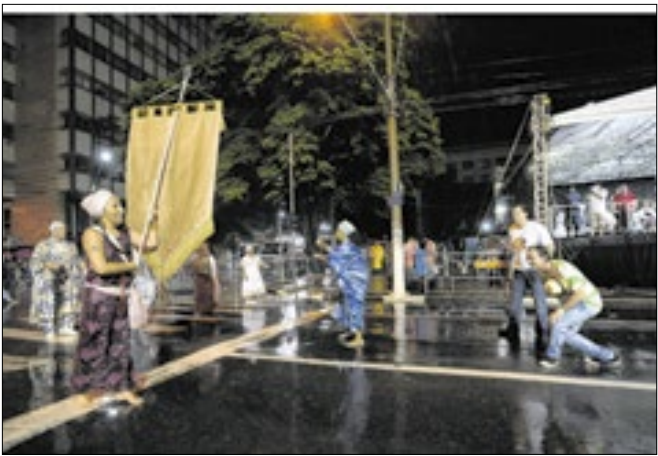
Carnaval campineiro é sempre miado