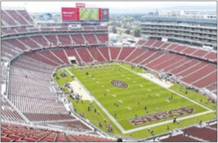
Levi's Stadium vai receber o 60º Super Bowl neste domingo