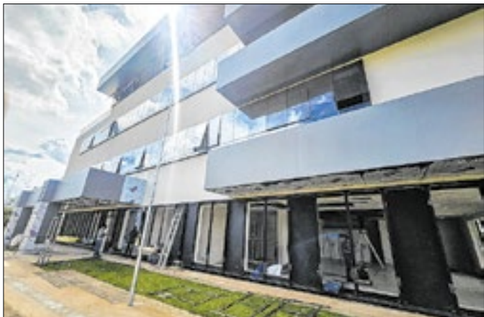
Cidade Saúde ampliará a capacidade de atendimento