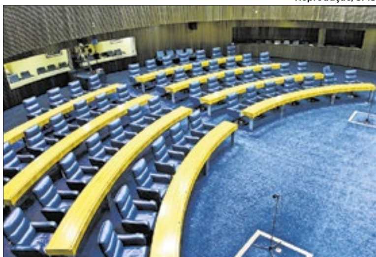
Plenário de votação da Câmara Municipal de São Paulo

Apresentado em 2019, o projeto passou por análise em diferentes comissões perma-