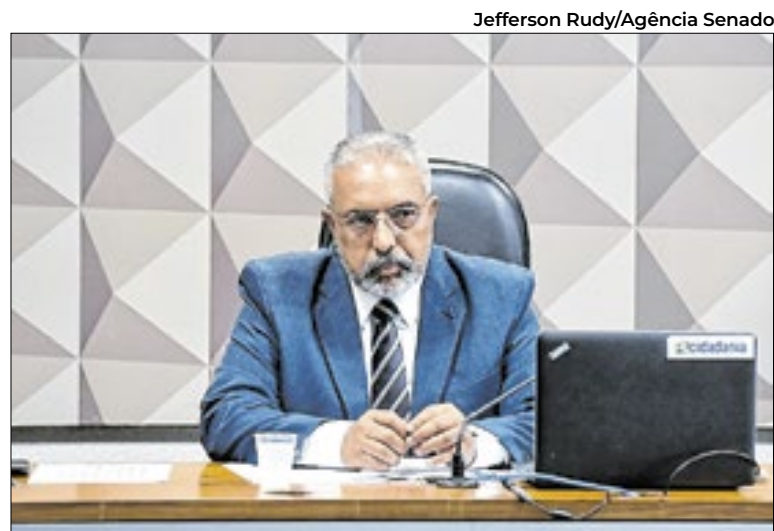
Paim é autor da proposta mais antiga em tramitação

Já no Senado, a Comissão de Constituição e Justiça (CCJ) foi mais adiante e aprovou, também no início de dezembro de 2025, o