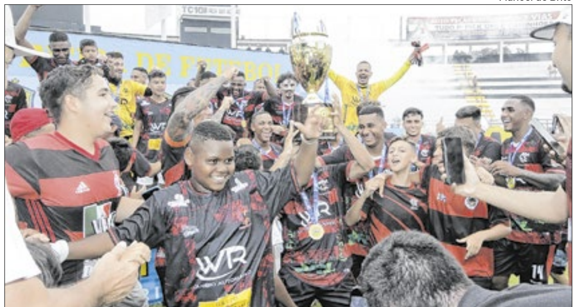
Ampliação do número de times inscritos permitirá que mais jovens participem das competições

O sistema de disputa do Campeonato Municipal de Futebol de Base terá duas fases. Na primeira fase, com início no dia 25 de abril, os times jogam dentro do próprio grupo, em quatro rodadas. Assim,