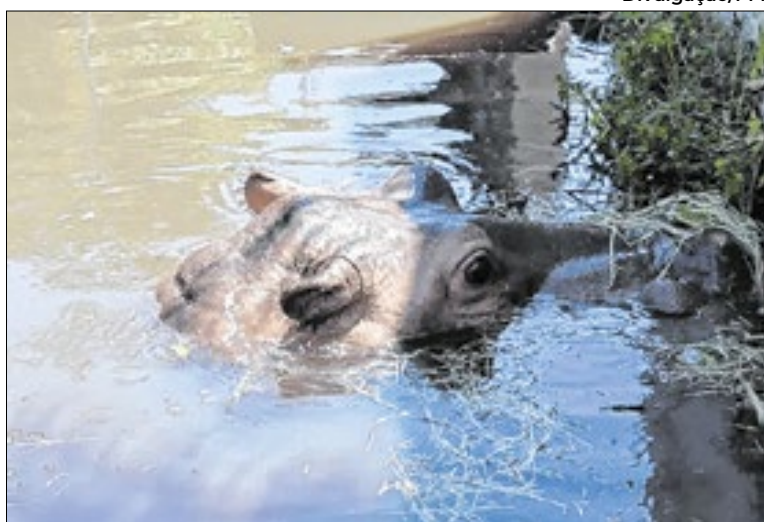
Juninho viveu 50 anos e poderá ganhar um memorial

Juninho chegou ao recinto com apenas três anos e era o morador mais antigo. Recente-