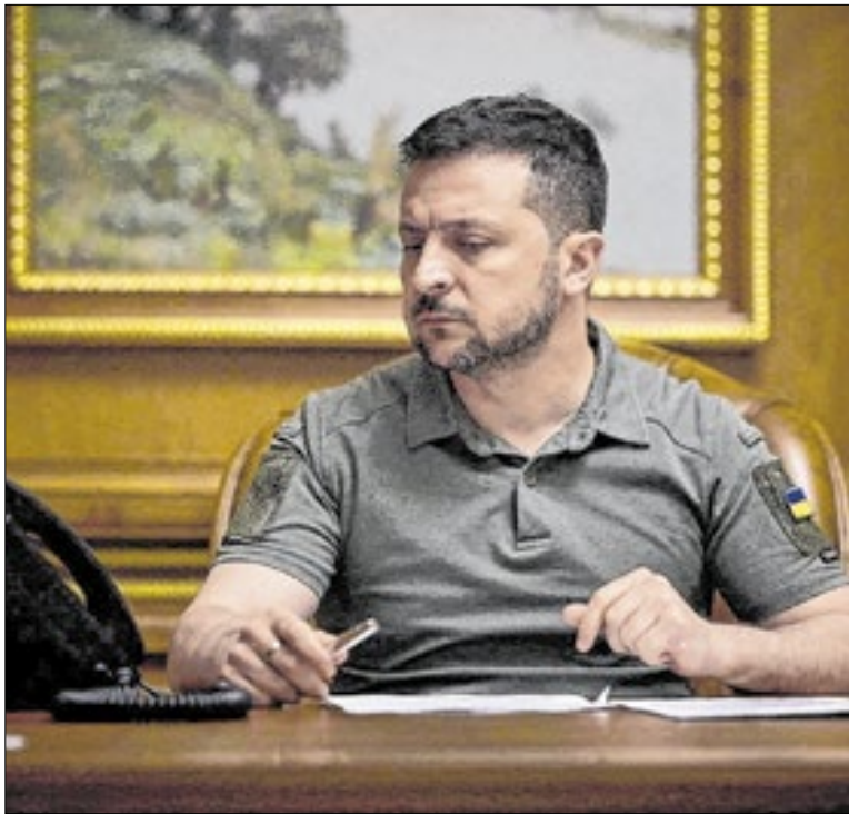
Zelenski não se mostra aberto ceder às demandas da Rússia

Já a menina desaparecida foi arrastada para dentro do rio Turvillá, na Espanha, ao tentar resgatar o próprio cachorro. O desaparecimento aconteceu na província de Málaga. O corpo do cão foi encontrado na quarta, mas a garota ainda é procurada. Na Espanha, há 14 rios e 10 barragens com risco extremo de transbordamento.