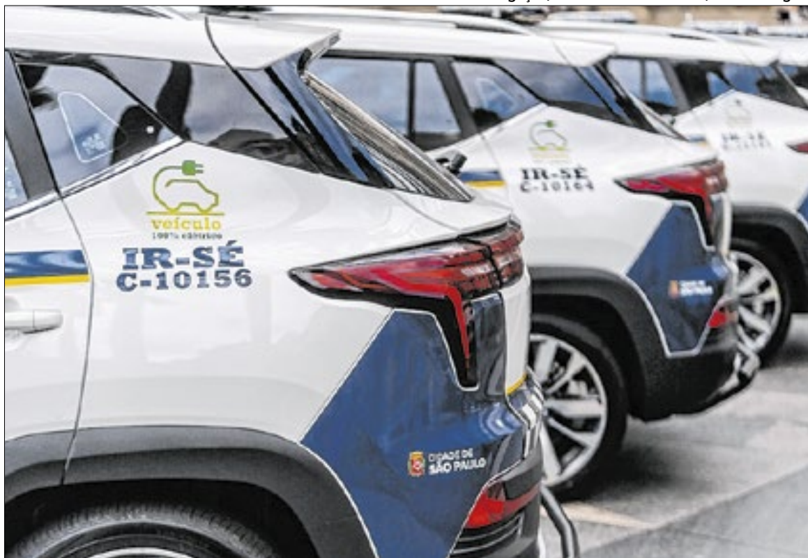
Viaturas elétricas da Guarda Civil Municipal, que poderia se chamar Polícia Municipal

No mesmo ato, a prefeitura criou a Inspetoria de Ações Táticas Especiais (Iate), que substitui