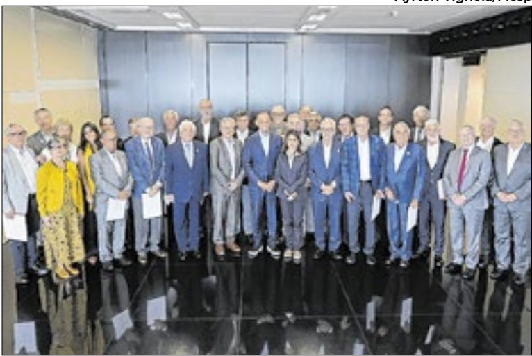
Representantes da Fiesp e da Secretaria de Estado da Saúde

A Secretaria de Estado da Saúde é responsável pela aquisição, armazenamento e distribuição de medicamentos fornecidos tanto pelo Ministério da Saúde quanto pelo governo estadual. Também administra programas específicos voltados ao financia-