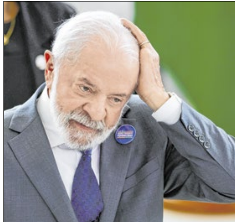
Lula diz que seu filho “vai pagar o preço”, se estiver envolvido

A ideia é iniciar campanha de assinaturas depois do carnaval. A segunda proposta é mudar o sistema de votação proporcional. O MCCE propõe uma votação em dois turnos. Primeiro, o eleitor votaria no deputado de sua preferência. E assim seria formada a lista. No segundo turno, ele voltaria para votar nos nomes da lista.