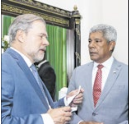
Nos bastidores da solenidade, o governador Jerônimo Rodrigues com o ministro Dias Toffoli