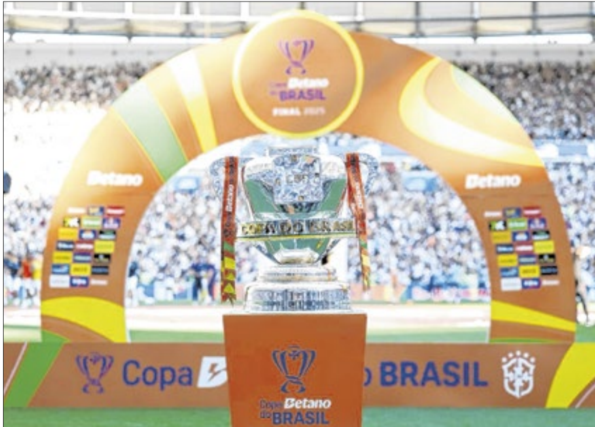
Premiação da Copa do Brasil 2026 será a maior da história do torneio

Os clubes da Série A só entram na quinta fase da Copa do Brasil e tem valor máximo de premiação inferior ao de 2025. No ano passado, a cota máxima era de R$ 101 milhões, caso um time da elite nacional disputasse todas as fases da Copa do Brasil e se sagrasse campeão.