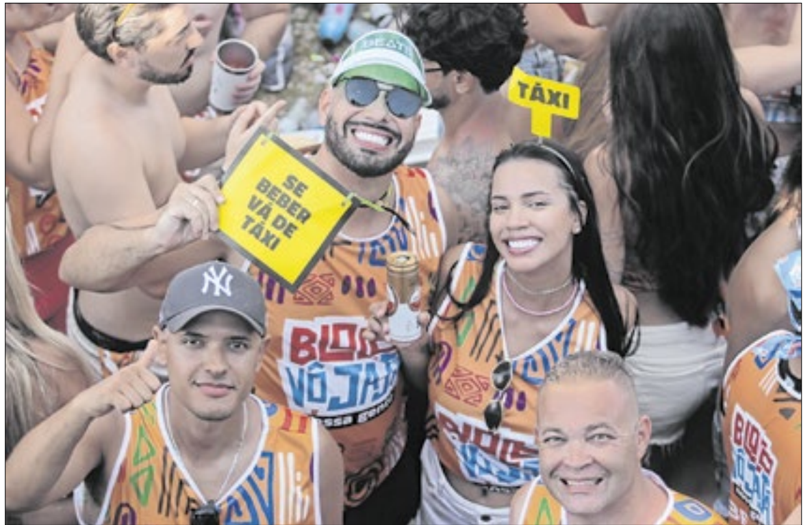
Campinas recebe, no sábado (7) e no domingo (8) o segundo final de semana de pré-Carnaval

Site reúne horários e trajeto em tempo real; blocos estarão por diversas regiões de Campinas