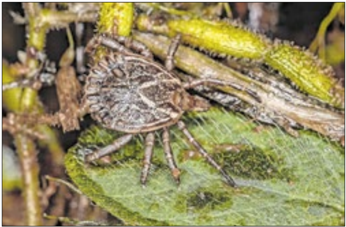
Foi realizada capacitação com médicos e veterinários