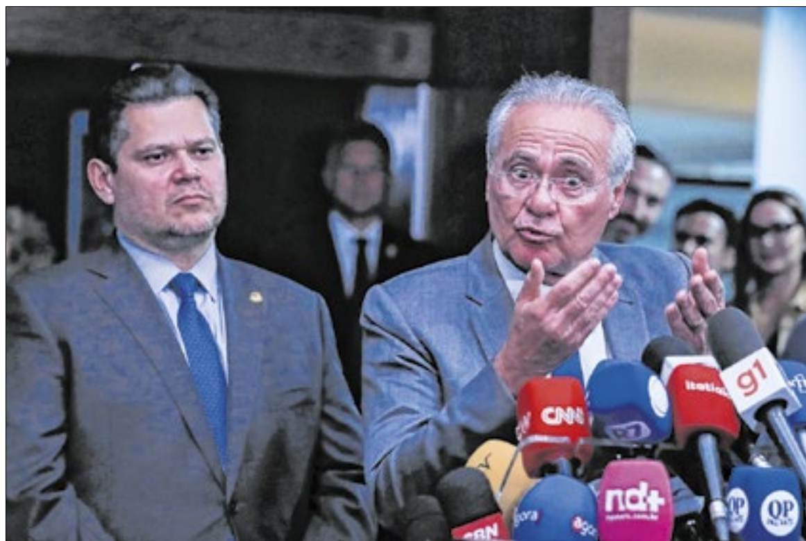
Renan Calheiros diz que irá em busca de explicações

os casos e, quando necessário, encaminha à instituição consignatária envolvida. A Saeb também orienta que denúncias sejam feitas à Ouvidoria Geral do Estado. A pasta, no entanto, não explicou como os contratos puderam ser registrados em larga escala sem consentimento nem esclareceu como dados sensíveis de professores foram utilizados.