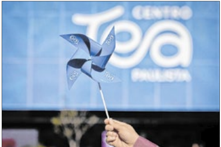
Governo de SP

O Governo vetou apenas o trecho que proibia publicidade antes dos filmes, por entender que o tema é de competência da União, conforme a Constituição