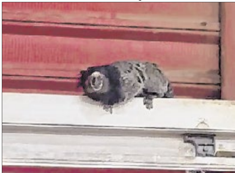
Animal na porta de estabelecimento alimentício

para áreas seguras, além do monitoramento pós-resgate.