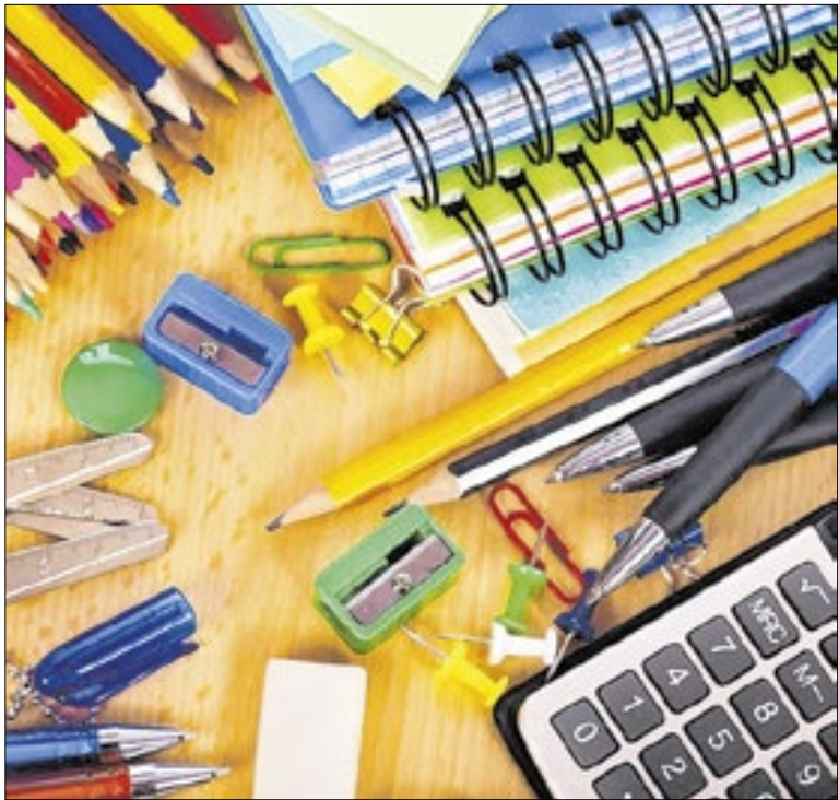
Levantamento do órgão comparou os valores e 12 itens

Outras propostas também entraram em pauta, como o plano “Paulínia Carbono Neutro 2035” e capacitação para profissões do futuro. Também foi sugerido o atendimento odontológico 24 horas e o projeto Escola Segura. Também houve pedidos sobre transporte, estrutura urbana e novos equipamentos de saúde.