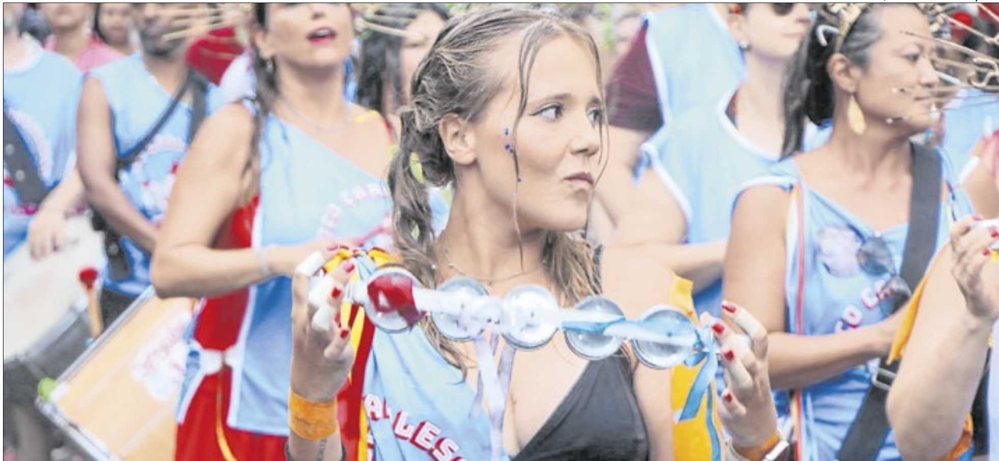
Campinas deve girar entre R$ 16 e R$ 20 milhões; já o Estado de São Paulo pode chegar a R$ 7,3 bilhões