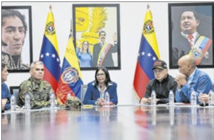
Projeto de anistia está sendo debatido no Parlamento