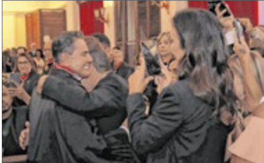
Amiga do novo presidente, a cantora Ivete Sangalo prestigiou a solenidade no Fórum Ruy Barbosa