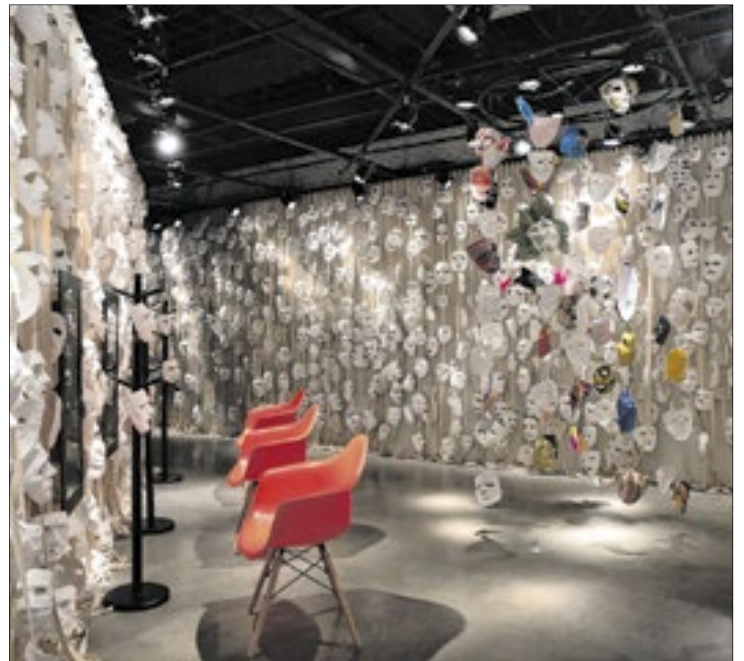
Programação gratuita traz exibição de filme e bate-papo