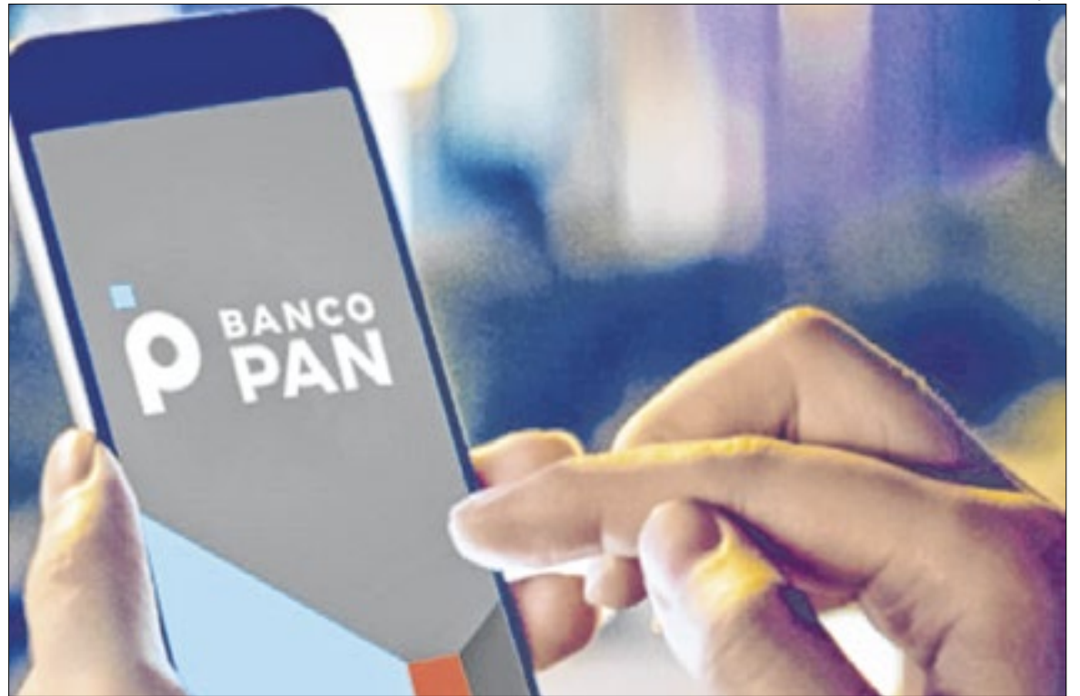
Banco PAN teria fraudado empréstimos consignados em Mato Grosso, segundo investigações

Investigações apontam que 76% dos consignados analisados têm indícios de fraude no Mato Grosso