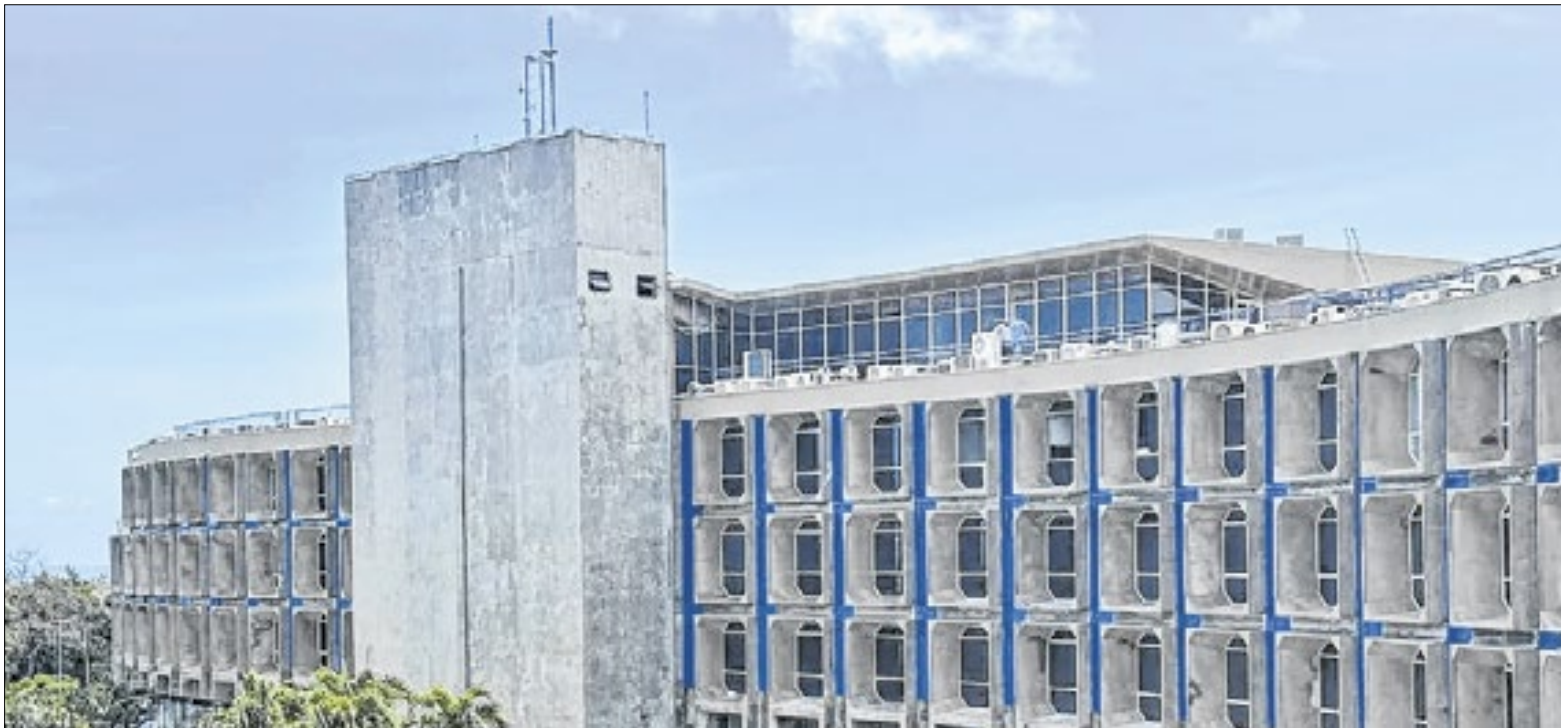
Uma categoria inteira foi lesada e a Secretaria de Administração da Bahia não viu?

Segundo a secretaria, a Coordenação de Consignações analisa