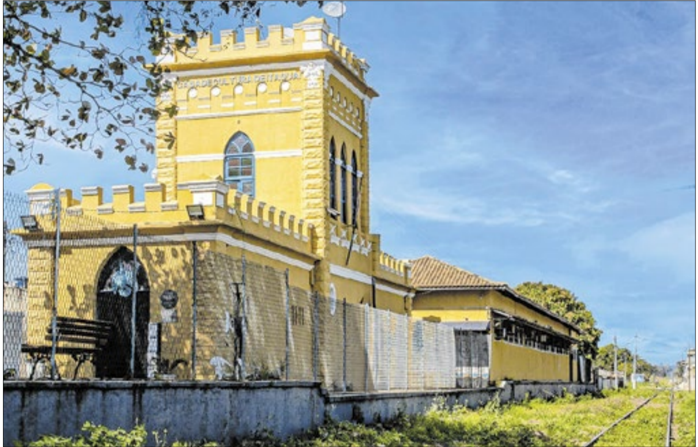
Prédio histórico abriga a sede da Secretaria de Cultura e já funcionou como estação de trem

Além do pagamento do RAS, Itaguaí também será um dos primeiros municípios da região a implantar uma Sala de Oitiva e Atendimento voltada a minorias e pessoas em situação de vulnerabilidade, assegurando acolhimento hu-