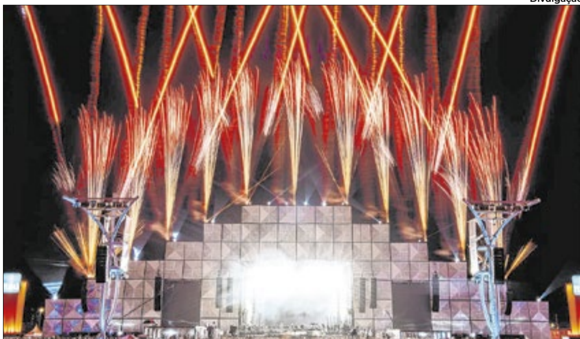
Rock in Rio 2026 acontece entre os dias 4 e 13 de setembro

Entre as novidades, o Palco Mundo contará com uma cenografia inédita e, pela primeira vez, toda a estrutura frontal será revestida por 2.400 metros quadrados de painéis de LED de altíssima definição, transformando o espaço em um grande painel visual. Outro destaque é o retorno do espetáculo aéreo The Flight, com manobras acrobáticas sincronizadas, trilha sonora especial e 756 disparos de fogos diurnos. Os fãs que não conseguiram adquirir o Rock in Rio Card terão nova oportunidade na venda oficial programada para 2026, com data a ser anunciada.