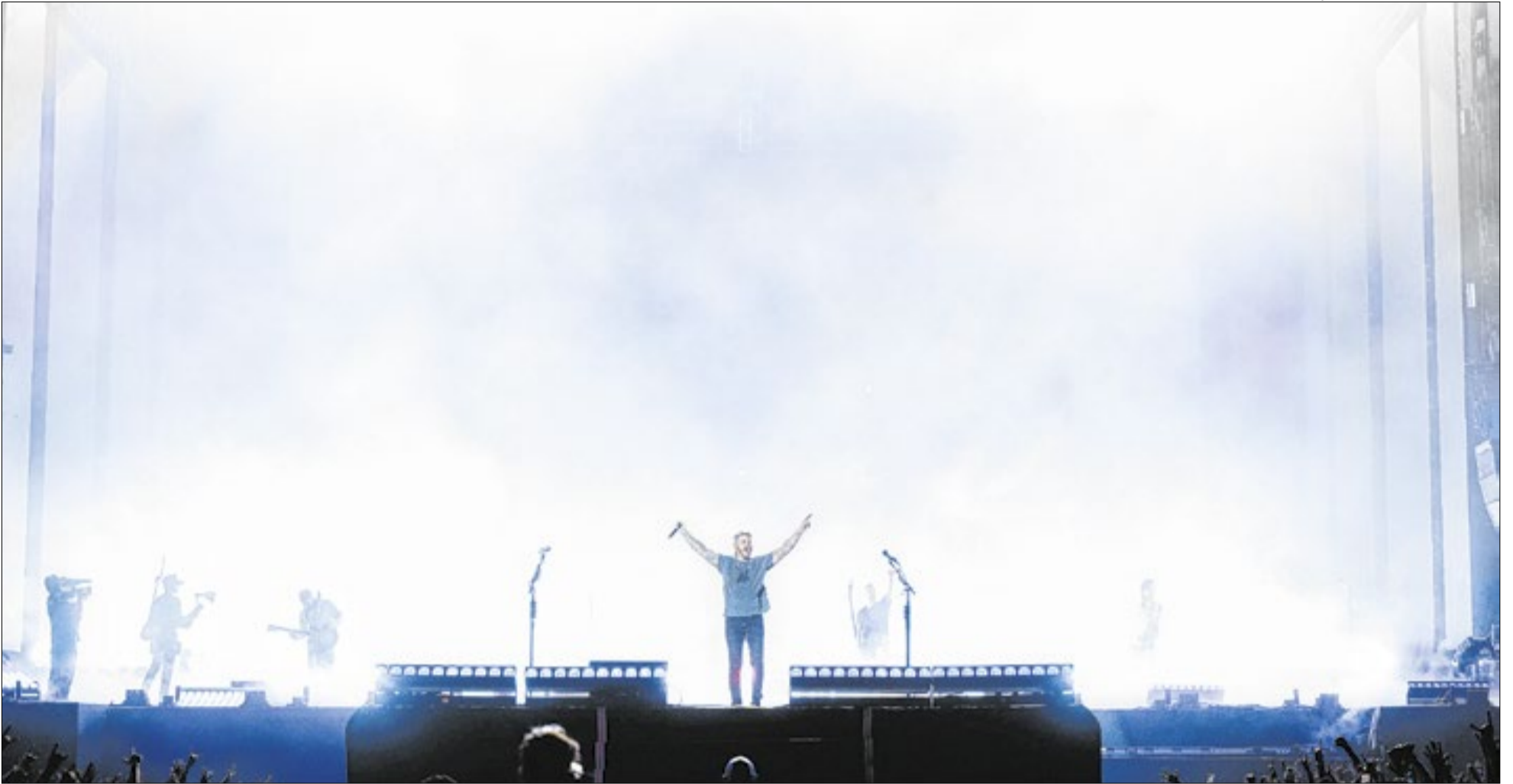
Avenge Sevenfold vai encerrar as apresentações do dia 5 de setembro entregando um momento ainda mais marcante para o público que estará presente

O rock se prepara para mais um capítulo marcante no Rock in Rio. No dia 5 de setembro, o Palco Mundo terá como headliner uma das bandas mais importantes do metal contemporâneo e contará ainda com uma atração de peso em sua estreia no festival. Após protagonizar um show memorável na edição de 2024, o Avenge Sevenfold volta ao evento para encerrar as apresentações do Dia do Rock, prometendo mais um momento de grande impacto para o público. A data também marca a primeira participação do Bring Me The Horizon no Rock in Rio.