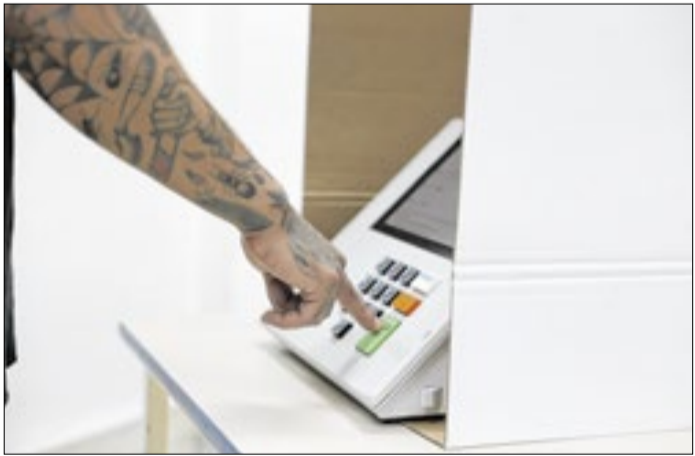
O voto, de fato, na eleição proporcional pouco importa