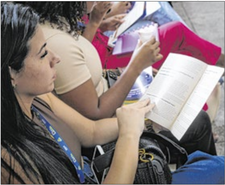
Capacitação foi promovida ao longo desta semana

Em Volta Redonda, moradores que se depararem com casos de maus tratos e mutilação como esse, podem realizar uma denúncia formal por meio do número 156, que é redirecionado à Central de Atendimento Único (CAU). A equipe do Zoo-VR também costuma fazer atendimentos nestes casos.