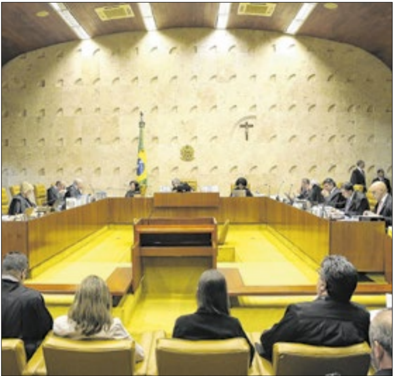
Plenário do STF julgará liminar de Dino no dia 25

Depois de 11 anos, o STF concluiu julgamento que considerou constitucional, por seis votos favoráveis, o artigo do Código Penal que aumenta em um terço a pena para condenados por calúnia, injúria ou difamação contra servidor público. A ação foi iniciada pelo PP, o Progressistas.