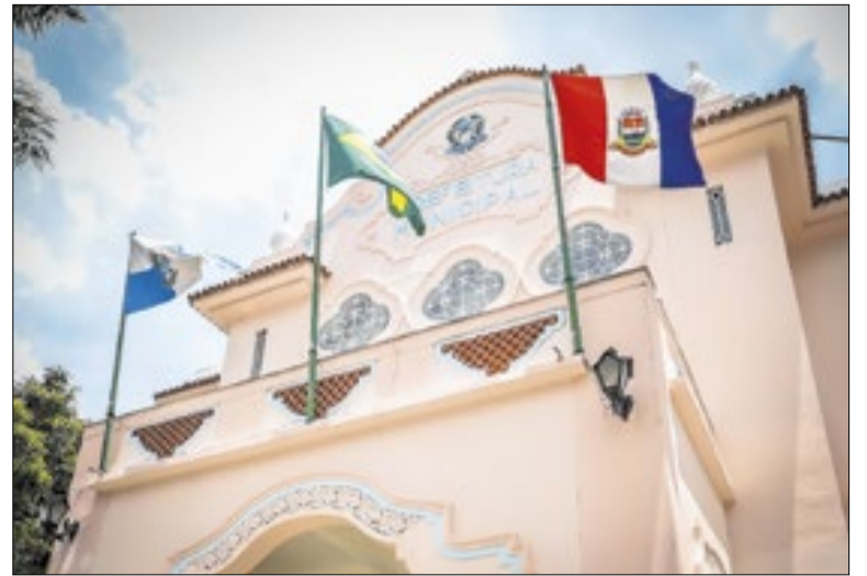
Lei Complementar continua gerando debate no município

As atrações acontecem na Feirinha do Alto (Praça Higino da Silveira), na Praça Olímpica Luís de Camões, na Várzea; na Praça Nilo Peçanha, no Alto, ao lado do Colégio Ginda Bloch; e também no interior, em Bonsucesso, no 3º Distrito. Com shows de artistas locais e desfiles de blocos que prometem colorir.