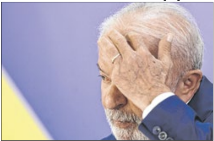
Lula não havia decidido se vetaria projetos