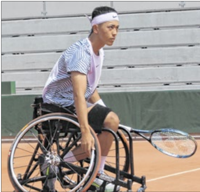
Tenista japonês abrilhantar a Rio Open com sua participação