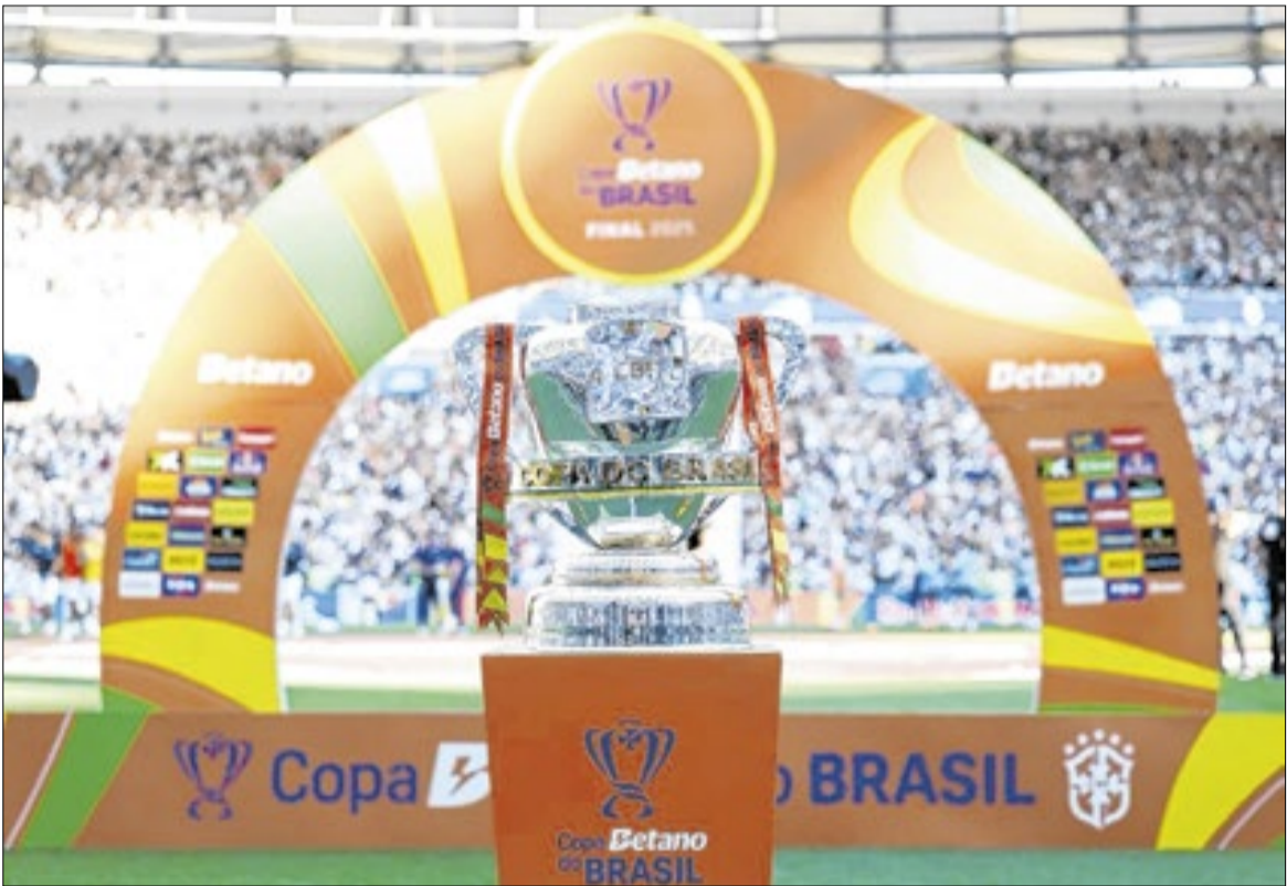
Premiação da Copa do Brasil 2026 será a maior da história do “torneio mais democrático do Brasil”

Com estas mudanças, a CBF tem como objetivo garantir maior representatividade nacional, oferecer mais oportunidades de exposição comercial a patrocinadores, trazer maior impacto econômico e assegurar um produto mais atrativo esportivamente.