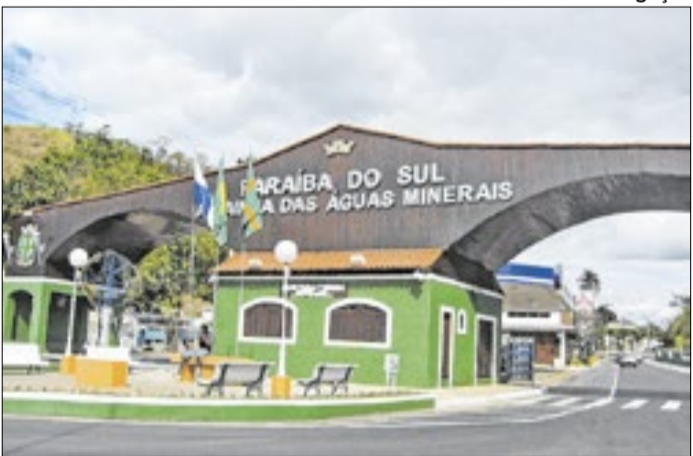
Concessionária foi alvo de CPI em 2025 pelos serviços