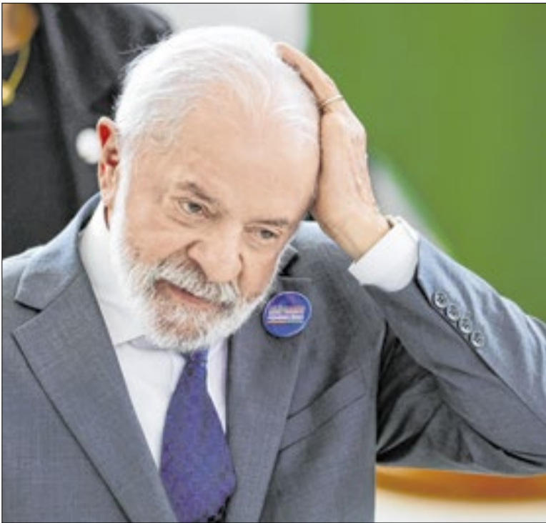
Lula diz que seu filho “vai pagar o preço”, se estiver envolvido