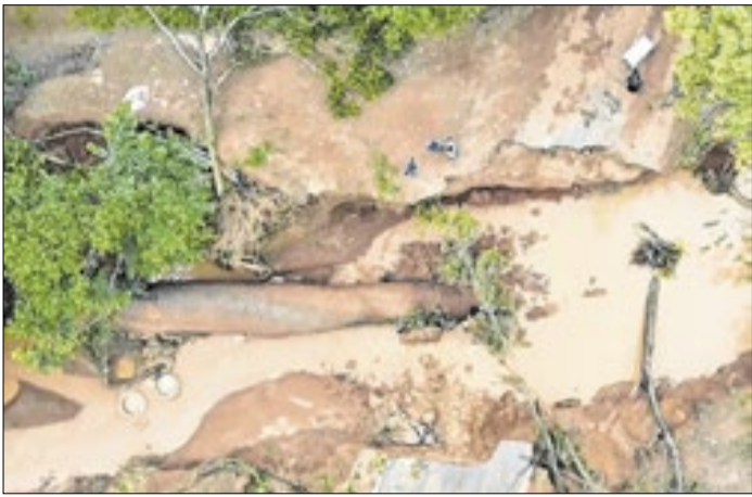
Chuvas interrompem passagem em RJ-176