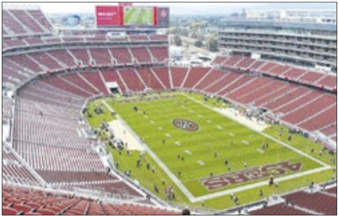
Levi's Stadium vai receber o 60º Super Bowl neste domingo