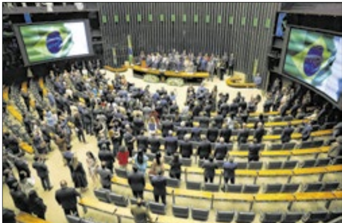
Deputados se importam menos com a opinião pública