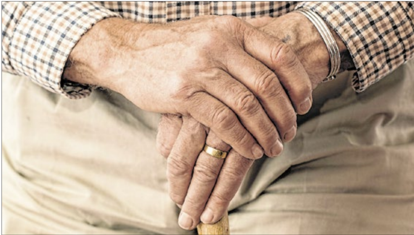
São Paulo tem o maior número de aposentados do país com 5,5 milhões de beneficiários, seguido de Minas Gerais (2,8 milhões)

Dados do Ministério da Previdência Social, mostram que em cerca de 70% dos municípios, o valor repassado pelo INSS supera o que as prefeituras recebem do Fun-