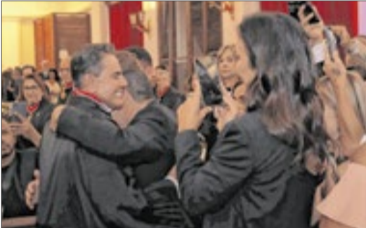
Amiga do novo presidente, a cantora Ivete Sangalo prestigiou a solenidade no Fórum Ruy Barbosa