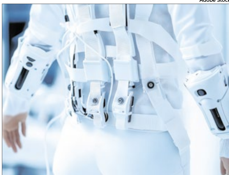
O grande feito do exoesqueleto, segundo os pesquisadores, é a interação entre o córtex cerebral com os neurônios motores

Uso de exoesqueleto melhora fala e desenvolvimento