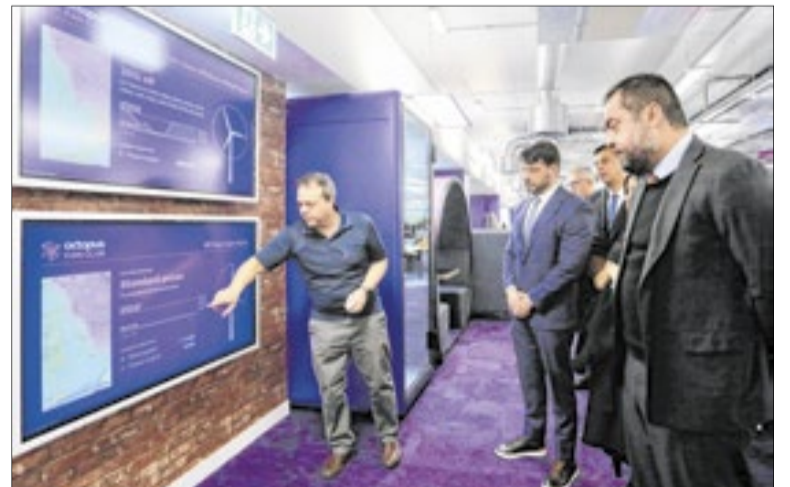
Governador nas instalações da Octopus Energy