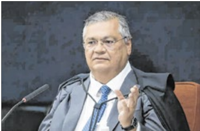
Ministro deu prazo para fim de benefícios