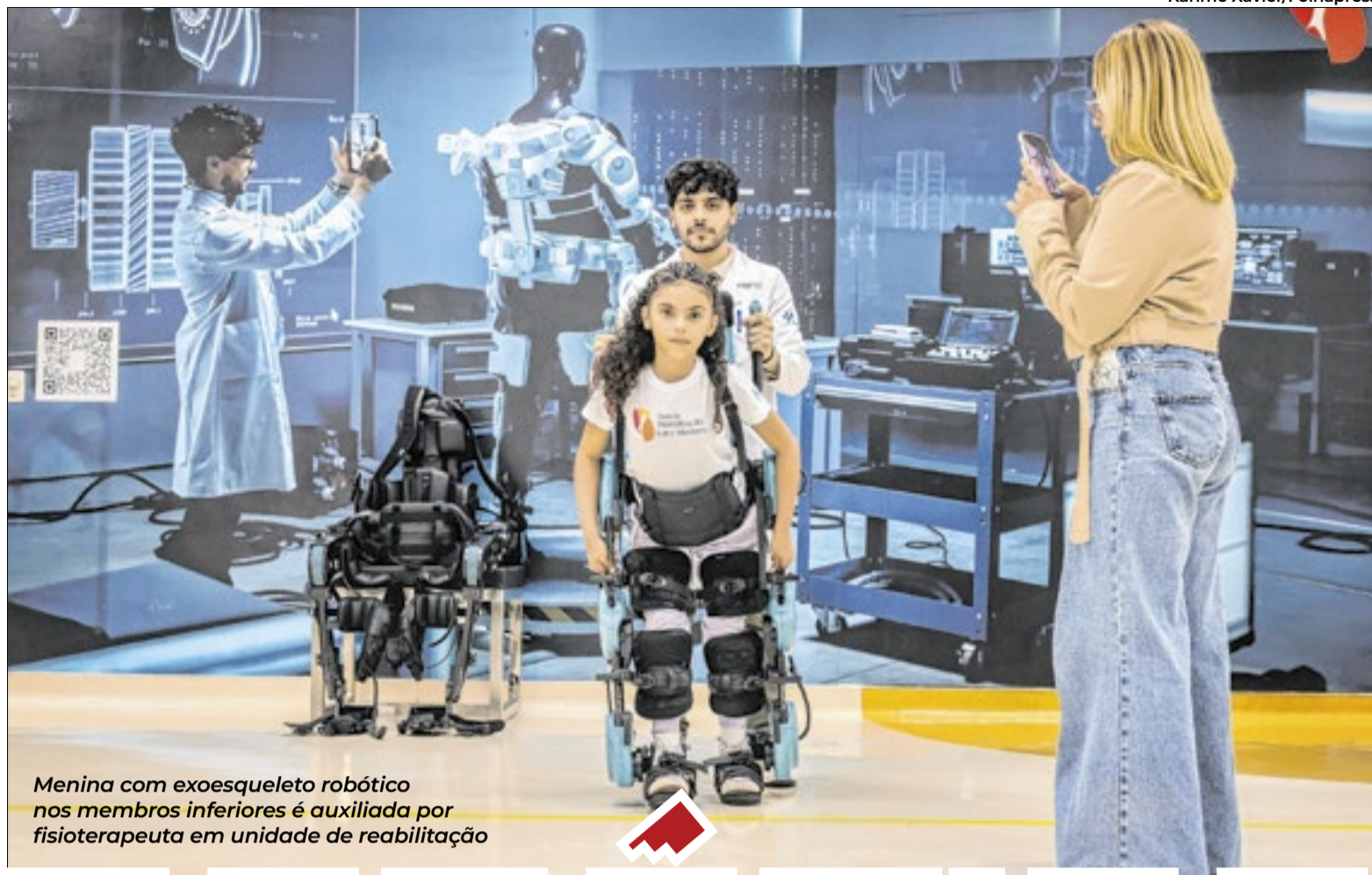
Menina com exoesqueleto robótico nos membros inferiores é auxiliada por fisioterapeuta em unidade de reabilitação

“Ela fica muito ansiosa antes das sessões e feliz depois de usar o robô. A força do chute dela já mudou. Para mim, ver ela em pé