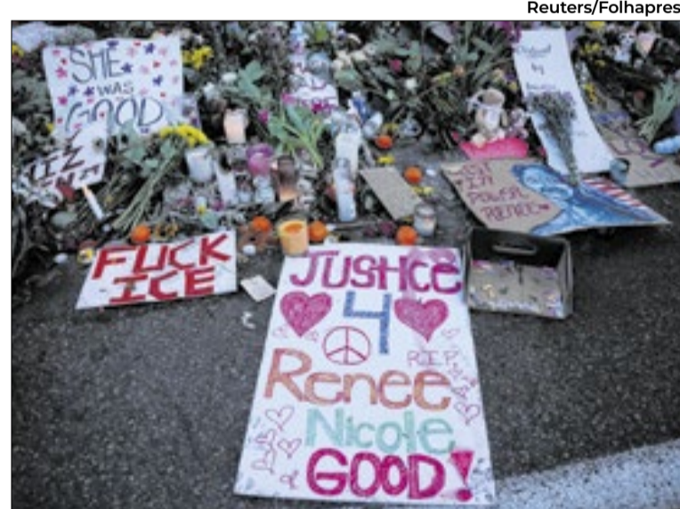
Revolta da população dos EUA contra os assassinatos do ICE está dando resultado

O governo já vinha indicando um recuo nas operações de imigração desde a morte de Pretti, no final de janeiro. Inicialmente, a gestão o classificou de “terrorista doméstico” que “queria massacrar” agentes federais, apesar de evidências em vídeo e