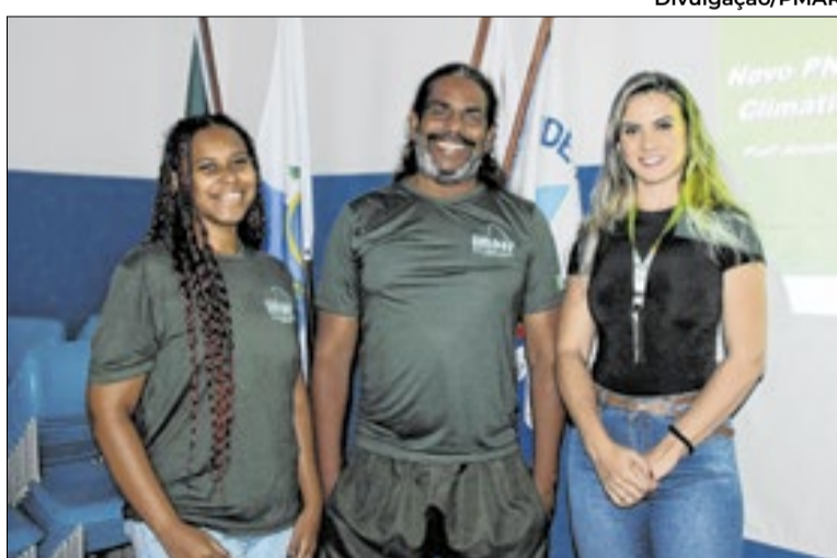
Ação integra as metas do Programa de Educação Ambiental

“Essa formação é fundamental para que nossos educadores estejam alinhados às discussões mais atuais sobre meio ambiente. Quando capacitamos nossos professores, ampliamos a capacidade das escolas de formar cidadãos mais conscientes e preparados para enfrentar os desafios ambientais do presente e do futuro”, destacou a superintendente