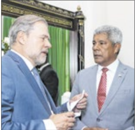
Nos bastidores da solenidade, o governador Jerônimo Rodrigues com o ministro Dias Toffoli