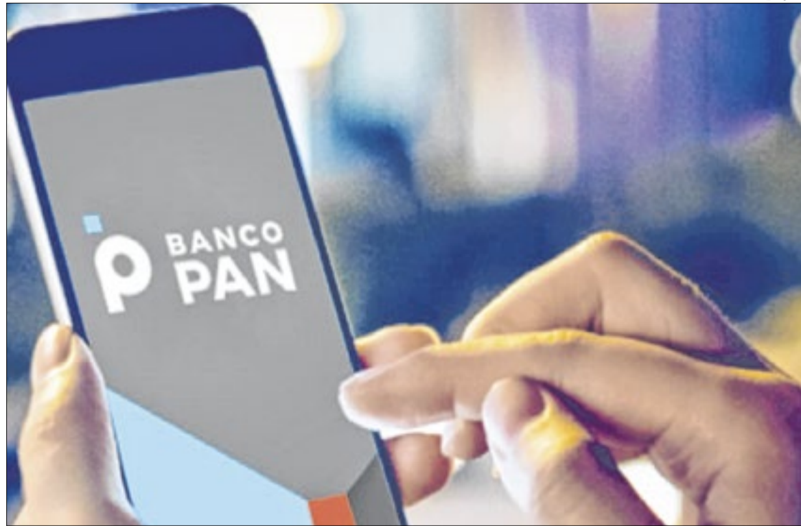
Banco PAN teria fraudado empréstimos consignados em Mato Grosso, segundo investigações

Diante das denúncias apresentadas por sindicatos e das evidências coletadas, o governo de Mato Grosso suspendeu os descontos em folha de pagamento de empresas e bancos envolvidos em maio de 2025 – o caso foi denun-