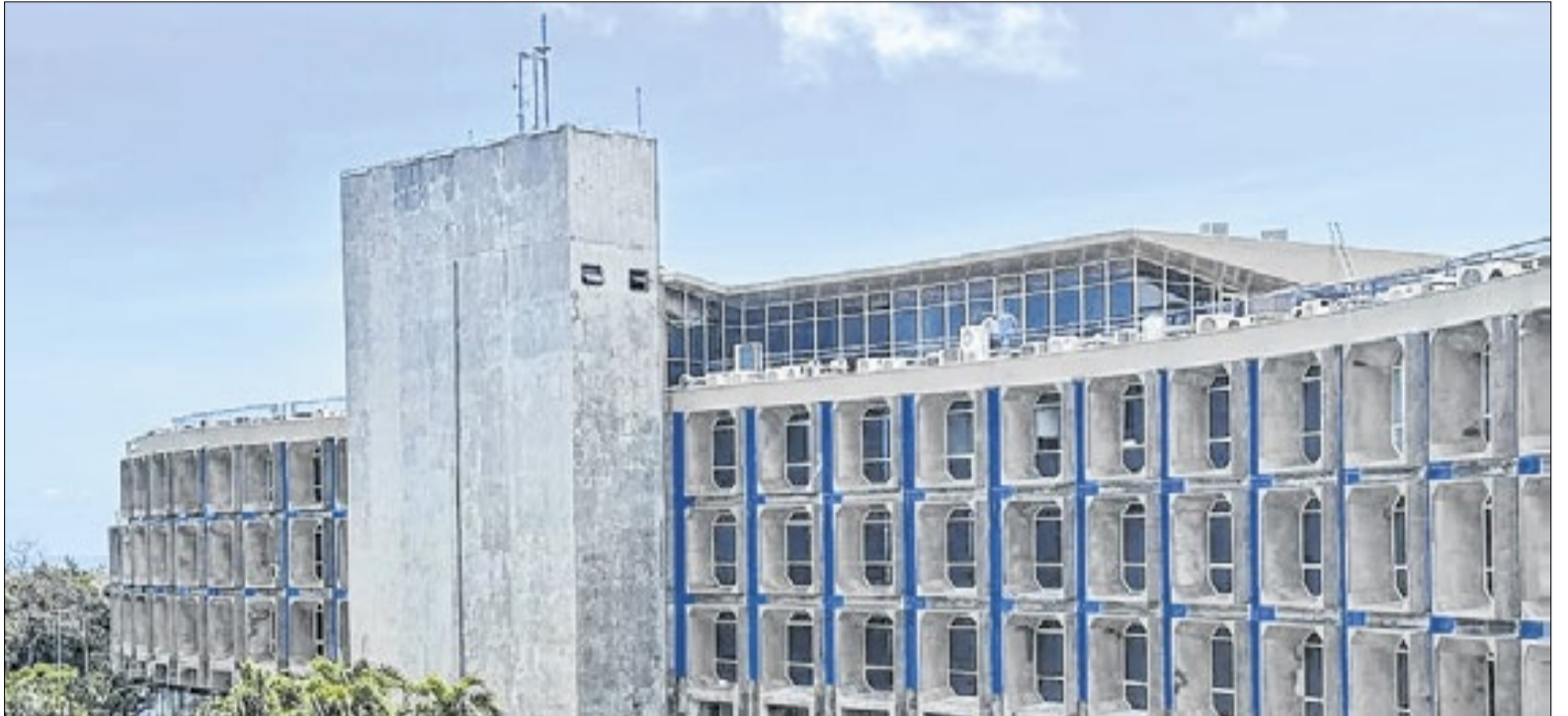
Uma categoria inteira foi lesada e a Secretaria de Administração da Bahia não viu?

Segundo a secretaria, a Coordenação de Consignações analisa