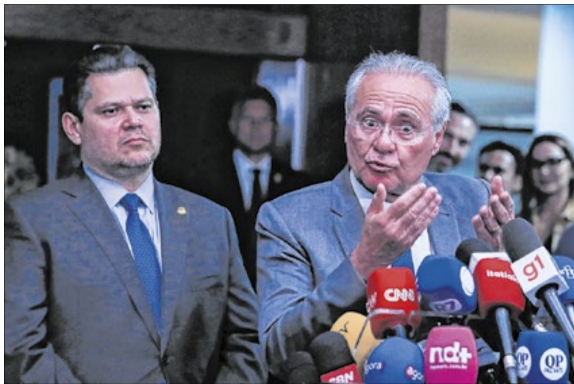
Renan Calheiros diz que irá em busca de explicações

os casos e, quando necessário, encaminha à instituição consignatária envolvida. A Saeb também orienta que denúncias sejam feitas à Ouvidoria Geral do Estado. A pasta, no entanto, não explicou como os contratos puderam ser registrados em larga escala sem consentimento nem esclareceu como dados sensíveis de professores foram utilizados.