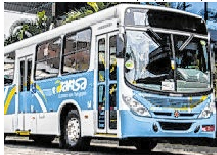
Empresa pede por união para tratar da reformulação do transporte