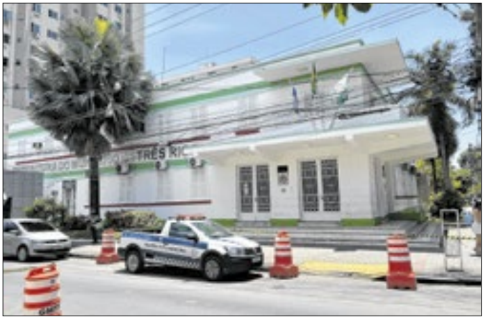
Para acessar o carnê, o contribuinte deve entrar no site