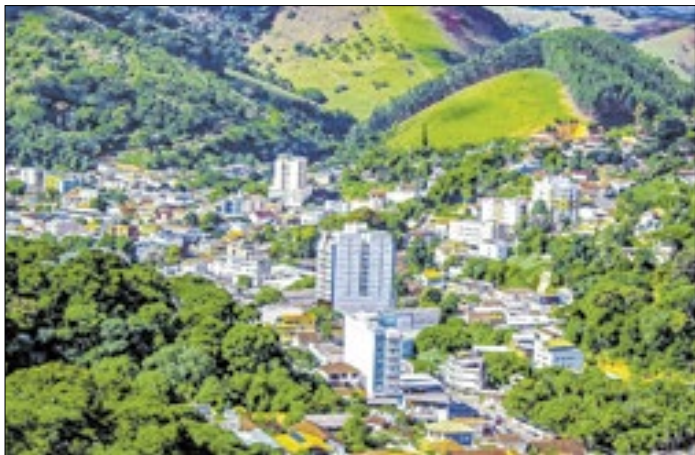
Prefeitura vai demonstrar avaliações das metas de 2025