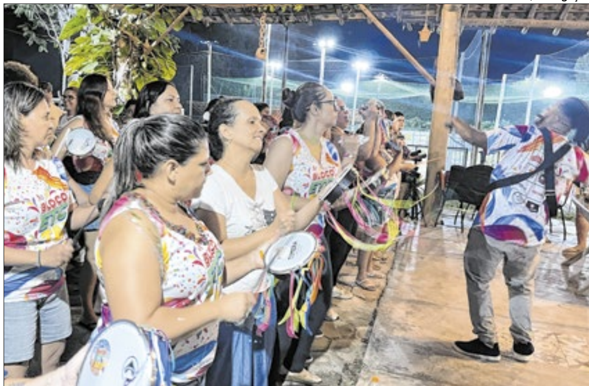
O material reúne informações práticas para curtir a folia com mais segurança

Material reúne dicas práticas de prevenção, acesso aos serviços públicos e cuidados