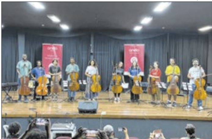
Entidade já beneficiou mais de 15 mil alunos