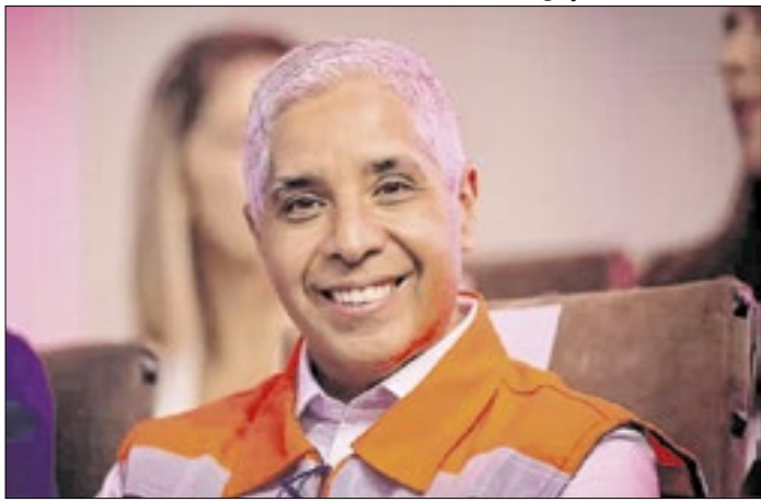
Henguel vai suceder o coronel Paulo Maculevicius