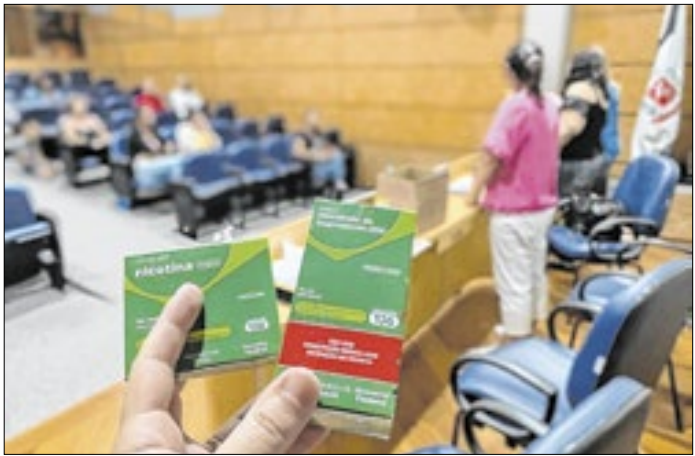
Programa começa no dia 24 de fevereiro, a partir das 14h