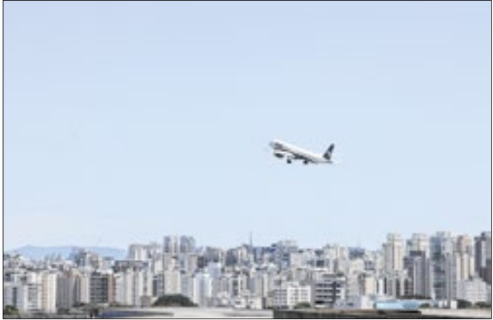
Passagens aéreas impactaram o resultado