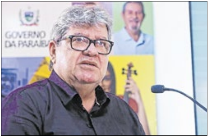
João Azevêdo assinou a portaria com o aumento

O modelo de seleção é voltado especificamente à contratação temporária. Os profissionais são admitidos por até um ano, com possibilidade de prorrogação por igual período, para suprir ausências de servidores efetivos em situações como licença médica, licença-maternidade, licença-prêmio e licença por interesse particular, entre outras. O processo ocorre após a aprovação de um projeto que tratava da prorrogação dos contratos.