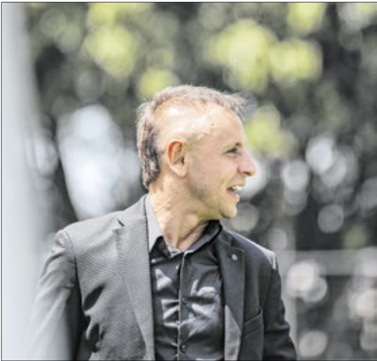
Contratação de Rafinha ajudou no emocional do time

A CBF negou o pedido do Mirassol pelo adiamento do jogo contra o Remo, no Mangueirão. O jogo foi mantido para esta quarta (4) às 20h. O pedido do Mirassol se deu porque o jogo contra o Novorizontino, no Paulista, foi interrompido ao fim do primeiro tempo no domingo, por conta da chuva, e foi concluído na segunda (1º).