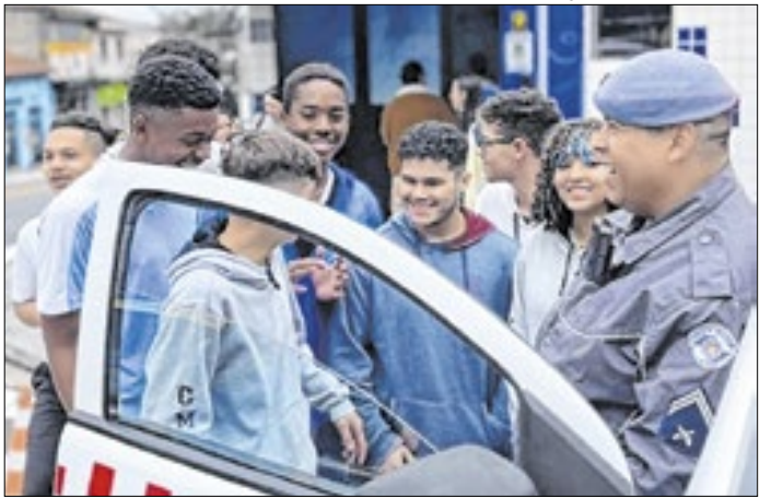
Ronda Escolar também integra ações educativas