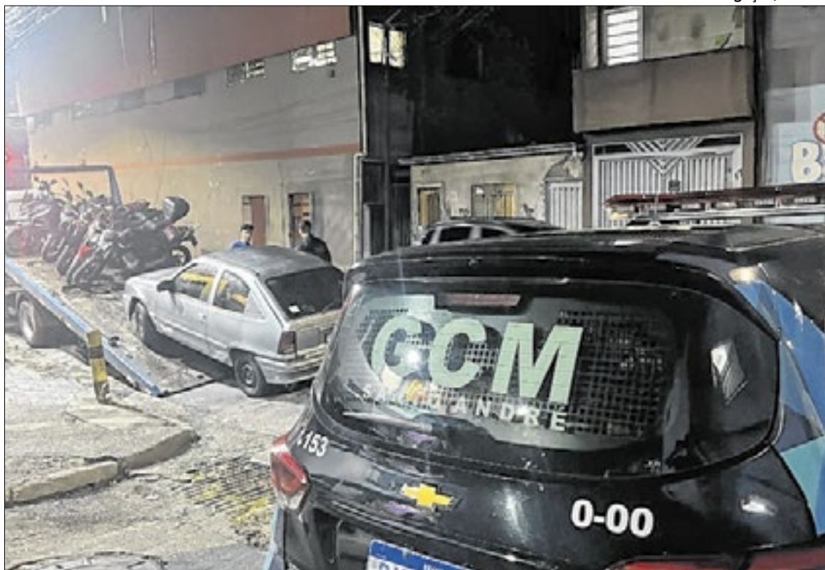
Semasa e Guarda Civil Municipal durante a fiscalização da Operação Sono Tranquilo

Criada em 2017, a Operação Sono Tranquilo é conduzida pelo Serviço Municipal de Saneamento Ambiental de Santo André (Semasa) e