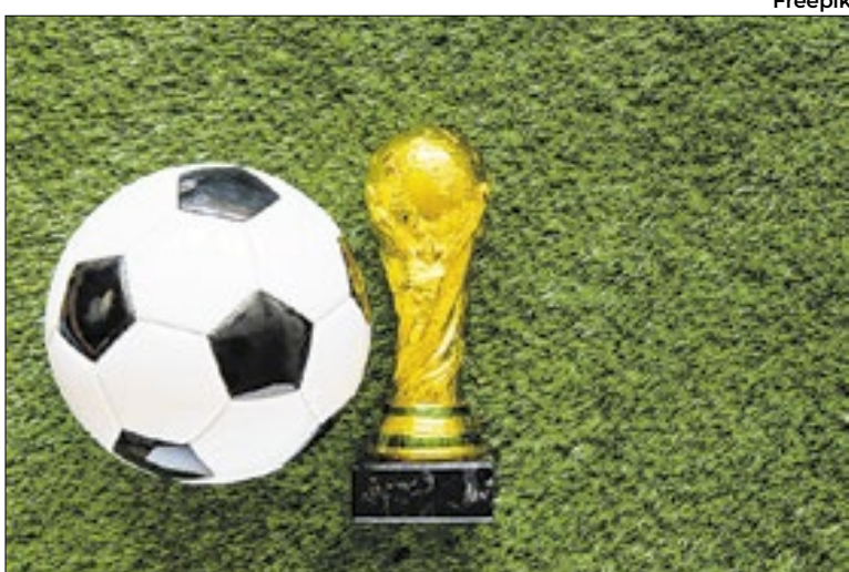
Comércio investe em ações promocionais e decoração

Entre as práticas vedadas estão o uso do nome oficial do evento, de expressões associadas à competição, de hashtags institucionais, bem como de emblemas, mascotes, slogans e da imagem do troféu. Também é proibida a chamada publicidade de emboscada, caracterizada por tentativas de associação indireta ao torneio por meio de