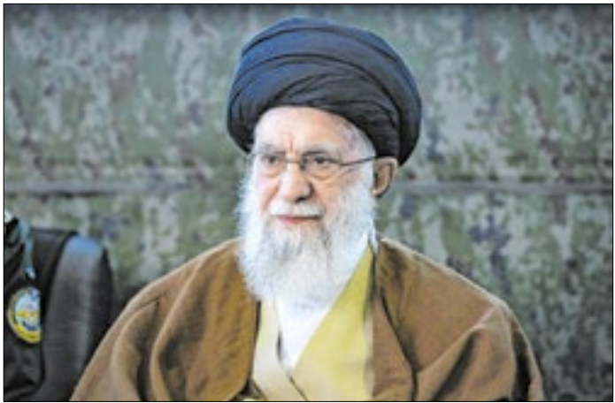
Aiatolá Ali Khamenei rechaçou os blefes públicos de Trump