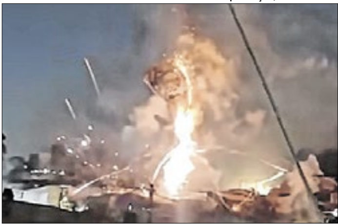
Ninguém houve feridos nem registro de danos graves