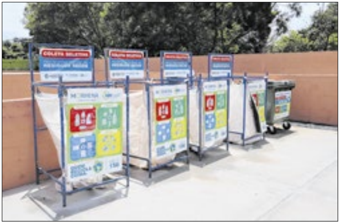
Mudanças incluem aumento do limite de descarte