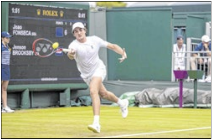
João Fonseca caiu para a 34ª posição do ranking da ATP