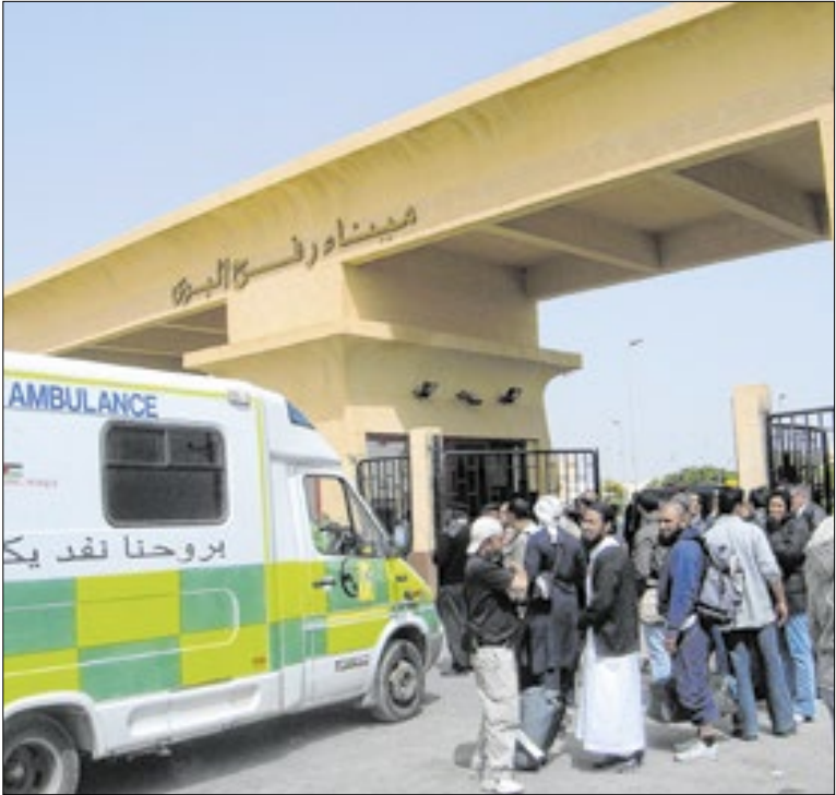
Ashraf El-Anani via Wikimedia Commons

De acordo com o republicano, o primeiro-ministro indiano, Narendra Modi, também se comprometeu a comprar mais de US$ 500 bilhões em produtos de energia, tecnologia, agrícolas e outros dos Estados Unidos, que terão à disposição um mercado com praticamente 1.5 bilhão de consumidores.