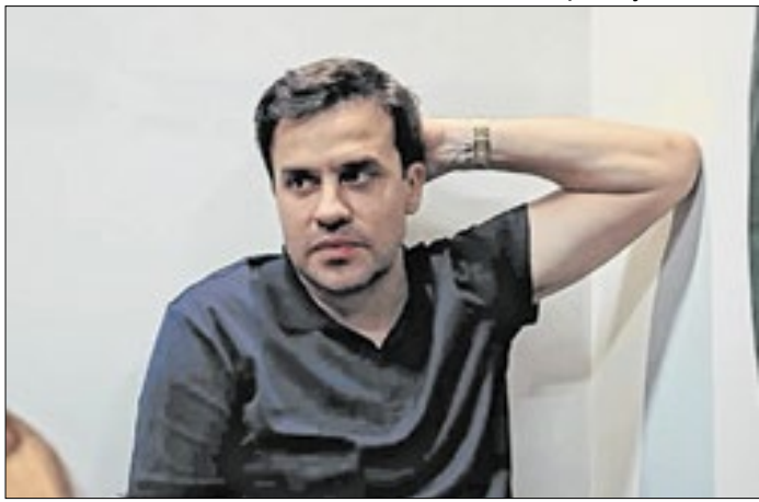
Processo analisou disputa pela Prefeitura de São Paulo