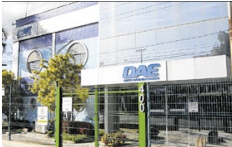
Interligação de adutora poderá atingir até 18 bairros

A intervenção ocorrerá no centro de reservação e distribui-