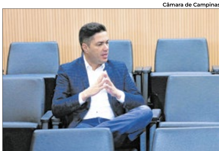
Corregedoria conclui investigação contra parlamentar do PL