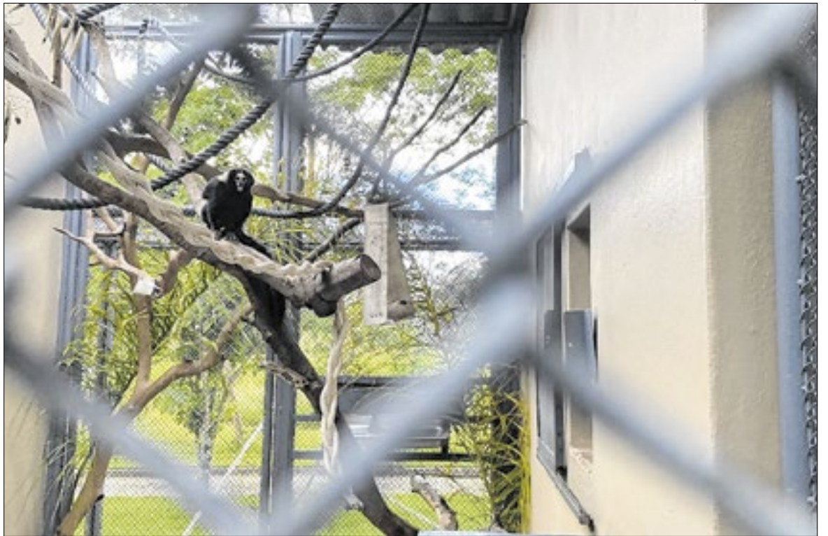
Mila, uma fêmea de sagui-da-serra-escuro ( Callithrix aurita ), de 2 anos, nascida no Cecfau

Fêmea é transferida para o Parque de Sapucaia do Sul com objetivo de formar novo par reprodutivo