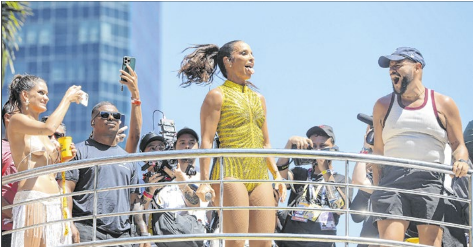
Em momento inédito e que promete ser histórico para os paulistanos, Ivete levará energia do axé ao pré-carnaval de SP