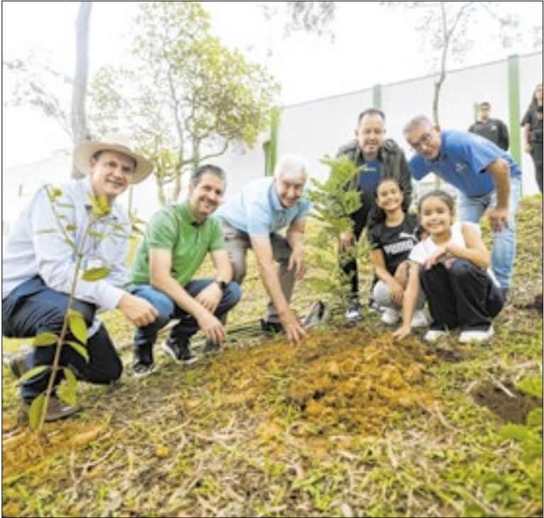
Prefeitura de Valinhos

A Prefeitura de Jaguariúna regulamentou o uso do Teatro Municipal Dona Zenaide para atividades culturais e educativas. O decreto define prazos para solicitação, critérios de aprovação, valores diferenciados, isenções para grupos locais e regras de uso. Recursos arrecadados vão para o Fundo Municipal de Cultura.