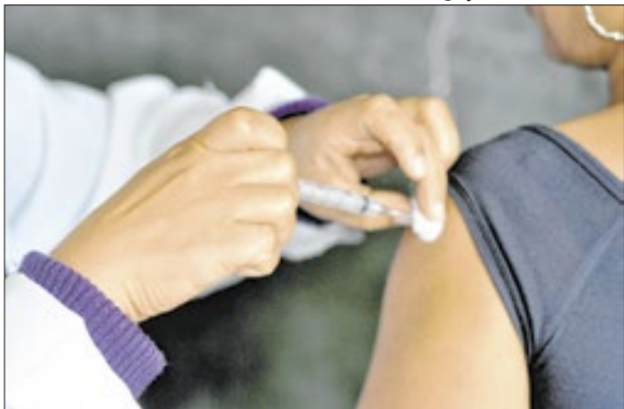
Aplicação contempla moradores de 18 a 59 anos