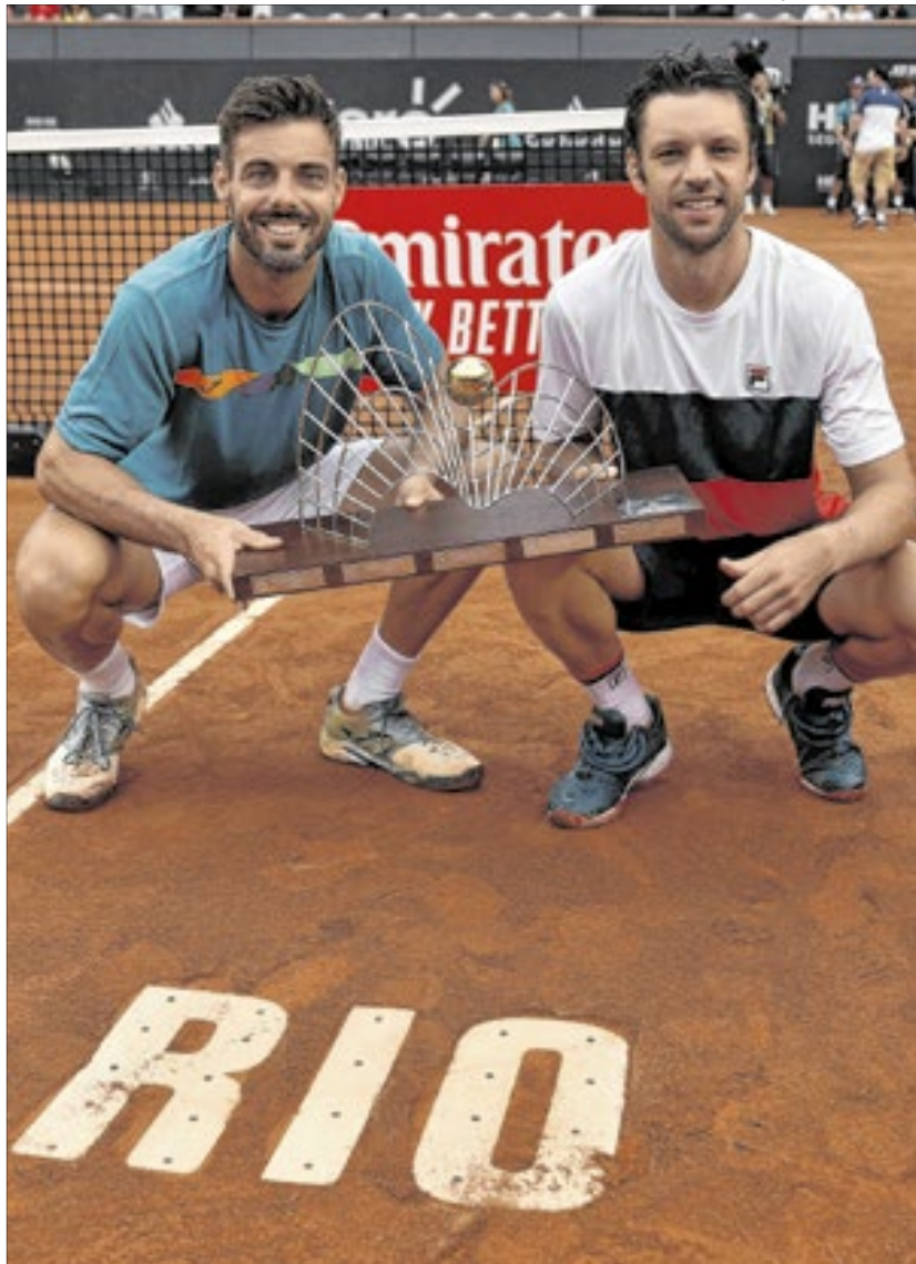
Os veteranos Marcel Granollers e Horacio Zeballos buscam novo título no torneio brasileiro

ao torneio para buscar o bicampeonato, além da lista contar com nomes como os franceses Sadio Doumbia e Fabien Reboul, dupla campeã em cinco torneios ATP, e simplistas que também estarão em ação na competição por times, como Cerundolo/Comesana e Darderi/Etcheverry.