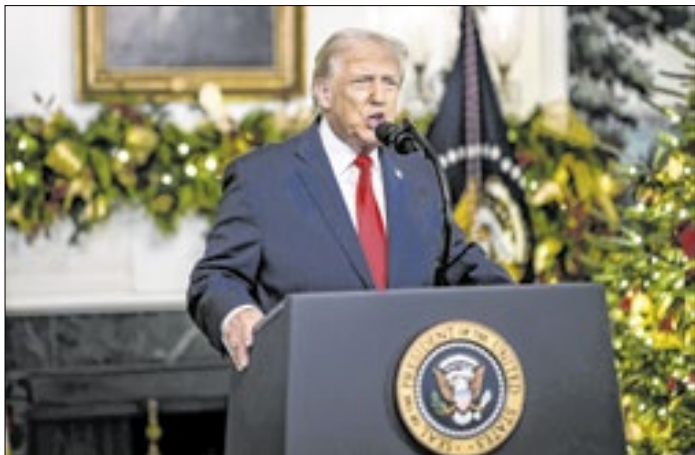
Casa Branca Na última semana, Trump deu um “ultimato” ao Irã