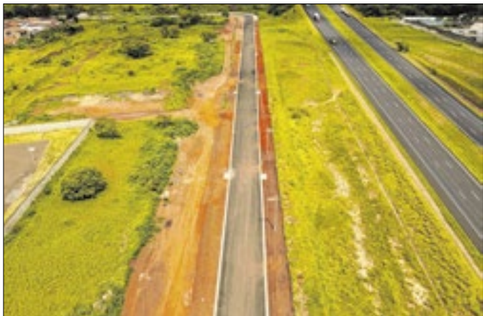
Nova via liga Jardim Amanda ao conjunto habitacional