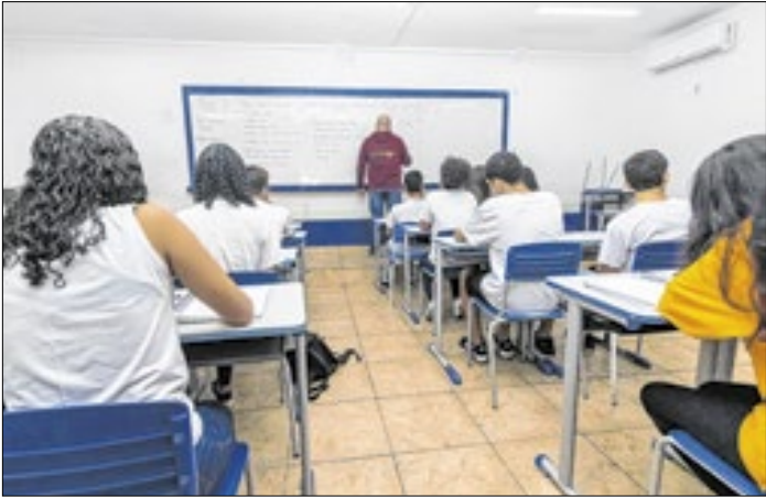
Seleção de professores para contratação temporária