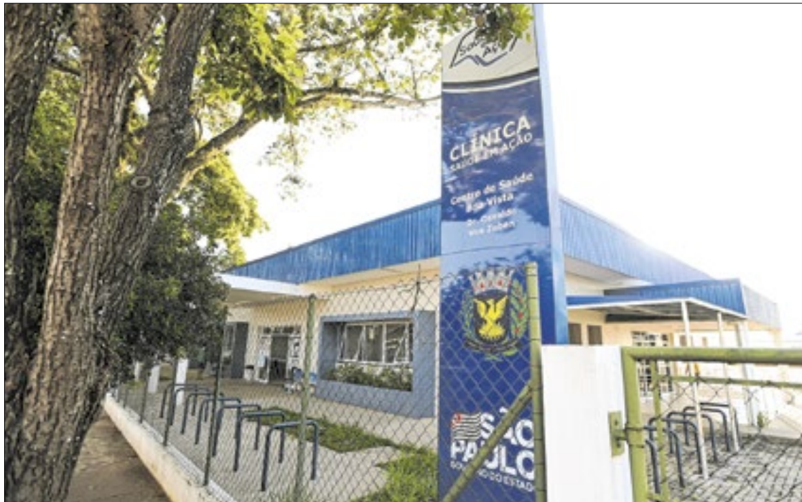
Fachada do Centro de Saúde Boa Vista, em Campinas

No requerimento encaminhado ao Executivo, o vereador destaca que a própria Secretaria Municipal de Saúde reconheceu impactos na distribuição durante a transição logística entre o antigo e o novo almoxarifado. “Cabe ao Legislativo exercer seu papel fiscalizador sempre que houver indícios de prejuízo direto à po-