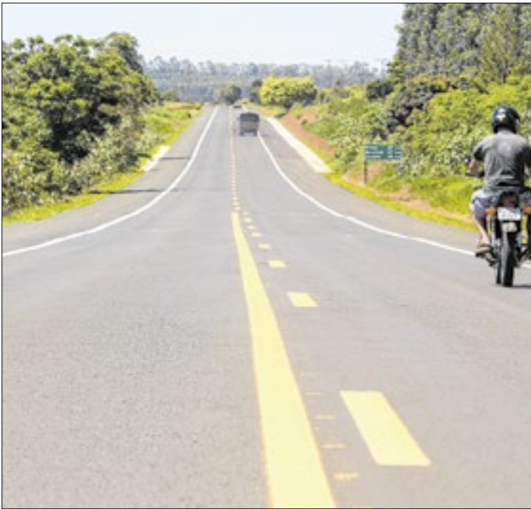
Ação reforça a Raposo Tavares como rota estratégica

Em decorrência das chuvas registradas no domingo (1º de fevereiro), o Fussta (Fundo Social de Solidariedade de Taubaté) está mobilizando a arrecadação de doações para atender famílias que foram diretamente afetadas. A prioridade é a coleta de itens essenciais para garantir condições mínimas de higiene, alimentação e estrutura básica.