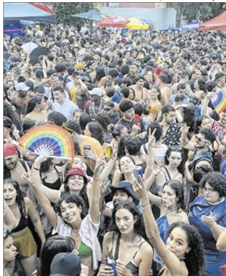
Campinas recebe segundo final de semana de pré-Carnaval