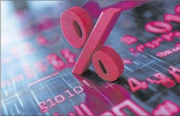
Taxa básica de juros varia conforme a economia