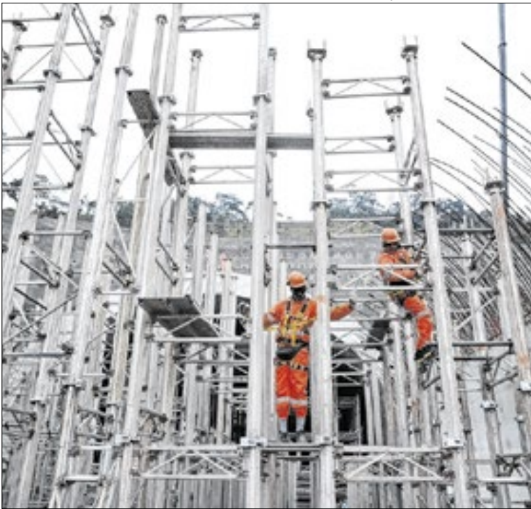
Sector de Construção gerou 23,6 mil vagas no ano passado

A Seduc-SP divulgou a 3ª chamada do Provão Paulista Seriado. As vagas são para USP, Unesp, Unicamp e Fatecs. Os aprovados devem consultar o resultado no portal do Provão e realizar a matrícula nesta semana, conforme os prazos de cada instituição. Esta é a última chamada unificada do programa em 2026.