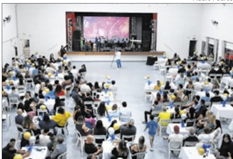
Cerimônia de posse dos novos diretores e vice-diretores

O processo eletivo, previsto no Estatuto do Magistério, definiu 46 diretores e 82 vice-diretores para as 56 unidades de Educação Infantil e Ensino Fundamental I da cidade. Algumas escolas possuem mais de um vice, totalizando 128 gestores empossados. A eleição começou em agosto, com inscrições e participação em curso de gestão, que contou com cerca de 300 inscritos. Os candidatos apresentaram planos de trabalho alinhados às diretrizes da Secretaria de Educação, avaliados por uma comissão de 30 membros, formada por professores, diretores,