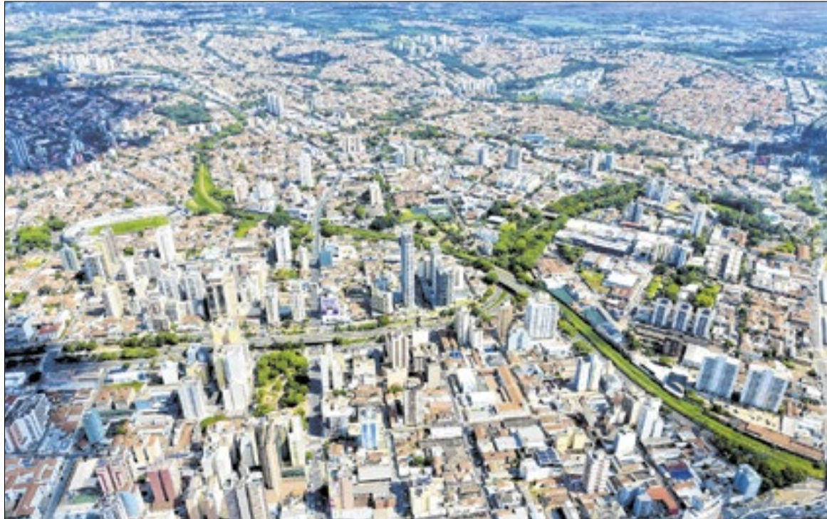
Campinas aparece na 10ª colocação, com uma arrecadação de R$ 26 bilhões em 2024