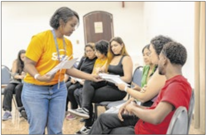
Aulas acontecem em 10 unidades no Grande Rio