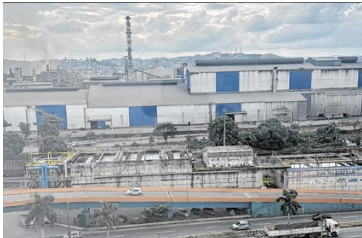
CSN tem vagas para as unidades de Volta Redonda e de Porto Real, sul do Estado do Rio

O Governo do Estado está divulgando, esta semana, 2.552 oportunidades de emprego formal, estágio e jovem aprendiz