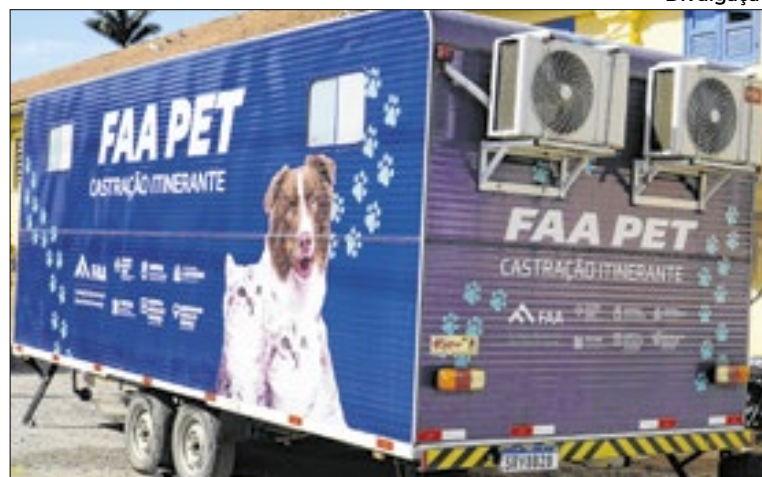
Equipe conta com oito profissionais, entre eles sete médicos

Até o momento, o projeto já passou por Barra Mansa, Barra do