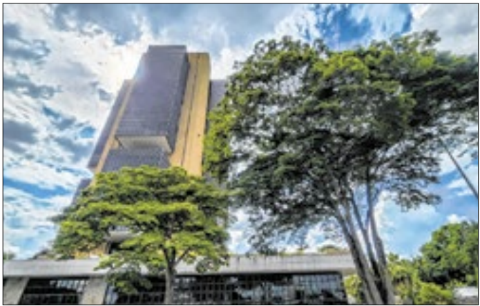
Onde estava o Banco Central e o controle?