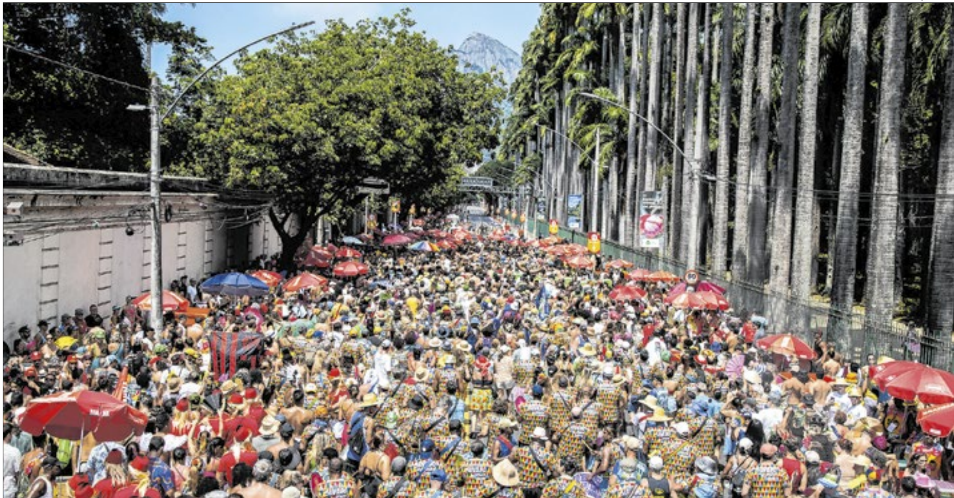
Suvaco do Cristo se despede do carnaval carioca realizando a sua 40ª e última apresentação no Jardim Botânico

O Carnaval de Rua do Rio de Janeiro segue a todo vapor e, de sexta-feira (6) a domingo (8), milhares de foliões vão se divertir em diversos pontos da cidade, com uma programação que passeia por ritmos como funk, samba, marchinhas, frevo, afoxé e música popular brasileira. Do Centro à Zona Sul, passando por Santa Teresa, Ilha de Paquetá e Zona Oeste, blocos tradicionais e contemporâneos ocupam as ruas celebrando a diversidade da maior festa popular do país.