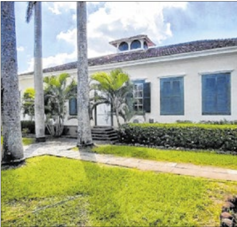
O saldo positivo reforça a efetividade das políticas públicas