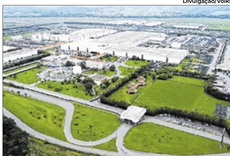
Fábrica da Volks em Resende produz caminhões e ônibus

Outro destaque da marca é sua rede de concessionárias. São mais de 350 pontos de atendimento em três continentes, dos quais 150 deles se concentram no Brasil, para garantir amplo apoio e alta disponibilidade dos veícu-