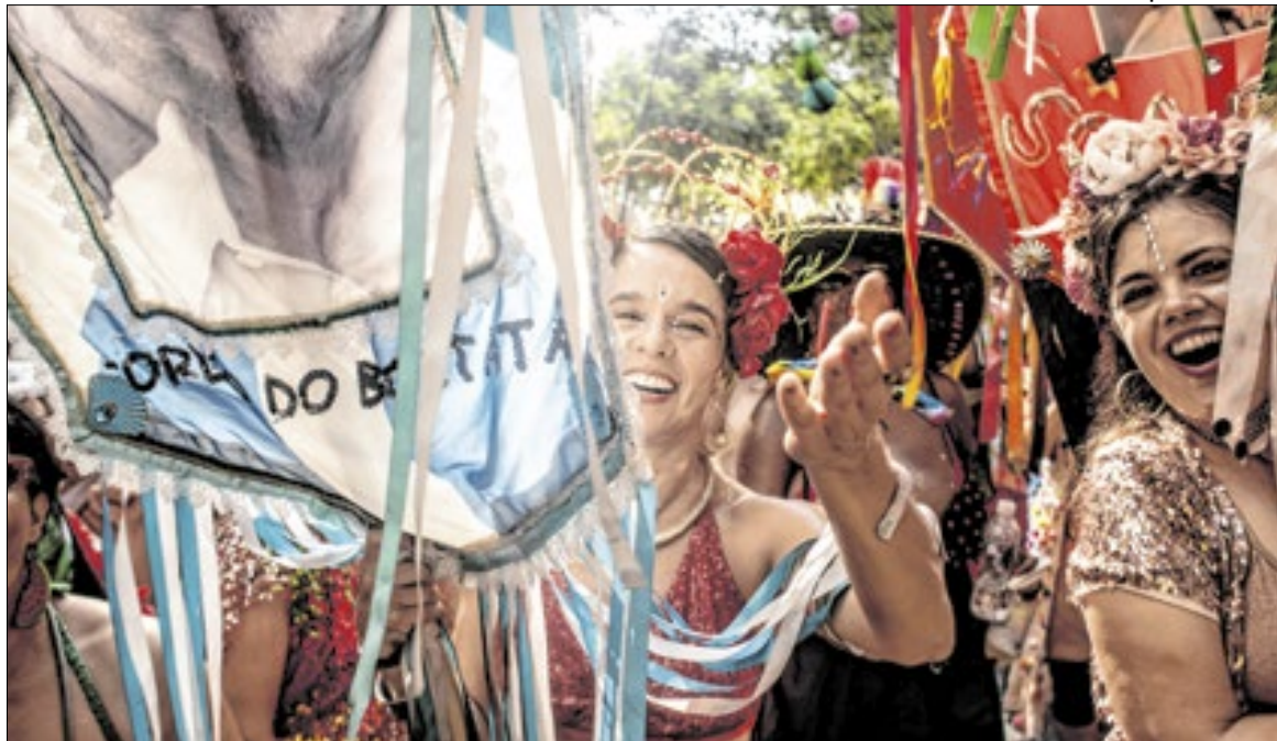
Cordão do Boitatá estreia neste ano o grupo de megablocos da cidade do Rio