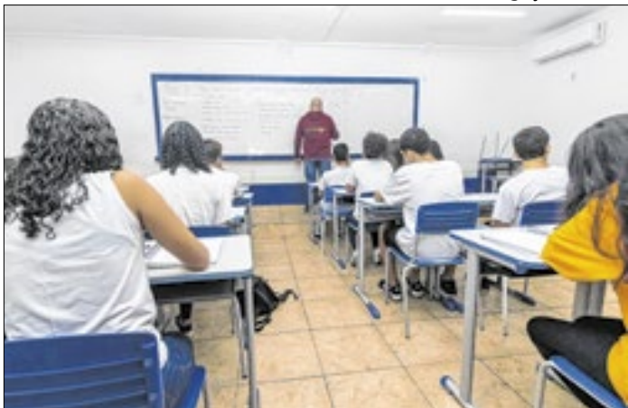
Seleção de professores para contratação temporária