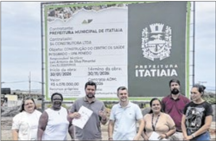
Anúncio foi feito nesta segunda-feira (2)