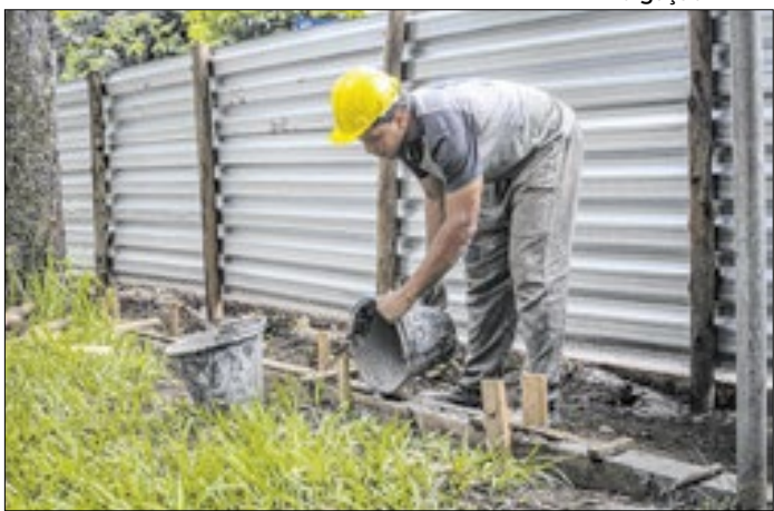
Intervenção tem duração prevista de quatro meses