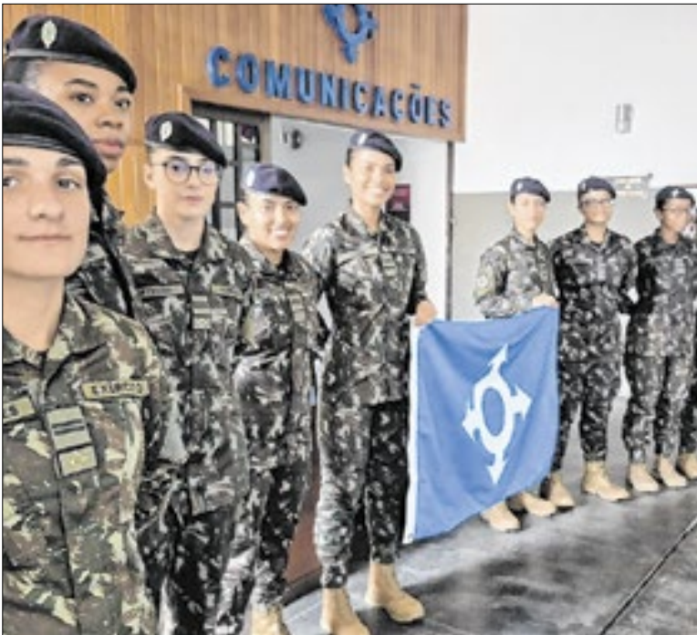
Arma passa a ter formação mista a partir de 2026

A Prefeitura de Itatiaia realizou no sábado (31) mais uma ação de recuperação e manutenção de estradas no bairro Country Club. Os trabalhos ocorreram na Alameda dos Sabiás e também atenderam recentemente as ruas Quero-Quero, Beija-Flor e a Travessa Saracura, melhorando o tráfego e a segurança dos moradores.