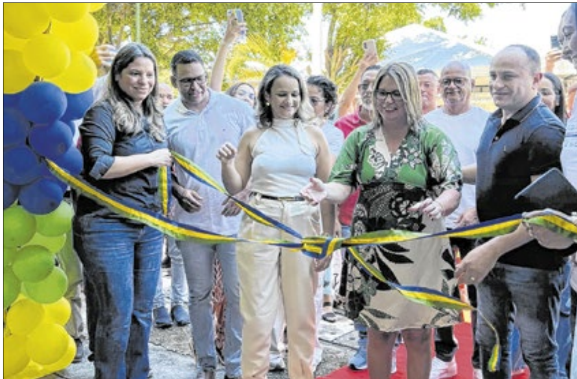
O CIEP 401 enfrentava há anos sérios desafios estruturais, agora superados com a revitalização da unidade

“Quando assumimos, a situação da escola era muito difícil. Hoje entregamos uma unidade moderna, climatizada, acessível e preparada para acolher alunos e