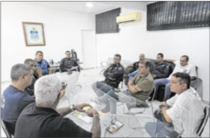
Reunião com secretarias, polícia e guarda