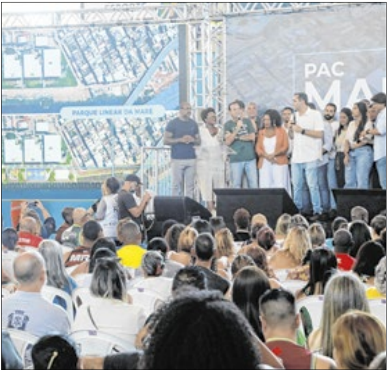
Paes e Cavaliere no Complexo da Maré

A Secretaria Municipal de Saúde anunciou a abertura das inscrições para o Processo Seletivo Simplificado do Programa Médico de Família. Os interessados devem consultar o edital completo e seus anexos no site da FeSaúde. O prazo para inscrição vai até o dia 12 de fevereiro. O valor total pode chegar a R$ 20.842,69.