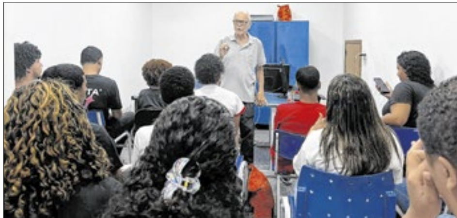
Treinamento foi ministrado pelo coordenador de educação profissional da secretaria

O Projeto acontece às terças e quintas-feiras, das 10 às 12h e das 14 às 16h. Após fazerem suas inscrições, os jovens participam de um treinamento de um dia no horário escolhido. Ao término, seus cadastros são registrados em banco de dados e há a intermediação junto às empresas que têm vagas