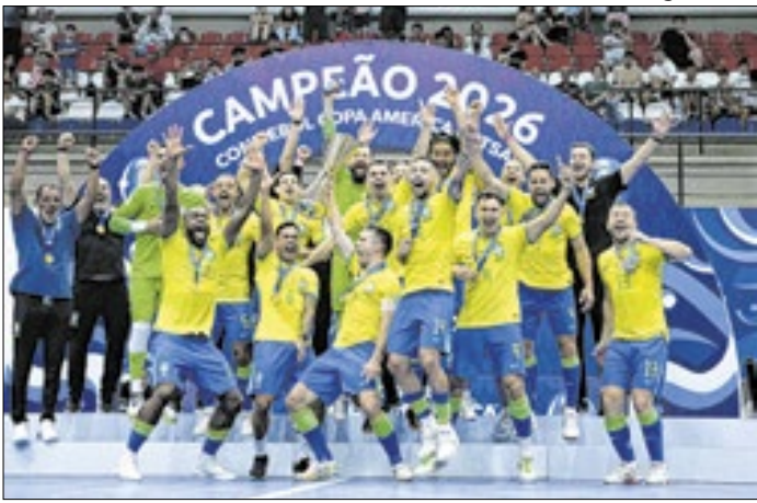
Seleção Brasileira bateu a Argentina na finalíssima