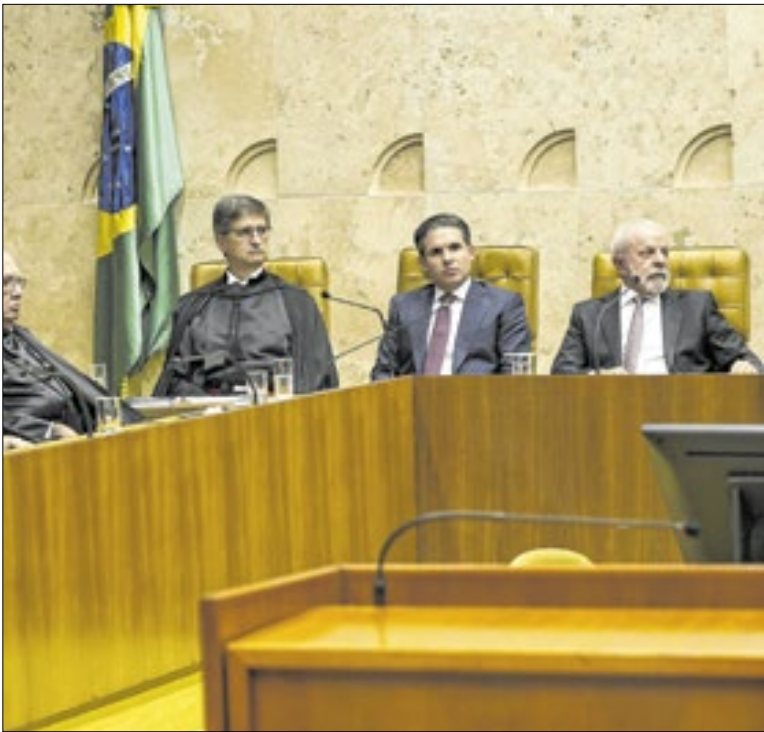
Lula e outras autoridades participaram da abertura no STF

O que perceberam os diretores da Caixa que se opuseram à venda? O que não percebeu – ou não quis perceber – o BRB? Como falsos empréstimos podem ter virado falsos créditos que engordaram a carteira vendida ao BRB? O que havia de verdadeiro de fato nessa carteira? Qual é o tamanho desse esquema?