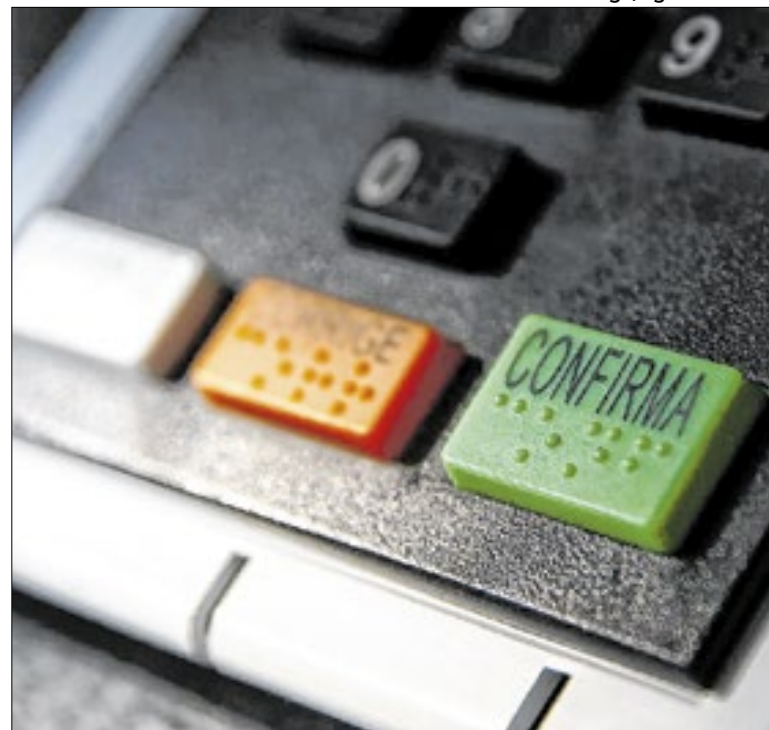
Novas eleições acontecem em outubro deste ano