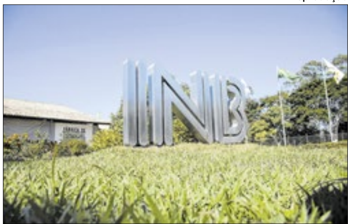
Defesa da empresa nega denúncias em processo