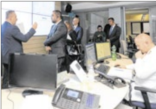
Governador Cláudio Castro se reúne com o serviço de cooperação internacional de polícia de direção central da polícia criminal