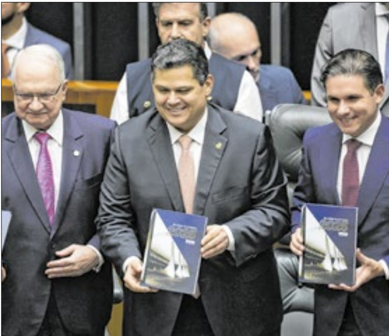
Presidentes pregaram harmonia entre os poderes

Ao anunciar publicamente a elaboração de uma proposta de um código de ética para a corte, Fachin constrangeu os ministros que, por baixo das togas, conspiravam contra a iniciativa. Ao delegar a relatoria para Cármen Lúcia, diminuiu as chances de a iniciativa ser sabotada dentro da própria corte.