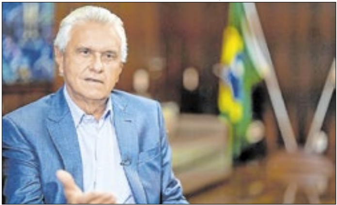
Ronaldo Caiado anunciou ida para o PSD