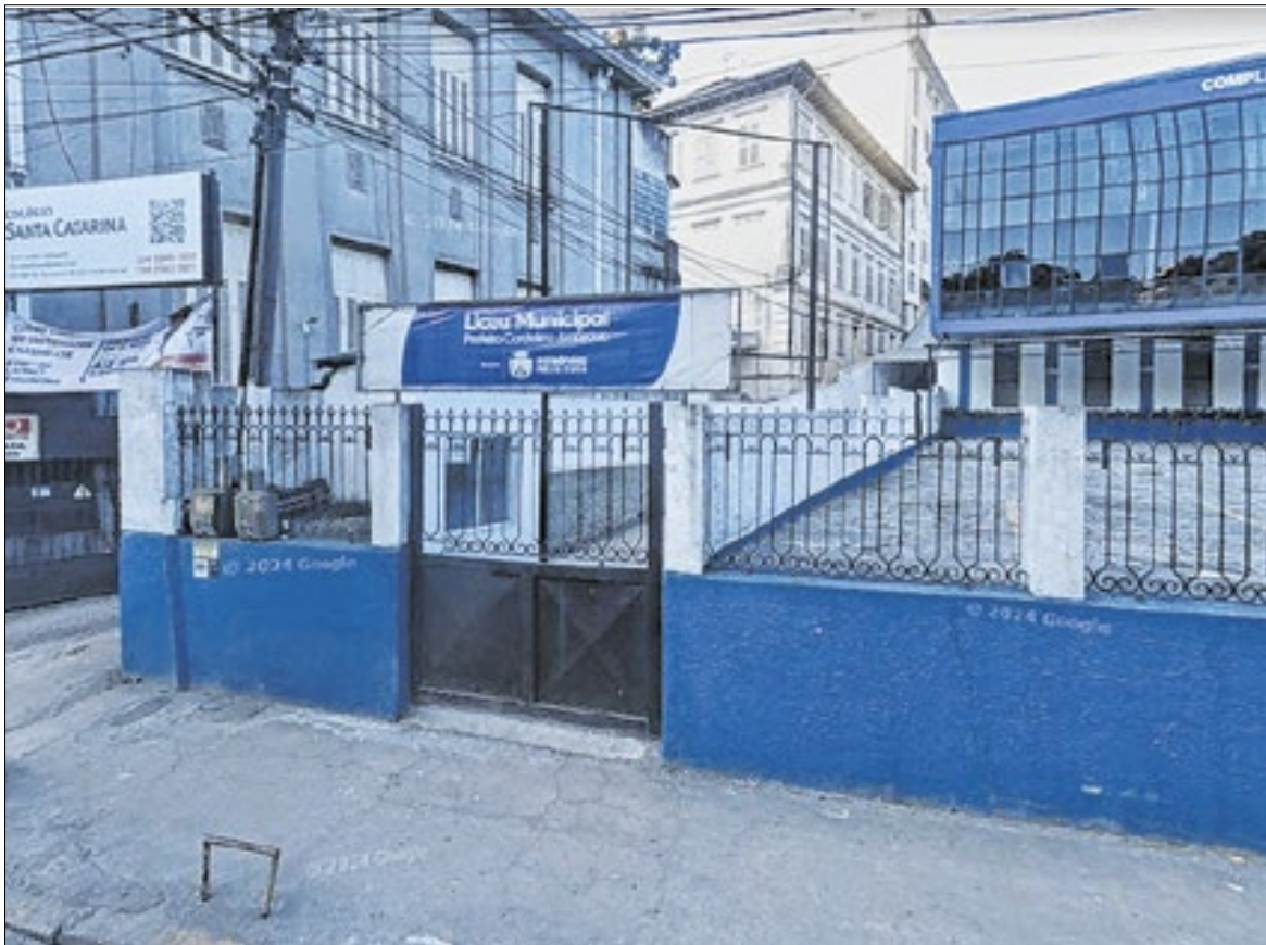
Audiência que discutirá despejo será realizada nesta terça-feira (03)