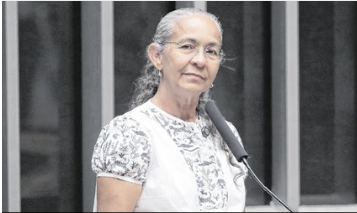
Heloísa: denúncia do Correio deve ser foco principal da investigação

O retorno dos trabalhos do Congresso Nacional, nesta segunda-feira (2), ocorreu sob o impacto direto do avanço das investigações sobre o que houve de irregular nas negociações do Banco de Brasília (BRB) com o Banco Master após os relatos feitos pelo Correio da Manhã de vítimas que afirmam ter sido incluídas em empréstimos consignados jamais contratados.