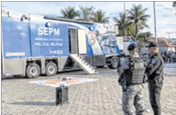
Ação integra o plano de combate ao crime organizado