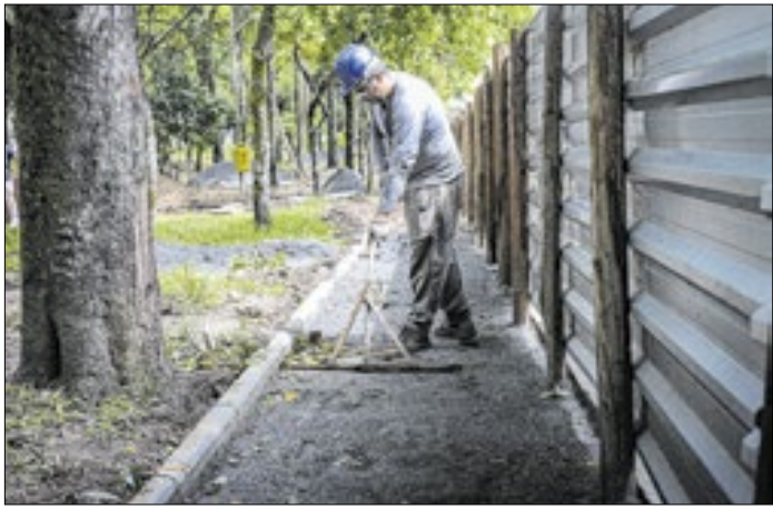
Ação visa incentivar o turismo e oferecer mais segurança