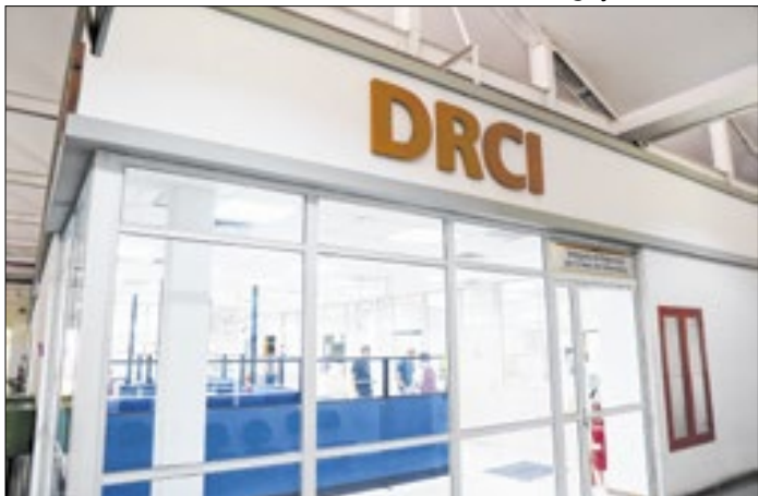
Três criminosos foram presos na operação da DRCI