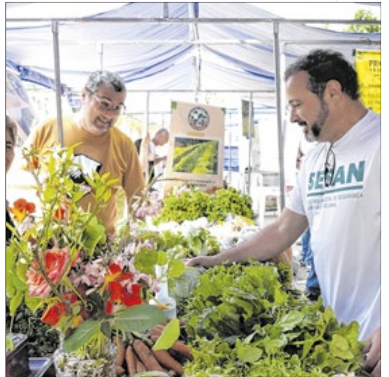
Feira é realizada em Volta Redonda

Quatis sediou, na manhã do último sábado (31), a 3ª edição da Corrida Janeiro Branco, em alusão ao mês de conscientização à saúde mental e emocional. Cerca de 100 atletas participaram do evento, encarando um percurso de 5 km. O evento teve entrega de medalhas à todos os atletas e arrecadação de itens para a saúde da mulher.