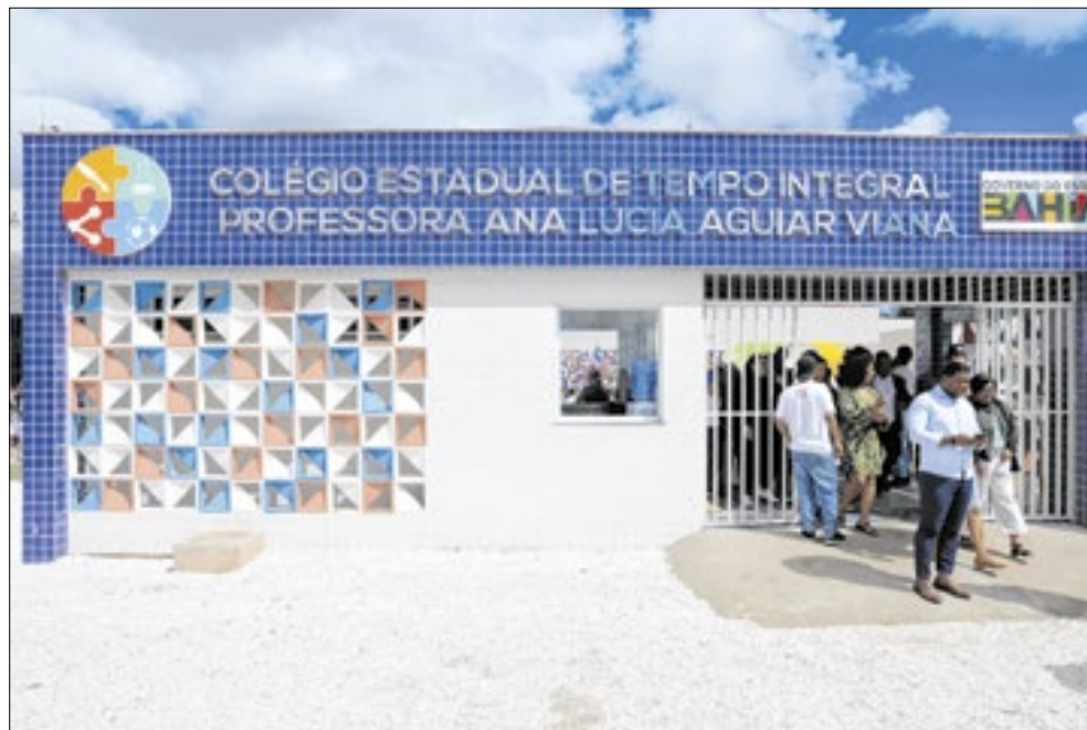
Professores da Bahia foram vítimas dos consignados falsos