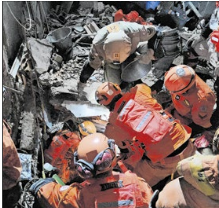
Mais de 50 militares foram acionados para o salvamento

De acordo com a prefeitura, a criação do Parque Taquara integra a política de espaços públicos estruturados na Zona Oeste, repetindo o modelo de sucesso dos parques Madureira e Oeste. Além da preservação da arquitetura colonial, o município mira na proteção ambiental local e no acesso à cultura e ao lazer.