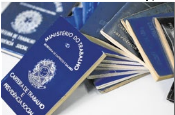
Também há oportunidade de estágios em diversas áreas