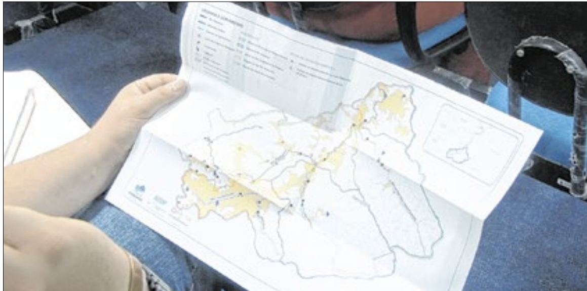
O objetivo é definir metas de qualidade da água para os rios da região