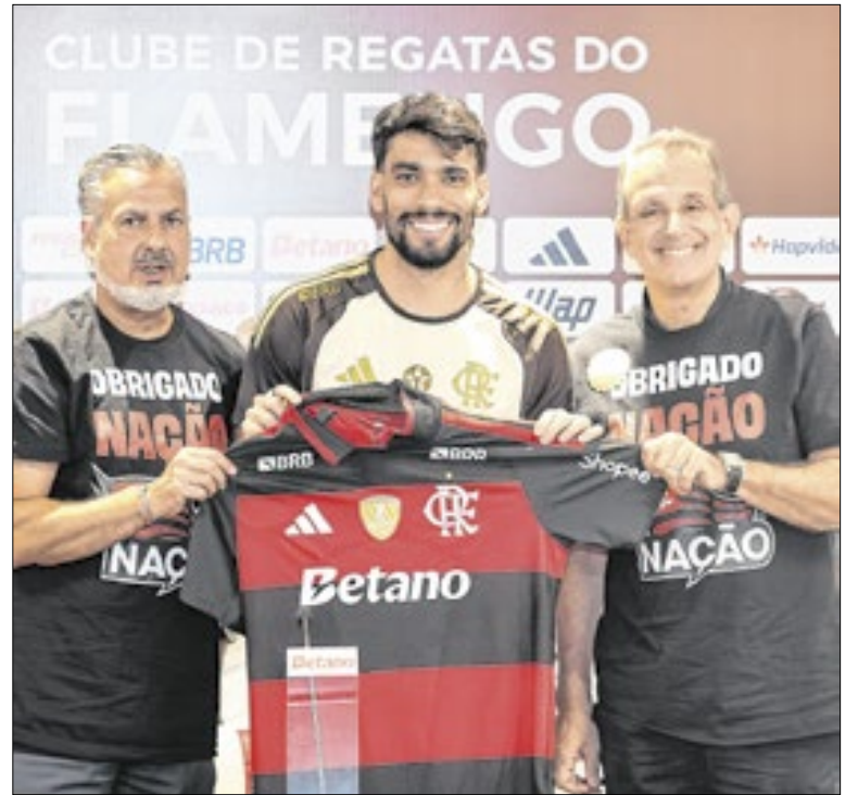
Paquetá perdeu gol incrível em sua reestreia pelo Flamengo

A diretoria do associativo se reuniu com John Textor e com o banco BTG Pactual, em São Paulo. O BTG vai realizar um processo de análise para detalhar e explicar ao associativo se a operação envolvendo o aporte de John Textor é segura ou não para o clube. Por enquanto, o Botafogo segue impedido de inscrever jogadores.