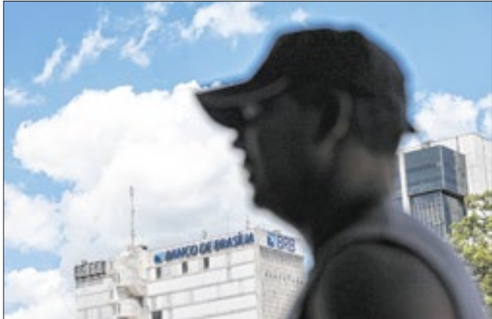
O que havia de verdadeiro na carteira do BRB?