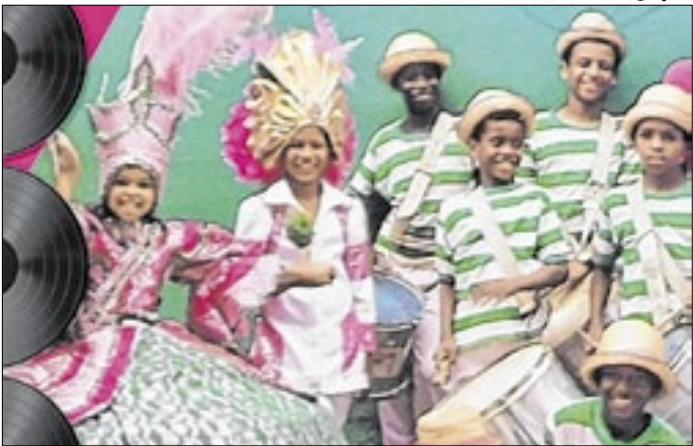
Mostra aconteceu durante todo o mês de fevereiro