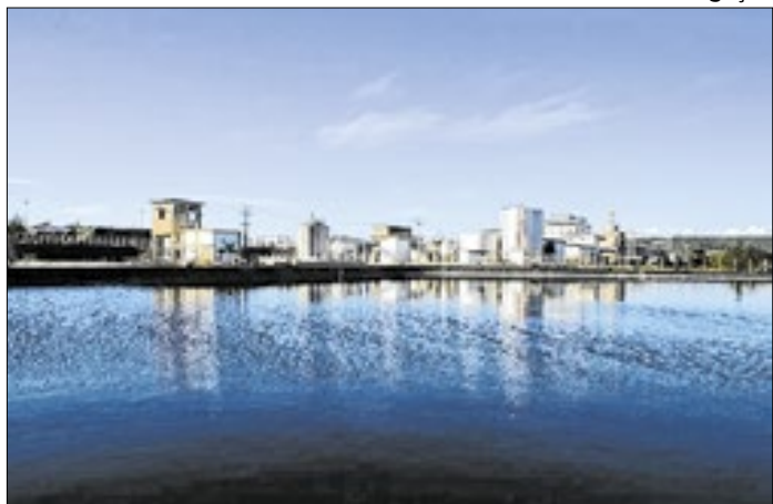
Unidade da INB em Caetité-BA está sob suspeita