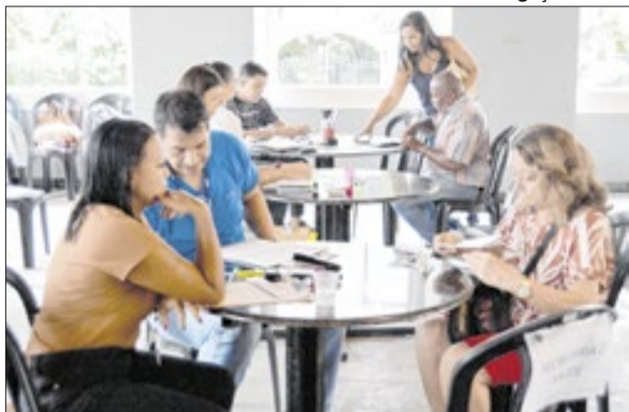
Ação garante a manutenção dos benefícios previdenciários