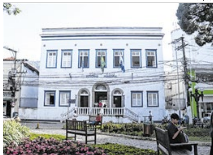
Ana Luiza Rossi/CSF

Voltado para jovens a partir de 14 anos e adultos, o projeto