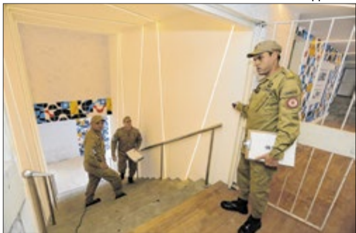
Vistorias visam garantir a segurança