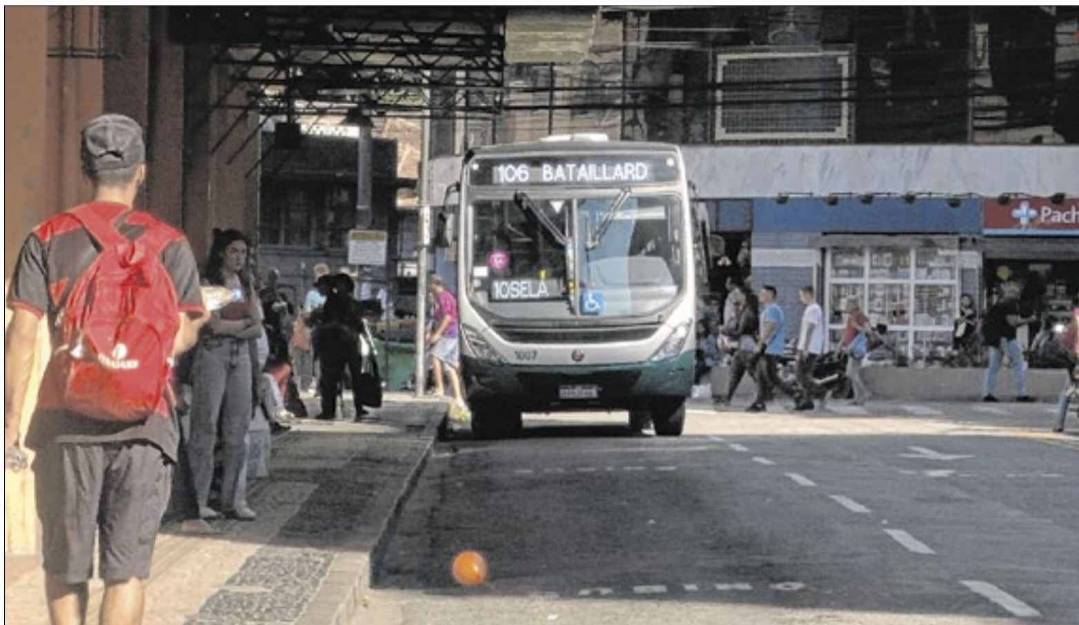
Novos contratos serão realizados com as empresas

O presidente da Câmara também lembrou que o problema já havia sido registrado no início do ano em outras linhas. “Conversei com o presidente da CPTrans porque passageiros da linha 150 (Bingen – Terminal