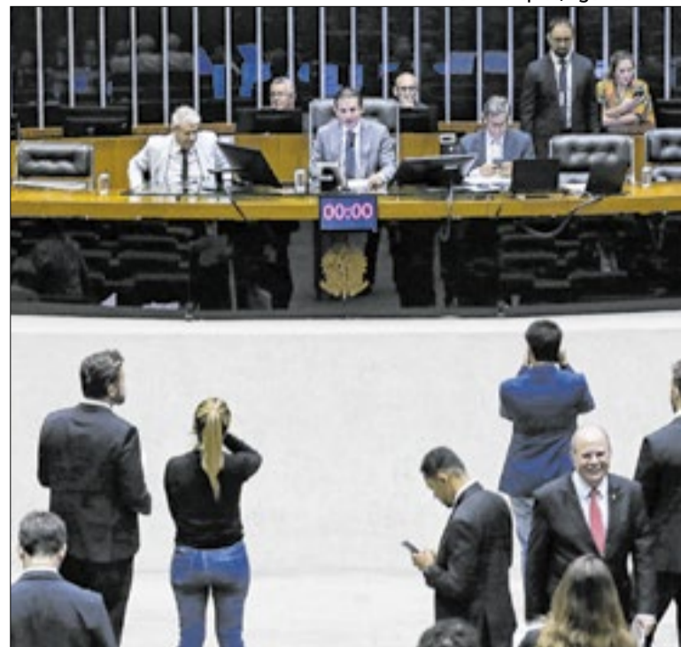
Duas MPs já deverão ser votadas no primeiro dia do retorno

Há um número grande de ausência de apoio dentro do Centrão. Mas o que intriga mais às deputadas da Rede e do Psol é por que razão também não aderem à investigação os parlamentares da base do governo, às quais também pertencem os partidos delas. Terá isso a ver com o que ainda pode aparecer?