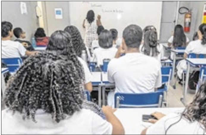
Projeto impulsionou desempenho de estudantes