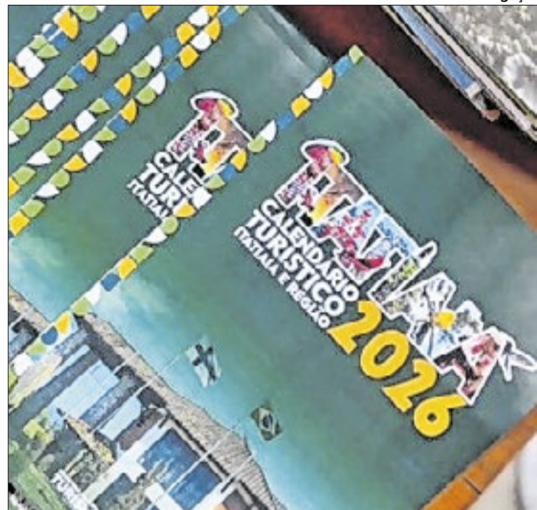
Planejamento reúne eventos e fortalece turismo regional

Também na segunda, às 8h, haverá entrevista para operador de empilhadeira, com 10 vagas. O salário é de R$ 2.300, além de benefícios. É exigida experiência mínima de dois anos, NR 11 ativa, ensino médio e currículo impresso. A vaga é masculina para moradores de Resende, Porto Real ou Quatis.