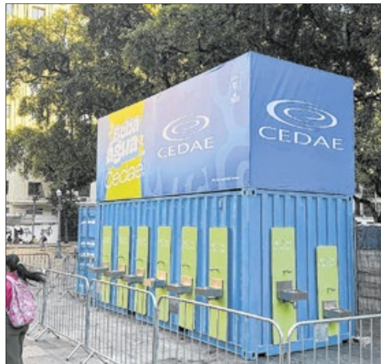
Ações da Cedae durante os megablocos do Centro

Nesse caso, há uma inversão na ordem de preferência pelas regiões da cidade: Leme/Copacabana (87,82%) é a mais procurada até o momento, seguida por Ipanema/Leblon (85,29%), Barra/Recreio/São Conrado (68,96%), Centro (65,84%) e Glória a Botafogo (64,15%). Os argentinos são os principais visitantes internacionais