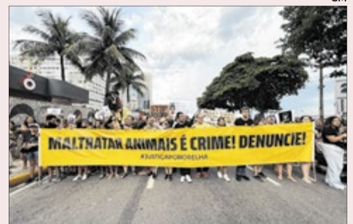
Por iniciativa do deputado federal Marcelo Queiroz (PSDB-RJ), Copacabana foi palco de um ato pedindo justiça pela morte do cachorro Orelha, neste domingo, 1º de fevereiro. A caminhada, que seguiu do posto 2 ao posto 6, reuniu centenas de manifestantes

■ ÁREA RESTRITA - A repercussão sobre a proibição de novas gravações do programa Aeroporto: Área Restrita no Galeão levou a Polícia Federal a divulgar nota de esclarecimento. Segundo a PF, a medida decorre do "estrito cumprimento de normas constitucionais, legais e regulamentares" e do fato de que as Áreas Restritas de Segurança são "zonas prioritárias de risco, sujeitas a rigorosos controles de acesso". A instituição destacou ainda que "atividades de entretenimento ou produção audiovisual" não se enquadram como necessidade operacional.