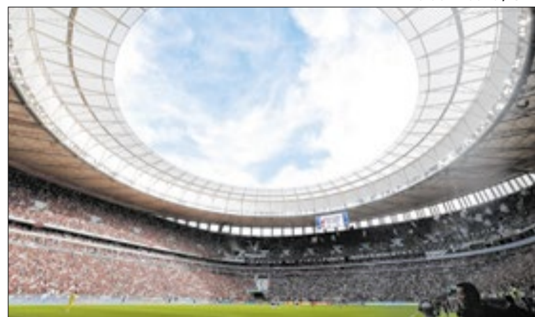
Mané Garrincha recebeu as duas maiores torcidas do país

Se o policiamento foi capaz de gerir bem mais de 70 mil torcedores em Brasília, por que não conseguiria fazer o mesmo em São