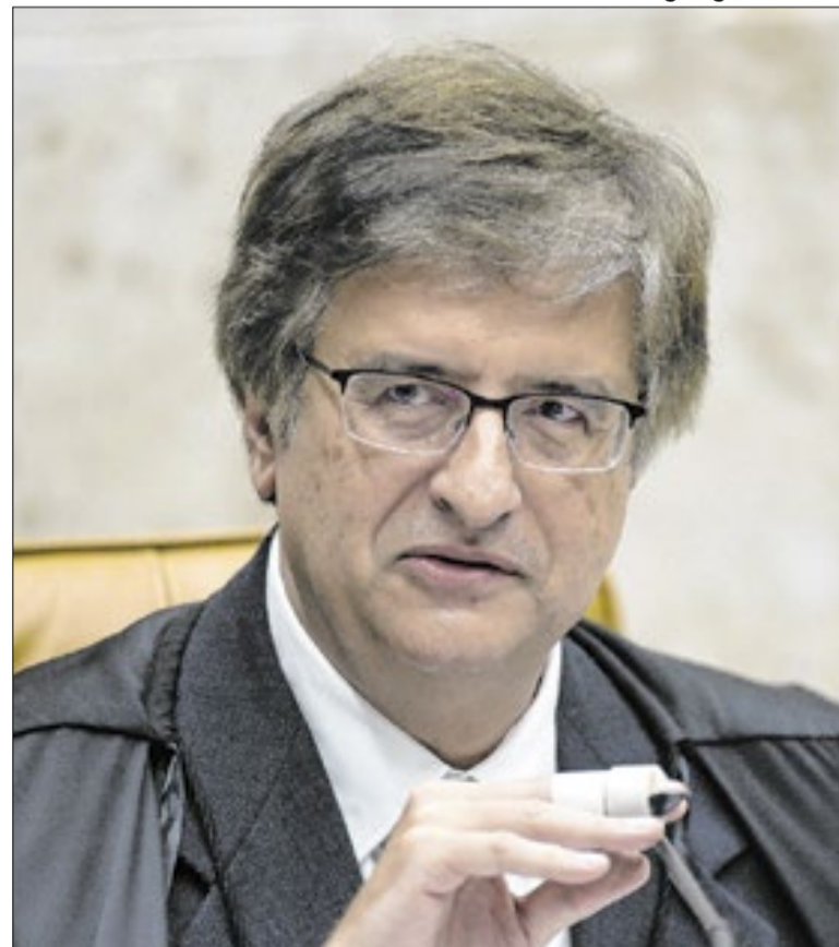
Procurador-Geral, Paulo Gonet, deu parecer divergente da AGU

A manifestação foi enviada ao Supremo na terça-feira (27), no âmbito de uma ação aberta pelo PSOL em maio de 2024. O processo está sob relatoria do ministro Gilmar Mendes. Ainda não há prazo definido para que o tema seja levado a julgamento pelo plenário da Corte.