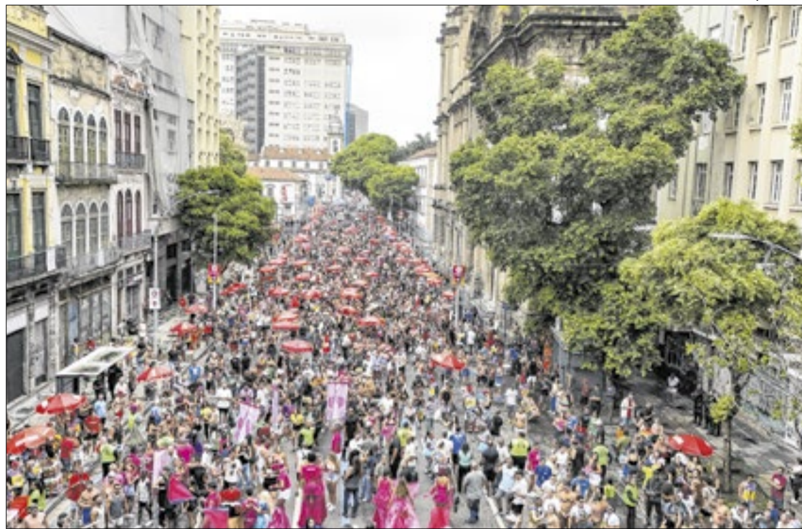
Foliões começam a ganhar as ruas. Atenção redobrada para não perder celular e não cair em golpe