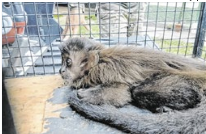
Animal foi encaminhado para atendimento especializado