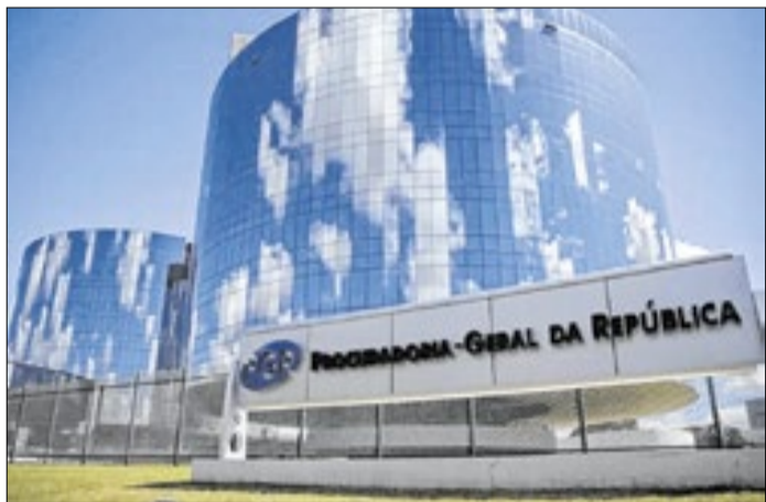
Medida do MPU foi solicitada pela Procuradoria-Geral