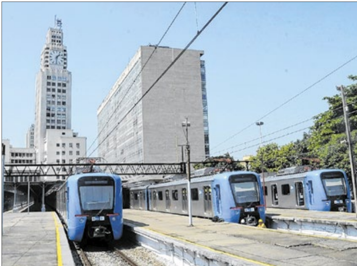
Viagens para Belford Roxo e Saracuruna ficarão mais rápidas a partir desta semana

“O passageiro vai perceber que as viagens no ramal Belford Roxo terão uma redução de até 5 minutos no tempo total da viagem. Conseguimos ampliar de 66 para 76 o número de viagens diá-