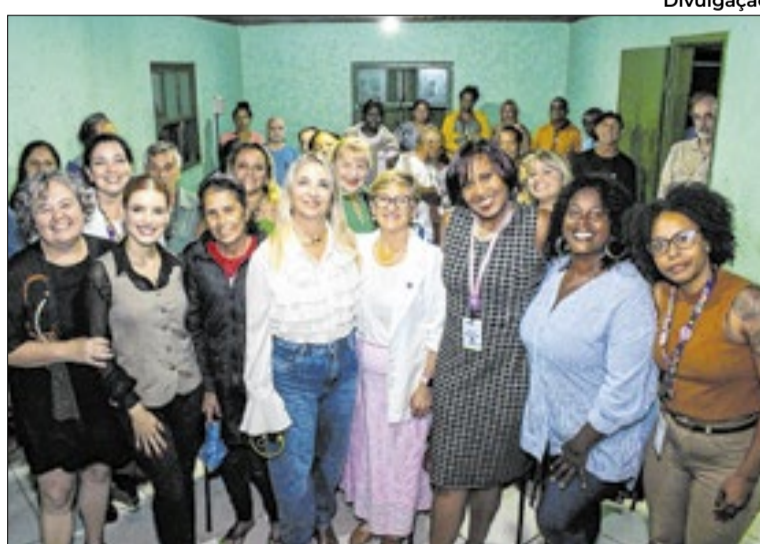
Objetivo é aliviar a sobrecarga de trabalho doméstico feminino

O que são as lavanderias públicas e comunitárias?