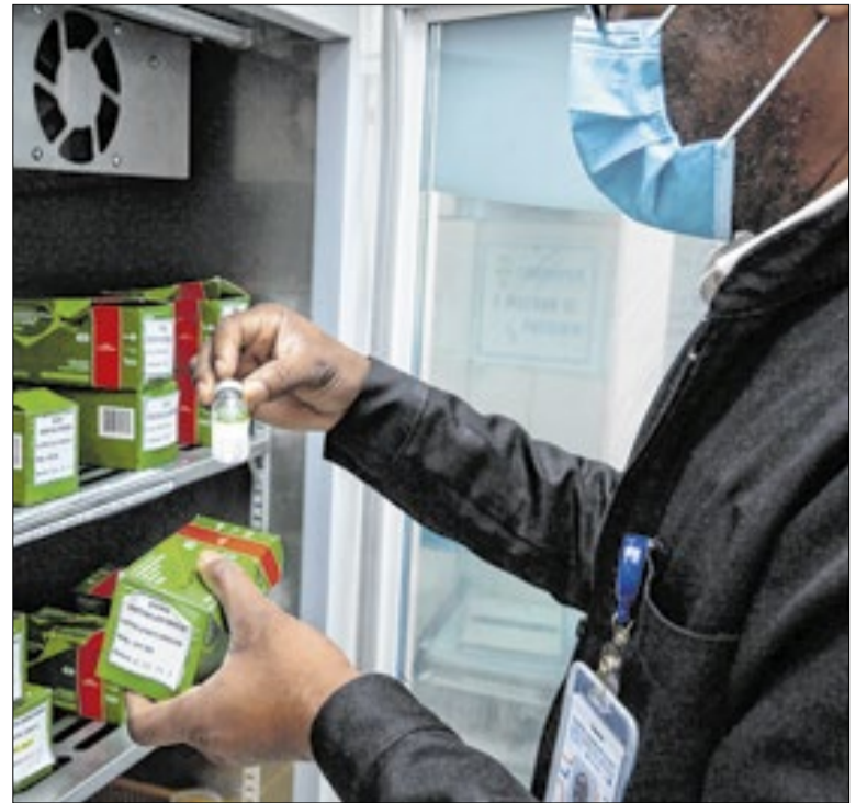
Ataques de cobra, aranha e escorpião são comuns nessa época