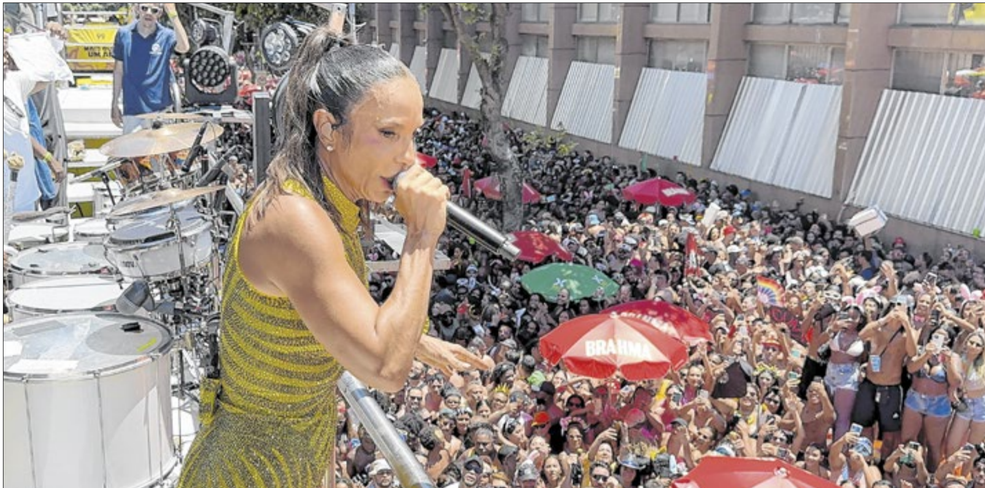
Ivete Sangalo esteve, pela primeira vez, comandando um trio elétrico no Rio e homenageou Preta Gil na abertura do seu megabloco neste domingo