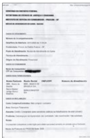
As provas: o falso consignado, o pedido de explicações ao BC, a reclamação no Procon

e que eventuais problemas foram resolvidos por meio da substituição das carteiras, por precatórios, sem prejuízo ao BRB.