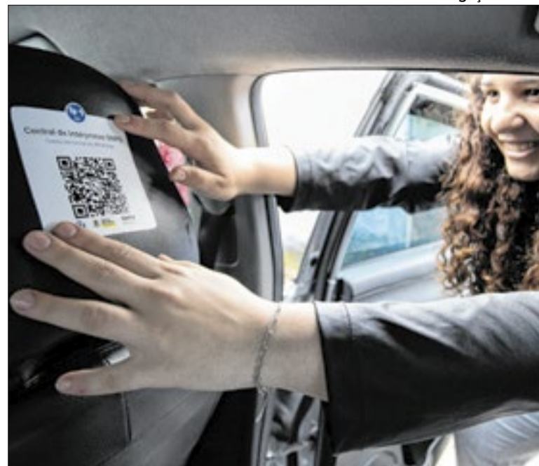
Ação envolve instalação de QR Code nos veículos

Os representantes das agremiações devem procurar a Secretaria Municipal de Cultura e Turismo de Quatis (SMCT), que fica no prédio da Prefeitura, e preencher a Ficha de Inscrição. O espaço funciona no horário das 8h às 16h30. Na hora do cadastramento, devem ser apresentados RG e CPF.