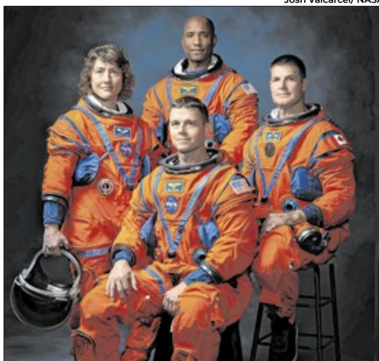
Christina Koch, Victor Glover, Reid Wiseman e Jeremy Hansen

Os EUA, onde ocorrerá o lançamento, passam por um período