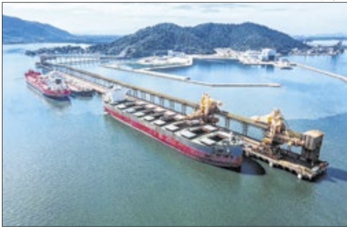
O leilão engloba 9.519.226 títulos de remuneração variável