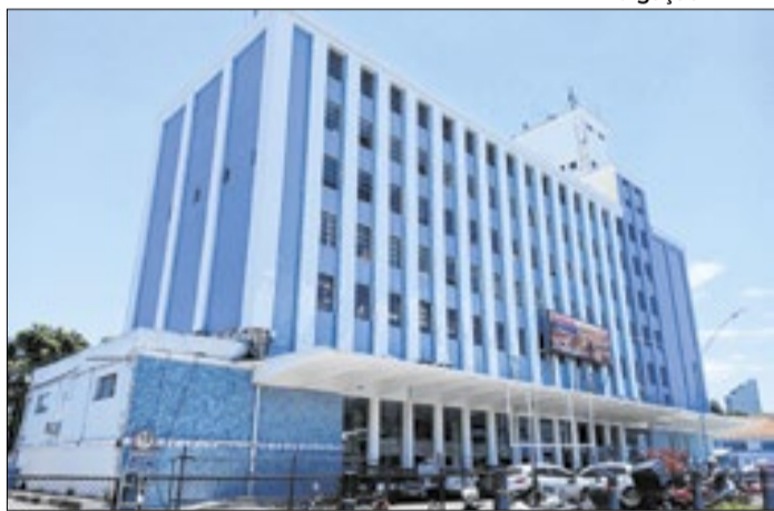
Atualização cadastral acontece de 2 a 27 de fevereiro