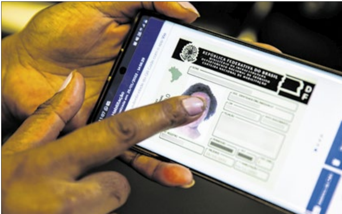
Mudanças no exame para renovar e adquirir a Carteira Nacional de Habilitação estão em vigor

“Admitir-se a legitimação extraordinária da Abrapsit significa atribuir-lhe a representação em juízo de interesses de uma comunidade muito mais ampla do que a dos seus associados, fazendo instaurar um processo coletivo em que a maioria dos membros do grupo, categoria ou classe estariam sendo, potencialmente, representados por quem defende interesses não coincidentes ou até contrários aos seus”, decidiu Dino.