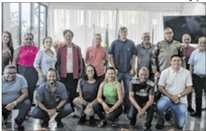
Posse oficial está prevista para março