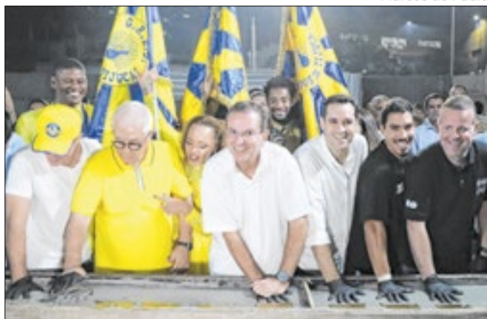
Prefeito Eduardo Paes participou do lançamento