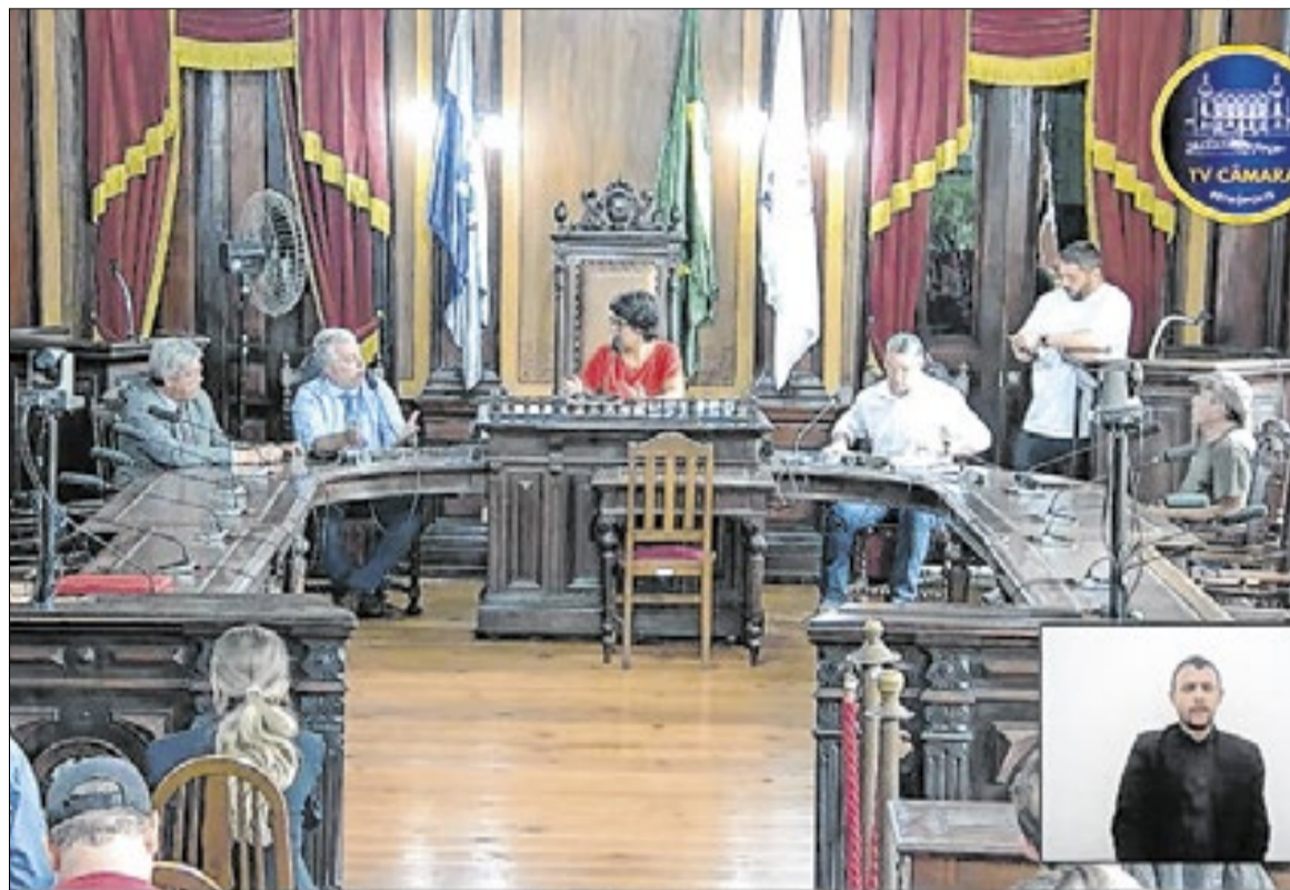
Além do licenciamento, outros documentos foram alvo de questionamentos