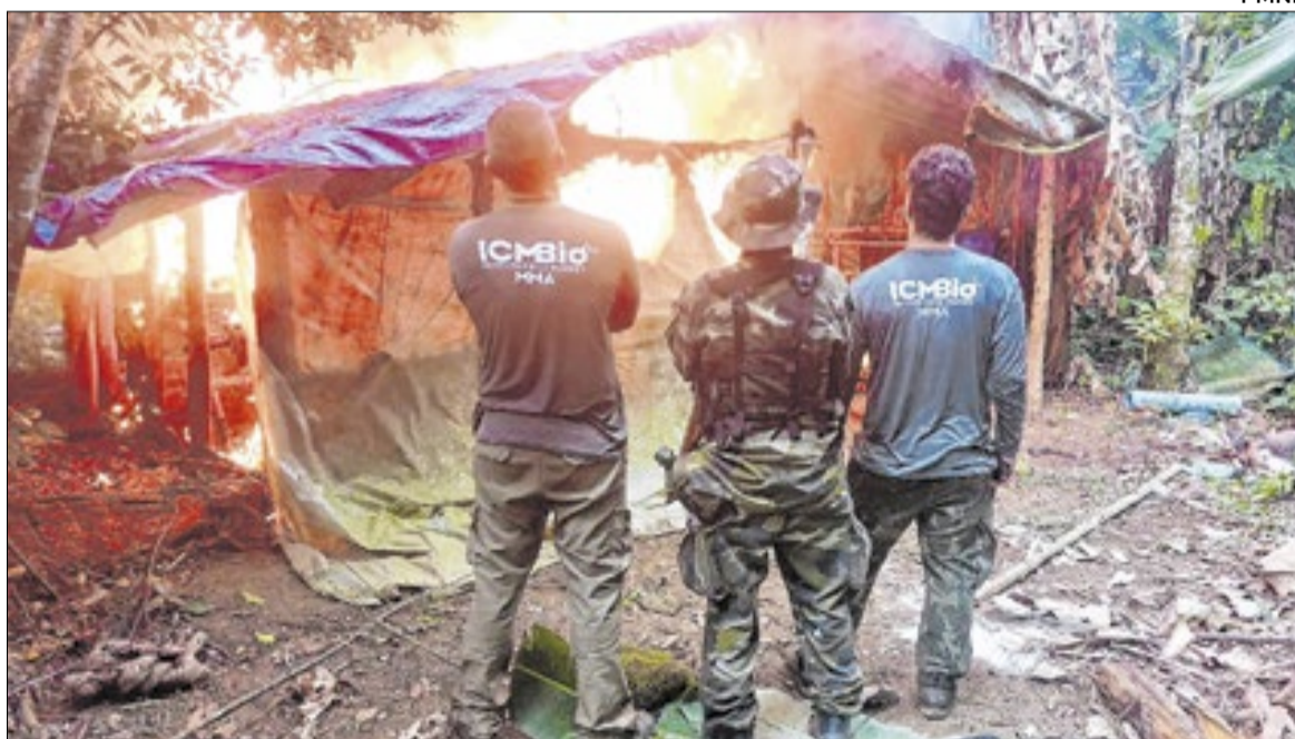
Homem é suspeito de extrair ilegalmente palmito juçara no interior da Reserva do Tinguá

o homem atuava na exploração, transporte e comercialização clandestina do palmito, abastecendo pontos de venda fora de Nova Iguaçu, como a feira de Areia Branca, em Belford Roxo. Há ainda registros de prisão anterior do suspeito por crime ambiental.