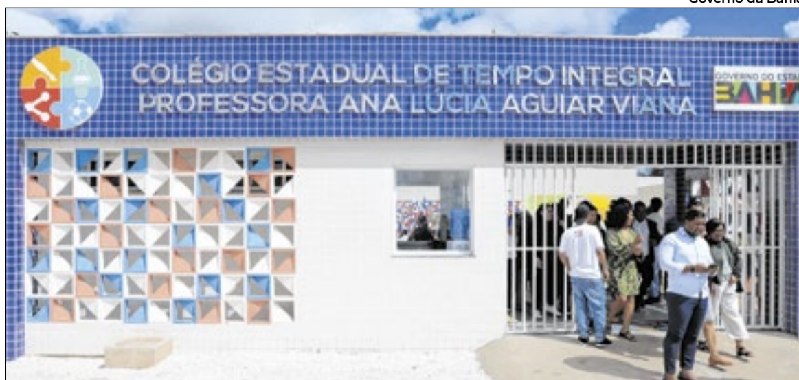
Professores da rede estadual da Bahia tiveram consignados falsos nas suas contas