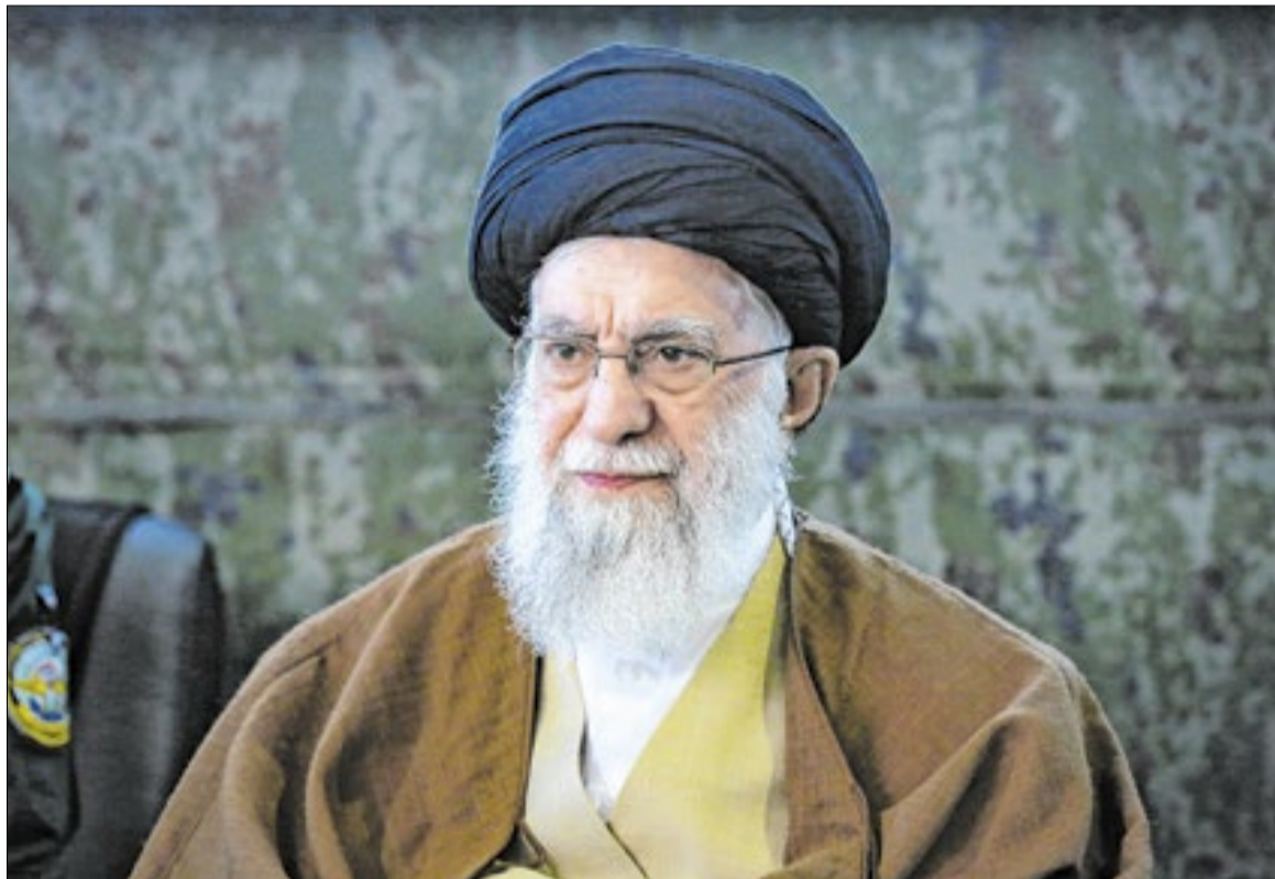
Aiatolá Ali Khamenei fez uma série de declarações que intensificaram a tensão internacional

O líder supremo do Irã, o aiatolá Ali Khamenei, afirmou neste domingo (1º) que eventuais ataques dos Estados Unidos contra o país desencadearão um conflito regional.