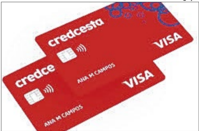
O CredCesta surgiu a partir da Bahia