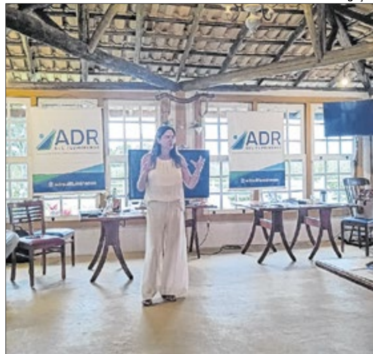
Objetivo foi consolidar calendário de ações da ADR