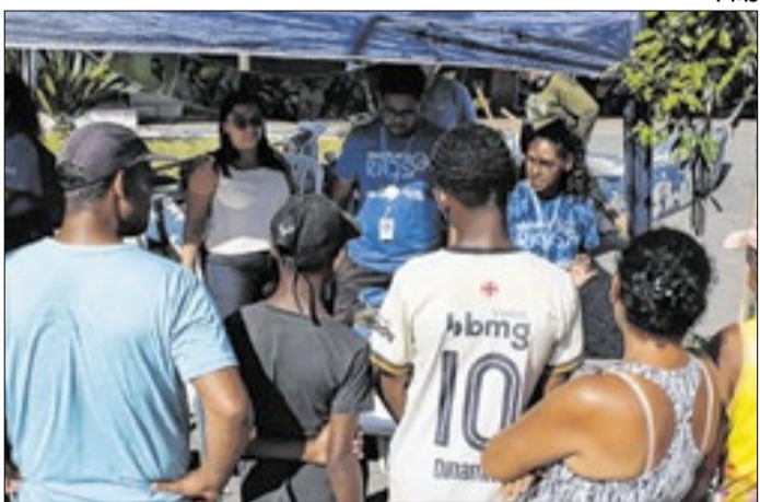
População passou por atividade de conscientização

A parceria com a Secretaria Municipal de Urbanismo reforça a importância do trabalho integrado entre as pastas para garantir planejamento, cuidado e respeito ao espaço urbano em Japeri.