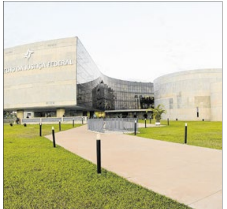
Maior parte das verbas é para pagar dívida do INSS

Em março, Dino havia determinado ao Ministério do Turismo e à Advocacia-Geral da União (AGU) que colhessem informações para garantir a rastreabilidade e a transparência das emendas direcionadas ao Perse. Os órgãos responderam que não poderiam cumprir a decisão, pois não haviam recebido os relatórios.