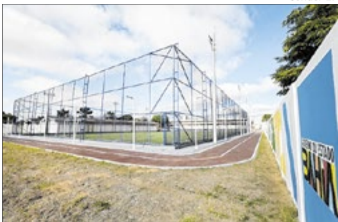
Um esquema que envolveu professores da rede pública