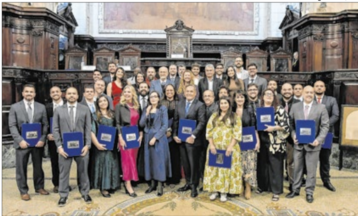
Deputado atua como professor na Alerj, qualificando funcionários e assessores do Legislativo