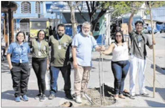
Na ação, foram plantadas mudas de Oiti e Pau-Ferro