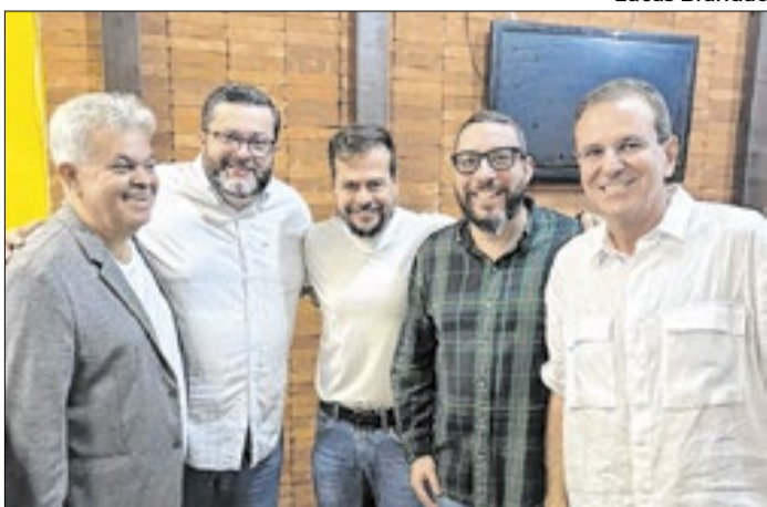
Encontro discutiu cenário eleitoral e alianças no estado