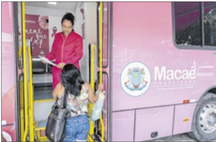
Unidade faz parte do Programa "Saúde Até Você"