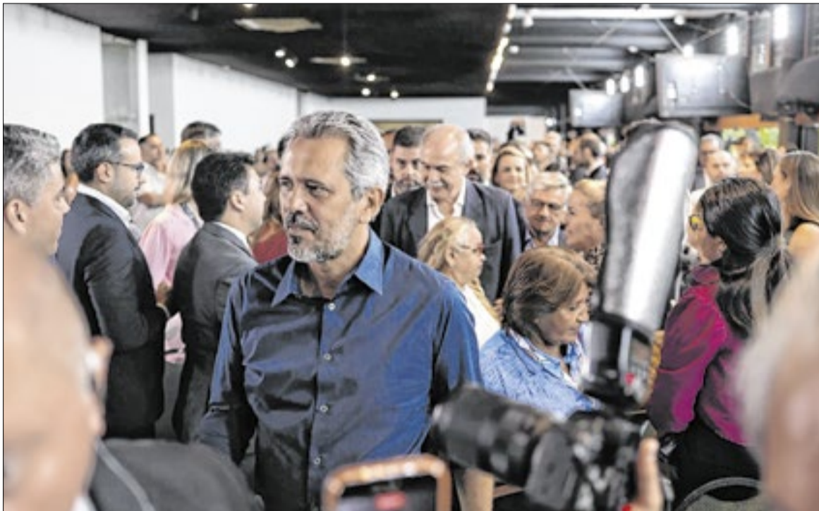
O projeto de duplicação ampliará a capacidade de transporte

tensão, o Eixão das Águas é composto por estação de bombeamento, canais, adutoras, sifões e túneis, e integra o sistema que transporta água do Castanhão até a Região Metropolitana de Fortaleza. Parte do empreendimento tem previsão de entrega em setembro de 2026, com conclusão total estimada para o final de 2026.