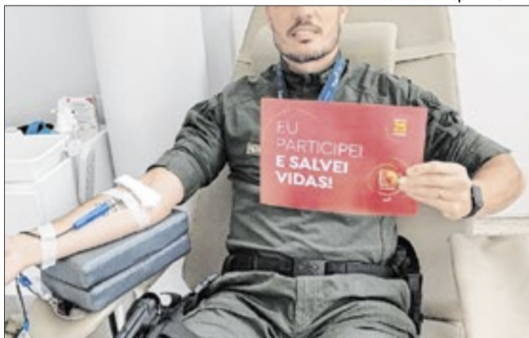
A iniciativa contará com atendimento itinerante do Hemoes

A coleta de sangue será realizada das 8h às 14h, sem a necessidade de deslocamento até a sede do hemocentro. A proposta é ampliar a adesão à doação voluntária e contribuir para a manutenção dos estoques, que atendem hospitais e unidades de saúde em todo o Estado.