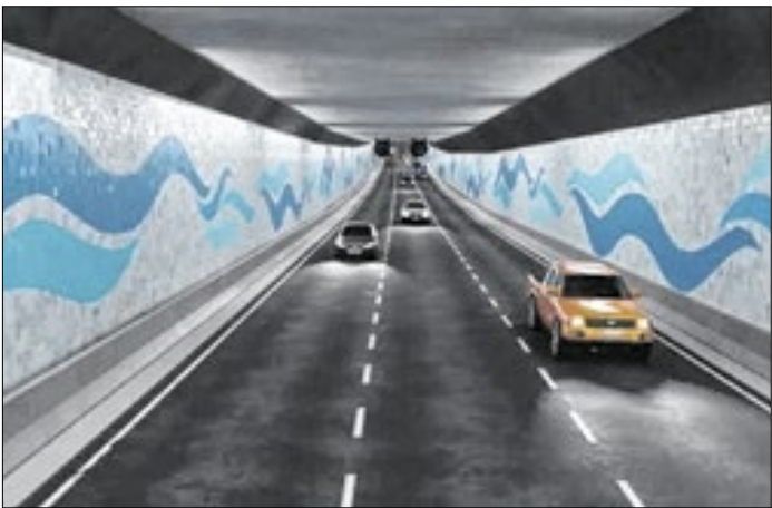
Governo estadual firma parceria com construtora