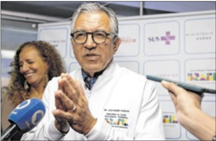
O ato foi realizado no Hospital Sofia Feldman