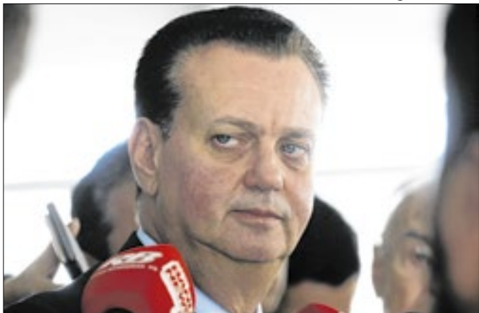
Presidente do PDS entrou de vez no jogo eleitoral