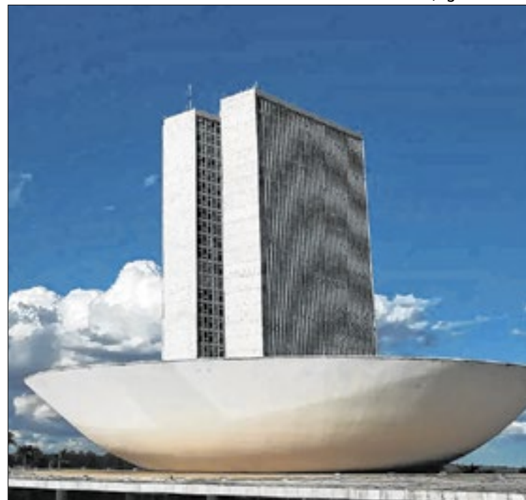
Por enquanto, Câmara não discute CPI do Master