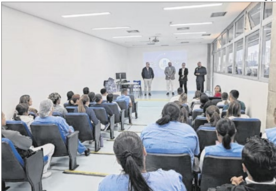
Palestra sobre registros de enfermagem e judicialização do prontuário reuniu colaboradores

O Coren-SP é a autarquia responsável por fiscalizar e disciplinar o exercício profissional da enfermagem no estado. Em sua atuação, o conselho busca ser referência em fiscalização e valorização da categoria, contribuindo para a segurança da assistência prestada à população. Segundo o órgão, a aproximação com as unidades de saúde também é uma forma