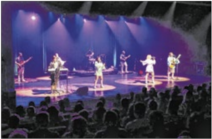
Show é homenagem a ícones dos anos 1960, 1970 e 1980