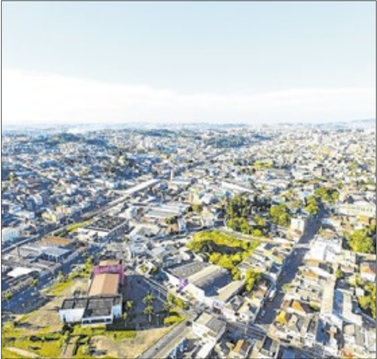
Cidade de Ferraz de Vasconcelos, na Grande São Paulo