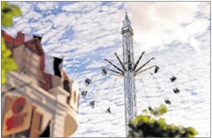
Primeira atração de grande porte construída em 20 anos