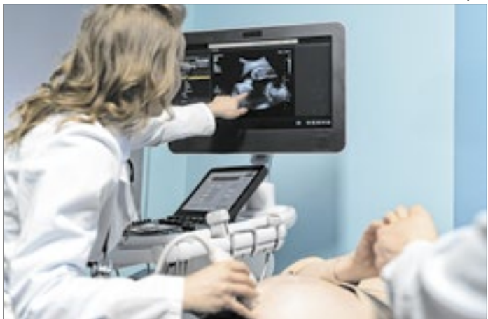
Intenção é aumentar a capacidade exames de imagem