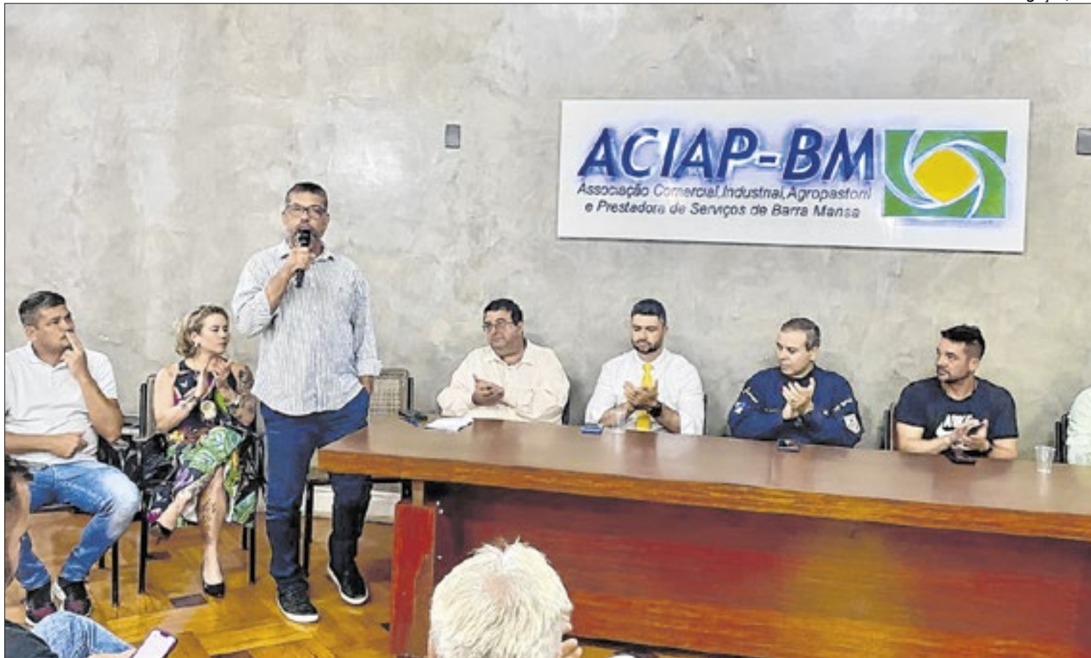
Posse dos Conselhos Comunitários de Segurança da Área Integrada de Segurança Pública

O parlamentar também reafirmou o apoio do mandato aos conselhos e relembrou iniciativas realizadas na Assembleia Legislativa do Estado do Rio de Janeiro (Alerj) voltadas ao fortalecimento da segurança pública.