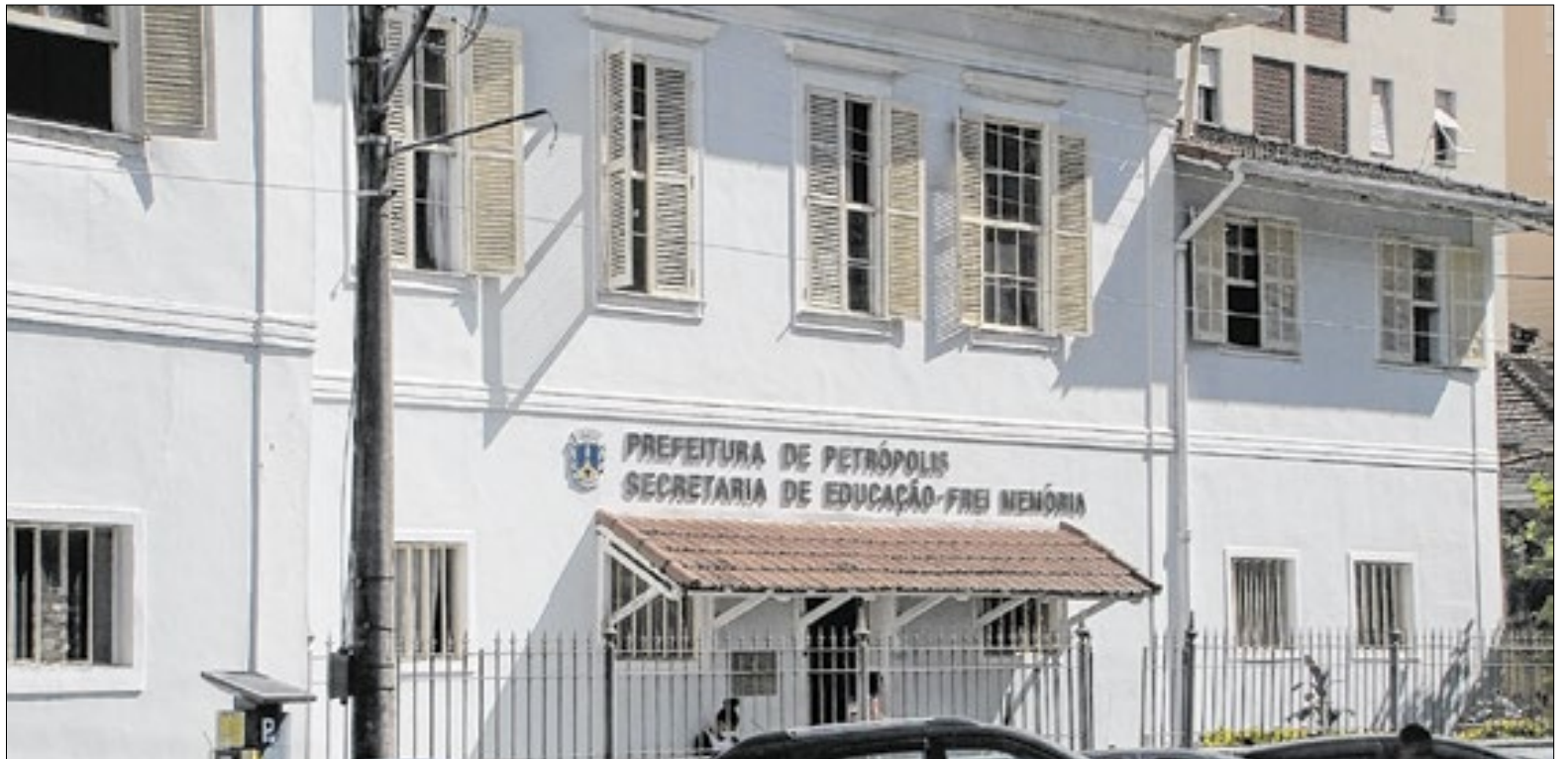
Município deve apresentar comprovação sob multa ao prefeito e secretária, em casos de descumprimento

No entendimento da promotoria, conforme consta nos autos