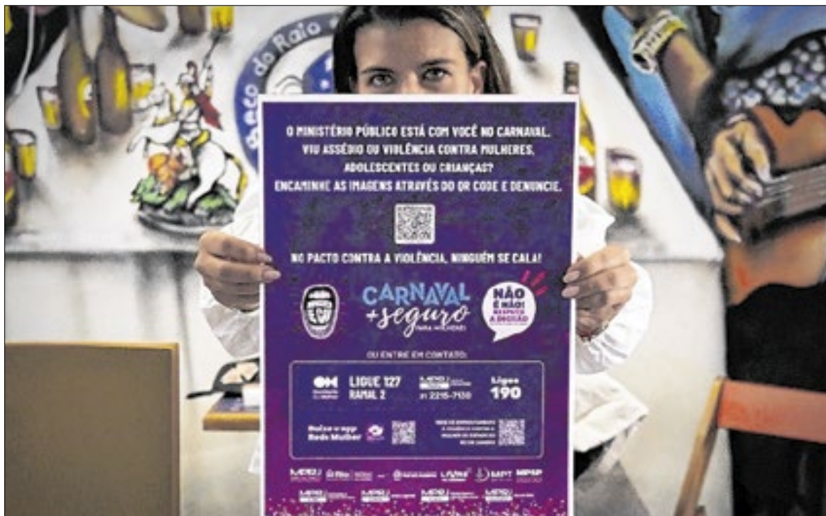
MPRJ incentiva união entre entidades para gerar ambientes mais seguros para as mulheres

O NUGEN também envia notificações para produções que