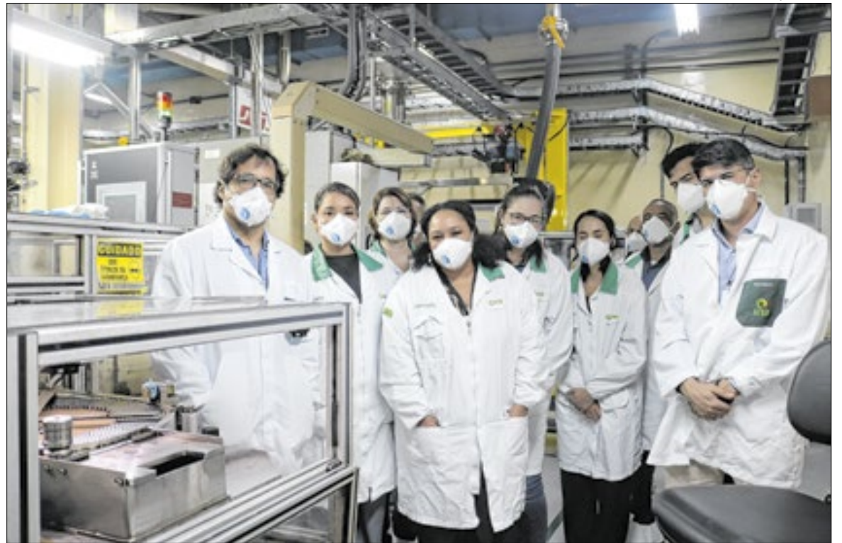
Unidades da estatal federal que enriquece urânio é procurada pelo público acadêmico

O local recebe estudantes de diversos municípios da Bahia e também turistas que visitam a cidade, sendo reconhecido como um dos principais pontos turísticos locais. O Espaço INB Caetité recebeu grupos de diversas cidades do estado e, desde sua inauguração em 2010, acumula 43.782