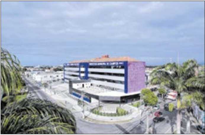
Ano foi marcado por 86 mil atendimentos no pronto-socorro