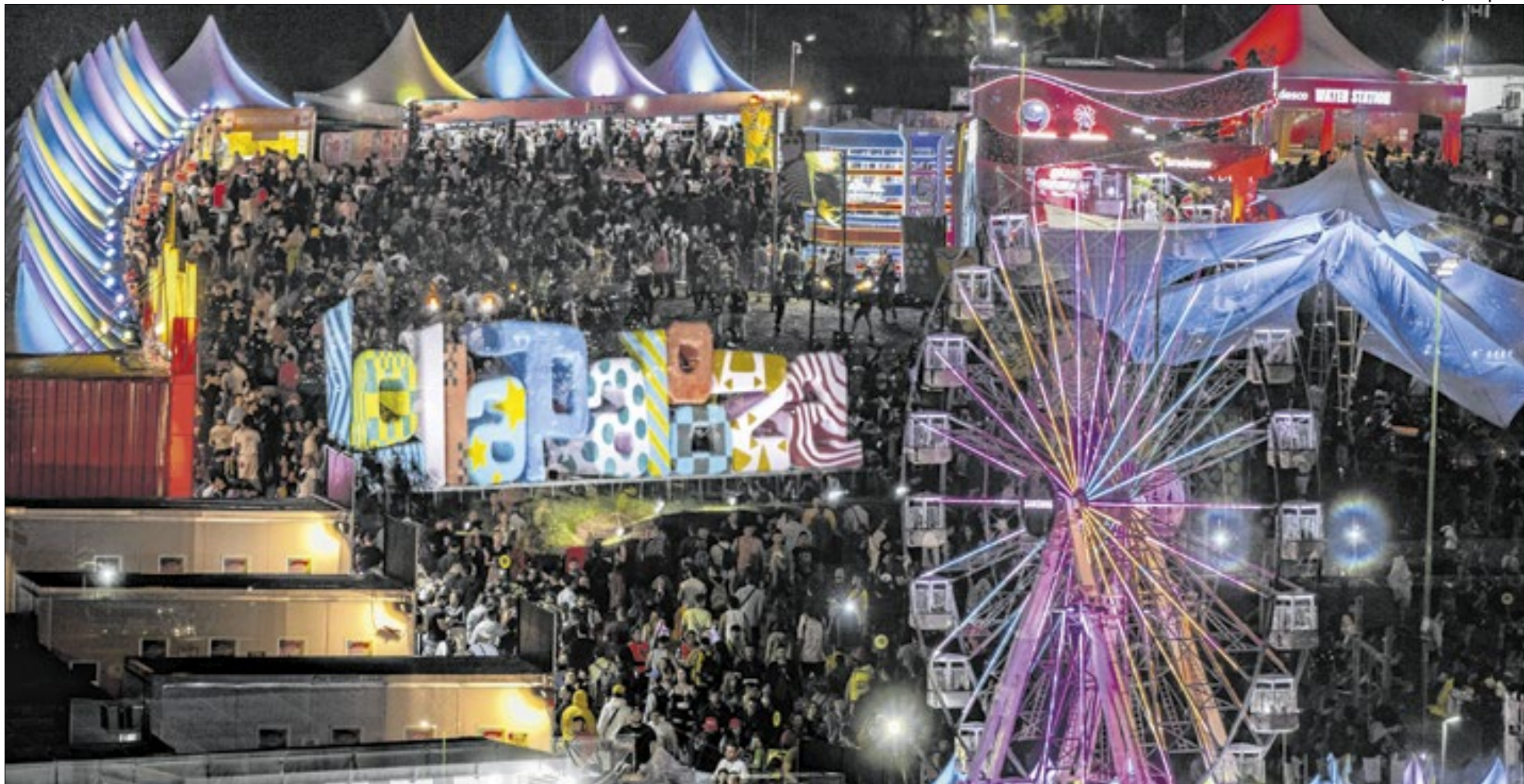
Edição de 2026 traz cartaz que leva para os palcos nomes que são sucessos mundiais e tendências de fora da região Sudeste

Faltando menos de dois meses para ocupar novamente o Autódromo de Interlagos, o Lollapalooza Brasil 2026 chega reafirmando sua vocação como um dos principais festivais do calendário musical internacional. Nos dias 20, 21 e 22 de março, o evento reúne mais de 70 atrações nacionais e internacionais, com um line-up que combina grandes nomes globais, artistas em ascensão e estreias aguardadas pelo público brasileiro. Ao todo, 18 artistas se apresentam no país pela primeira vez, além de cinco nomes que figuram entre os 15 mais pedidos pelos fãs nas últimas edições.