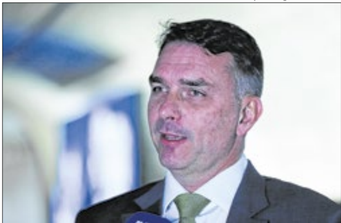
Imposição de Flávio Bolsonaro desagradou caciques