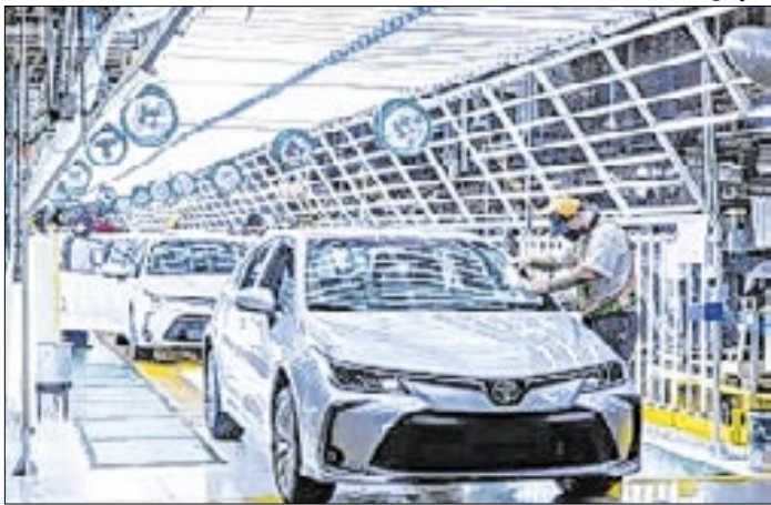
O carro Ethios ocupa o 6º lugar de mais procurados