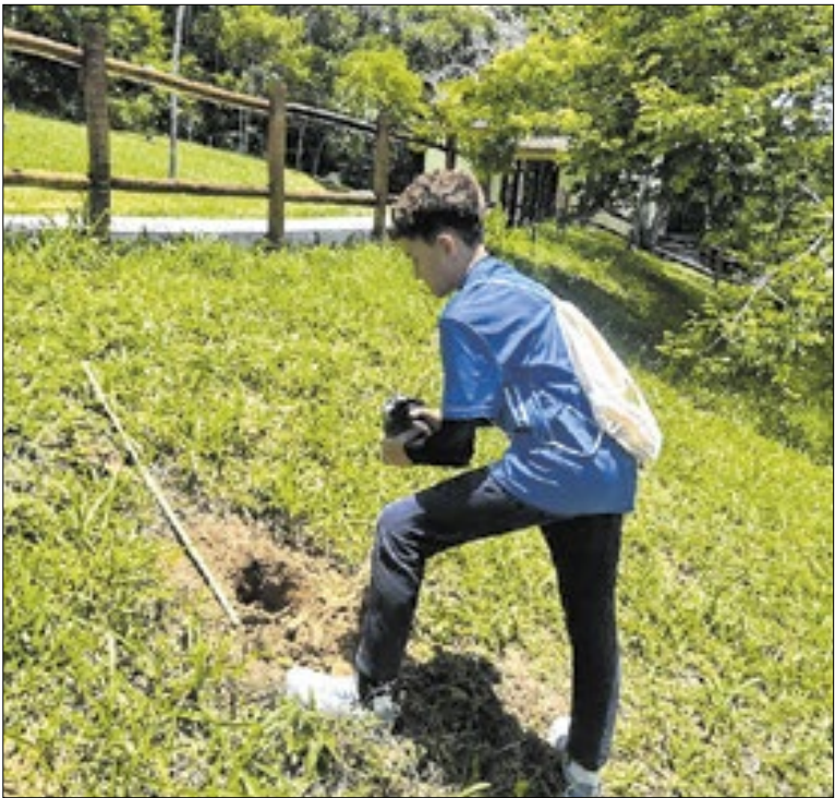
Crianças plantam mudas de planta

A caminhada terá início na Avenida Macário Pinto Lopes, seguirá até a Avenida Hilton Massa e retornará em frente ao Edifício Dom Filippo, nº 500. Ao final do trajeto, o trio elétrico permanecerá próximo à rotatória da Praça da Cidadania, ao lado dos quiosques, onde será encerrada a programação.