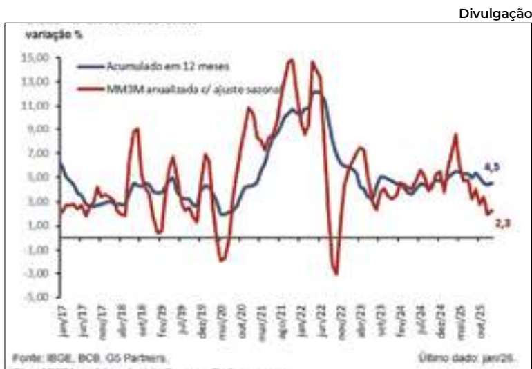
Confira o desempenho da inflação

A depender do resultado da prévia da inflação divulgada pelo Instituto Brasileiro de Geografia e Estatística (IBGE), teoricamente, a taxa tem condições de cair. A conta de luz mais barata