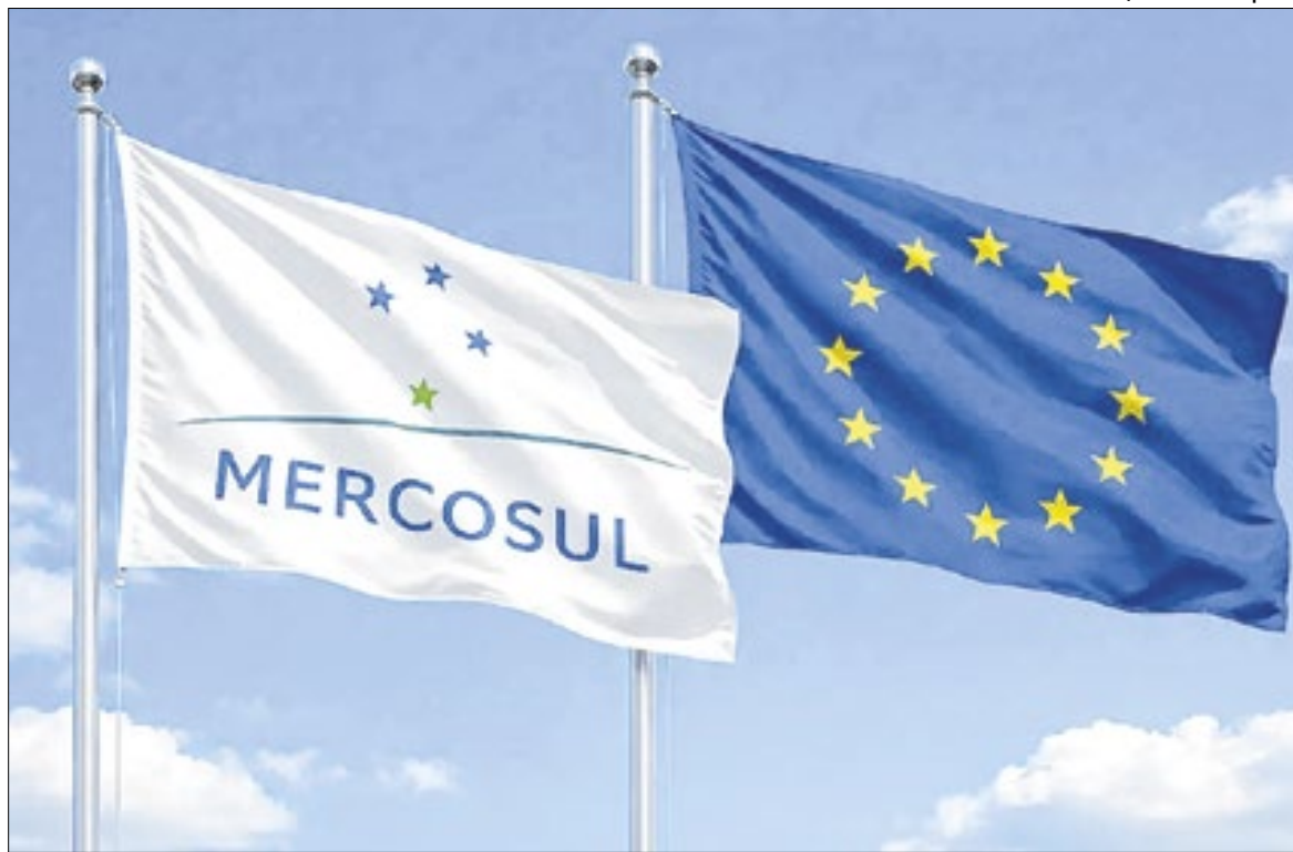
Acordo entre UE e Mercosul prevê a criação da maior área de livre-comércio do mundo

“Existe uma pressão geopolítica para ampliar e diversificar acordos bilaterais. No entanto, no caso europeu, essa pressão não supera os limites jurídicos do sistema institucional. Sem o aval da Justiça, o acordo simplesmente não avança”, conclui.