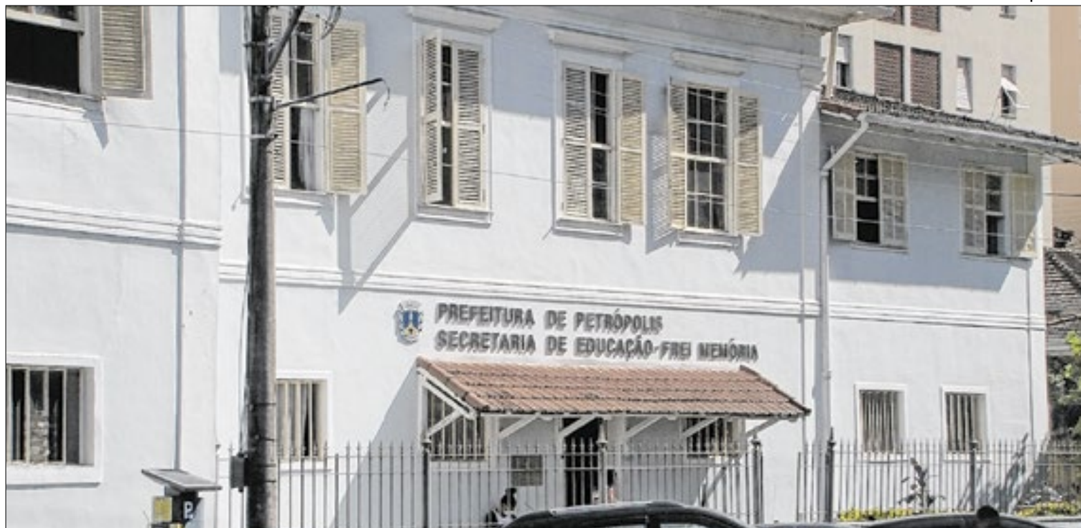
Município deve apresentar comprovação sob multa ao prefeito e secretária, em casos de descumprimento

No entendimento da promotoria, conforme consta nos autos