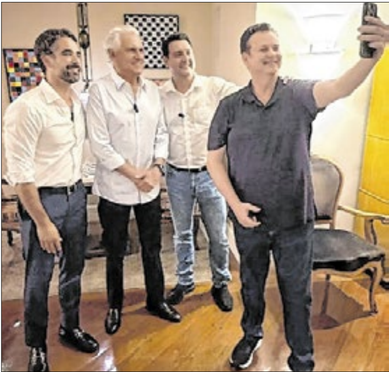
Um dos três governadores sai com apoio dos demais

Para o deputado, ex-ministro do Meio Ambiente, não faz sentido autorizar a retomada das obras antes de a Justiça de primeira instância julgar a legalidade da intervenção. Ele ressalta que é preciso a concordância do Iphan para que a decisão do STJ seja aplicada, daí o pedido de ajuda feito a Grass.