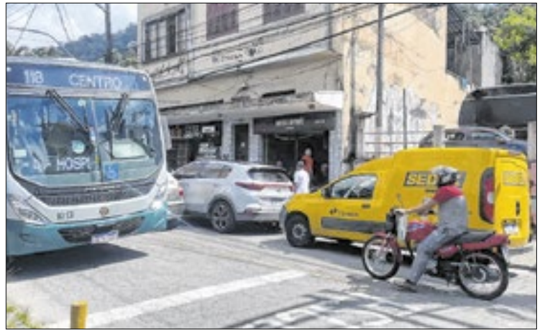
Nos horários de pico, o cenário se torna ainda mais crítico

Na tarde desta terça-feira (27), o Setranspetro - Sindicato das Empresas de Transportes Rodoviários - informou que, após a desobstrução da Rua Santos Dumont por parte da Secretaria Municipal de Obras, as 25 linhas de ônibus que utilizam o trecho tiveram a operação normalizada, retomando seus itinerários originais.