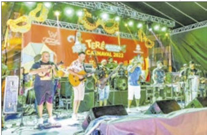
Mais de 17 blocos, matinês e shows em quatro pontos da cidade