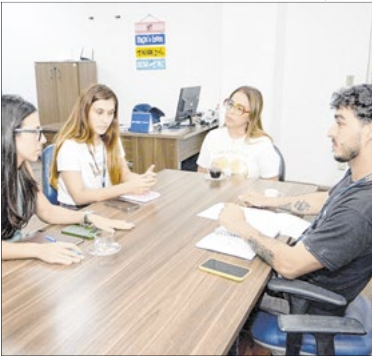
Reunião entre as pastas realizada nesta semana

O curso acontece no campus Aterrado do UGB e as aulas começam em fevereiro. Os interessados devem se inscrever pelo link: https://bit.ly/DiplomaCidadaoRH . Mais informações podem ser obtidas pelo contato com a SMPD: pelo número (24) 3511-3448, ou presencialmente na Avenida 17 de Julho, nº 20, Aterrado.