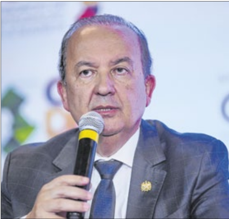
Movimentos de Jorginho Mello racham conservadores

A chapa, porém, deixou de fora o MDB, com quem Mello havia se comprometido para a vice. O que fez o MDB? Rompeu com Mello. E cogita uma chapa com o PSD, para reforçar o plano de Gilberto Kassab de lançar à Presidência o governador do Paraná, Ratinho Jr, ou o do Rio Grande do Sul, Eduardo Leite.