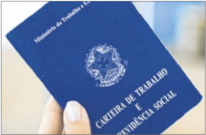
Oportunidades abrangem diversos setores e níveis