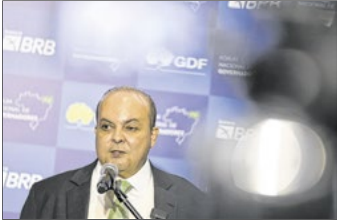
Ibaneis, de fato, cogitou não disputar o Senado