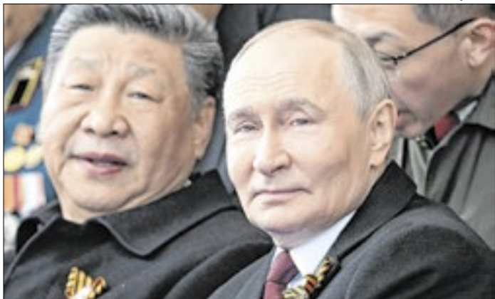
Ameaça americana poderá aproximar a China da Rússia