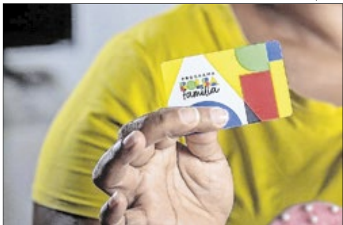
Bolsa Família é pago nos últimos 10 dias úteis do mês