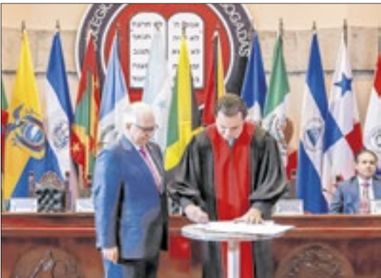
O presidente da Corte IDH, Rodrigo Mudrovitsch, assina acordo de cooperação com o STF, representado por seu presidente, Edson Fachin