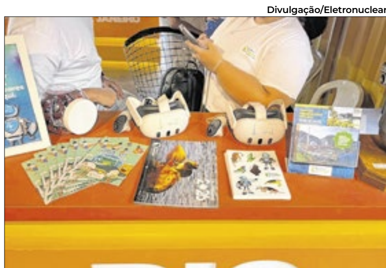
Usinas podem ser vistas por óculos de realidade virtual

O superintendente de Comunicação Institucional e Responsa-