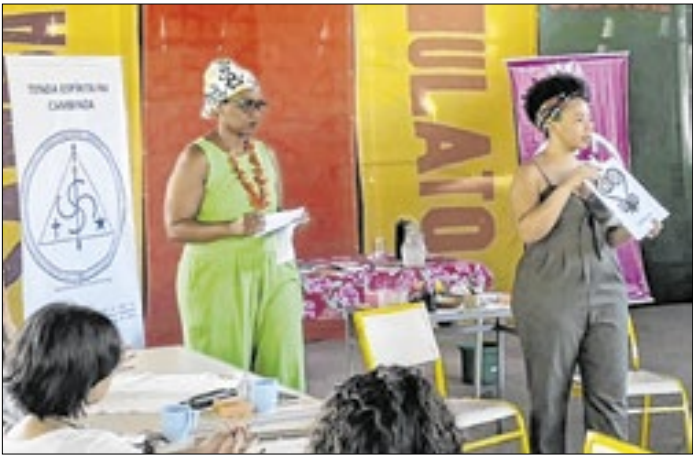
Evento acontece nesta quinta-feira (29)