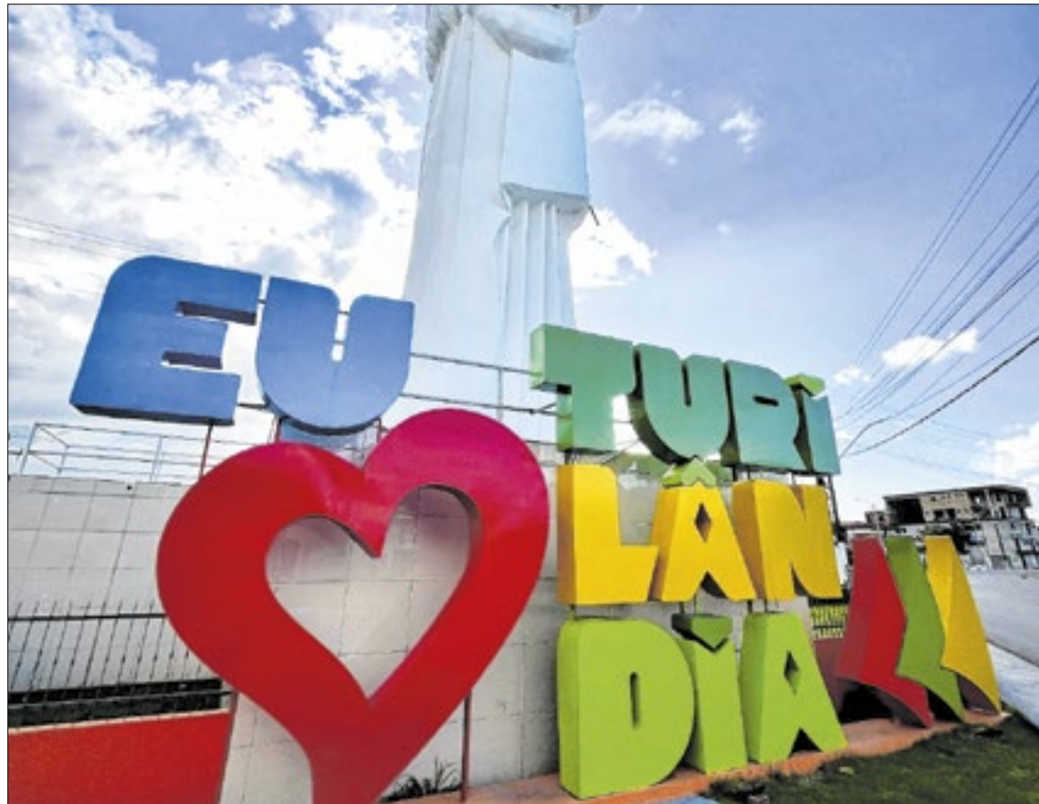
Turilândia, cidade próxima à São Luís, tem apenas 33 mil habitantes e muita história para contar

Com isso, o comando do município ficou, desde o dia 26, a cargo