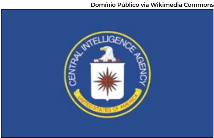
A CIA não respondeu a um pedido de comentário da CNN

As declarações foram feitas um dia após o governo Trump divulgar sua nova Estratégia de Defesa. O documento, publicado na última sexta pelo Departamento de Defesa dos EUA, afirma que Washington está pronta para adotar “ações decisivas” contra países vizinhos que não cooperarem com os interesses americanos. A meta é garantir a supremacia militar e comercial dos EUA “do Ártico à América do Sul” e defender seus interesses em todo o Hemisfério Ocidental.