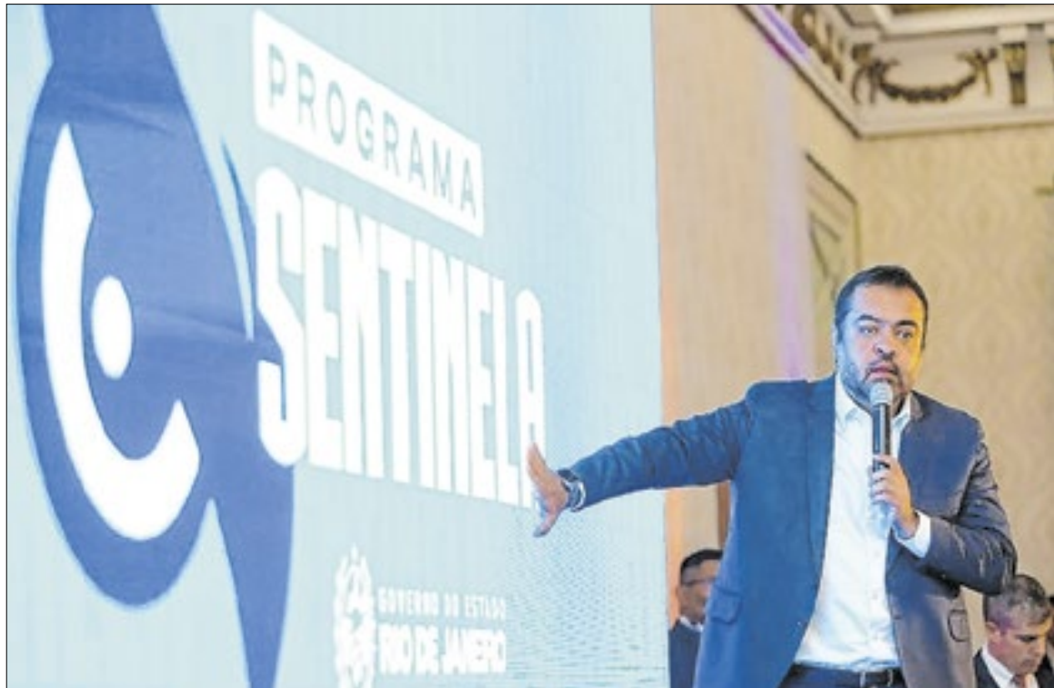
O governador Cláudio Castro fez a apresentação do processo de licitação para instalar 200 mil câmeras

O lançamento oficial do programa, realizado na sede do Governo do Estado, na Zona Sul, contou com as presenças do governador Cláudio Castro, do secretário de Estado de Polícia Militar e Polícia Civil, Coronel PM Menezes e Felipe Curi, prefeitos, autoridades e representantes da Segurança Pública do Rio de Janeiro.