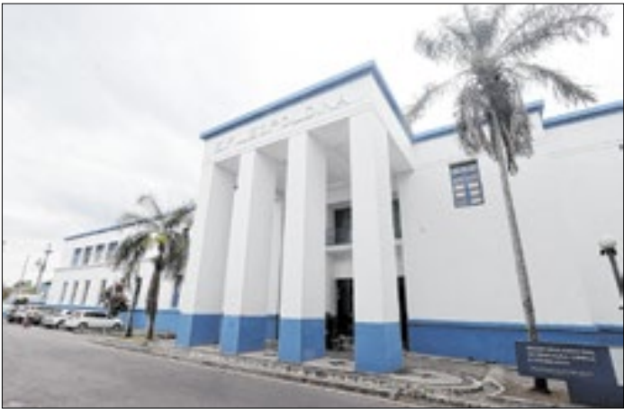
Ações têm como objetivo sensibilizar a comunidade escolar