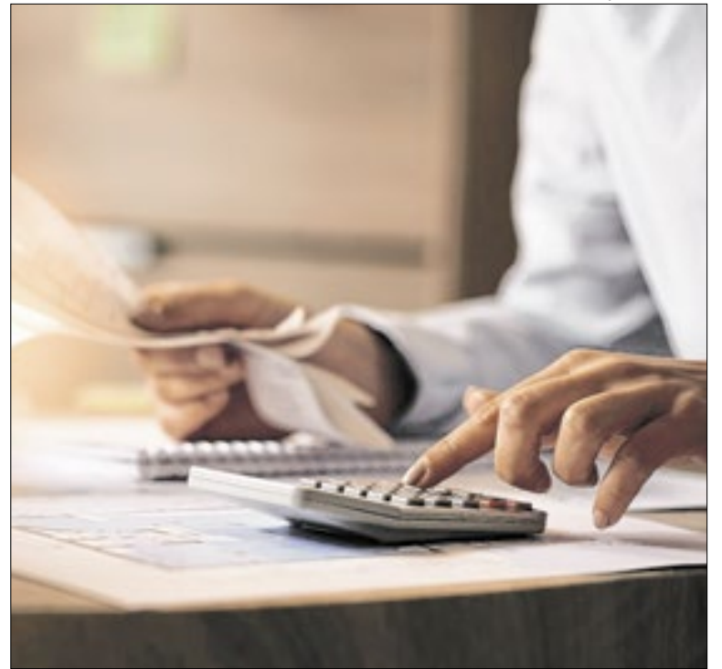
Empreendedores podem acompanhar o processo

Quando o Copom aumenta a Selic, a finalidade é conter a demanda aquecida; isso causa reflexos nos preços porque os juros mais altos encarecem o crédito e estimulam a poupança. Assim, taxas mais altas também podem dificultar a expansão da economia. Os bancos consideram outros fatores na hora de definir os juros.