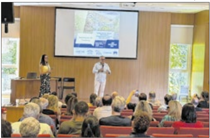
Evento é uma parceria da Prefeitura, do Comtur e do Sebrae