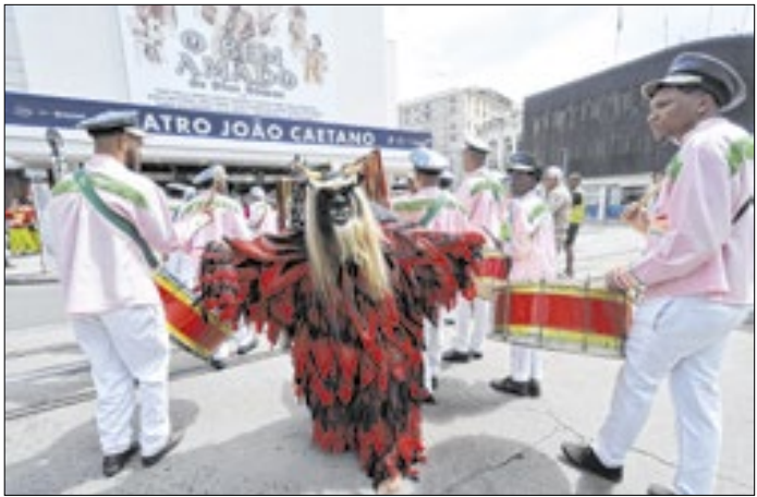
Tradição centenária ganha espaço no Theatro Municipal