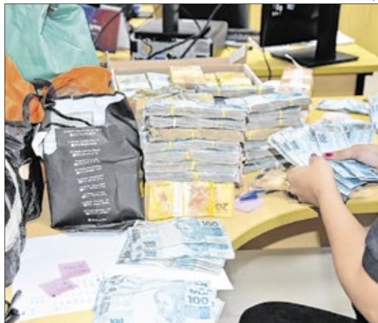
Operação Tântalo foi realizada em dezembro do ano passado

A operação contou com o apoio de promotores de justiça