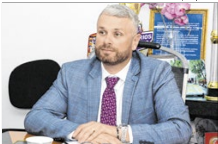
Nova companhia trará independência administrativa