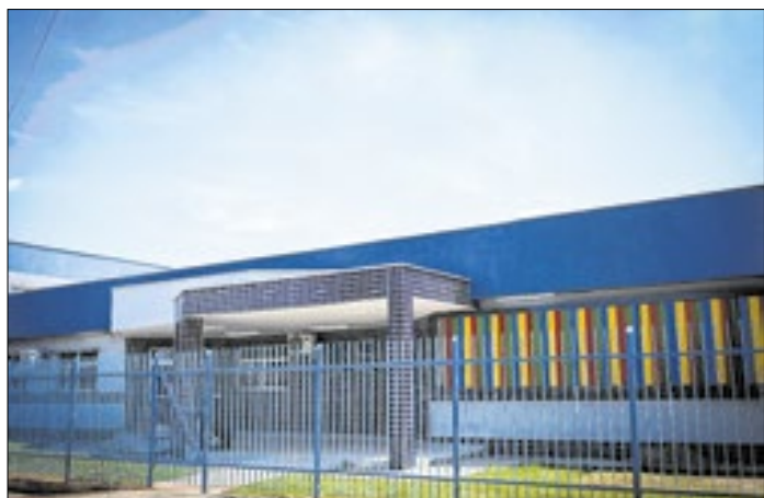
Fachada da creche no Piranema, que será inaugurada hoje