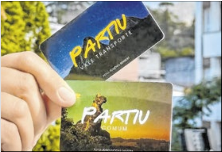
Cartão antigo será cancelado após o primeiro uso do novo

A Carreta da Saúde realiza até o próximo dia (31/01), na Praça Garcia, em Paraíba do Sul, exames e atendimentos à população. Os agendamentos são realizados na UBS cadastrada pelo morador. Entre os exames realizados estão: cco-cardiograma, ultrassonografia de abdômen total e ultrassonografia de próstata.