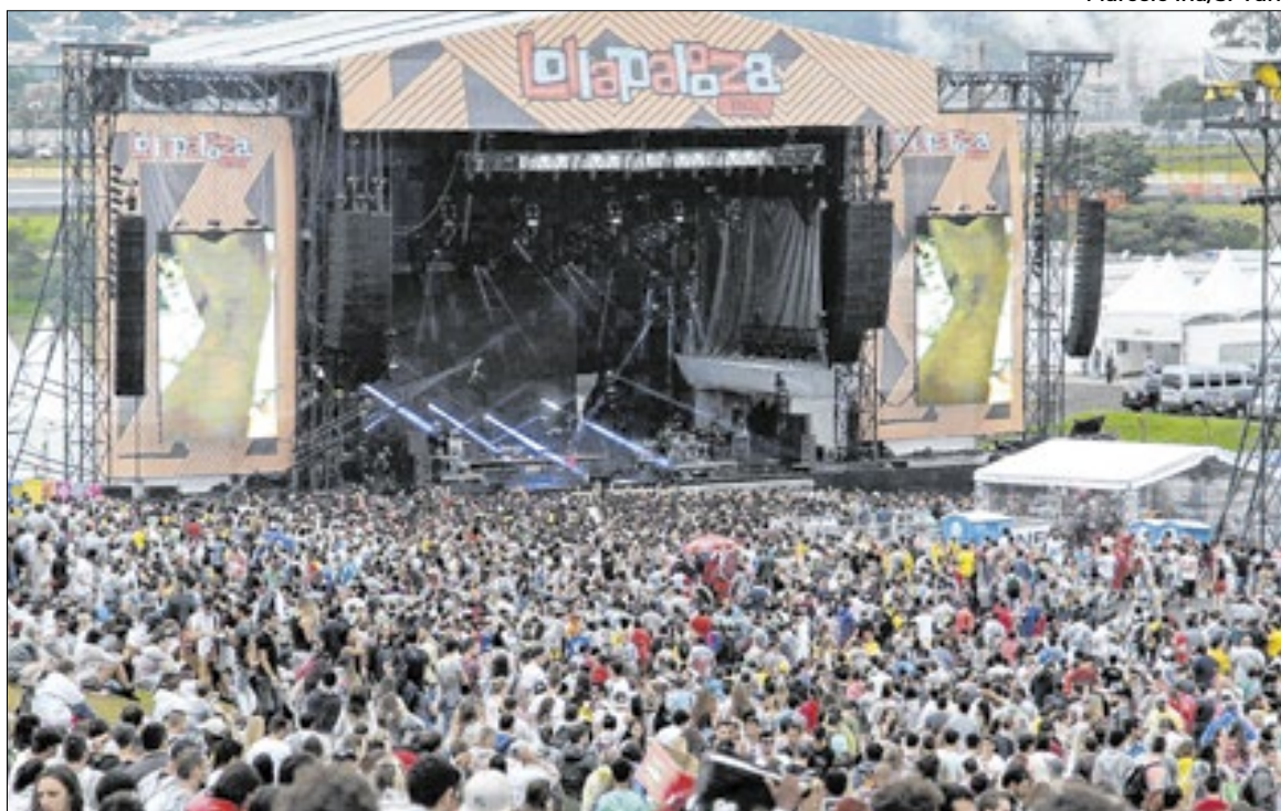
O Autódromo de Interlagos recebe, em março, mais uma edição do Lollapalooza Brasil

que admira e promete um show exclusivo, pensado especialmente para a ocasião.