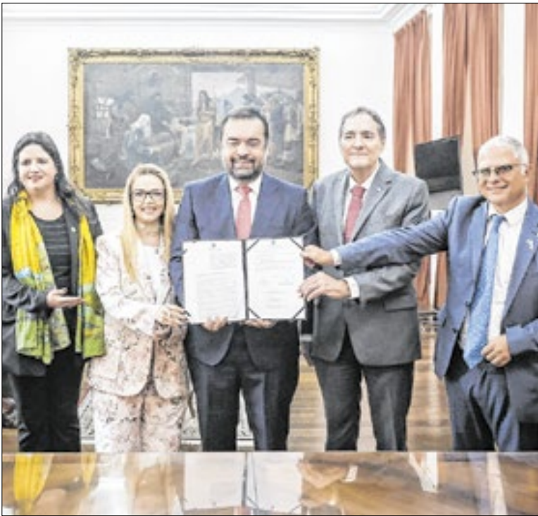
Cláudio Castro assina novo acordo com a OPAS

As novidades foram apresentadas em reunião realizada no auditório do Centro de Atendimento ao Turista, no Caminho Niemeyer, com a presença de representantes das escolas de samba, dirigentes da União das Escolas de Samba e Blocos Carnavalescos de Niterói e da Liga das Escolas de Samba de Niterói.