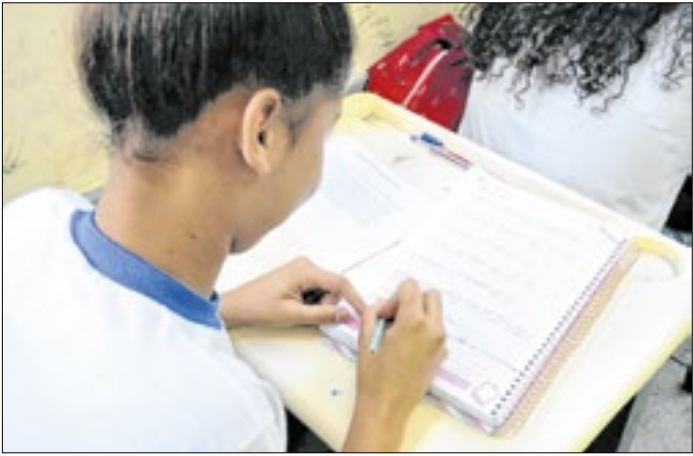
Unidades da rede municipal estarão abertas das 8h às 17h