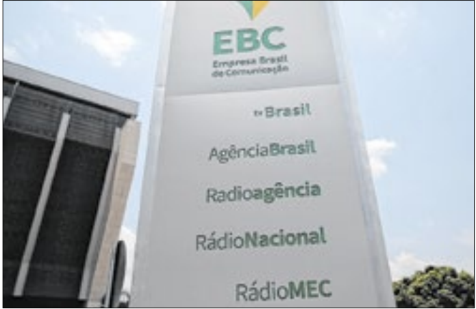
EBC tem que manter pagamentos do empregado