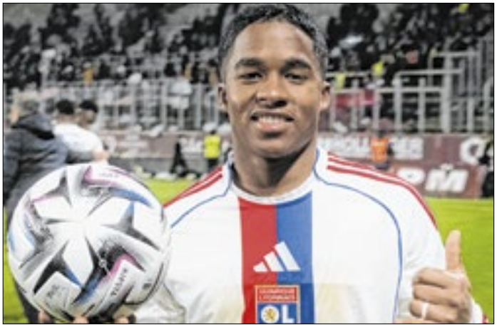
Endrick encantou a imprensa francesa com um hat-trick