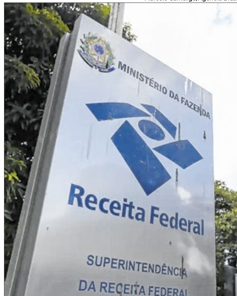
Receita Federal rebate fake news sobre cobrança de imposto