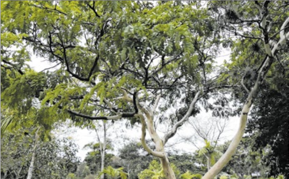
Segundo informação, será feita a supressão de uma árvore da espécie pau-ferro

A Prefeitura de Campinas informou que fará, nesta terça-feira (27), a supressão de uma árvore da espécie pau-ferro ( Libidibia ferrea ), localizada na rua Baronesa Geraldo de Resende, na região do Taquaral. Em comunicados oficiais sobre o bloqueio viário programado para a ação, a justificativa apresentada é a interferência da árvore na fiação da rede elétrica. No entanto, ao ser questionada sobre os motivos técnicos que levaram à decisão de derrubada, a administração municipal apontou outra causa: infestação por cupins e risco de queda. De acordo com o Departamento de Parques e Jardins (DPJ), a árvore estaria infestada por cupins, inclusive com ninhos na copa, o que representaria perigo para pedestres e veículos que circulam pelo local. Em nota, o departamento afirma que a extração de árvores só ocorre “quando realmente é necessário”, após avaliação técnica. “A árvore está infestada de cupins, inclusive com ninhos na copa, e, por isso, apresenta grande risco de queda sobre veículos e pedestres”, informou o DPJ, acrescentando que a decisão foi tomada com base em avaliação técnica, cujo laudo foi anexado ao processo.