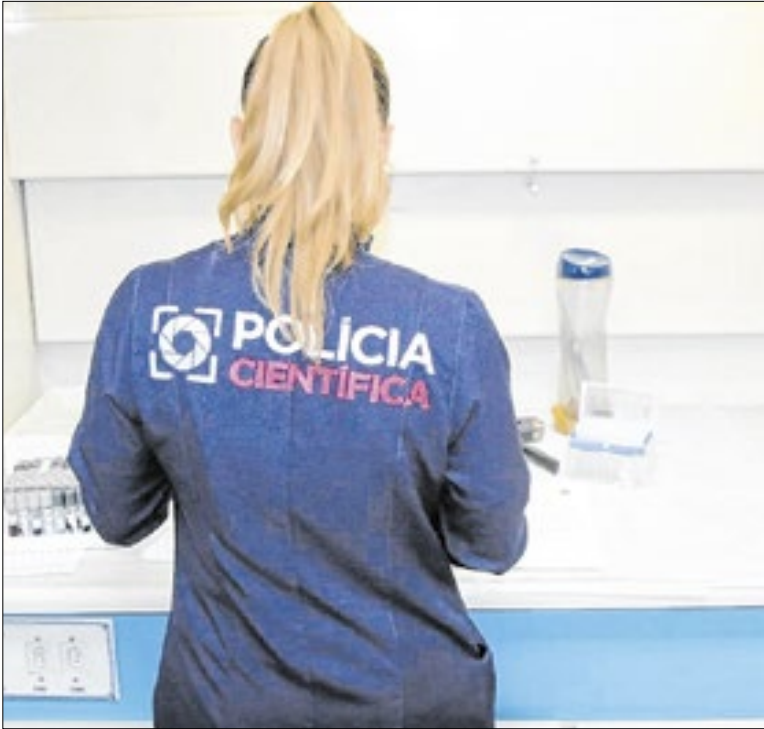
Laboratório é referência em crimes desde criação, em 1933

Estão abertas as inscrições para a 2ª edição do Prêmio Ester Sabino, que reconhece mulheres cientistas do estado de São Paulo. As indicações devem ser feitas por ICTs até 17 de fevereiro, pelo site inovacao.sp.gov.br. A premiação será realizada em março de 2026, em cerimônia especial no estado.