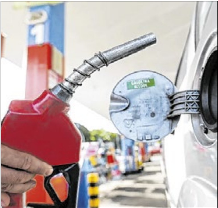
Petrobras reduz preço da gasolina em 5,2% nas distribuidoras

O maior percentual de atendidas em Campinas com bulimia e anorexia é de garotas com idades entre 10 e 19 anos, representando 27,3% dos atendimentos, segundo dados da Secretaria Municipal de Saúde. Na sequência, aparecem mulheres de 30 a 39 anos de idade, em 23,6% dos registros.