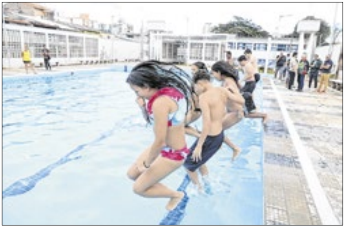
Piscina semiolímpica tem 25 metros de extensão