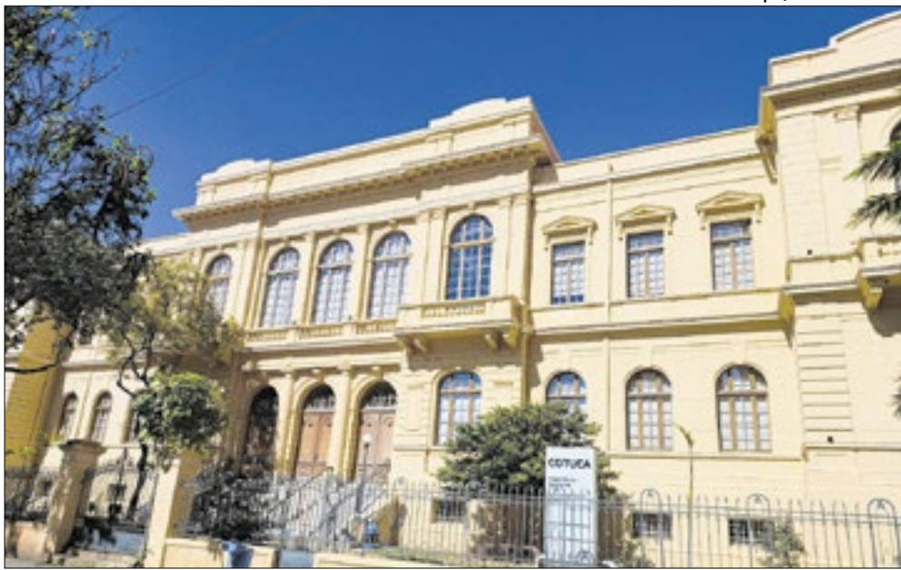
Joalpe/CC BY-SA 4.0