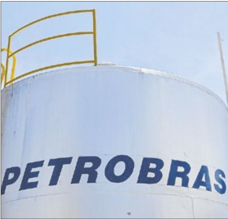
Preço de gasolina A tem queda nas distribuidoras

Segundo ele, o método aplicado é resultado de anos de estudo e prática clínica, voltado para o alívio da dor, reeducação postural e recuperação funcional sem necessidade de cirurgia. “O modelo de atendimento, 100% focado na individualidade do paciente, se tornou um diferencial competitivo no mercado de clínicas e reabilitação”, finaliza.