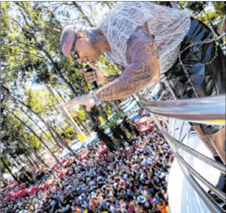
Para o desfile de 2026, artista prepara repertório especial

Os números nas plataformas digitais ajudam a explicar esse sucesso. Léo Santana soma mais de