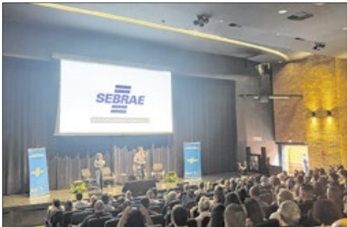
Resultados de 2025 serão apresentados durante o evento