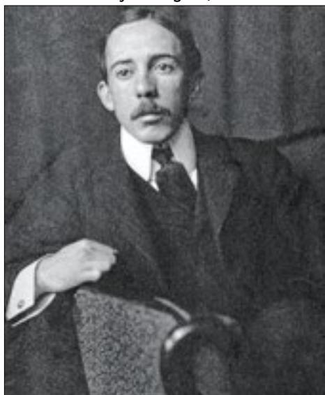
Santos Dumont, o ‘Pai da aviação’