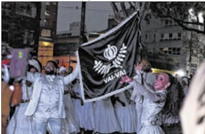
Público acompanhou trechos do novo enredo da escola