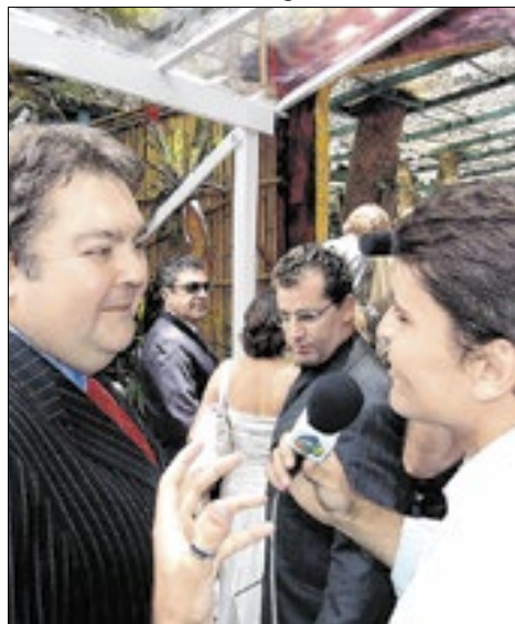
Fausto Silva, ex-apresentador