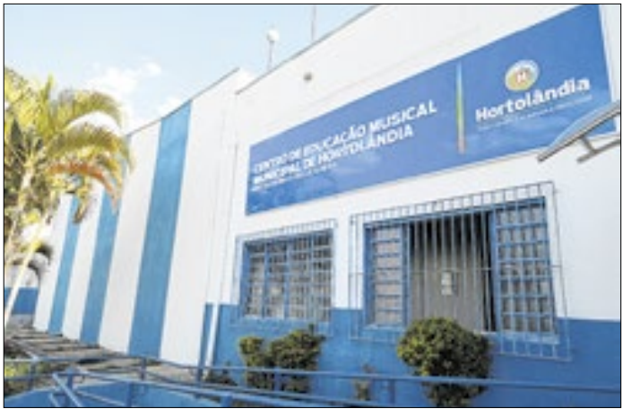
Reforma ampliará a capacidade de 240 para 500 alunos