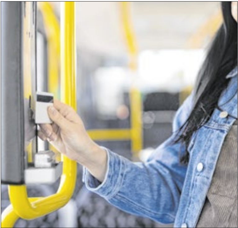
Governo de SP reforça que essa comercialização é crime

Para garantir a vaga, o tutor deve informar o número do Registro Geral Animal (RGA). É preciso que o pet tenha idade entre 7 meses e 7 anos e peso inferior a 25 kg. Ao todo, nesta ação, estão disponíveis 250 vagas: 70 para cães fêmeas, 60 para cães machos, 70 para gatos fêmeas e 50 para gatos machos.