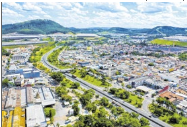
Empresas e comércios poderão inscrever equipes

As competições estão previstas para março e abril, com a grande final marcada para 1º de maio, data em que se comemora o Dia do Trabalhador. A programação busca reforçar o caráter simbólico da data e incentivar a participação comunitária. Podem se inscrever