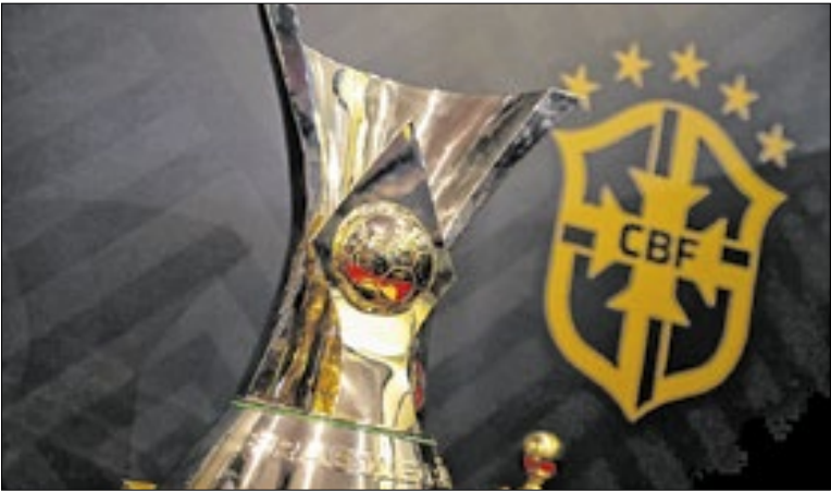
Melhora no nível técnico pode atrair jogadores mais jovens

O mais longo dos pontos corridos A edição 2026 é a primeira que começará em janeiro, no dia 28. A data de início mais próxima disso pertence aos Brasileiros de 2003 e 2025: 29 de março. Os dois anos citados tinham o maior número de dias em disputa: 260 para 2003, 254 para 2025. A edição 2026 terá 308 dias, de acordo com o calendário da CBF. Maio é o mês em que o Campeonato Brasileiro começou mais vezes, com 11 edições, seguido por abril, com duas a menos. Dezembro