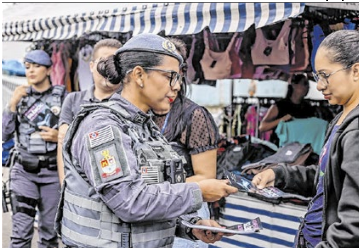
Equipe distribui folders informativos sobre o assunto no Boulevard Major Paula Lopes

A ação ocorreu em dois momentos ao longo do dia. Pela manhã, às 9 horas, a equipe esteve na Feira Livre do bairro Nogueira, e, à tarde, às 13h30, no Boulevard Major Paula Lopes, o Calçadão. A iniciativa contou com a participação da