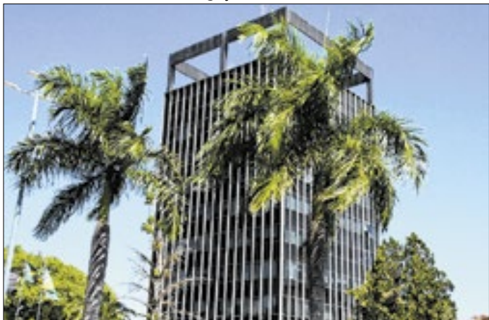
Prédio da Prefeitura de Santa Bárbara d'Oeste