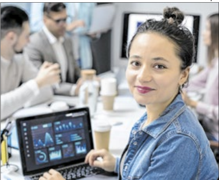
Projetos devem ser formados por, no mínimo, dois integrantes

O VAI TEC é direcionado a negócios inovadores, formalizados ou não, que utilizem a tecnologia como elemento central do modelo de atuação e apresentem potencial de impacto econômico e social. O programa contempla todas as regiões da capital paulista, com atenção especial aos ter-