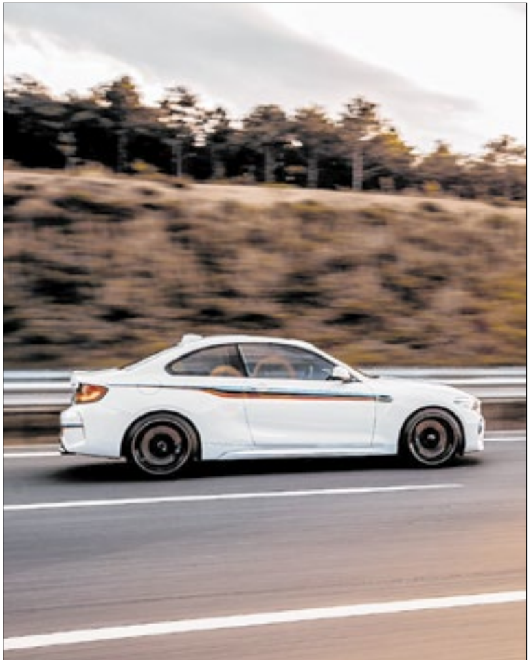
Excesso de velocidade concentra 56,6% das infrações de trânsito

perigosas de Campinas, concentrando 14,2% (32) dos óbitos em sinistros de trânsito registrados entre 2022 e 2024. Em 2024, foram expedidas 951.776 penalidades, sendo 594.381 (62,4%) por excesso de velocidade e 92.534 (9,7%) por avanço semafórico. Assim, as 799.016 infrações expedidas em 2025 representam uma queda de mais de 16% em relação ao balanço de 2024. Diversas ações para coibir as condutas de risco no trânsito foram adotadas pela Emdec e explicam a queda no total de infrações, principalmente no que se refere ao excesso de velocidade. Os radares estão cumprindo a função educativa: a queda no número de infrações por excesso de velocidade indica que a presença da fiscalização eletrônica vem cumprindo seu papel de coibir essa prática. Expansão das operações integradas de fiscalização: foram 295 blitzes realizadas no ano passado e 127 em 2024.