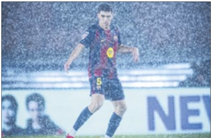
Jogo foi realizado em meio a um temporal intenso