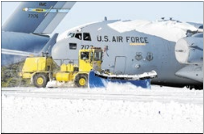
Situação da neve impede a decolagem e pouso de aviões