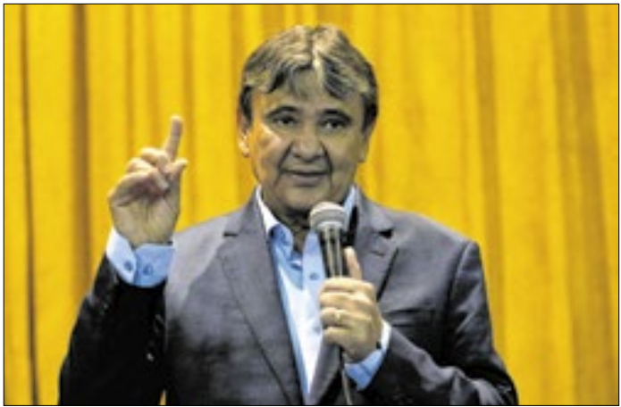
Ministro Wellington Dias: ajuda aos mais pobres