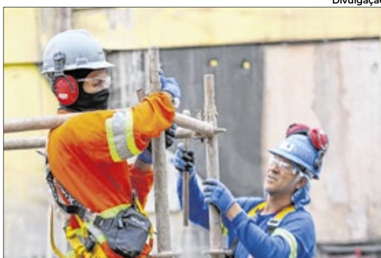
Trabalhadores de São Paulo também contam com plataforma

Entre os PATs com mais vagas estão os de Santana de Parnaíba, com 1.476 vagas, Embu, com 688, Itapeverica da Serra, com 633, Indaiatuba, com 606, e Itapevi, com 587 oportunidades. A distribuição por regiões administrativas mostra que a Região de São Paulo concentra o maior número de postos, com 6.195 vagas, seguida por Campinas, com 3.952, Sorocaba, com 1.575, São José dos Campos, com 757, e Santos, com 722. Outras regiões,