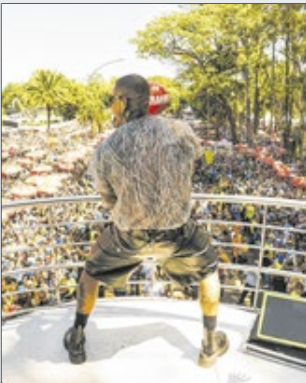
Trio será no dia 22 de fevereiro

É o segundo ano seguido, que o cantor baiano comanda o bloco Vem com o Gigante, que desfila no dia 22 às 9h, encerrando o carnaval de SP