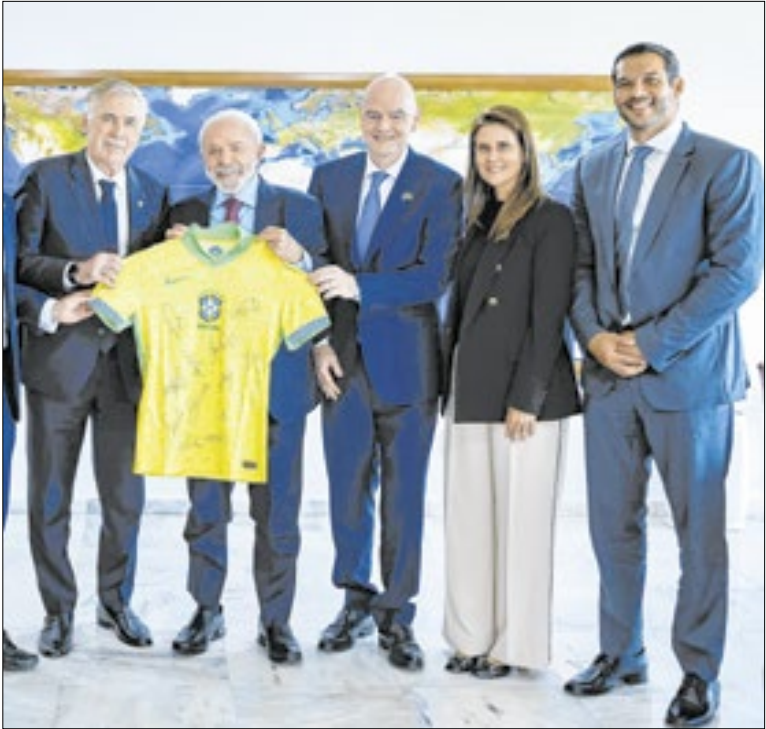
Presidente da FIFA teve reunião no Palácio do Planalto