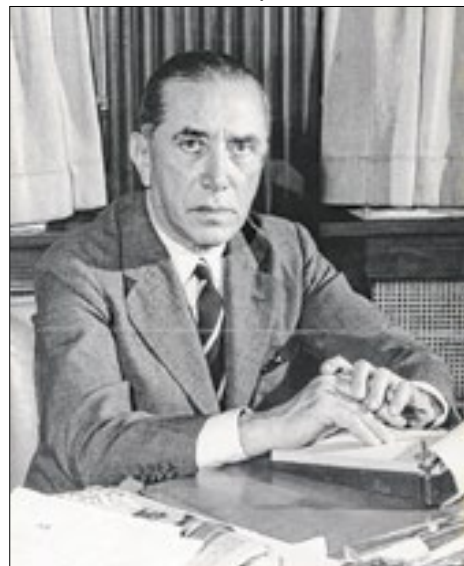
Júlio de Mesquita Filho, jornalista