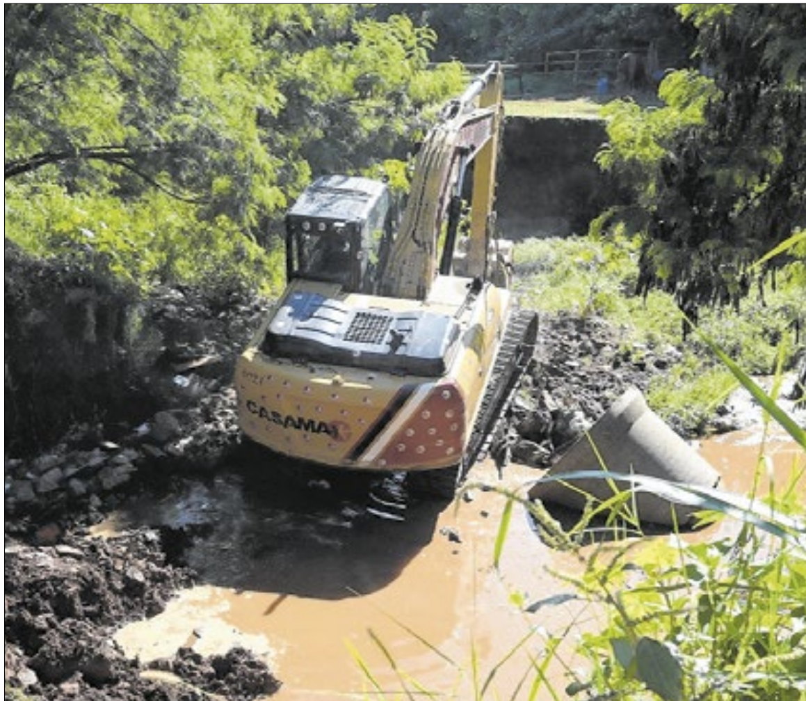
Fernanda Sunega/ Prefeitura de Campinas

A previsão oficial é de que as atividades sejam finalizadas no período de uma semana, embora a administração municipal ressalte que a continuidade do serviço e o cumprimento desse prazo estão estritamente vinculados às condições climáticas, podendo haver prorrogações caso ocorram precipitações fortes que impeçam o manuseio seguro da terra.