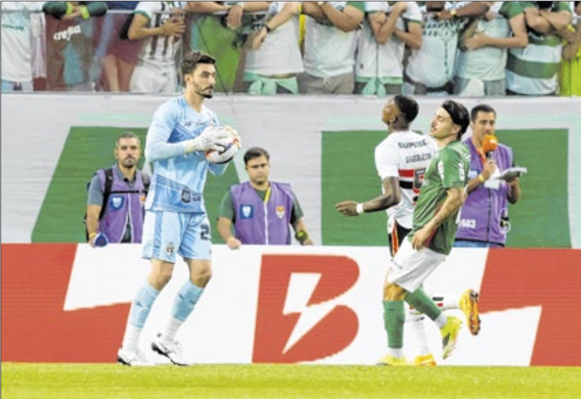
Tricolor vai analisar outros campeonatos com base em seu desempenho no Brasileirão 2026

O São Paulo priorizará o Campeonato Brasileiro mesmo em meio à situação delicada no Paulista. O time estreia no nacional nesta quarta (28), contra o Flamengo. A sequência ruim no Campeonato Paulista jogou luz na prioridade do São Paulo para 2026: escapar do rebaixamento no Brasileirão. “Prioridade é o Brasileirão e lutar até dezembro. No meio, temos a possibilidade de ir para as quartas de Paulistão, Sul-Americana, mas a prioridade são os 45 pontos. No meio, podem acontecer coisas. Vamos saber se os moleques que vêm terão boa adaptação, se temos reforços. O foco está nos 45 pontos. Quando vamos alcançar? Temos toda a temporada para fazer, mas focados e jogando assim, acho que vamos chegar e fazer ainda mais pontos”, disse o técnico Hernán Crespo, após o clássico contra o Palmeiras. O clube admite preocupação com a situação delicada na tabela do estadual e já definiu que priorizará a rotação de elenco com foco nos jogos do nacional. Por isso, os jogos de copas serão avaliados pontualmente. Crespo rodou o elenco, por