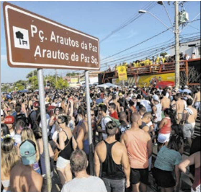
Expectativa de crescimento reflete o cenário regional

A Secretaria de Segurança Pública de Artur Nogueira realizou, neste domingo (25), a segunda fase da Operação Via Segura. A ação teve como foco o combate a furtos e roubos de motocicletas e a fiscalização de escapamentos. A operação contou com agentes, que atuaram com abordagens e verificação de documentos.