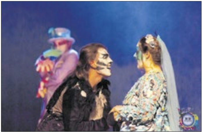
Mais do que história de amor, peça propõe reflexão