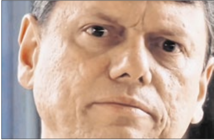
Publicação foi feita pelo governador no sábado (24)