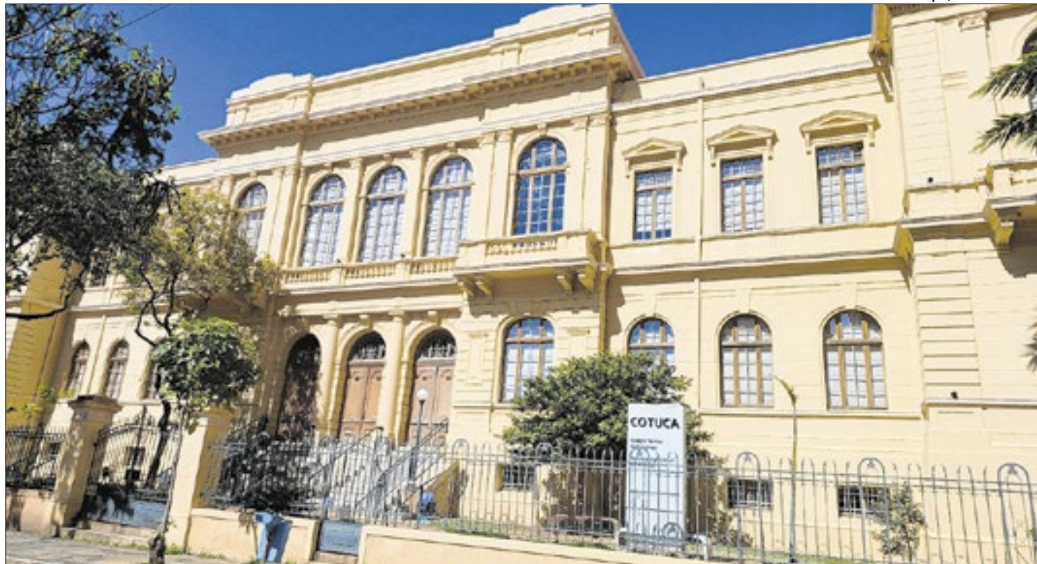
Escola Estadual é a instituição de ensino médio mais antiga do Brasil e funcionamento no mesmo prédio

Fundado por idealistas maçons, a instituição nasceu com um propósito ousado para a época: o de oferecer ensino laico, com qualidade e caráter progressista, que incentivasse o livre pensamento e a formação intelectual dos jovens alunos