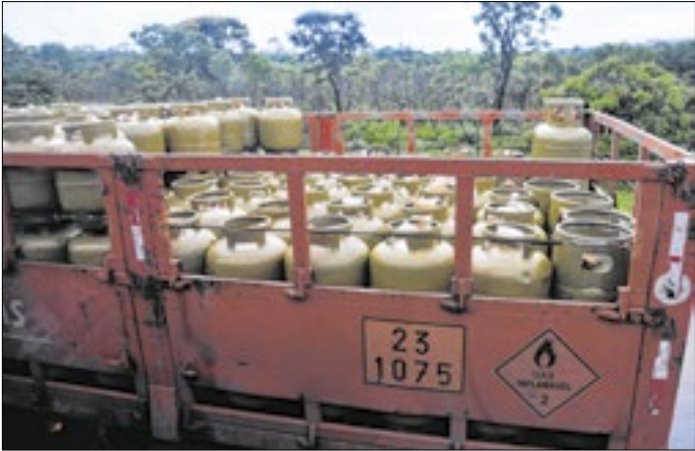
Botijão de gás será mais acessível às famílias