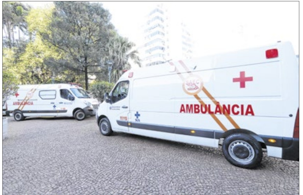
Ambulância do SAEC: utilizadas para realizar entrega de medicamentos aos Centros de Saúde

Veículos do SAEC foram usados para entregar medicamentos a unidades de saúde