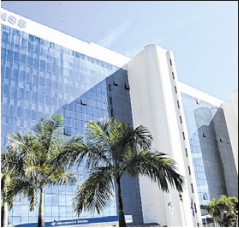
Mesmo com sistema off, INSS mantém meta do funcionalismo

Para a entidade, o novo concurso é necessário, mas não deve substituir a nomeação de todos os aprovados no cadastro de reserva do último certame. O Sindilegis destaca a retomada do concurso para Técnico Legislativo, que não era realizado há bastante tempo, à exceção das seleções específicas para a Polícia Legislativa Federal (PLF).