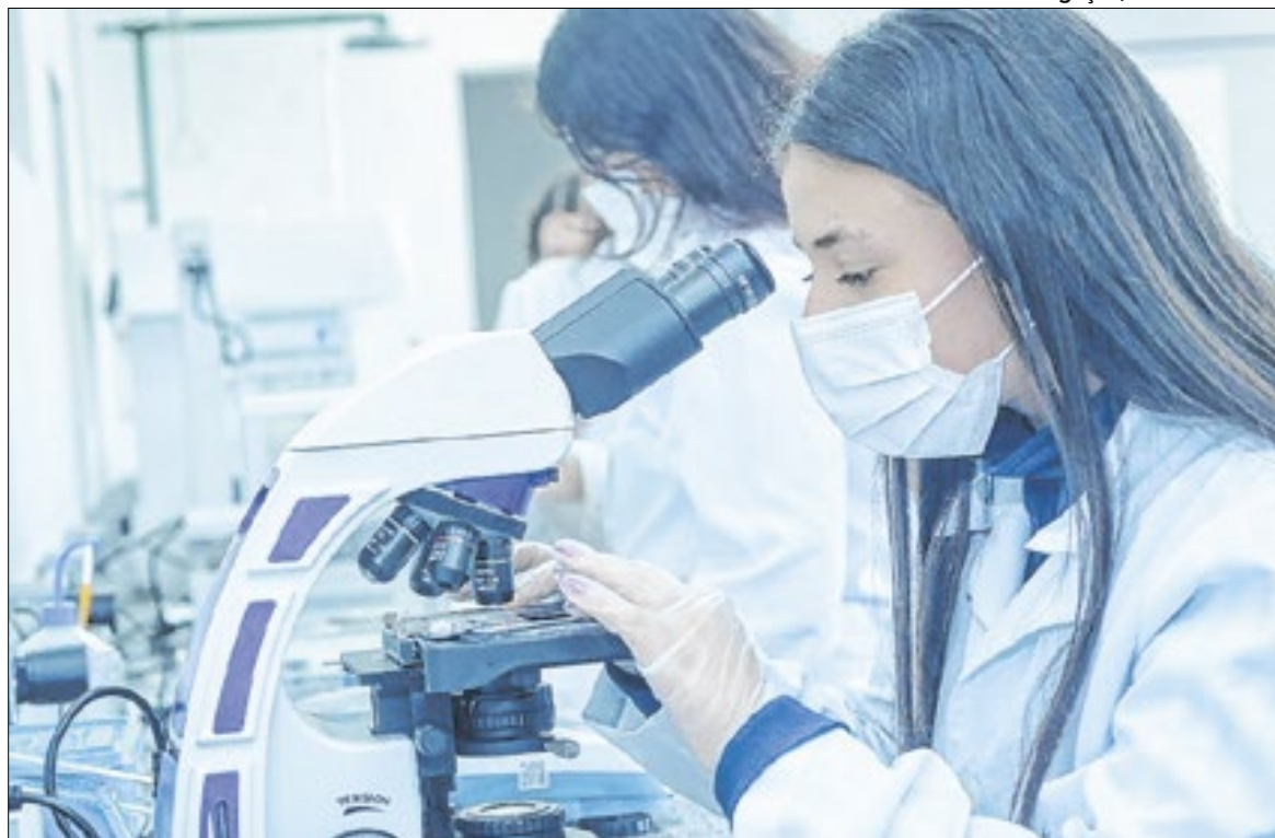
A premiação será entregue em celebração ao Dia Internacional da Mulher

Iniciativa do Governo de SP recebe indicações até 17 de fevereiro e valoriza pesquisadoras