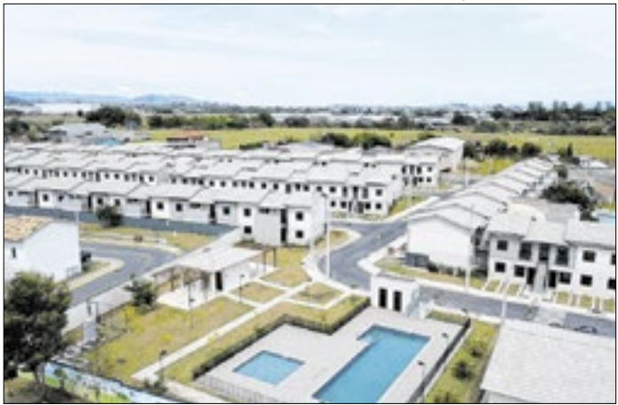
Comunicado de abertura de adesões foi em 22 de janeiro