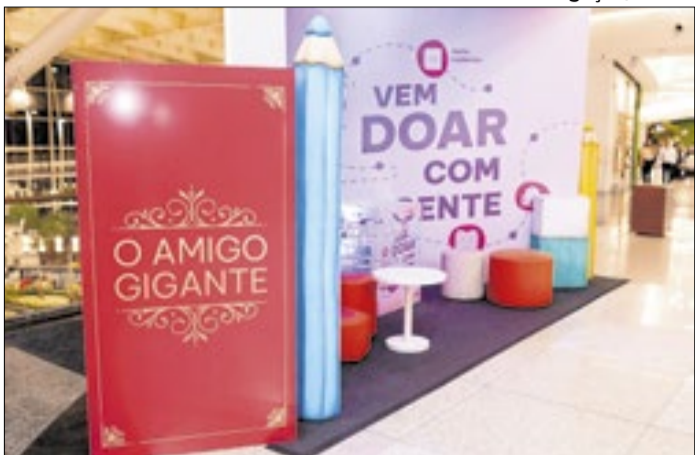
Ação arrecada materiais escolares para crianças e jovens