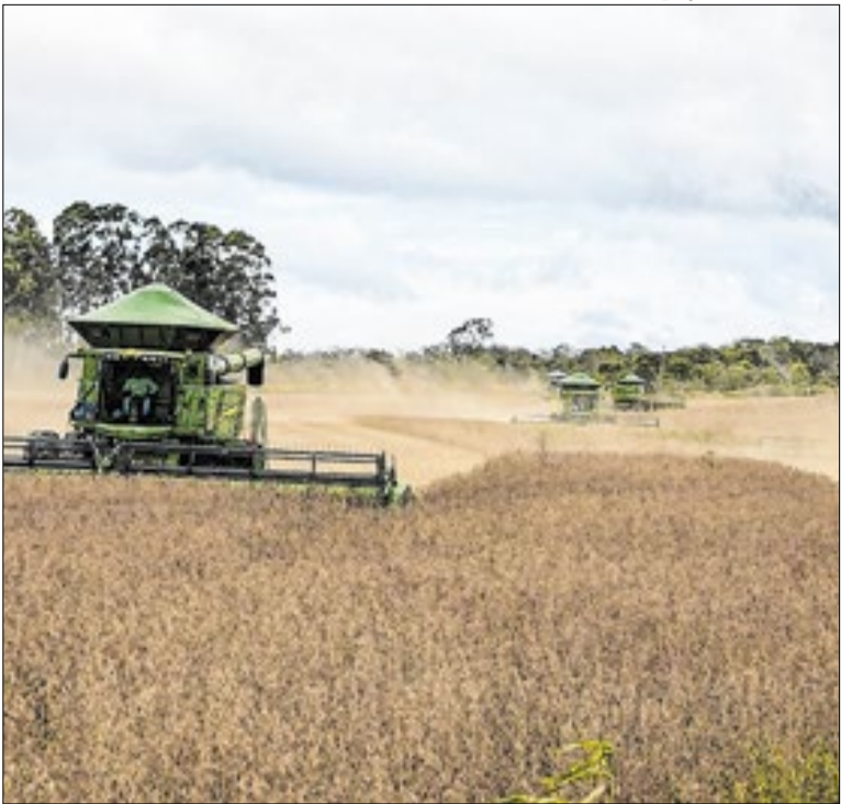
Soja segue como principal cultura agrícola do estado

A prefeitura de Campo Grande (MS) iniciou o mapeamento anual da rede hoteleira do município. O levantamento identifica capacidade de hospedagem, serviços e condições de acessibilidade por meio de visitas presenciais. A ação abrange 72 meios de hospedagem e orienta o planejamento do turismo local.