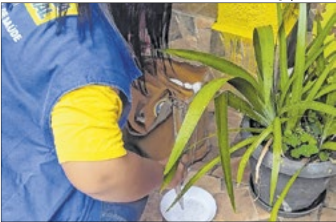
Equipes percorreram bairros vistoriando residências