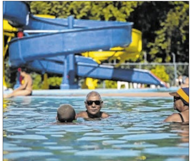
Programação incluirá apresentação musical no intervalo

A inscrição exige, por fim, a apresentação do quadro de horários do curso atestado pelo candidato; laudo médico, caso o inscrito seja PCD; e comprovantes do PROUNI, FIES e do CadÚnico, se aplicável. A comissão poderá solicitar documentos adicionais dos candidatos, caso julgue necessário.