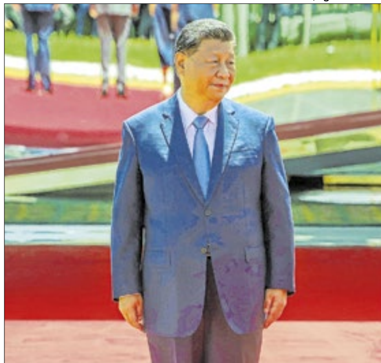
Xi Jinping quer combater a corrupção dos militares na China