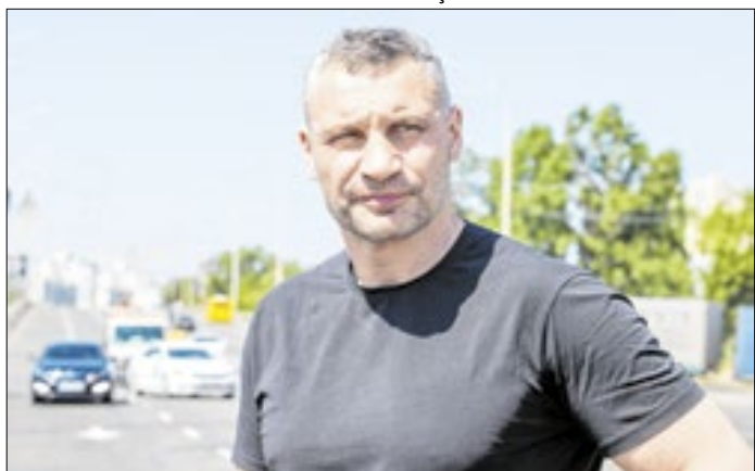
Prefeito de Kiev confirmou que houve uma morte na capital

Administração Estadual da Cidade de Kiev