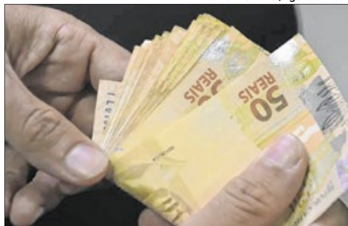
Cinco de cada 10 aposentados precisaram do consignado