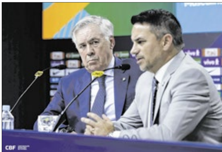
Comissão está de olho nos atletas da Champions League