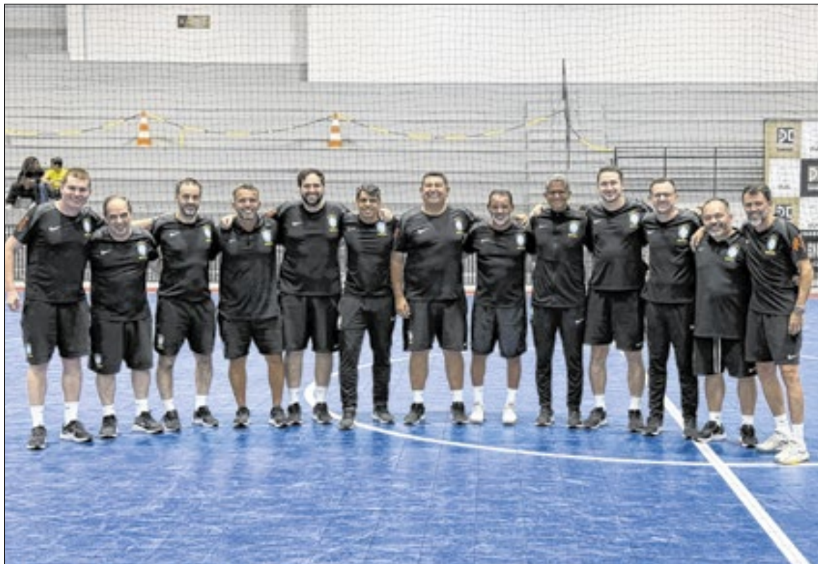
Comissões técnicas das Seleções Brasileiras de Futsal e de Beach Soccer durante o intercâmbio