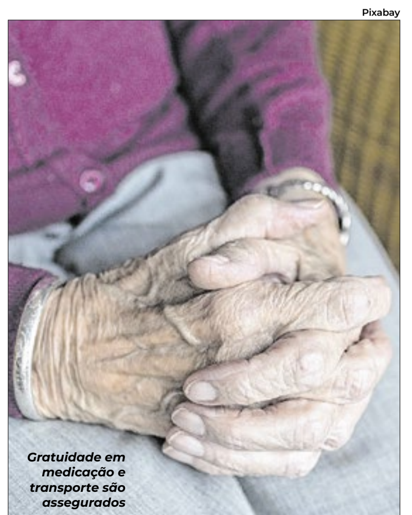
Gratuidade em medicação e transporte são assegurados

Idosos acima de 60 anos têm o direito de circular sem pagar a passagem. E também têm acesso a medicamentos gratuitos, conforme estabelecido no Art. 15 do Estatuto da Pessoa Idosa (Lei nº 10.741/2003).