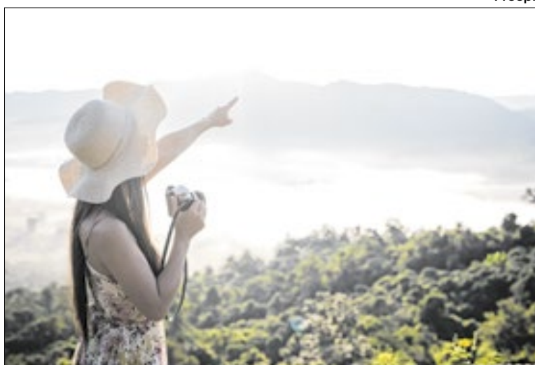
Resultado impulsionado por agenda de grandes eventos

O resultado foi impulsionado pela realização de grandes eventos culturais, esportivos e de entretenimento, além da retomada de competições internacionais e exposições de grande porte. A agenda diversificada reforçou a imagem da cidade como destino global e movimentou diferentes regiões da capital. O faturamento do setor turístico chegou a R$ 25,4 bilhões em 2025, alta de 11,5% na comparação com 2024. Do total de turistas, 44,7 mi-