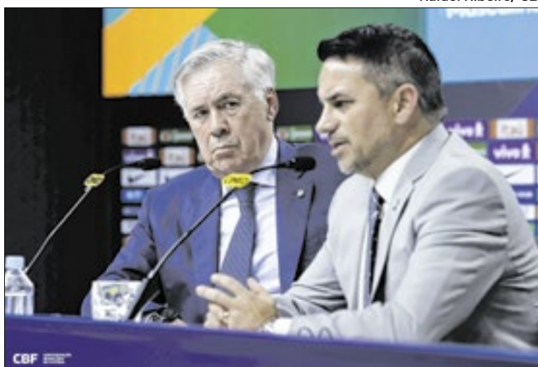
Comissão está de olho nos atletas da Champions League