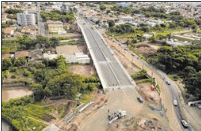
Dispositivo está com 90% das obras concluídas