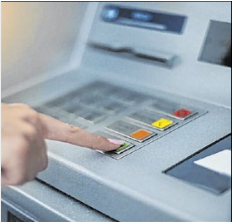
Calendário do INSS vai de 26 de janeiro a 6 de fevereiro

A pesquisa a pedido do Serasa foi realizada pelo Instituto Opinion Box, com coleta entre 22 de dezembro de 2025 e 11 de janeiro de 2026, ouvindo 952 aposentados. A margem de erro é de 2,6 pontos percentuais. Para quem tem dúvidas de como se organizar, a Serasa disponibiliza informações em seu site ( www.serasa.com.br ).