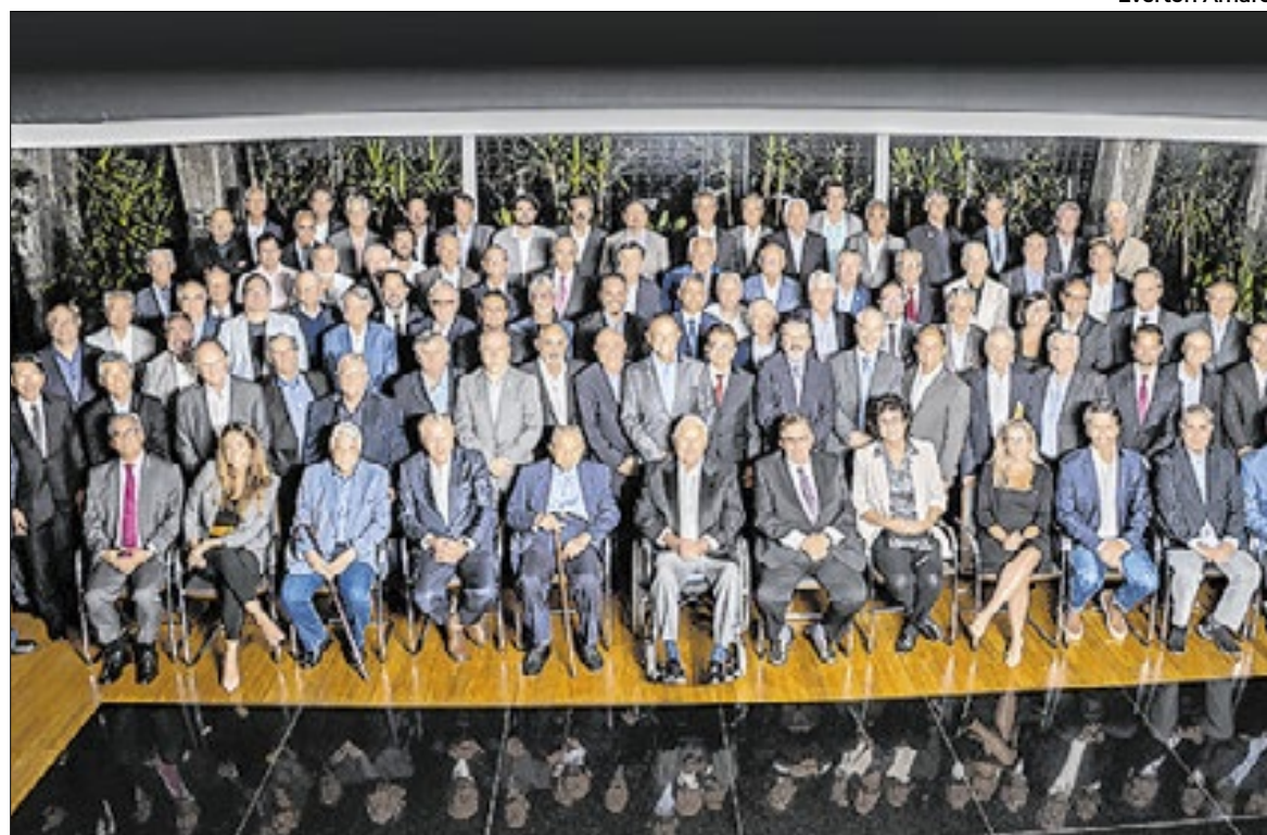
Cerimônia de diplomação da nova diretoria da Fiesp para o quadriênio 2026-2029

Com a diplomação concluída e a estrutura de Conselhos em funcionamento, a Federação das Indústrias inicia oficialmente o período de gestão 2026-2029. A expectativa da entidade é que, durante o mandato, os fóruns de discussão contribuam para debates estratégicos em áreas como comércio exterior, reformas tributária e trabalhista, educação, segurança, meio ambiente e agronegócio.