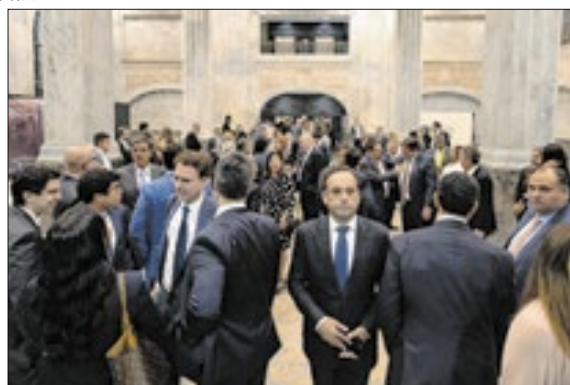
Estiveram presentes na cerimônia autoridades, representantes das instituições jurídicas, e políticos