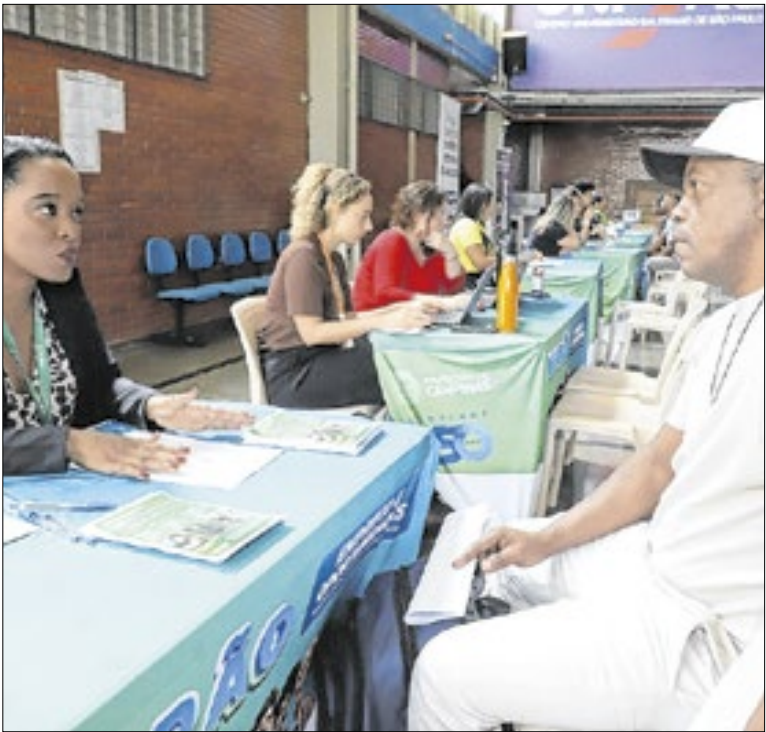
Evento é benéfico tanto para a população quanto empresas

Inspirado no trabalho do artista Vik Muniz, o Educativo do SESI Campinas convida o público a pintar usando materiais orgânicos, como terra, café e beterraba. Além disso, convida a explorar as possibilidades criativas dos elementos, refletindo sobre o papel na criação das tintas. Nesta sexta-feira (23) às 14h.