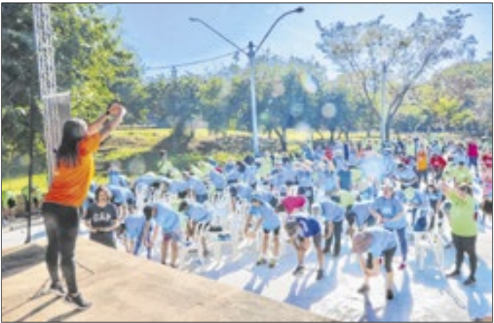
Participação no evento é gratuita e não precisa agendar