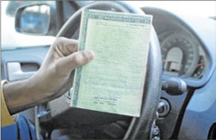
Quadrilhas usam sites falsos para emitir boletos do IPVA