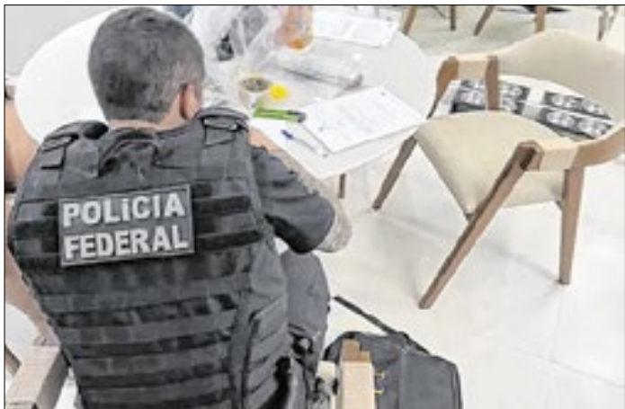
Policial Federal durante a Operação Sem Lastro