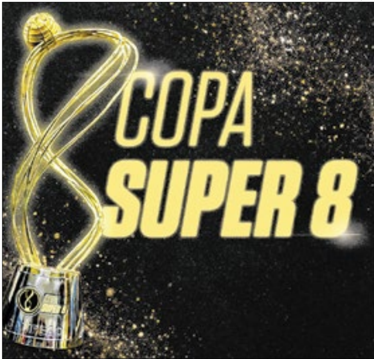
Vencedor se classifica para a Champions League das Américas

Depois da goleada sofrida para o Novorizontino, o Palmeiras vai para o clássico deste sábado (24) com força máxima. O Alviverde recebe o São Paulo na Arena Barueri às 18h30 e contará com as voltas de Felipe Anderson, Vitor Roque e Andreas Pereira. Todos recuperados de lesões. Será a primeira vez que o Palmeiras jogará “todo titular”.