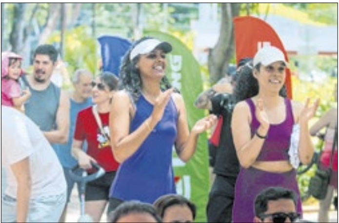
Projeto seguirá com aulas quinzenais ao longo do ano