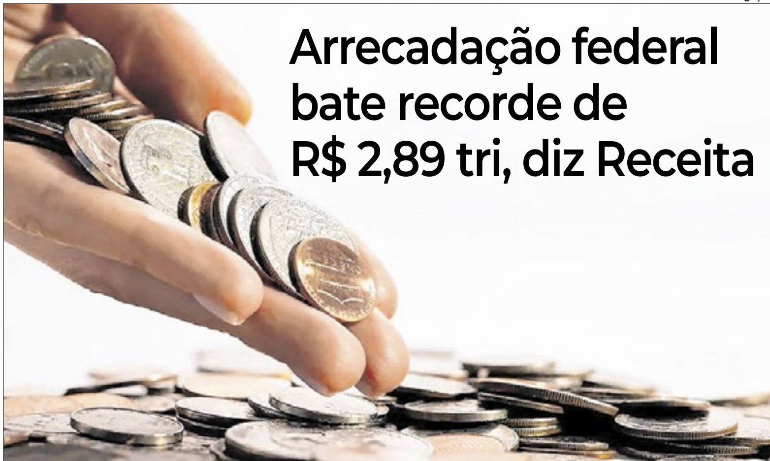
‘Efeito Taxad’ pode ter dado uma mãozinha para a arrecadação federal no ano passado