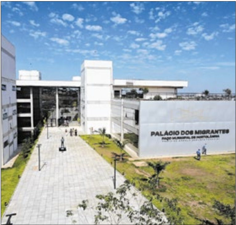
Medida foi anunciada em reunião realizada no Paço Municipal