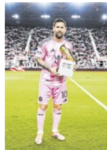
Inter Miami sonha em jogar a Libertadores com Messi

A Seleção Brasileira de futsal estreia na Copa América no dia 24/1, contra a Colômbia. O torneio será disputado no Paraguai.