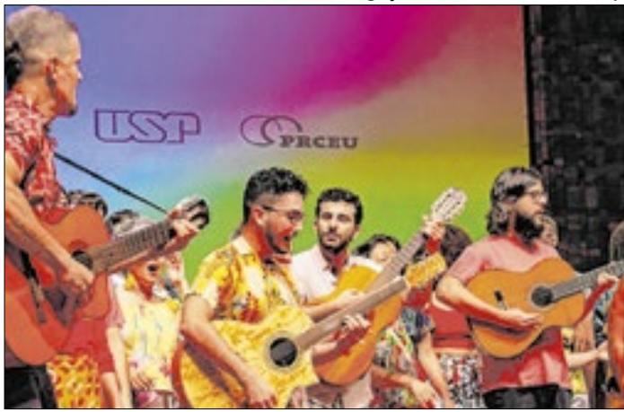
O Coralusp é formado por 14 grupos