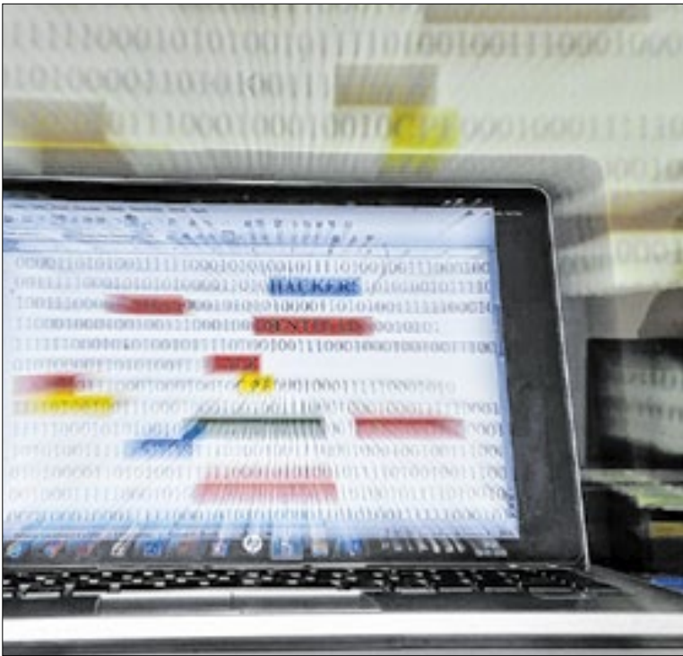
Propostas sobre proteção de dados são debatidas no Congresso