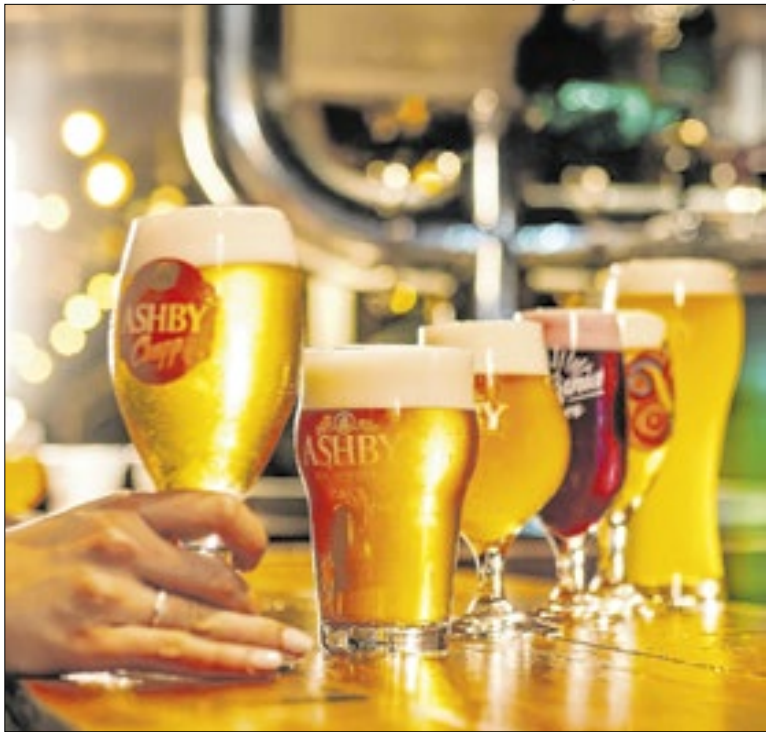
Ashby foi criada em 1993 pelo estadunidense Scott Ashby

O CAPS IJ de Piracicaba passou a atender em novo endereço. O serviço agora funciona na rua Floriano Carraro, 425, em Nova Piracicaba. Atualmente, a unidade possui aproximadamente 1.350 crianças e adolescentes com prontuário ativo. Devido à mudança, os atendimentos serão retomados em 26 de janeiro, segunda-feira.