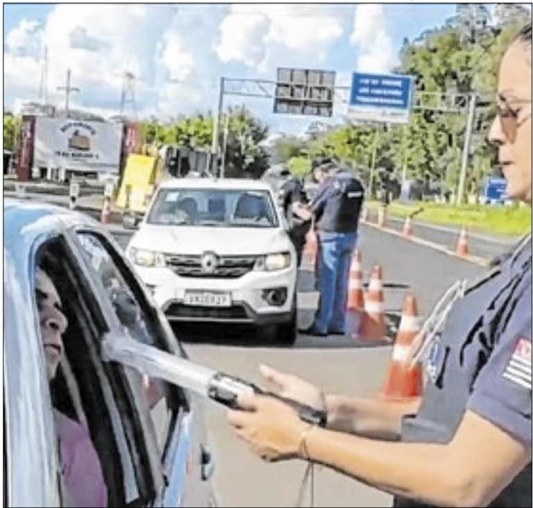
Para 2026, estão previstos avanços no uso de dados

Para celebrar os 472 anos de São Paulo, a CPTM promove circulação especial do trem temático Ayrton Senna na Linha 11-Coral. Entre 22 e 24 de janeiro, a composição exibe obras de artistas que retratam a trajetória do piloto. A ação integra a programação do aniversário da capital. As viagens são exclusivas e comemorativas.