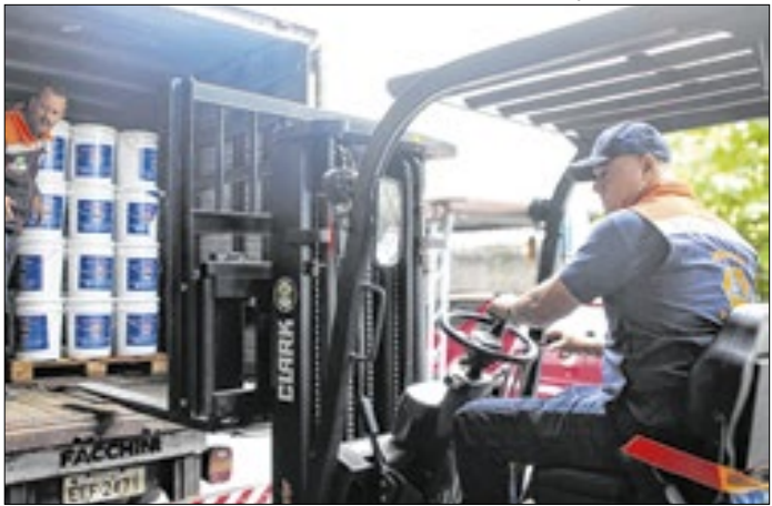
Peruíbe foi atingida por um acumulado de 171 milímetros