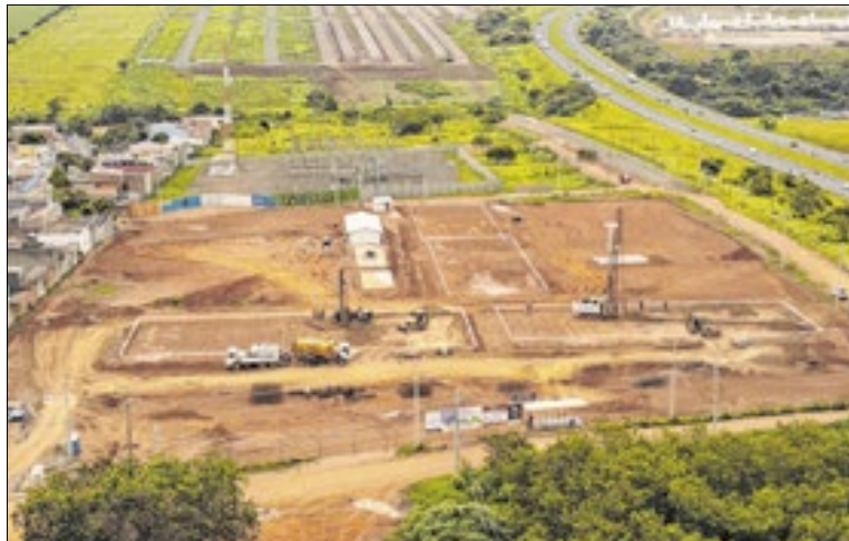
Construção no Jardim Amanda marca avanço na habitação

As primeiras etapas das obras de habitação popular no Jardim Amanda, em Hortolândia já estão em andamento. O empreendimento integra o Programa Minha Casa, Minha Vida e vai beneficiar 400 famílias. No local, a terraplenagem foi finalizada e os trabalhos avançam para a perfuração do solo e fase inicial da implantação da estrutura dos novos apartamentos.