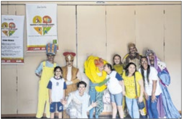
Todas as apresentações foram realizadas na Sia Santa