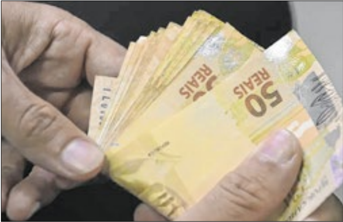
Cinco de cada 10 aposentados precisaram do consignado