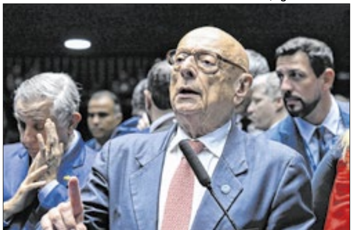
Acordo deixará Amin sem vaga para o Senado