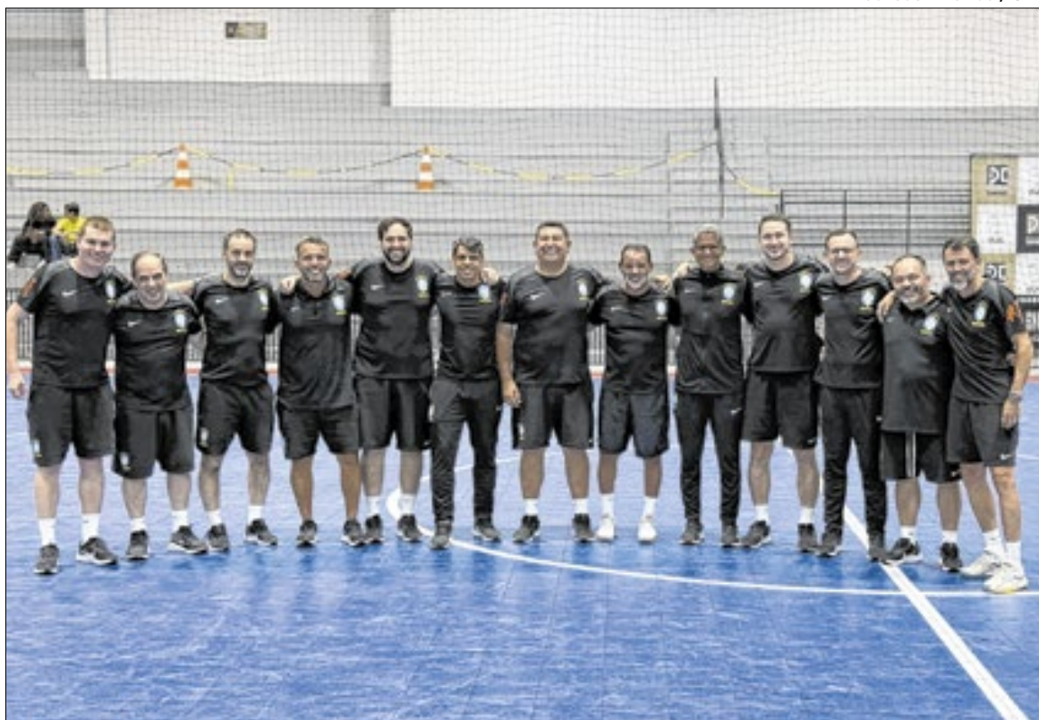
Comissões técnicas das Seleções Brasileiras de Futsal e de Beach Soccer durante o intercâmbio