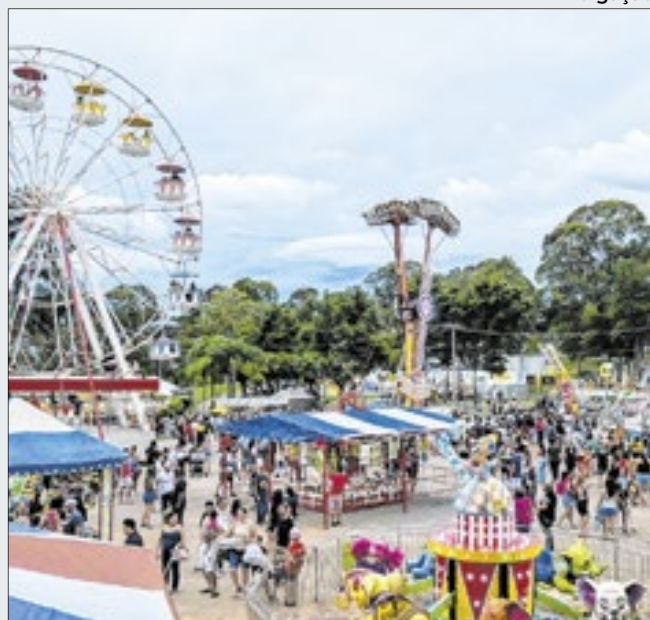
Evento acontece no Parque Municipal da cidade

Cerca de 70 mil pessoas passaram pela 75ª Festa do Figo e pela 30ª Expogoiaba de Valinhos durante a primeira semana do evento; festival segue até 1º de fevereiro