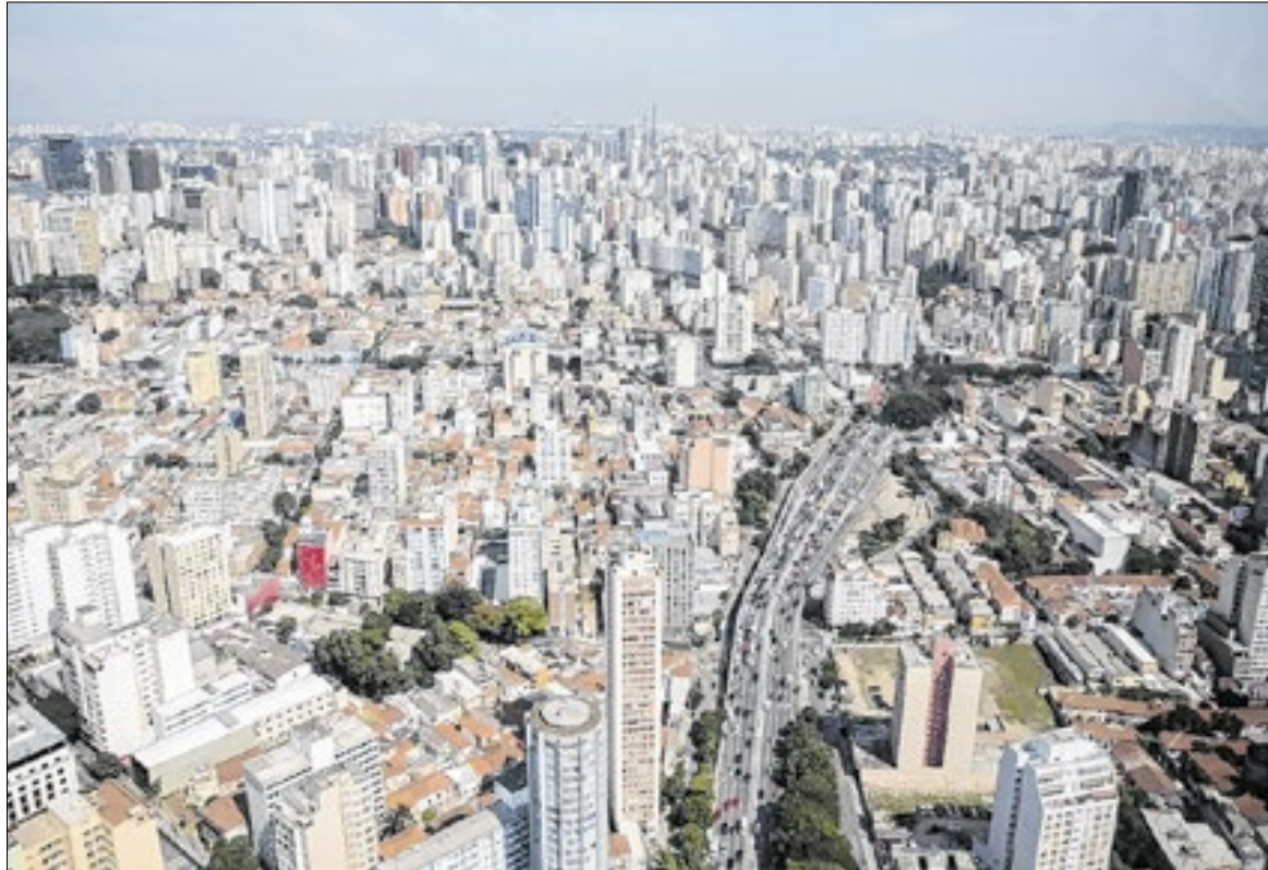
Em 2025, foram criados mais de 185 mil novos negócios e 15 mil empresas migraram para SP

A capital paulista se destaca pela combinação de infraestrutura robusta, amplo mercado consumidor, oferta de mão de obra qualificada e políticas públicas voltadas à atração de investimentos. Esse conjunto de fatores tem favorecido tanto o surgimento de novos empreendimentos quanto a expansão de empresas que já estão consolidadas, especialmente nos setores de tecnologia, serviços digitais, audiovisual, logística e economia criativa.