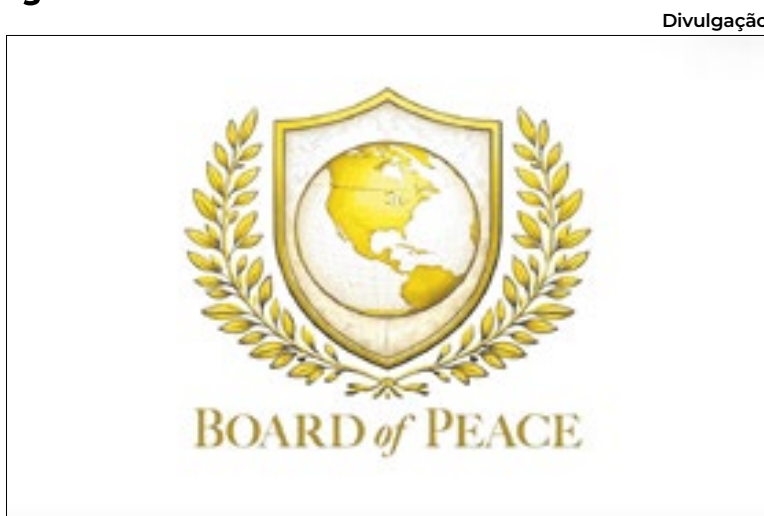
Símbolo oficial traz os Estados Unidos no centro do mundo

A cerimônia de assinatura ocorreu às margens do Fórum Econômico Mundial em Davos, na Suíça - evento já ofuscado pela investida tarifária e diplomática de Trump, ora suspensão, de anexar a Groenlândia.