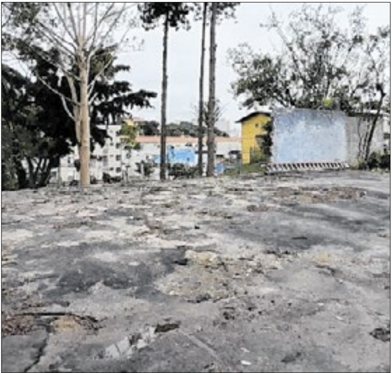
A construção atende a demanda histórica dos trabalhadores