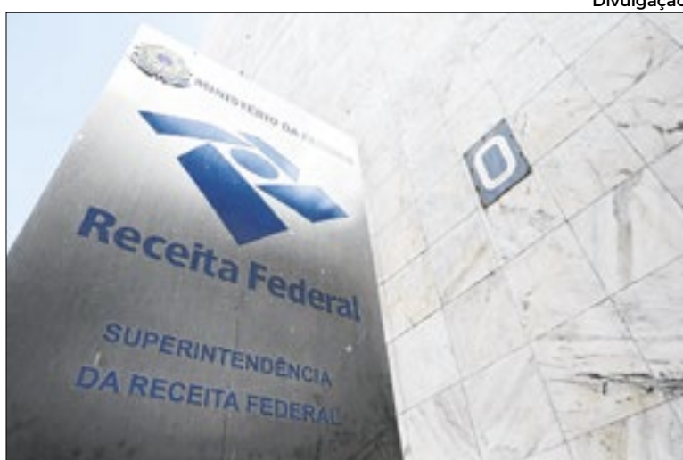
Receita com casas de apostas virtuais subiu mais de 10.000%

Essa última rubrica é um agregado de arrecadação volátil e tem surpreendido positivamente este ano, com crescimento robusto calcado na arrecadação de royalties e rendimento de trabalho e também nos Juros sobre Capital Próprio (JCP) forma de uma em-