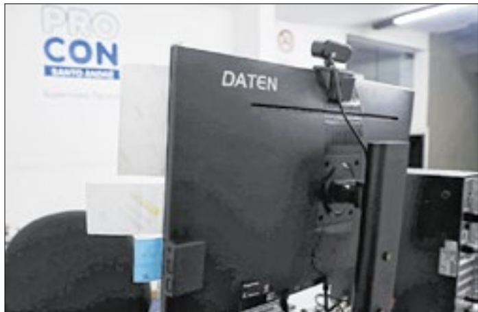
Os equipamentos doados já estão em uso pelo Procon