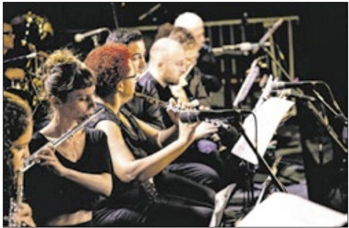
Bolsas garantem desconto integral ou parcial a alunos