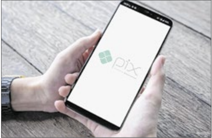
Pix tem ferramenta para devolução do dinheiro