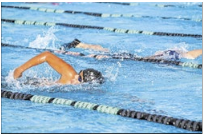
Inscrições presenciais acontecem de 27 a 29 de janeiro