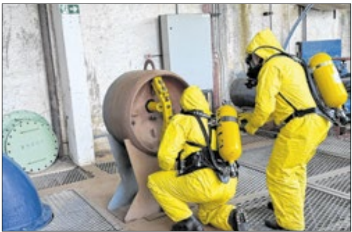
Treinamento prepara equipes para vazamentos de cloro