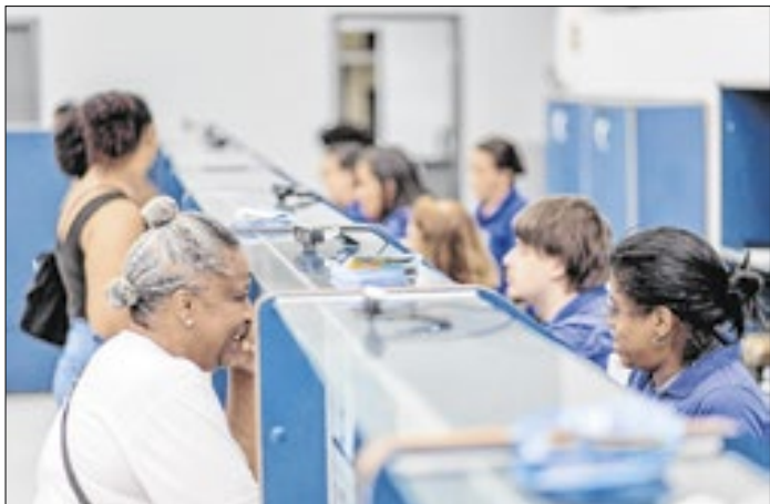
Ação facilita o acesso e atendimento dos passageiros