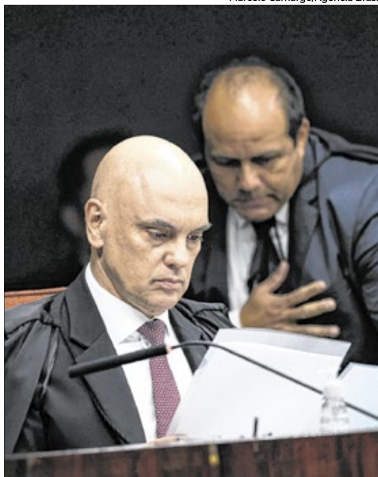
Caberá a Moraes definir o destino de prisão de Bolsonaro

Condenado a 27 anos e três meses de prisão por tentativa de golpe de Estado, o ex-presidente da República estava cumprindo pena na Superintendência da Polícia Federal (PF). Con-