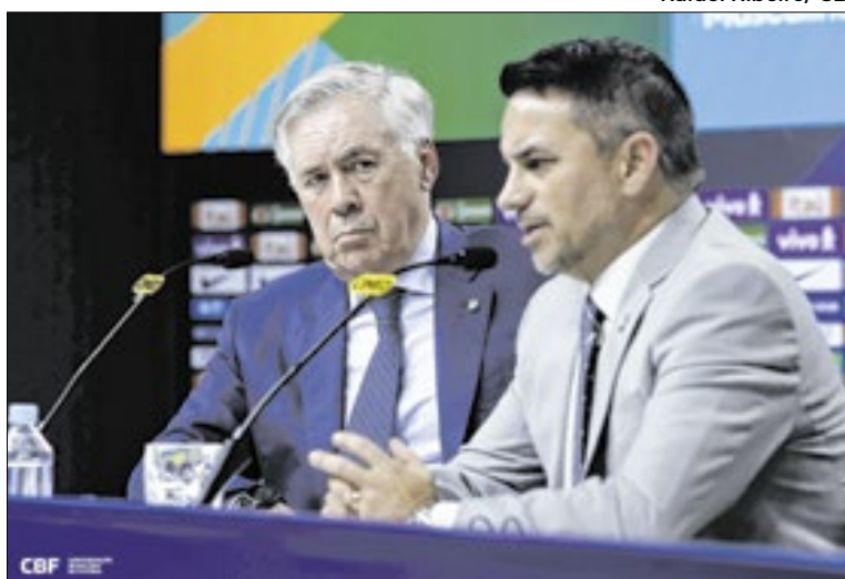
Comissão está de olho nos atletas da Champions League