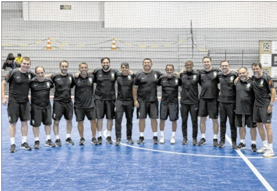
Comissões técnicas das Seleções Brasileiras de Futsal e de Beach Soccer durante o intercâmbio