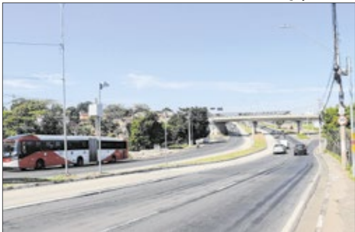
Entre os 32 radares, 14 estão na Av. John Boyd Dunlop