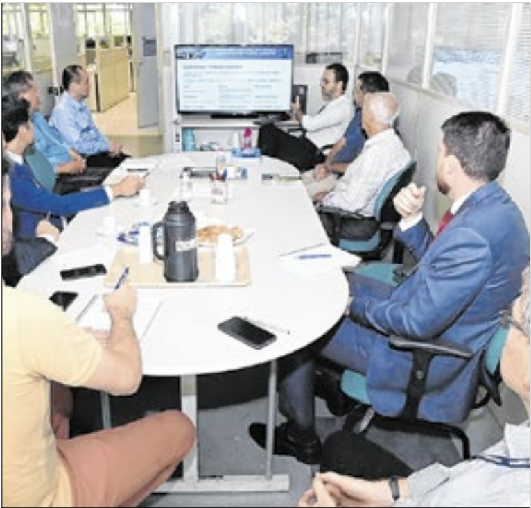
Representantes de entidades em reunião sobre o ISSQN

O projeto musical Primeira Nota oferece 250 vagas gratuitas para crianças e adolescentes de 6 a 14 anos, nos cursos de instrumentos e canto e musicalização. As aulas ocorrem no Cemmaneco, na Vila Marieta, com prioridade para alunos da rede municipal. As inscrições seguem abertas enquanto houver vagas.