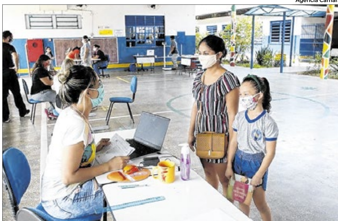
Servidores de estados, municípios e do Distrito Federal poderão receber os benefícios

"Não há qualquer criação de despesa a mais, não há impacto, porque tudo isso estava previsto (...). É um critério de justiça descongelar oficialmente [os pagamentos], porque descongelado extraoficialmente já acontece pelo Brasil inteiro; 24 estados já descongelaram, já têm essa possibilidade. (...) Basicamente, é o pessoal da educação que está aguardando essa iniciativa para que tenha direito", disse na ocasião.