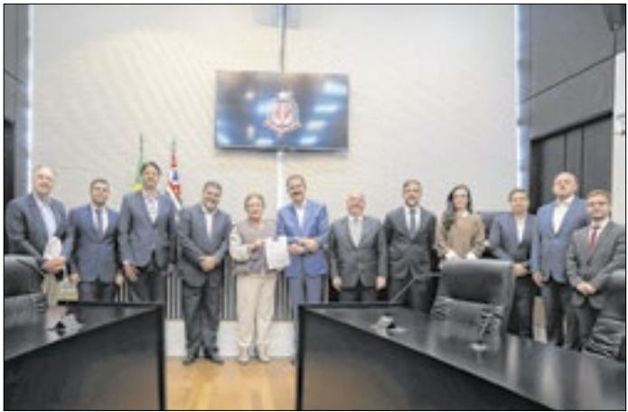
Frente Parlamentar do Empreendedorismo na Alesp