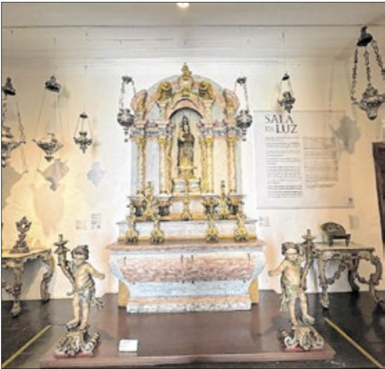
MAS SP - Museu de Arte Sacra de São Paulo

O Governo de São Paulo liberou a segunda parcela do cofinanciamento do programa SuperAção SP a 38 municípios da primeira onda, totalizando R$ 35,6 milhões. Os recursos apoiam a ampliação e qualificação de serviços socioassistenciais, como CRAS e CREAS, e priorizam inclusão produtiva de famílias.