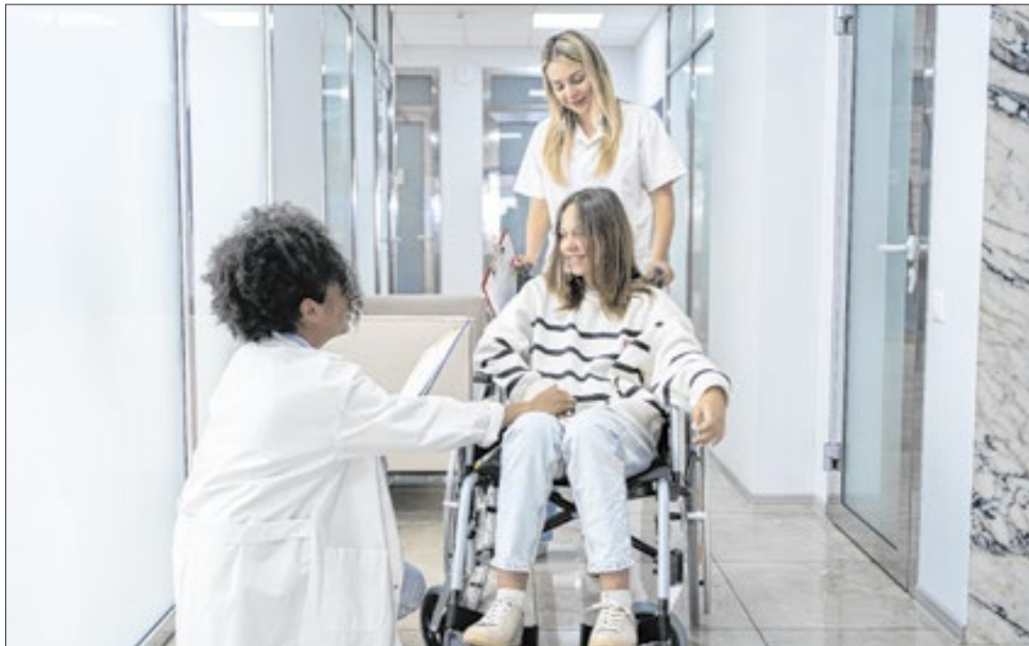
O projeto aprovado prevê que despesas não recaiam sobre vítimas nem nos cofres públicos

A iniciativa municipal tem como objetivo regulamentar, no âmbito local, um dispositivo já previsto na legislação federal. De acordo com o projeto, os valores pagos pelos agressores serão destinados diretamente ao Fundo Municipal de Saúde. O cálculo do montante a ser ressarcido deverá considerar a tabela do SUS ou os custos efetivamente