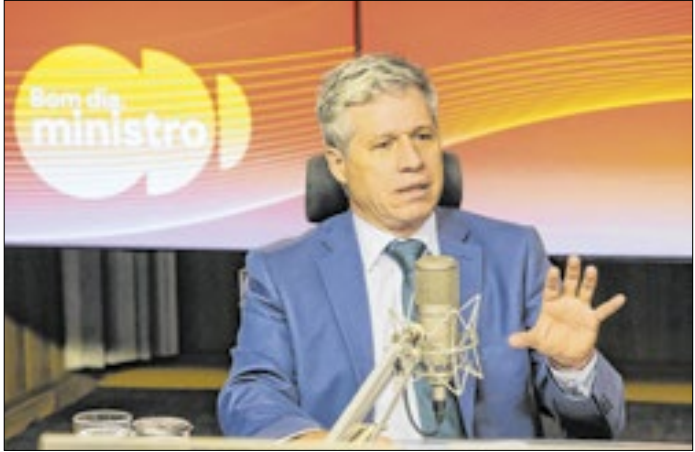
Ministro Paulo Teixeira fala sobre acordo UE-Mercosul