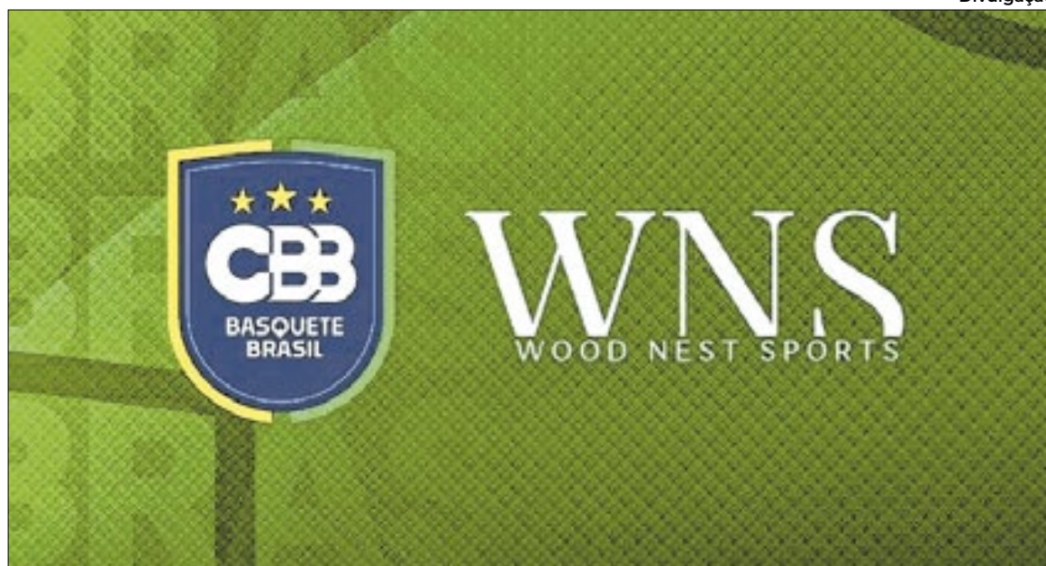
Confederação Brasileira de Basketball fechou uma parceria histórica com a Wood Nest Sports