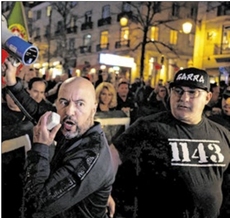
Todos os detidos pertencem ao grupo ultranacionalista 1143

O muro caiu sobre o trilho durante um temporal na Espanha. Com o ocorrido, o trem veio em direção, colidiu e descarrilou. O acidente ocorreu dias após o grave acidente ferroviário ocorrido domingo em Andaluzia, no sul espanhol. Ao menos 42 pessoas morreram após dois trens em alta velocidades colidirem.