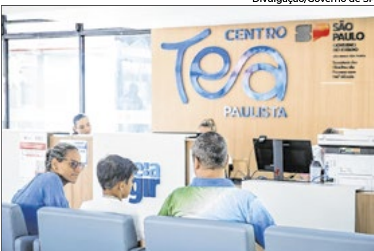
O Centro TEA Paulista é uma ação estratégica

Segundo informações oficiais, a equipe noturna é composta por 17 profissionais com formação superior, entre psicólogos, assistentes sociais e assessores jurídicos, capacitados para escuta qualificada e encaminhamento