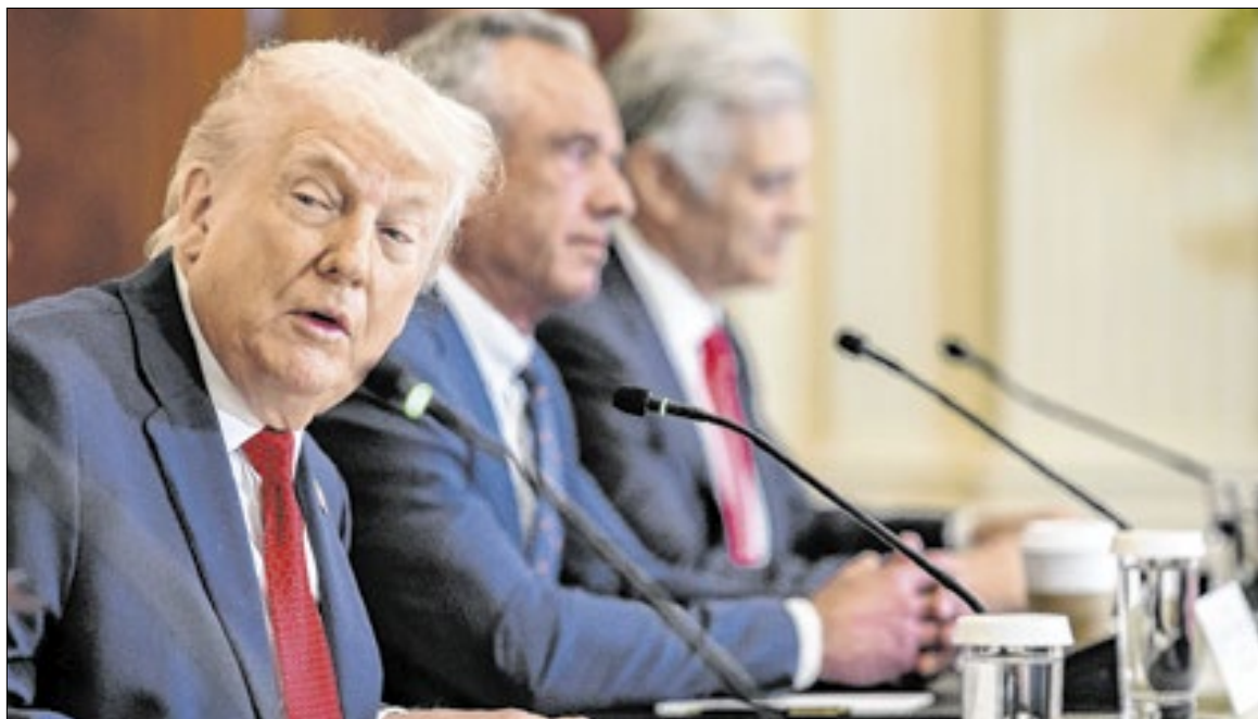
Trump criticou Europa e disse que países deveriam seguir os passos dos EUA na economia

“Os Estados Unidos está no caminho mais rápido de crescimento