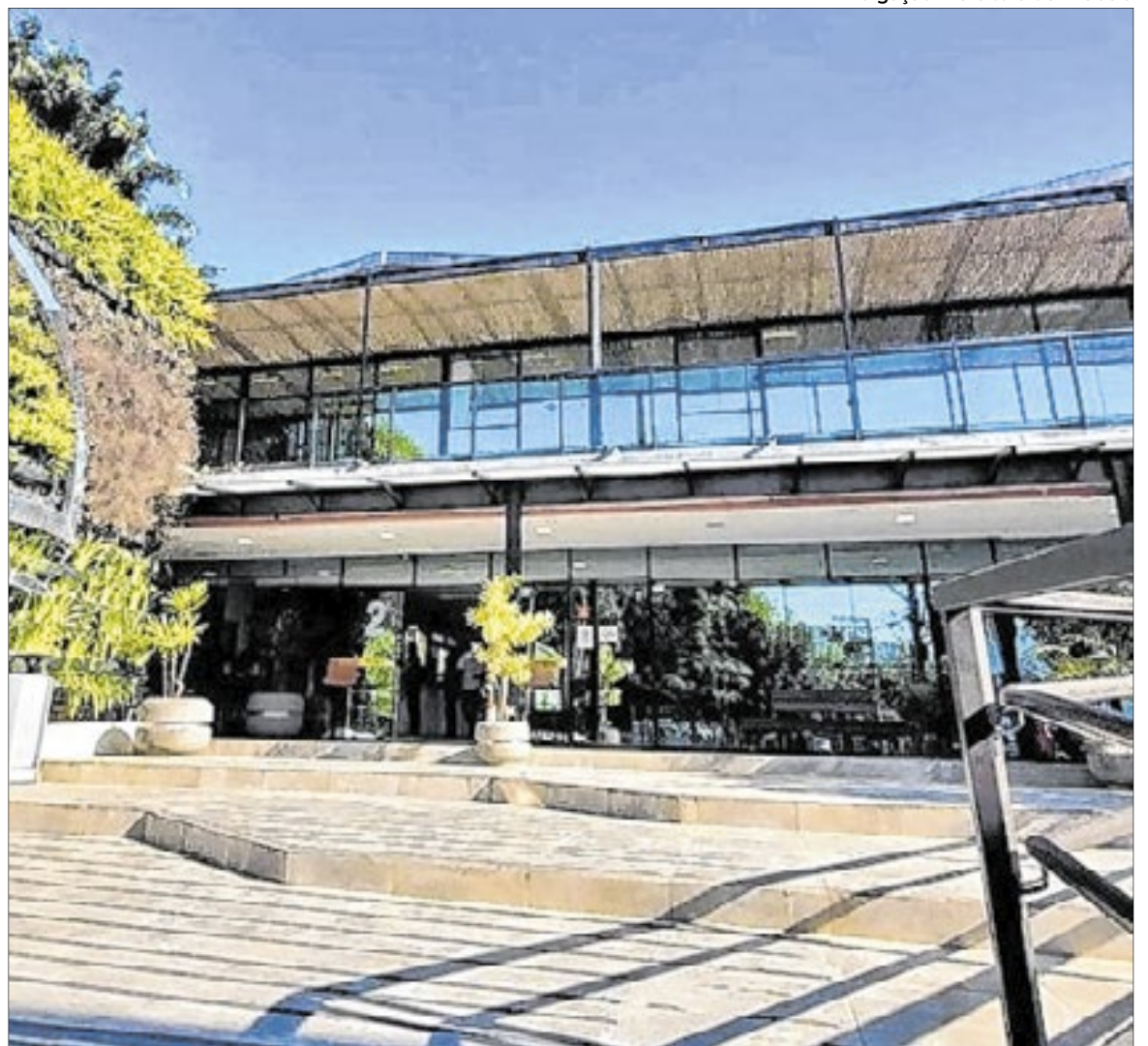
Plataforma de cobrança ainda está em fase de ajustes técnicos e operacionais

O município justifica a criação da taxa como um instrumento para apoiar ações permanentes de conservação, manutenção e