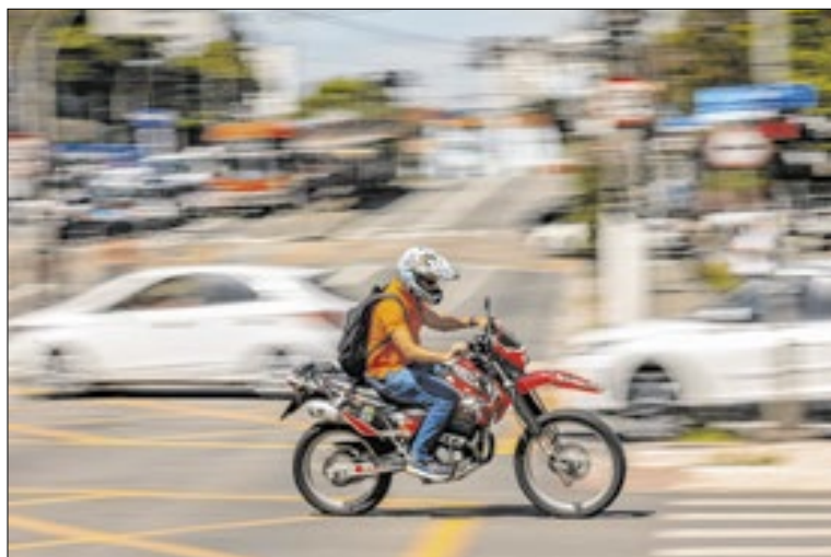
Motociclistas são as principais vítimas nas mortes no trânsito

Apesar do pico registrado em dezembro, Campinas encerrou 2025 com queda no total anual de mortes no trânsito. Ao longo do ano, foram 145 óbitos,