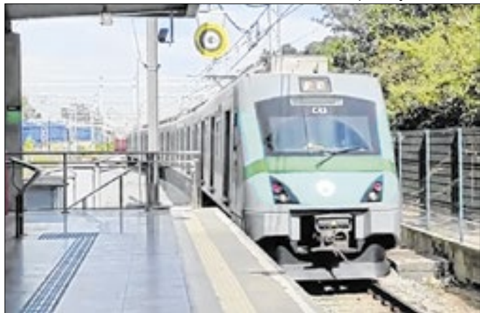
Via Mobilidade está com vagas abertas na região