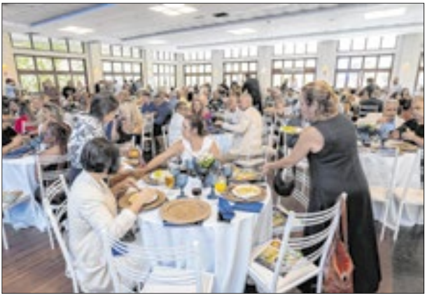
Mais de 300 pessoas estiveram presentes na festa de 50 anos da Pesagro-Rio