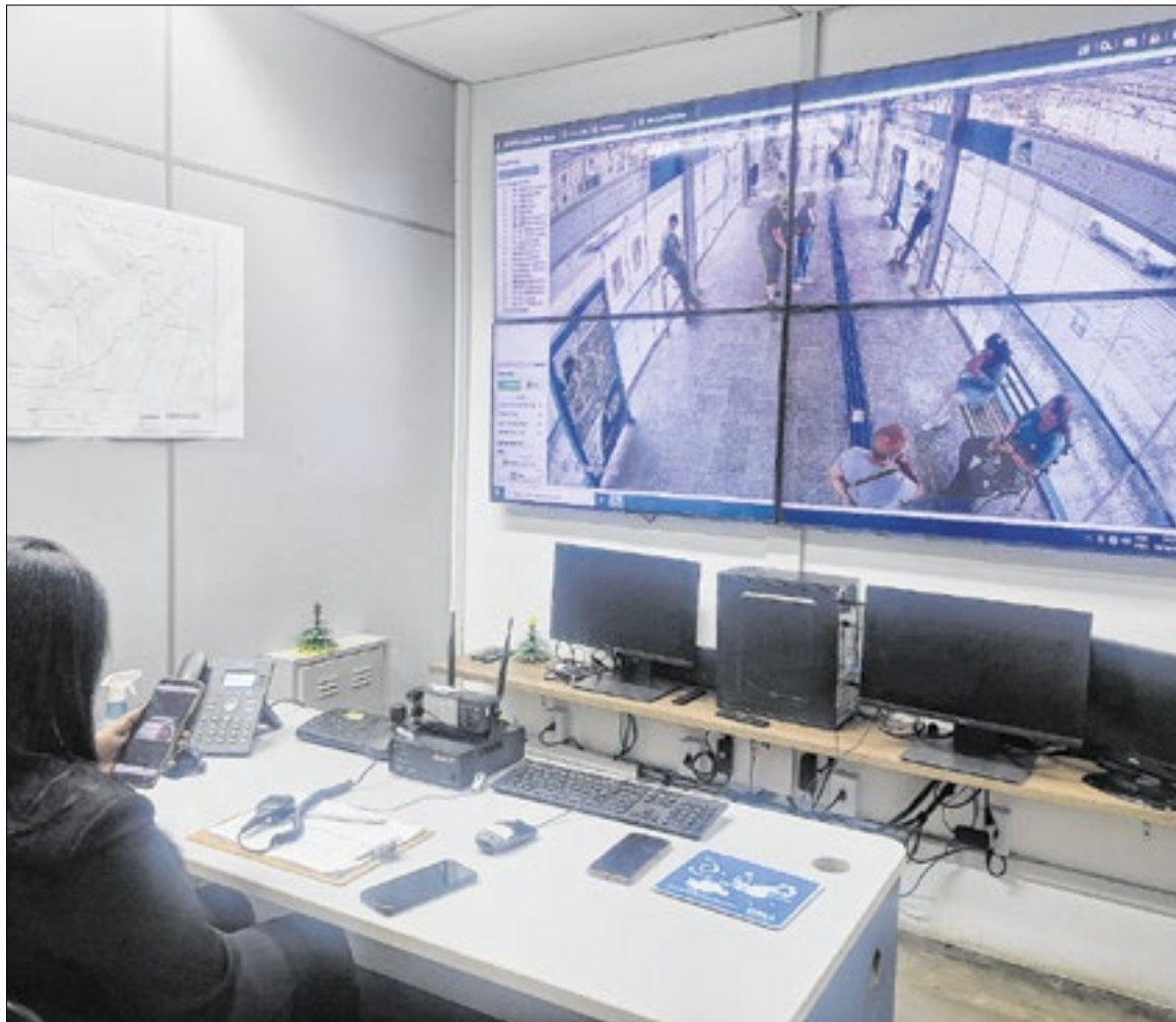
Central de monitoramento funciona 24 horas e auxilia na identificação das ocorrências

No Corredor BRT Ouro Verde, o vandalismo atingiu 41 casos em 2024 e 37 em 2025, ao passo