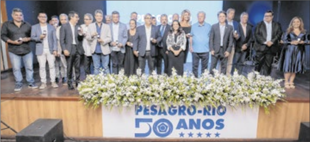
Autoridades se reúnem para prestigiar uma das maiores instituições de pesquisa pública do país

A Pesagro-Rio comemorou seus 50 anos em uma noite marcada por emoção e reconhecimento à ciência agropecuária fluminense. A celebração aconteceu no último dia 19 de janeiro, no Clube Naval, em Niterói, reunindo funcionários, pesquisadores, dirigentes e autoridades que ajudaram a construir a trajetória da instituição ao longo de cinco décadas. Um dos momentos mais simbólicos da noite foi a homenagem aos 50 funcionários mais antigos da casa, reconhecidos pela dedicação e contribuição ao longo dos anos, e presenteados com um broche comemorativo folheado a ouro. O evento destacou o papel estratégico da Pesagro-Rio no desenvolvimento do agro no Estado do Rio de Janeiro, da pesquisa aplicada à inovação no campo, sempre com foco na sustentabilidade e no apoio ao produtor rural. Em clima de confraternização, a festa celebrou o passado, valorizou o presente e reforçou o compromisso da Pesagro-Rio com os desafios do futuro.