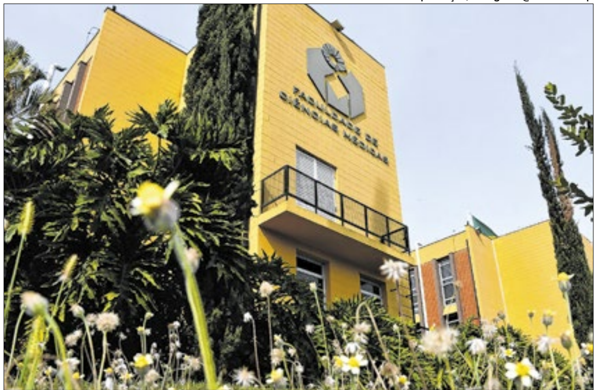
Faculdade de Ciências Médicas (FCM) da Unicamp

Com a divulgação dos resultados, o MEC informou que 99 cursos de medicina pertencentes ao Sistema Federal de Ensino, que inclui universidades federais e instituições privadas, entrarão em processo de supervisão por apresentarem desempenho insatisfatório. As instituições públicas estaduais, distritais e municipais não passam por esse tipo de processo, pois são supervisionadas por conselhos e secretarias locais. As sanções previstas são escalonadas e podem variar desde a redução do número de vagas até a suspensão da oferta de financiamento estudantil pelo Fundo de Financiamento Estudantil (Fies). Quanto maior o risco ao interesse público, mais severas poderão ser as medidas adotadas.