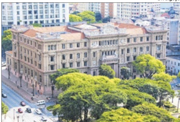
Fachada do Tribunal de Justiça de São Paulo