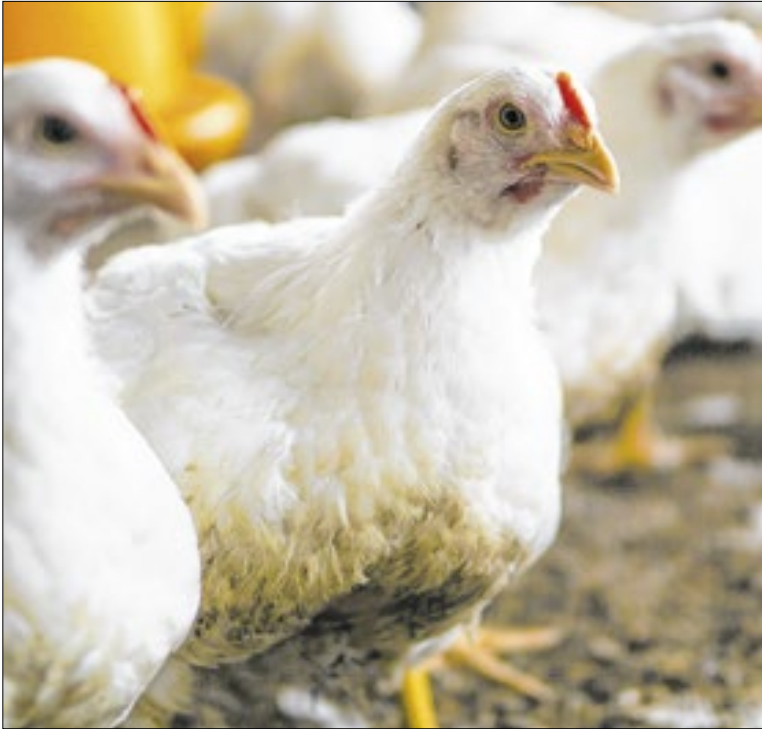
Compra de carne de frango está liberada pela China

Segundo o ministro do Desenvolvimento Agrário, Paulo Teixeira, esse pacote de desapropriações que será anunciado pelo presidente Lula em Salvador inclui, além de terras, crédito, assistência técnica, orientações e a possibilidade de organização por cooperativas. “Terá também acesso aos programas de compras públicas”.