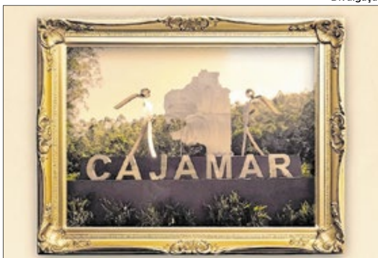
Exposição possui recursos de realidade aumentada

tra é o uso de realidade aumentada: por meio de QR Codes, os visitantes podem acessar vídeos e conteúdos adicionais que aprofundam as histórias retratadas.