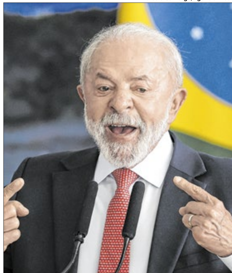
Lula vence em todos os cenários testados pela Atlas/Intel

Nesta segunda-feira (19), o deputado federal Nikolas Ferreira (PL-MG) iniciou uma caminhada em mobilização favorável ao ex-presidente Bolsonaro e contra a prisão dos envolvidos nos atos antidemocráticos. A proposta é uma caminhada de 230 quilômetros até Brasília.