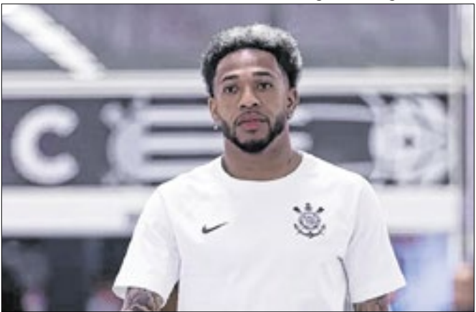
“Sumiço” de Martínez irritou o técnico Dorival Júnior