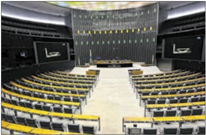
Programa da Câmara dos Deputados recebe nota máxima

O Programa de Mestrado Profissional em Poder Legislativo (MPPL), do Centro de Formação, Treinamento e Aperfeiçoamento (Cefor) da Câmara dos Deputados, mantém o conceito 5 da Coordenação de Aperfeiçoamento de Pessoal de Nível Superior (Capes), nota máxima atribuída aos mestrados profissionais. Criado em 2012, o programa apresentou evolução contínua nas avaliações da Capes. No ciclo 2013–2016, avançou da nota 3 para a nota 4 e, na avaliação quadrienal 2017–2020, alcançou o conceito máximo.