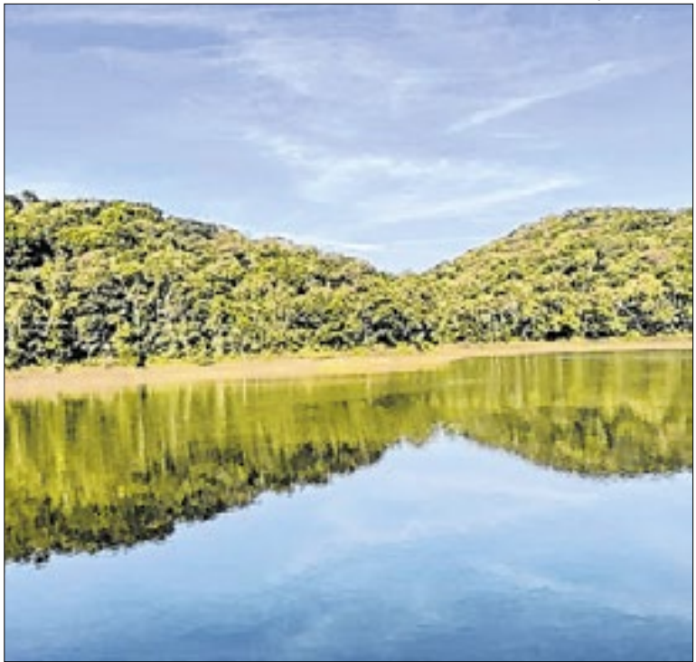
Ponto de captação do Rio Pequeno, da represa Billings

Durante a ação, moradores poderão realizar o agendamento da 1ª e da 2ª via de documentos pessoais de uso rotineiro, como a Carteira Nacional de Habilitação (CNH), além de solicitar a segunda via de certidões de nascimento, casamento e óbito, CPF, título de eleitor e 2ª via de contas de consumo.