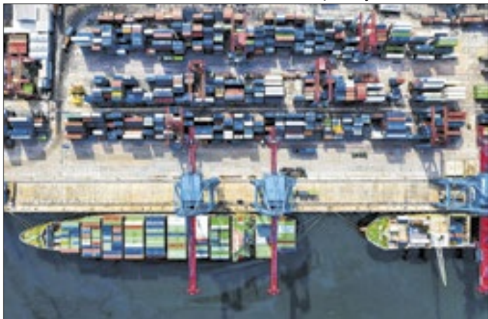
Desempenho reforça relevância do bloco europeu para SP