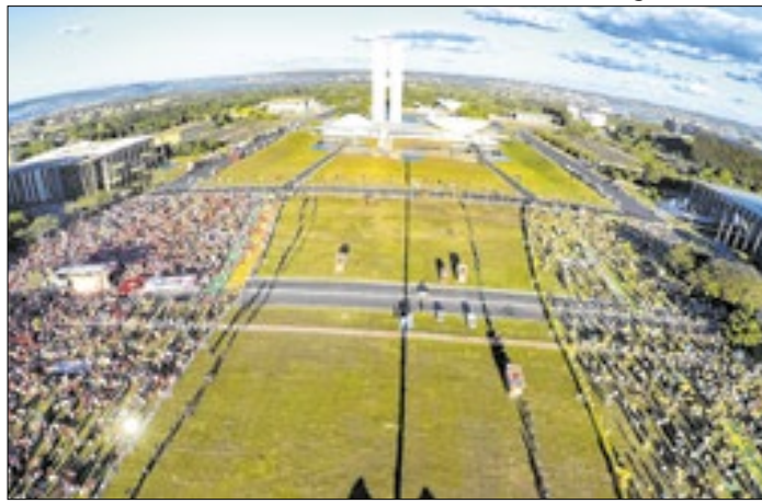
Cerca na Esplanada: ponto maior da radicalização