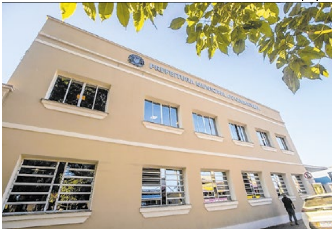
Fachada da Prefeitura de Guararema, onde os MEIs podem obter orientações

Apesar disso, a reforma pode gerar impactos indiretos no ambiente de negócios. Empresas de maior porte passarão a operar sob o novo modelo, o que pode aumentar a necessida-