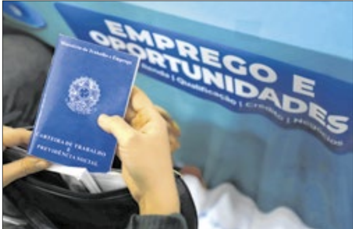
Foram atendidas 2 mil pessoas no 2º Feirão de Empregos