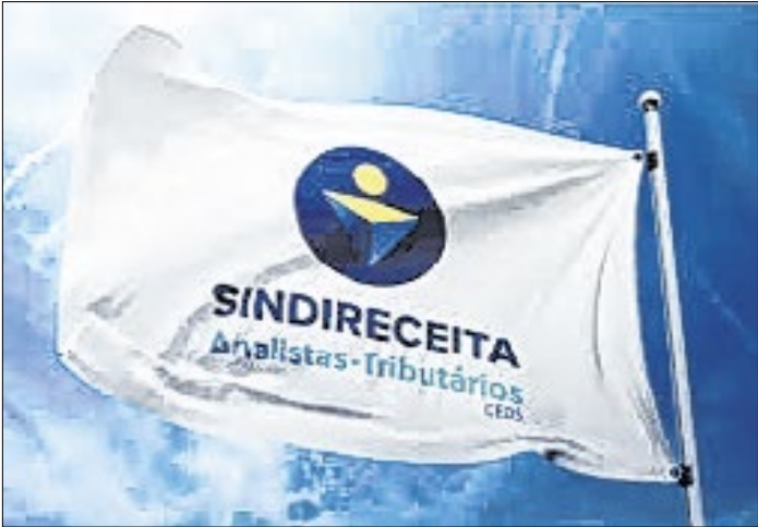
Sindireceita: cartilha pode ser baixada pelo site

Na semana do Dia do Aposentado, a ser comemorado no sábado (24), o Sindicato Nacional dos Analistas-Tributários da Receita Federal do Brasil (Sindireceita) lançou a cartilha “Ações de Interesse dos Aposentados e Pensionistas – Atualizada”. O documento reúne informações sobre as principais ações judiciais de interesse desse público de filiados e filiadas. O livro pode ser baixado em PDF ou lido virtualmente. O link está disponibilizado no site ( https://sindireceita.org.br )