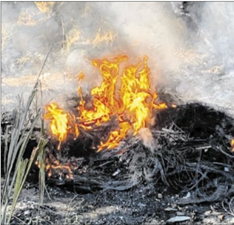
Pena para crime ambiental pode chegar a até 5 anos de prisão

As duas entidades de servidores emitiram nota em agradecimento à diretora do STF e afirmaram que vão seguir acompanhando os desdobramentos e orientando os filiados do Sindjus e da Astrife sobre os procedimentos para requerimento do pagamento das diferenças, quando cabíveis.