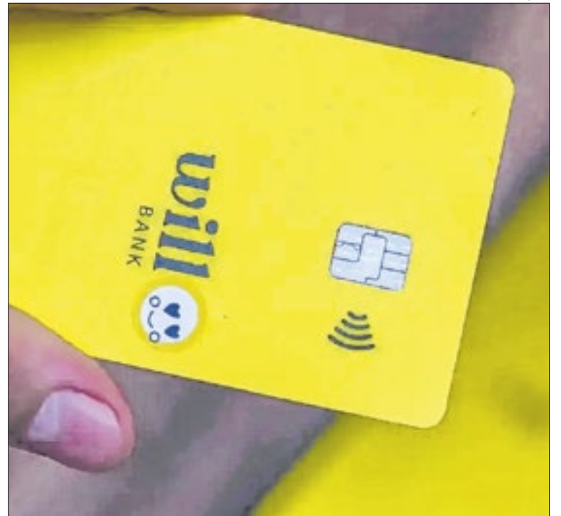
Cartões do Will foram desativados após liquidação