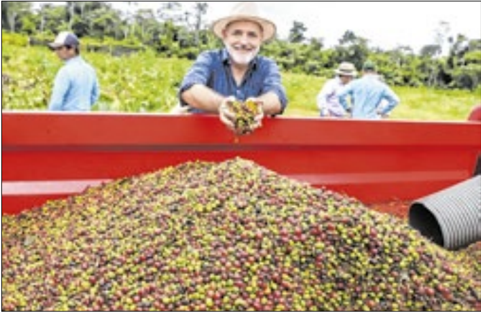
Produtores familiares poderão exportar café sem taxa