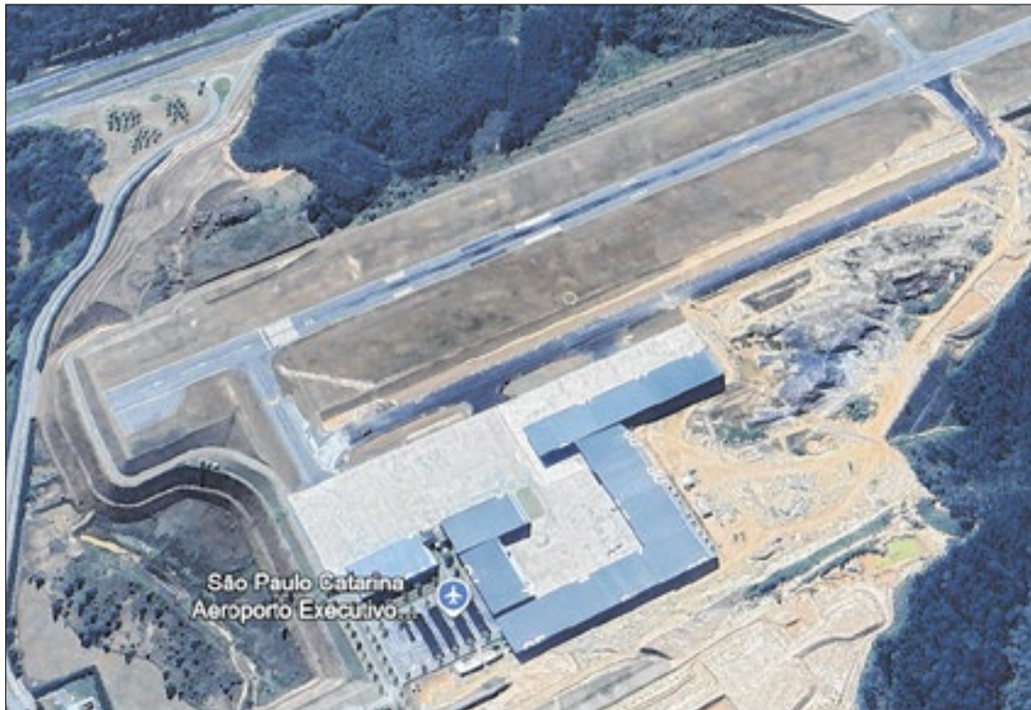
Atualmente, o Aeroporto Catarina é restrito a jatos particulares e táxis aéreos

O Correio da Manhã entrou em contato com a JHSF,