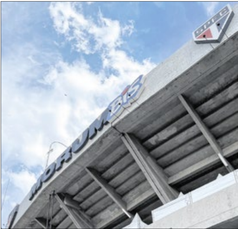
Promotor falou sobre o caso das vendas dos camarotes