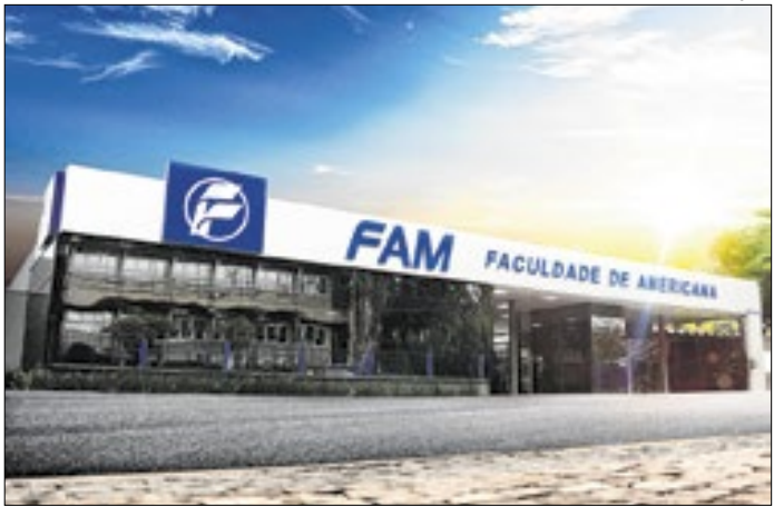
Faculdade de Americana protocolou pedido ao MEC