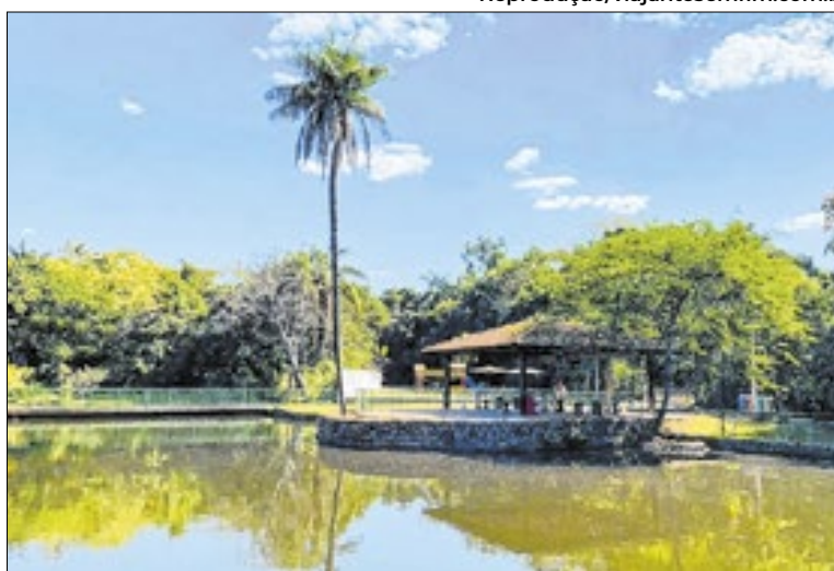
Atendimentos adequados estão sendo providenciados

Profissionais da Secretaria Municipal do Meio Ambiente fizeram os atendimentos iniciais e adotaram as medidas cabíveis. Para reforçar o acompanhamento, equipes técnicas dos zoológi-