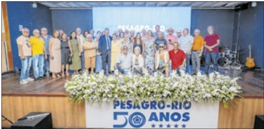
Os 50 funcionários mais antigos da casa foram homenageados pela dedicação e contribuição para a transformação do agro fluminense