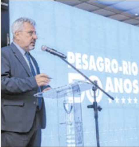
O presidente Paulo Renato Marques discursa em solenidade de abertura da festa de 50 anos da Pesagro