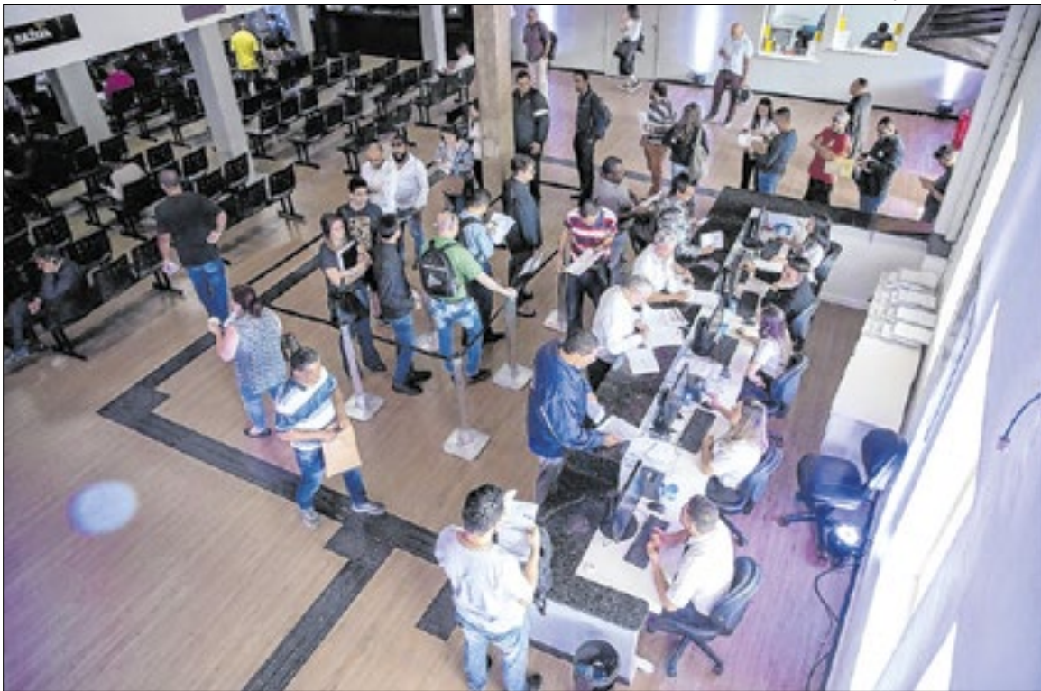
Junta Comercial do Estado de São Paulo (Jucesp)

A Jucesp e órgãos ligados ao desenvolvimento econômico estadual avaliam que a manutenção de políticas de apoio ao empreendedorismo, investidas em digitalização de serviços públicos e estímulo à competitividade podem consolidar a trajetória de crescimento observada em 2025. O incremento na abertura de empresas é visto também como potencial vetor de geração de empregos e ampliador da base produtiva no Estado de São Paulo.