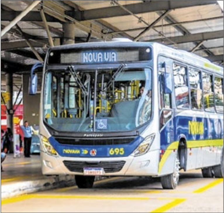
Transporte coletivo urbano é restabelecido integralmente