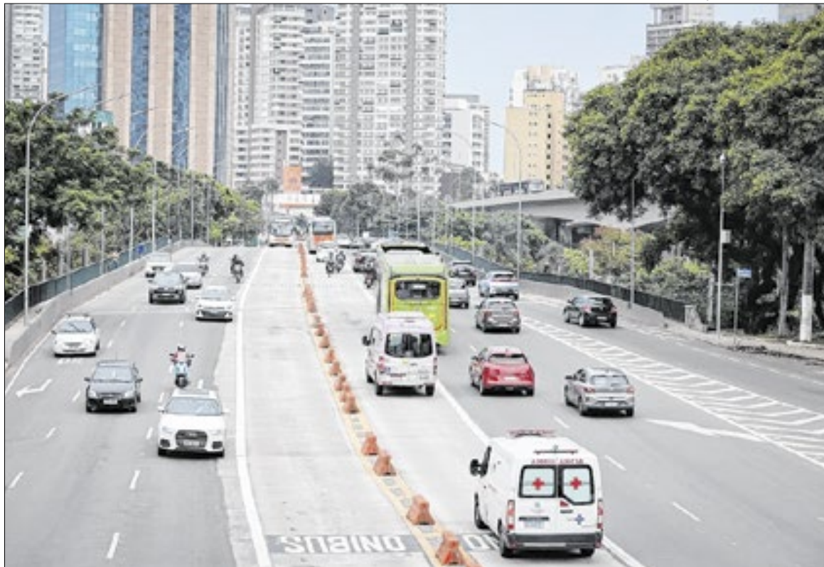
Alíquota para os carros de passeio continua a mesma do ano passado, 4%

O valor do imposto pode ser consultado pelo número do Renavam em qualquer agência bancária credenciada, terminais de autoatendimento, Internet Banking ou diretamente no portal da Sefaz-SP.