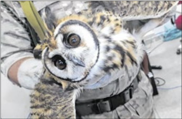
Mais de 20 espécies foram resgatadas