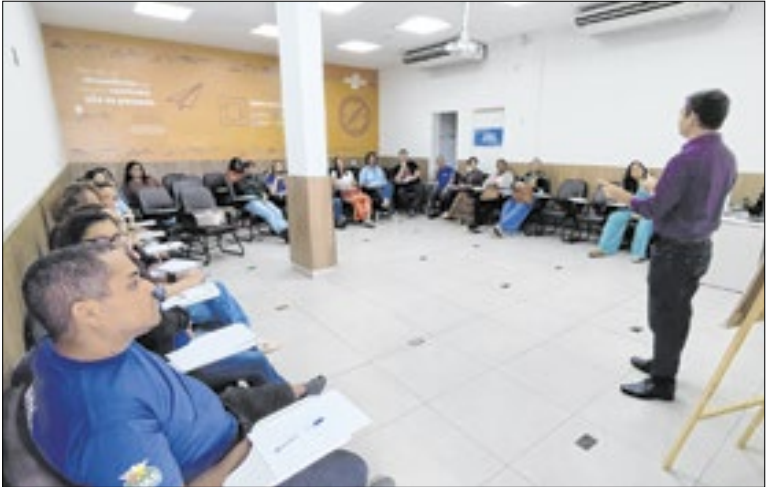
Ciclo vai até o dia 11 de fevereiro