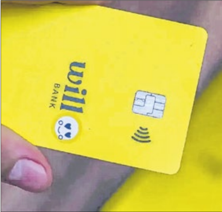
Cartões do Will foram desativados após liquidação