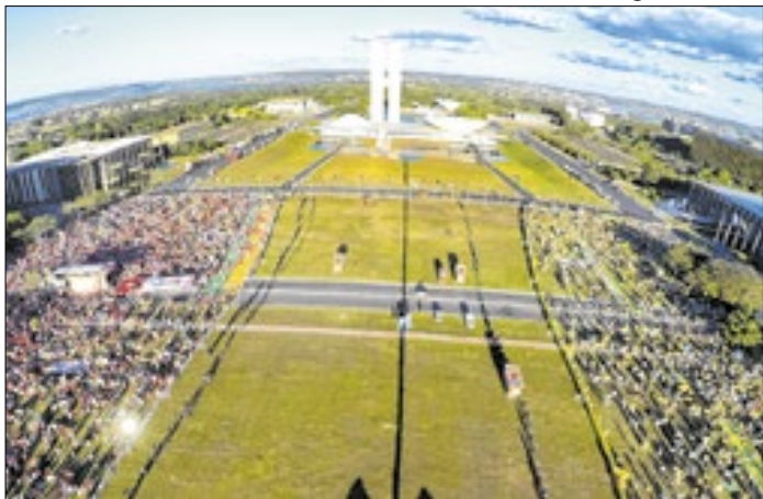
Cerca na Esplanada: ponto maior da radicalização