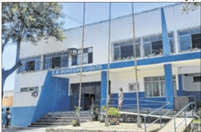
Aulas acontecerão na Escola Municipal Monteiro Lobato