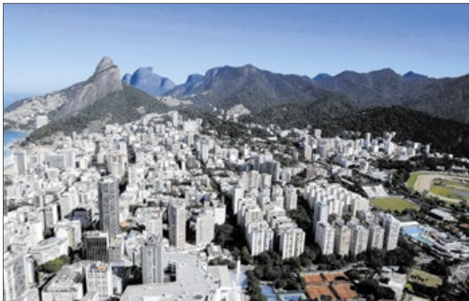
O contribuinte tem a opção de parcelar o imposto predial

A emissão das guias para pagamento deve ser feita exclusivamente pelo portal oficial Carioca Digital, através do endereço