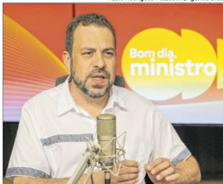
Boulos participou do programa Bom Dia, Ministro

Com o Orçamento do Povo, segundo o ministro Guilherme Boulos, cada cidadão poderá votar, uma vez, em alguma proposta para ser implementada em sua cidade. No primeiro ano, o objetivo é chegar a cerca de 400 municípios, incluindo todas as capitais.