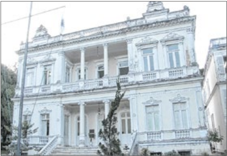
Medida se tornou obrigatória no início deste mês

Para obter a Carteira de Identidade Nacional (CIN), o cidadão precisa levar a certidão de nascimento ou de casamento original (ou a cópia autenticada em cartório). Além disso, deverá apresentar um documento que contenha seu número de CPF. É importante levar também um comprovante de residência.