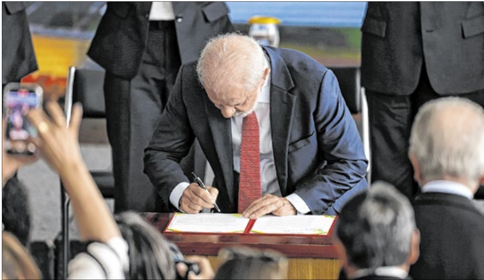
Lula sancionou a lei mas pagamento de verba retroativa aos servidores depende de disponibilidade de orçamento

Os pagamentos previstos pelo texto são referentes ao período entre 28 de maio de 2020