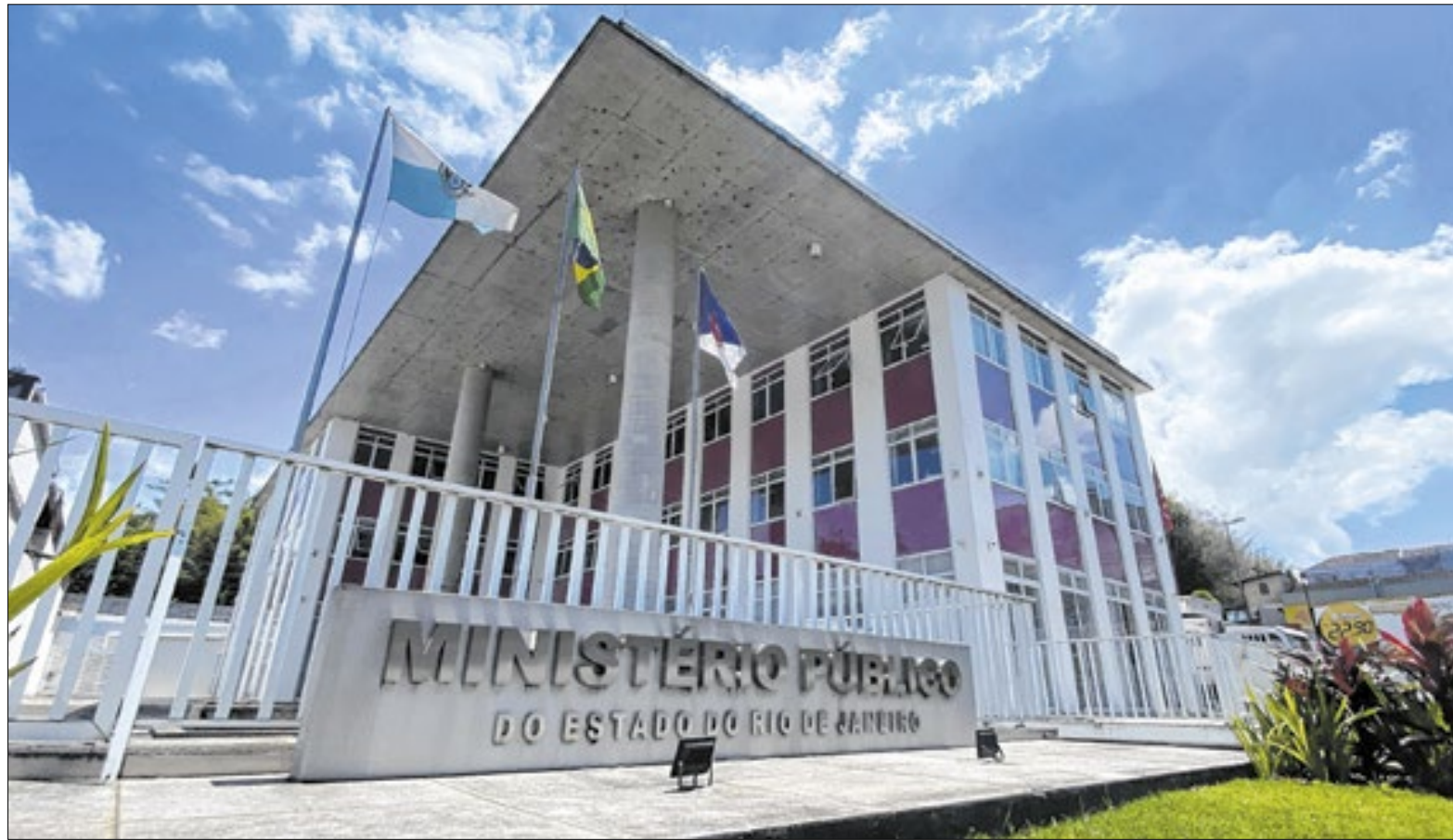
MPRJ aponta que os volumes de chuva registrados ultrapassaram o limite crítico para risco geológico alto

Segundo a promotora, a justificativa apresentada pelo município — de que não houve registro de chuva horária superior a 35 milímetros, parâmetro utilizado para acionamento de sirenes — não afasta o risco geológico, uma vez que o solo já se encontrava saturado. “A não abertura dos pontos de apoio implica em omissão estatal e compromete a segurança humana, além de trazer efeito psicológico nocivo para aqueles que