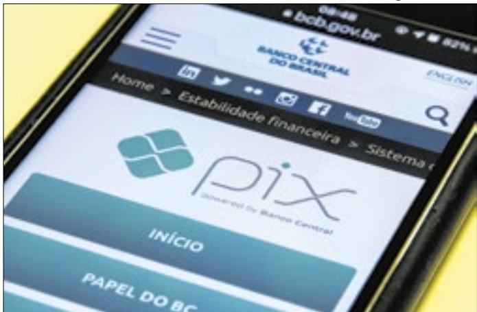
BC alega maior segurança contra fraudes