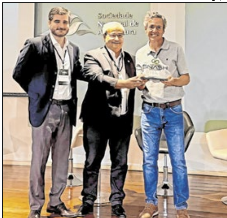
Tecgraf Agro venceu competição de startups Inova Agro Tour

cana-de-açúcar, flores e criação de animais.