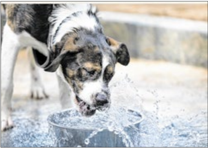
Secretaria Municipal alerta sobre assistência e abandono