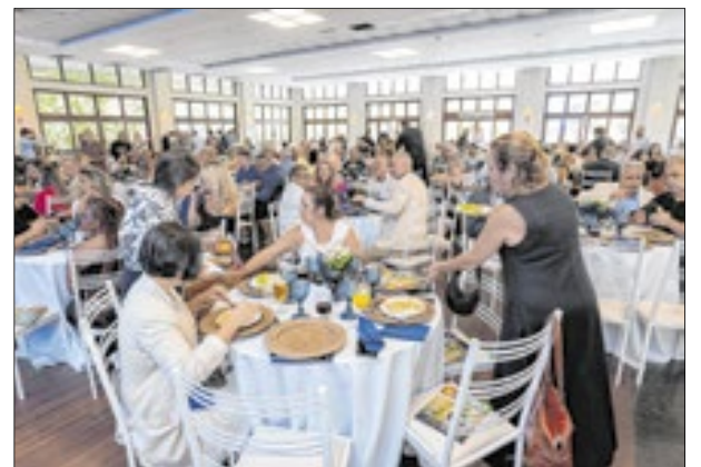
Mais de 300 pessoas estiveram presentes na festa de 50 anos da Pesagro-Rio

■ MAIORIA SIMPLES NO SEGUNDO TURNO DA ALERJ - Um dado sobre a eleição do governador biônico para suceder Cláudio Castro está passando despercebido. Havendo mais de um candidato, ganha aquele que atingir a maioria absoluta. Havendo segundo turno, a vitória será por maioria simples.