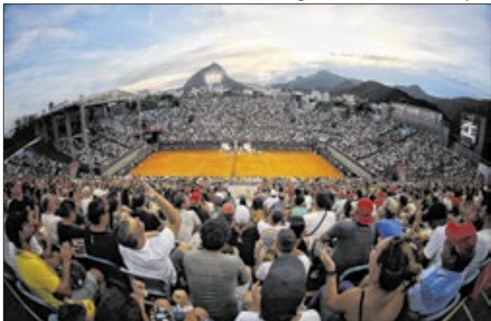
Ingressos para o Rio Open esgotaram rapidamente