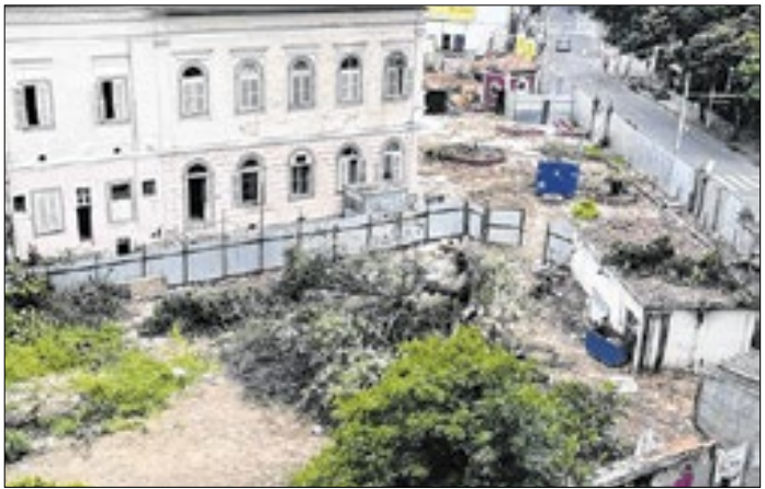
Terreno depois da derrubada de 71 árvores

O leilão do terreno fez parte do processo de recuperação judicial de entidades da Igreja Metodista, que mantinha o Bennett.