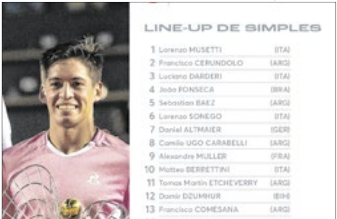
Lorenzo Musetti é o único top-10 confirmado no evento