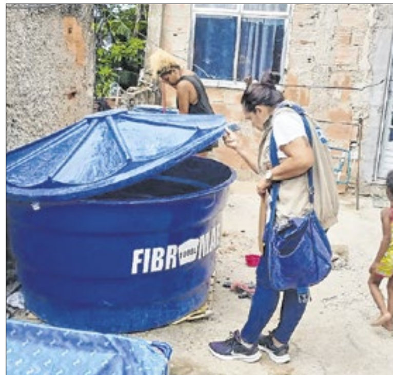
Agentes monitoram pontos de acúmulo de água parada

A Prefeitura de Magé divulgou o calendário de convocação para a vistoria do transporte escolar, referente à renovação da licença para o exercício de 2026. A renovação já começou e terminará em 12 de fevereiro, contemplando os permissórios de número de ordem 001 a 080. Mais informações em mage.rj.gov.br .