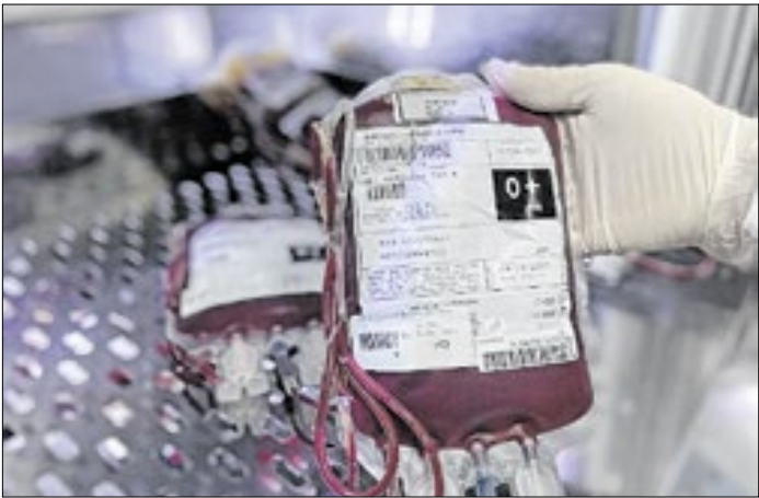
Período de férias exige atenção para manter os estoques

Janeiro é historicamente um dos períodos mais desafiadores para os hemocentros em todo o país. Férias escolares, viagens e o aumento do deslocamento de pessoas para regiões litorâneas contribuem para a redução no comparecimento de doadores. Esse cenário também é sentido pelo Hemocentro Regional de Campos, que alerta para a necessidade de manter os estoques em níveis seguros. Atualmente, o estoque é considerado razoável, porém, abaixo do ideal para garantir tranquilidade no atendimento de todas as demandas. Para suprir adequadamente os serviços de saúde da região, o Hemocentro precisa receber cerca de 70 doações por dia. Até agora, foram contabilizadas 495 doações (média de 20,7 por dia)