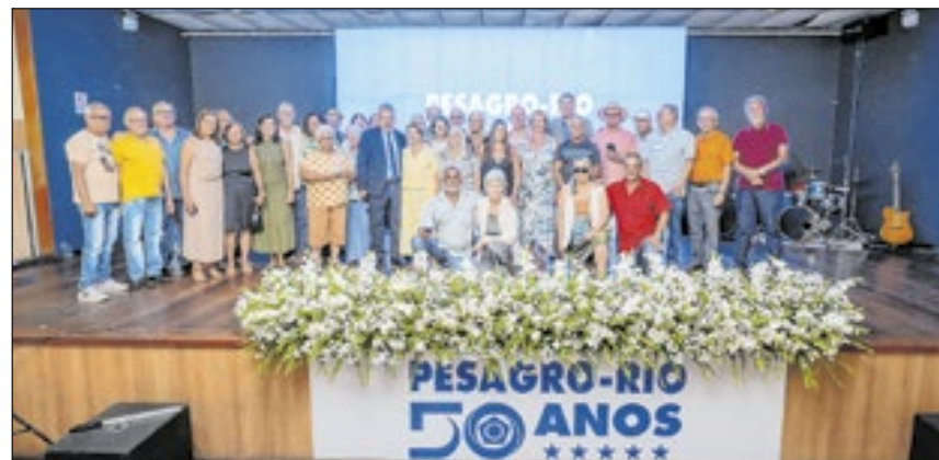
Os 50 funcionários mais antigos da casa foram homenageados pela dedicação e contribuição para a transformação do agro fluminense