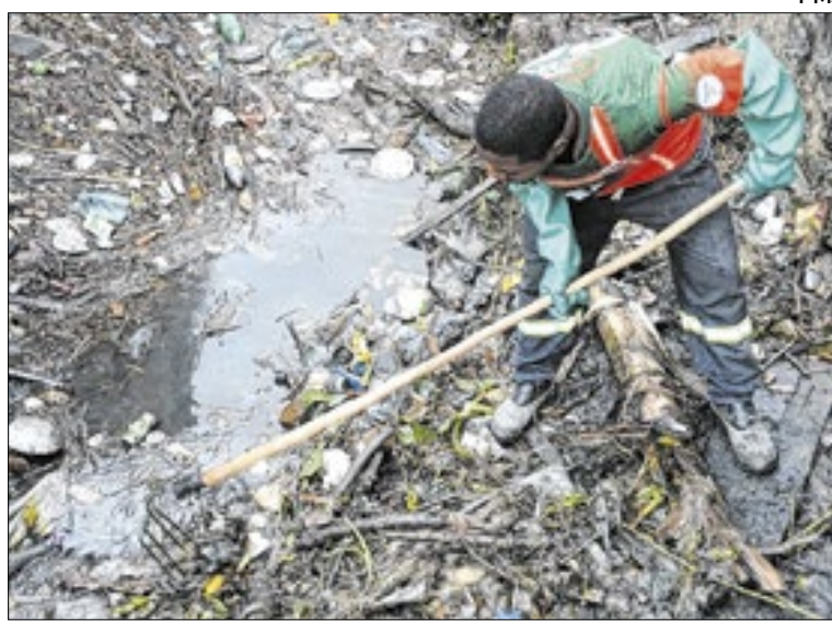
Secretarias municipais atuam desde a noite de segunda (19)

No bairro Citrópolis, uma casa teve o telhado totalmente destruído após ser atingida. Agentes da Defesa Civil estiveram no local, realizando a remoção dos galhos e garantindo a segurança da área. De acordo com o secretário municipal de Proteção