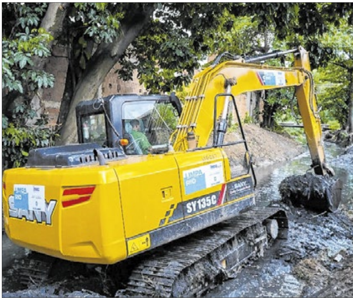
rede de proteção preventiva atua o ano inteiro e garante agilidade no escoamento da água

Além da colaboração entre equipes, a Secretaria Municipal