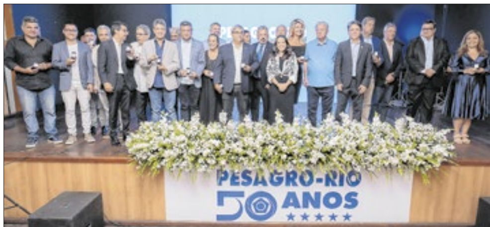
Autoridades se reúnem para prestigiar uma das maiores instituições de pesquisa pública do país

O evento destacou o papel estratégico da Pesagro-Rio no desenvolvimento do agro no Estado do Rio de Janeiro, da pesquisa aplicada à inovação no campo, sempre com foco na sustentabilidade e no apoio ao produtor rural. Em clima de confraternização, a festa celebrou o passado, valorizou o presente e reforçou o compromisso da Pesagro-Rio com os desafios do futuro.