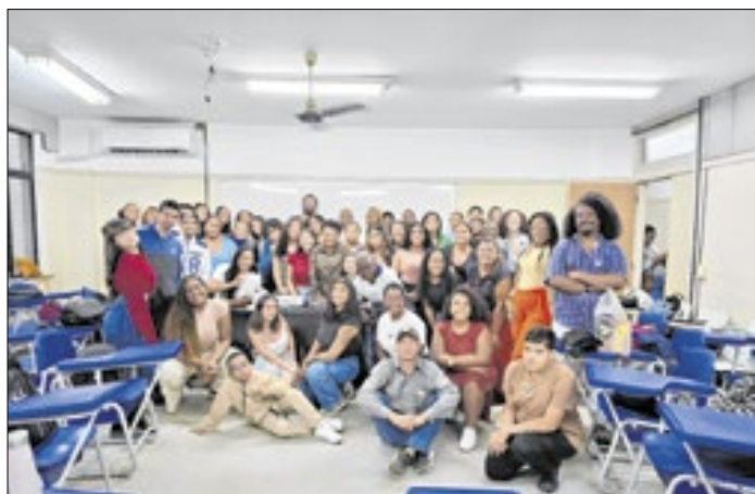
Inscrições para o curso ficarão abertas até 6 de fevereiro