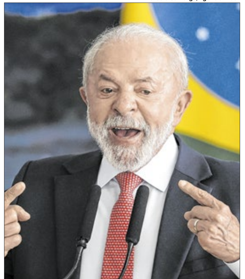
Lula vence em todos os cenários testados pela Atlas/Intel

Nesta segunda-feira (19), o deputado federal Nikolas Ferreira (PL-MG) iniciou uma caminhada em mobilização favorável ao ex-presidente Bolsonaro e contra a prisão dos envolvidos nos atos antidemocráticos. A proposta é uma caminhada de 230 quilômetros até Brasília.