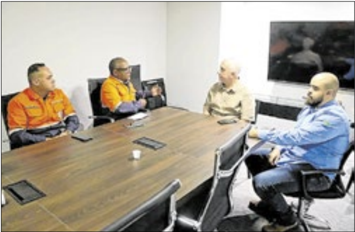
Reunião sobre a segurança aérea

Representantes das secretarias municipais de Defesa Civil e Ordem Pública se reuniram nesta terça-feira (20) com a empresa Infra Aeroportos para discutir o descarte irregular de entulhos nas proximidades do Aeroporto Bartolomeu Lisandro e do Heliporto Farol de São Tomé, que acaba atraindo aves como urubus e prejudica os voos, com risco de acidentes aéreos. Durante a reunião, realizada no Centro de Controle Operacional (CCO), foram debatidas possíveis medidas que podem ser tomadas para coibir o despejo irregular de entulhos.