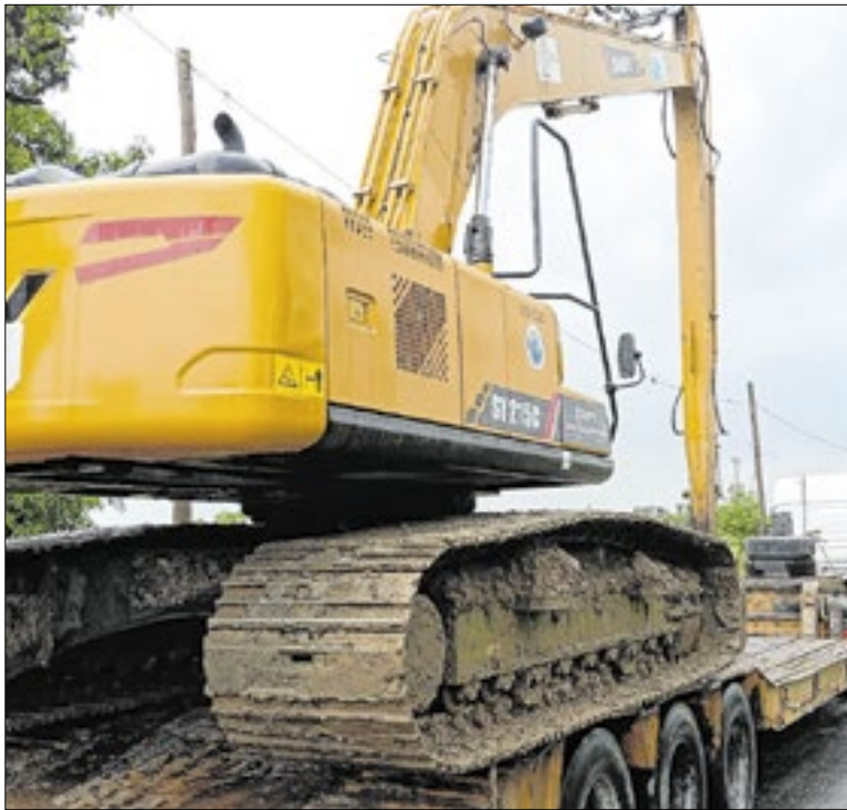
Maquinário auxilia na limpeza e na redução dos impactos

O Estado do Rio produziu 8,9 milhões de toneladas de aço em 2025, registrando crescimento de 1,1% em relação a 2024, com participação de 26,8% da produção nacional, atrás apenas de Minas Gerais. Em dezembro, a produção fluminense alcançou 701 mil toneladas de aço bruto, um avanço expressivo de 18,2% na comparação com o mesmo mês do ano anterior, respondendo por 27,4% do total produzido no Brasil, no período. Os dados são do Instituto Aço Brasil, que representa as empresas brasileiras produtoras de aço no país.