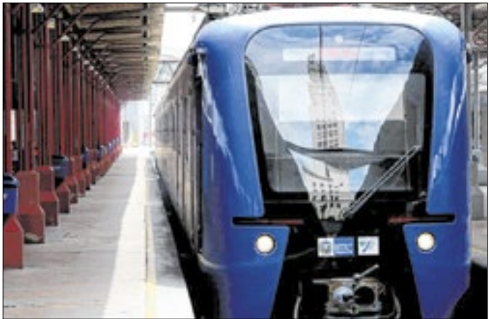
Trens terão viagens extras para diversos ramais