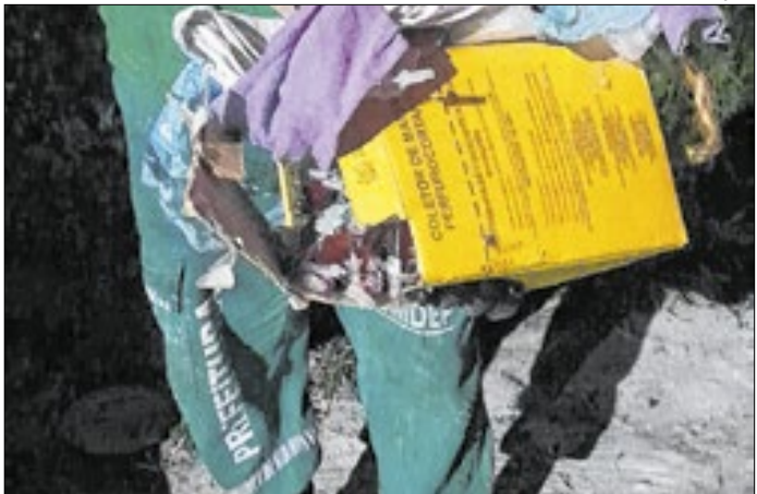
A agulha foi descartada em lixo comum