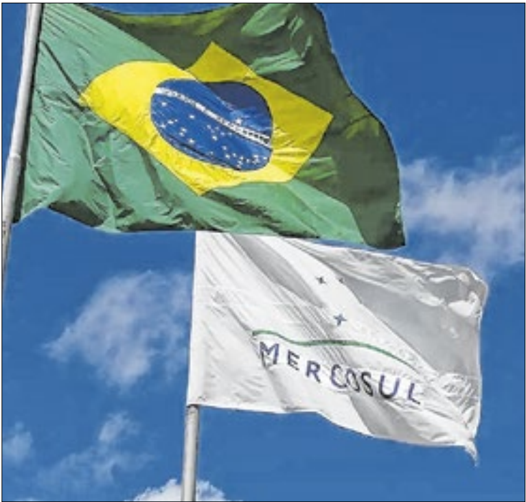
Até decisão da justiça europeia, acordo fica suspenso

A antecipação do que Bolsonaro diria ao governador foi feita, anteontem, por Flávio. O primogênito do ex-presidente ainda reforçou que a candidatura de Tarcísio ao Planalto estava descartada. Logo depois dessas declarações, o governador tratou de dar um jeito de cancelar o passeio na Papudinha.