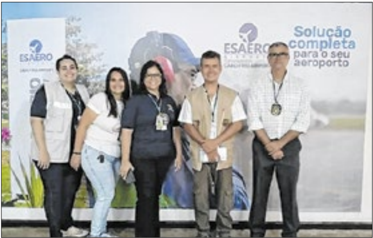
Equipe no Aeroporto Internacional da cidade

A vistoria também incluiu a Creche Escola Estadual Municipalizada Professora Maria Rita Coelho Novellino, que integra o conjunto de unidades do bairro que recebem investimentos em infraestrutura. A expectativa é que, com a conclusão das obras, a nova estrutura contribua para o desenvolvimento integral dos alunos.