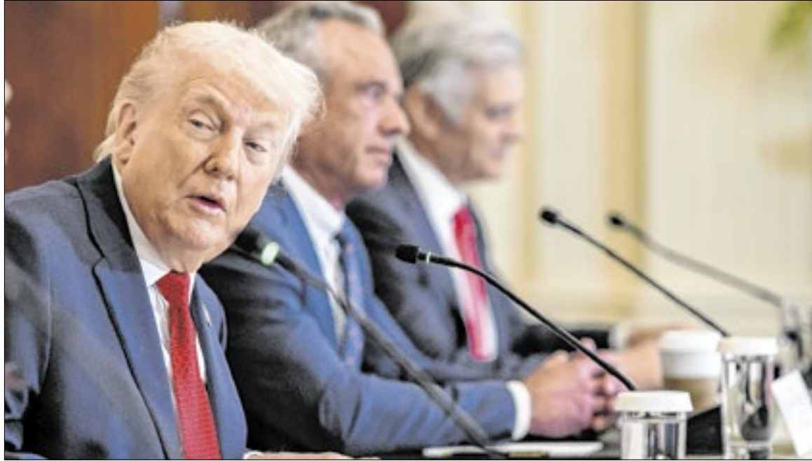
Trump criticou Europa e disse que países deveriam seguir os passos dos EUA na economia

“Os Estados Unidos está no caminho mais rápido de crescimento