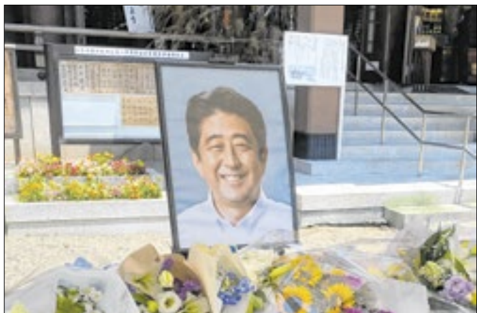
Shinzo Abe mobilizou as Olimpíadas de Tóquio 2020

Photo memories 1868 via Wikimedia Commons