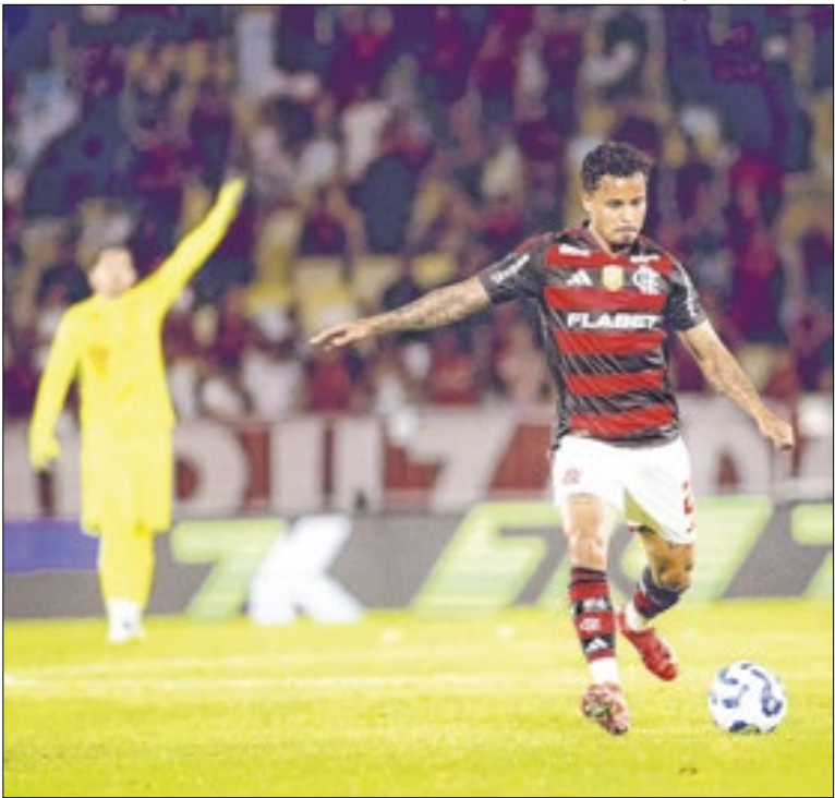
Volante quer deixar o Fla para ganhar mais minutos em campo