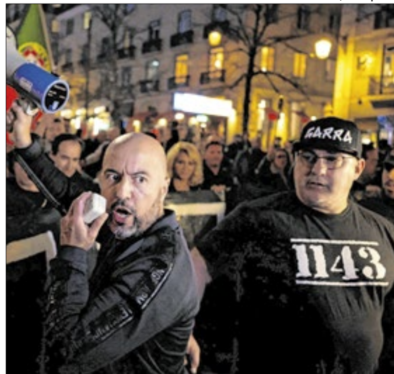
Todos os detidos pertencem ao grupo ultranacionalista 1143

O muro caiu sobre o trilho durante um temporal na Espanha. Com o ocorrido, o trem veio em direção, colidiu e descarrilou. O acidente ocorreu dias após o grave acidente ferroviário ocorrido domingo em Andaluzia, no sul espanhol. Ao menos 42 pessoas morreram após dois trens em alta velocidades colidirem.