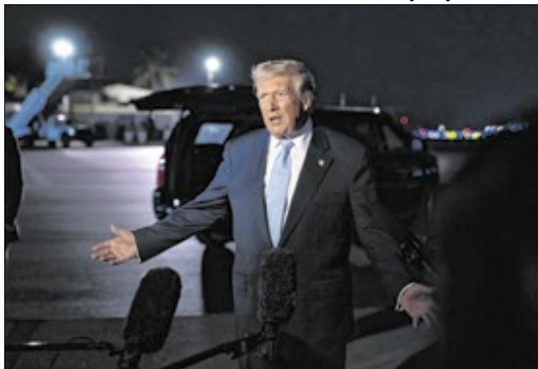
Lista de ‘365 vitórias’ celebra um ano do segundo mandato

A lista divide os 365 itens em dez categorias. “Protegendo as fronteiras da América e colocando os americanos em primeiro lugar”; “Tornando nossas comunidades seguras de novo”; “Reconstruindo uma economia para a classe trabalhadora”; “Defendendo a indústria e os trabalhadores americanos”; “Potencializando a inovação e tecnologia americanas”; “Reafirmando a liderança americana no mundo”; “Construindo um Exército mais