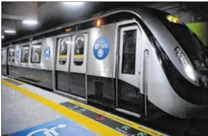
MetrôRio estenderá o horário de algumas estações