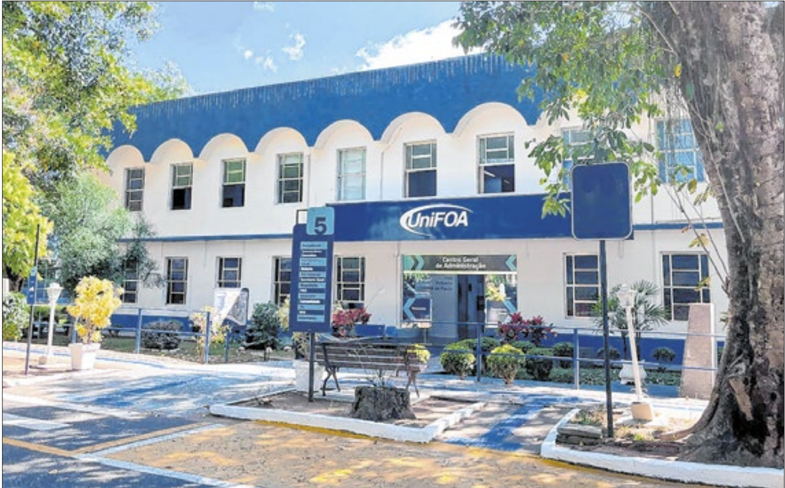
Centro universitário obteve nota 2 no exame e desempenho foi considerado insatisfatório pelo Enamed

Medicina do UniFOA é sustentada por indicadores oficiais do próprio MEC. Em outubro de 2024, a Avaliação in loco para Renovação de Reconhecimento do Curso, realizada presencialmente por experts em Medicina enviados pelo MEC, resultou na atribuição do Conceito 5 (nota máxima) em todas as dimensões avaliadas: Organização Didático-Pedagógica, Corpo Docente e Infraestrutura, conforme publicado na Portaria nº 347, de 17 de junho de 2025.