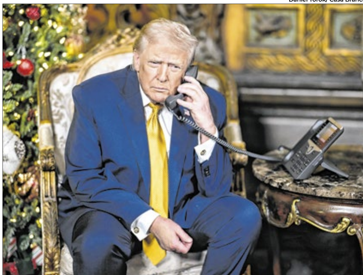
Em 20 de janeiro de 2025, Donald Trump iniciava seu segundo mandato como presidente dos EUA

Antes da disputa envolvendo a Groenlândia, outras medidas adotadas pelo atual inquilino da Casa Branca também contribuíram para minar ordem firmada ao tempo da Segunda Guerra Mundial com os acordos de Bretton