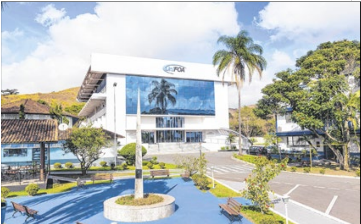
Universidade diz que mantém seu compromisso com ‘formação de médicos éticos e competentes’