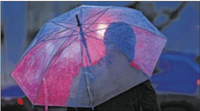
Gabinete de Crise foi criado