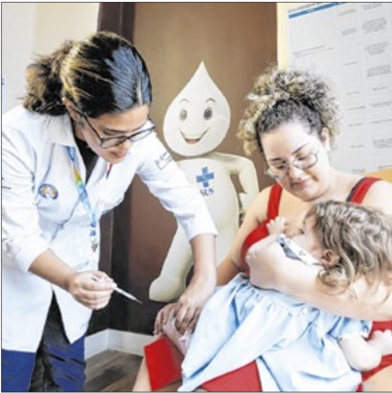
A vacinação individual evita a circulação do vírus

A droga é avaliada em cerca de R$ 32 milhões. A PM recebeu uma denúncia de que havia drogas dentro de um Chevrolet Tracker branco, na Vila Caragutá. Os agentes identificaram o carro no contrafluxo da rua José Pinho, mas o perderam de vista quando fizeram o retorno para iniciar a abordagem.