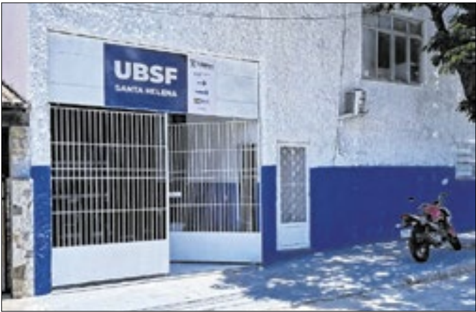
A unidade também será um polo do Pé Diabético