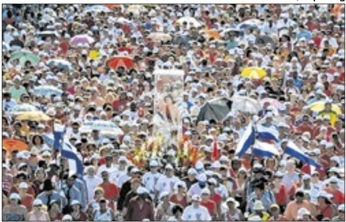
Itinerário começa na Rua Haddock Lobo, na Tijuca