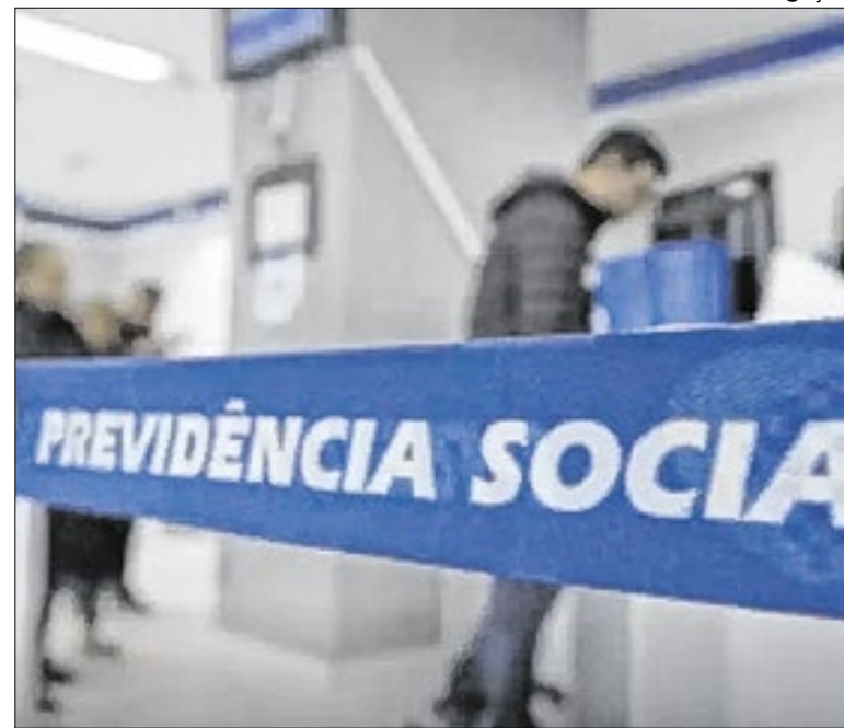
Previdência Social tem simulador de aposentadoria do RPPS

Com a promulgação da Emenda Constitucional 103, em 12 de novembro de 2019,