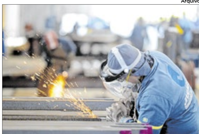
Só 14% relataram melhora no crédito no médio e curto prazo

●54% das empresas não buscaram crédito de longo prazo nos seis meses anteriores à pesquisa. ●49% não procuraram crédito de