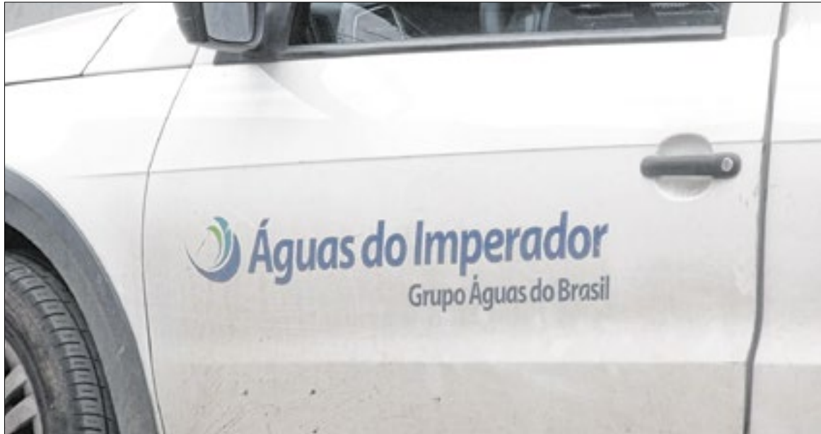
Prefeitura alega investimentos de R$ 160 milhões com a prorrogação

Essas metas passam a integrar formalmente o contrato e funcionam como parâmetros para avaliação da prestação do serviço ao