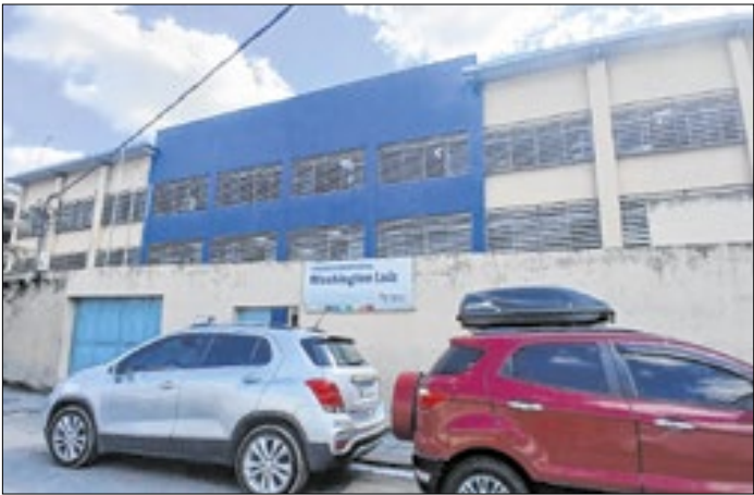
Inscrições abrem nesta quarta-feira (21)