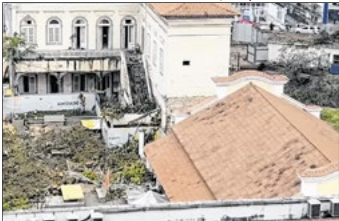
Terreno do antigo Instituto Bennett já sem as árvores