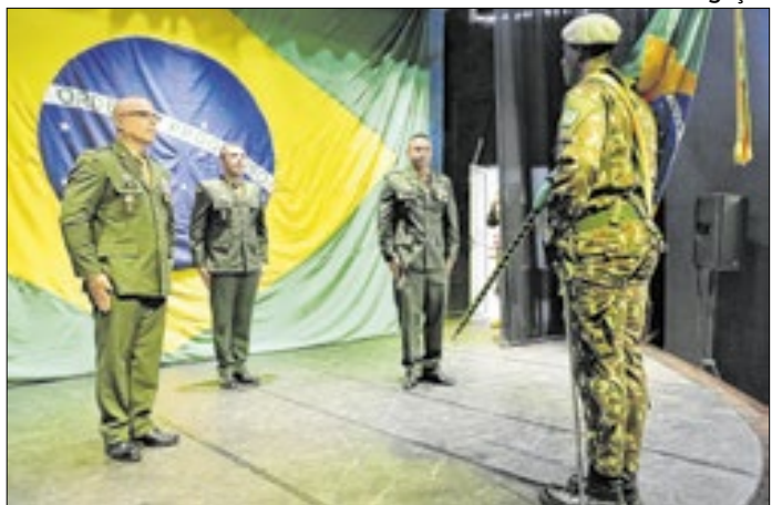
Mudança foi realizada nesta segunda-feira