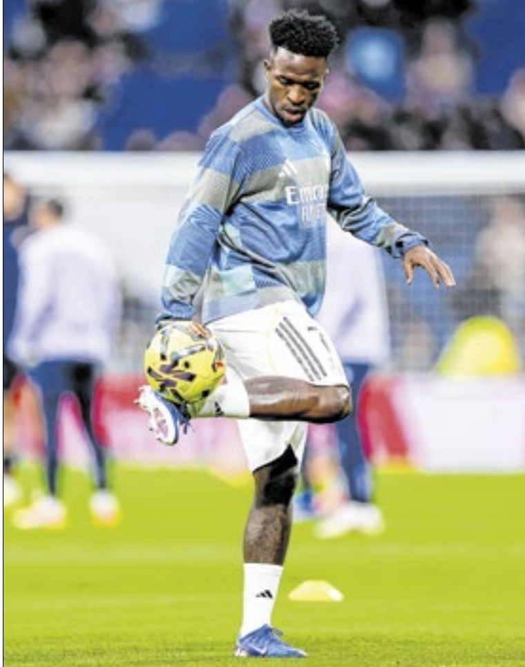
Vinicius Jr. ouviu longas vaías da torcida madridista no último jogo do Real Madrid no Santiago Bernabéu

Além disso, vaías e ambiente podem travar renovação do atleta com o Real Madrid