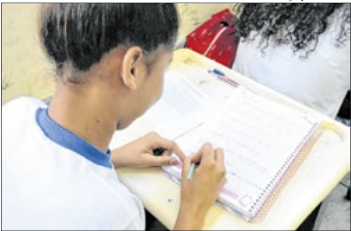
Unidades da rede estarão abertas de 21 a 28 de janeiro