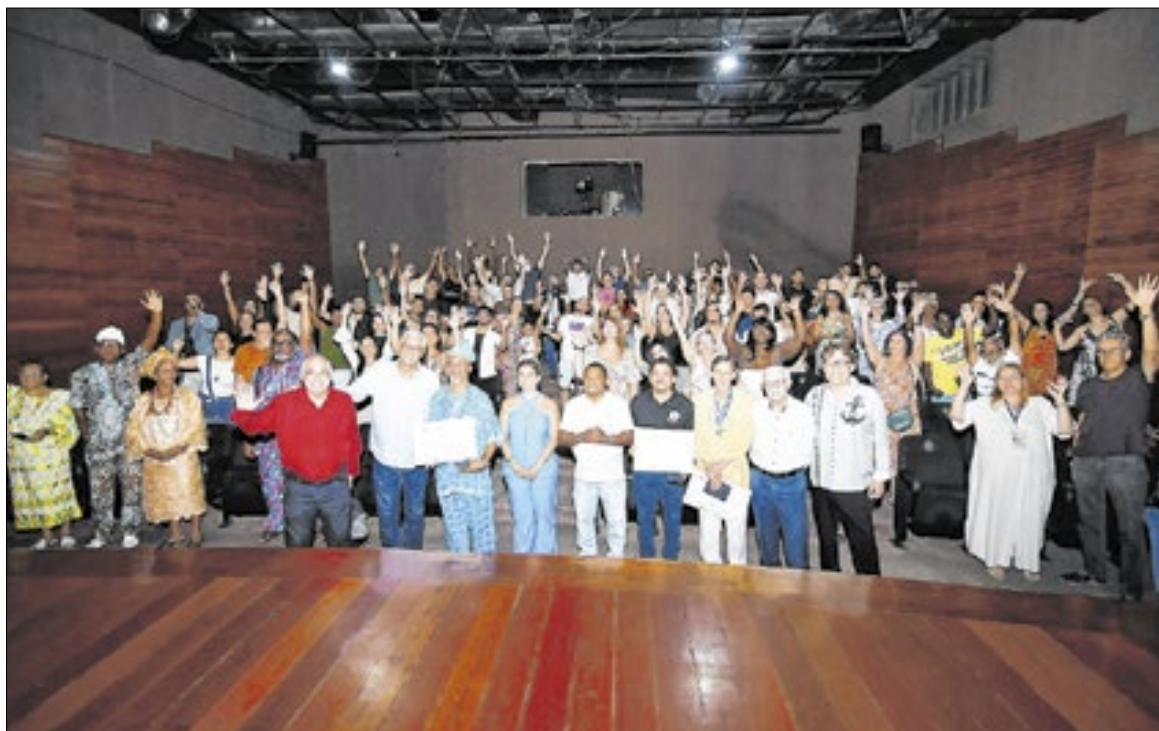
Destaques da Cultura iguaçuana foram reconhecidos pela prefeitura do município