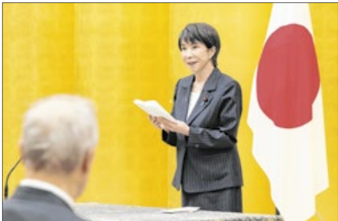
Takaichi anunciou eleições parlamentares para fevereiro