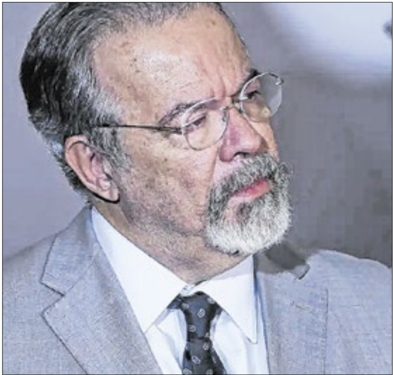
Jungmann foi ministro de FHC e Michel Temer

Correspondentes de TVs estrangeiras estão preocupados com, segundo eles, decisão da Liesa de proibir que façam imagens na concentração das escolas de samba. Alegam que isso vai restringir a cobertura do Carnaval aos blocos de rua. A coluna procurou a Liesa para saber mais detalhes da restrição.