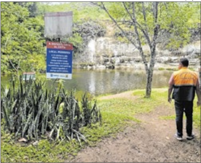
Ações aconteceram em cachoeiras da cidade

As ações da Operação Verão 2026 seguem em Itatiaia. No fim de semana, equipes atuaram nas cachoeiras de Penedo, Três Cachoeiras, Cachoeira das Três Bacias e Usina Velha, além da captação de água e da extensão do Rio Campo Belo. O objetivo é acompanhar as condições dos locais, orientando visitantes e observando o clima da região para garantir a segurança.