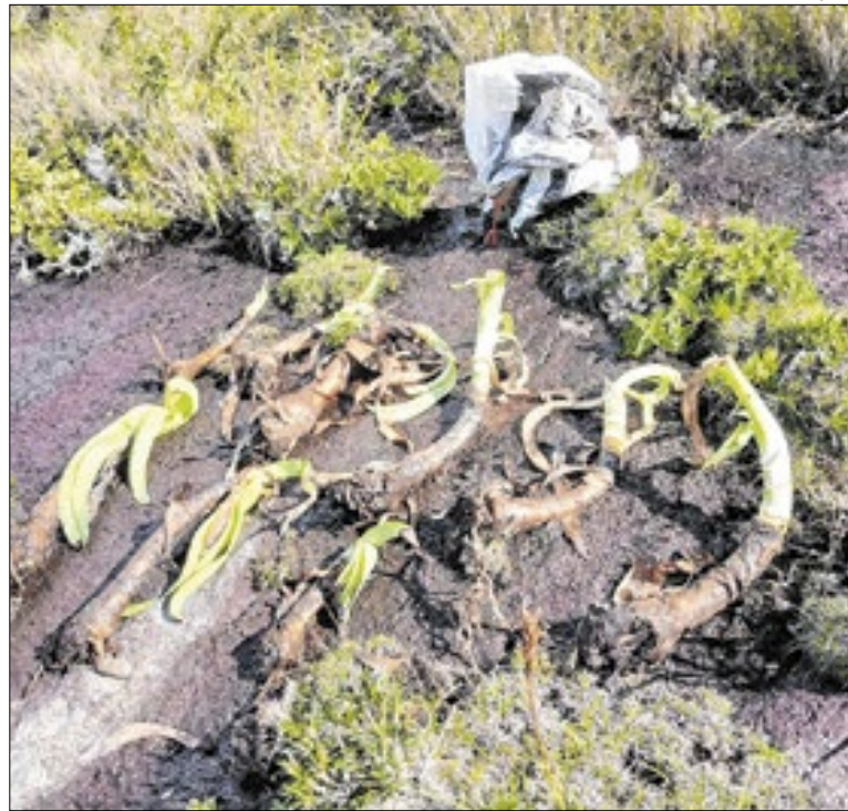
Espécie endêmica do RJ, é avaliada em milhares de dólares

Segundo a concessionária Águas do Imperador, após a normalização do fornecimento de energia na região, por parte da Enel Rio, o sistema de abastecimento de água será retomado gradativamente com normalização total prevista para as áreas mais altas do bairro durante a noite desta terça-feira.