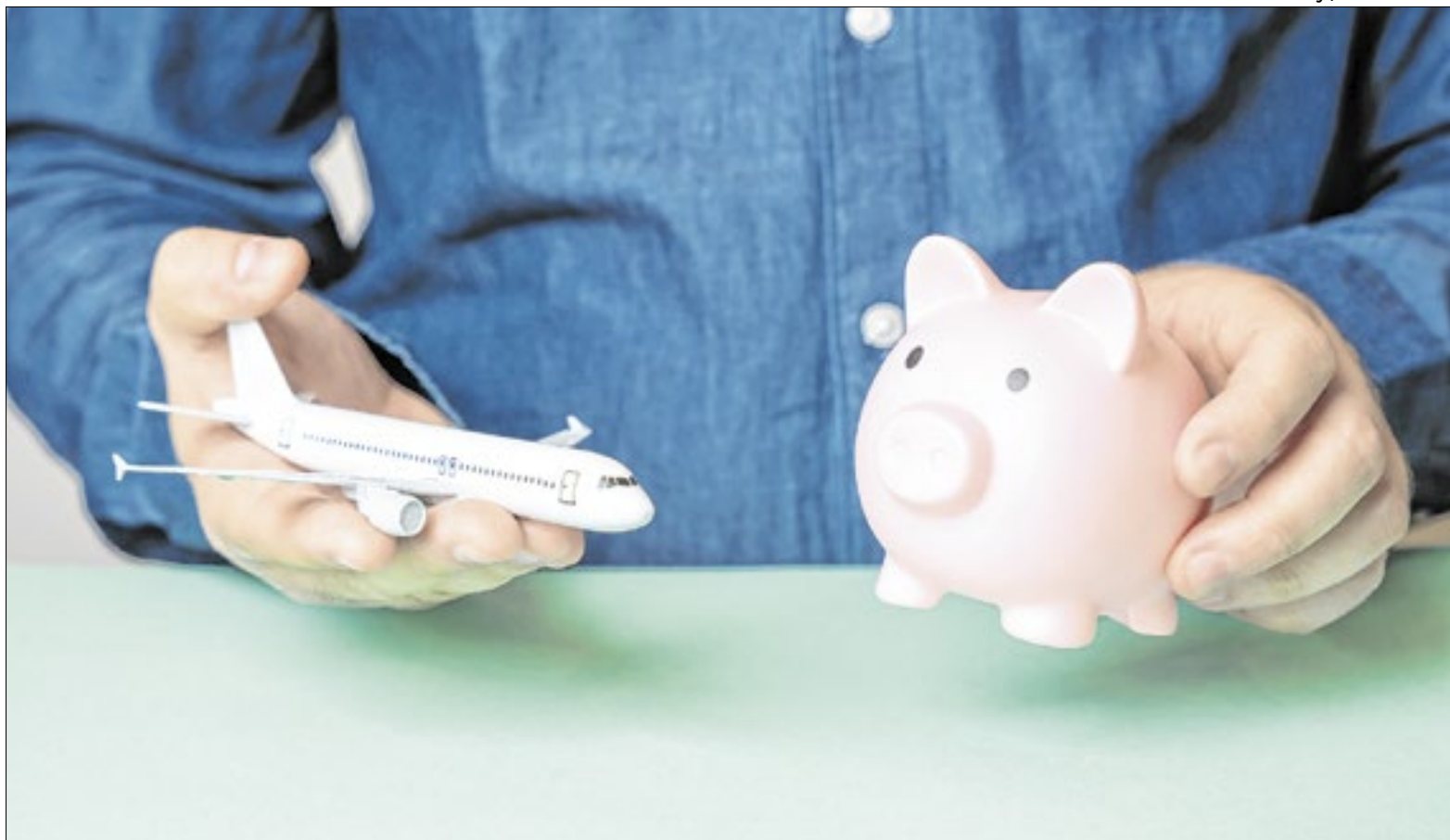
Uma boa estratégia é ficar atento às promoções de compra de pontos com desconto

Nessa segunda opção, você paga para transferir à companhia aérea mais pontos do que você tem no saldo do seu programa bancário (Livelo e Esfera). Assim como comprar milhas, fazer isso em geral não compensa, mas boas promoções acabam gerando milhares muito baratos.