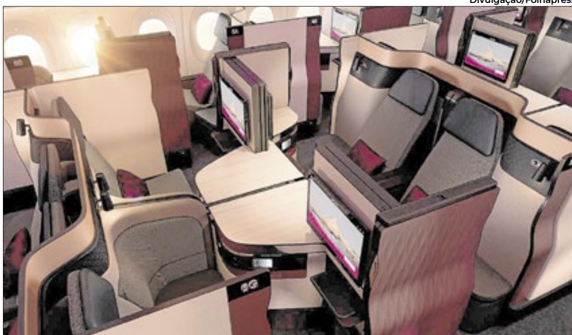
A configuração quádrupla da Qsuite, que dá versatilidade à cabine da Qatar Airways

A combinação do custo de aquisição baixo com emissões baratas, em tarifa award, é o segredo