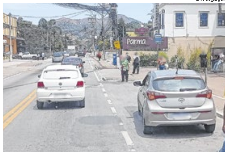
Distrito turístico enfrenta gargalos viários e pede melhorias

O problema atinge diretamente o comércio local, que depende da circulação de clientes com segurança e conforto, além de escolas e prestadores de serviço que enfrentam dificuldades diárias para aces-