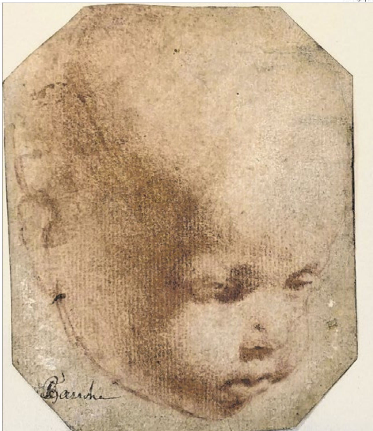
Obra “Menino Jesus”, que pode conter o DNA de Leonardo Da Vinci

Antes de chegar ao cromossomo Y, porém, os pesquisadores analisaram toda a “biodiversidade” acumulada