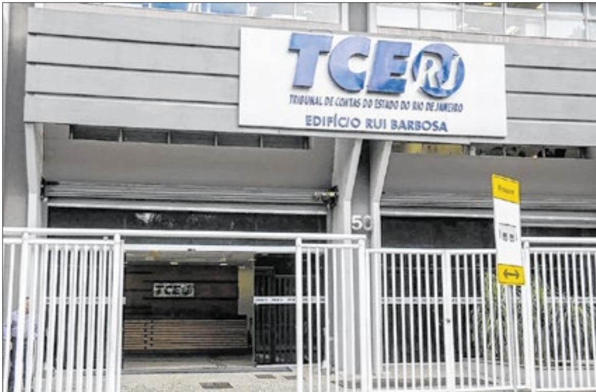
Processo segue para análise da área técnica de controle externo do TCE-RJ

O ponto central da apuração é a exigência, no edital, de três certificações internacionais como condição para participação na licitação: ISO 27001, ligada à segurança da informação; ISO 20000, relacionada à gestão de serviços de tecnologia da informação; e ISO 9001, que trata de sistemas de gestão da qualidade. A empresa autora da representação sustenta que essas certificações não são exigidas por lei, têm caráter