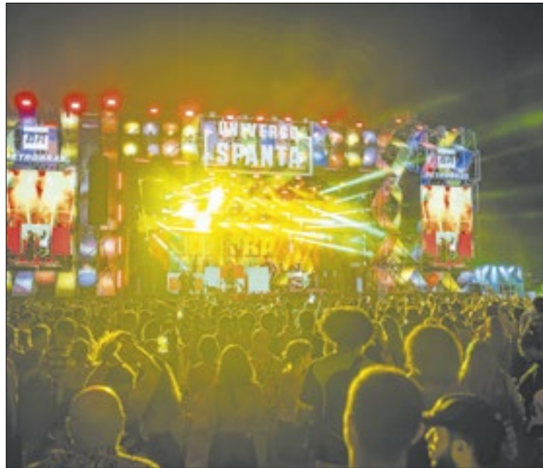
Universo Spanta segue no fim de semana com novidades

Ainda em coletiva após a reunião desta segunda-feira (19), Paes declarou que “quem do partido votar a favor de candidatura ligada ao Bacellar, será expulso. Não é aceitável que isso aconteça”. Pensando nas eleições, o atual prefeito do Rio reafirmou o apoio do PT e do presidente Lula para a disputa ao Governo do Estado.