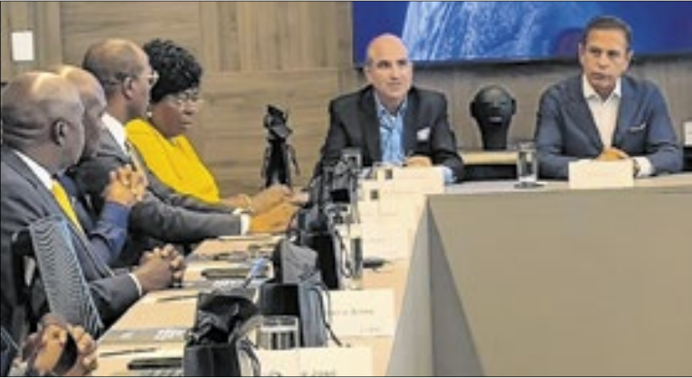
Fundador e copresidente do Conselho do Lide, João Doria recebeu autoridades e empresários para uma reunião