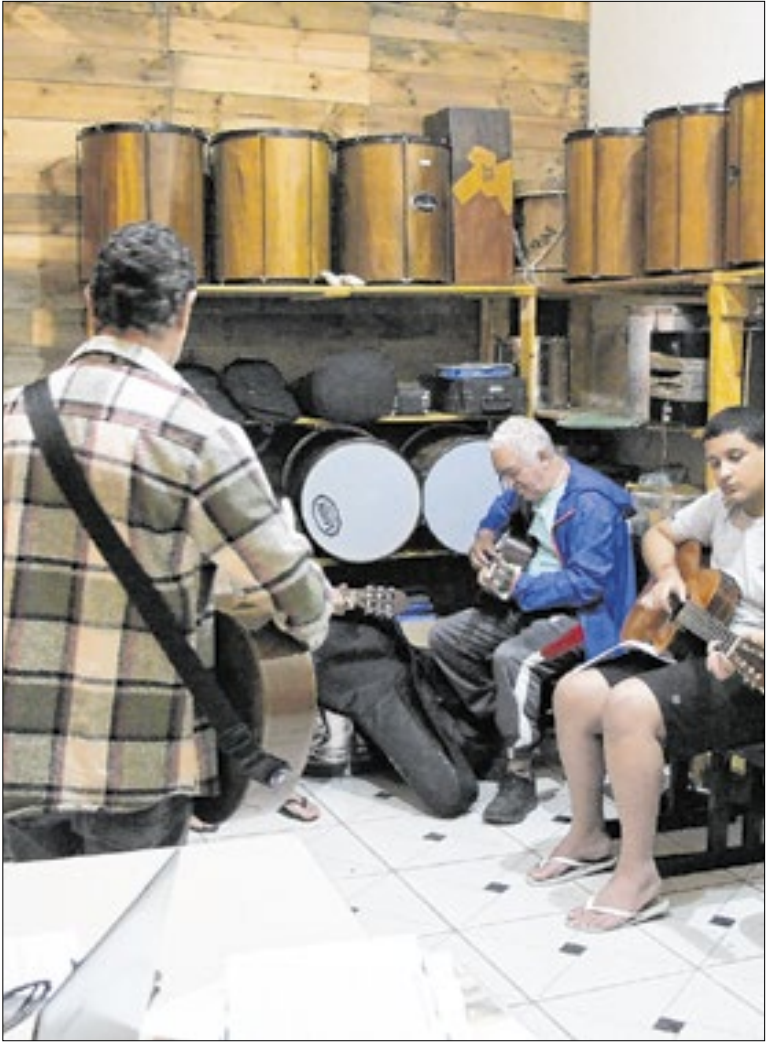
Cursos acontecem em diferentes dias e horários

Estão abertas as inscrições para o curso de mecânico de manutenção de motores Ciclo Otto, realizado no Centro de Capacitação e Inovação de Porto Real, focado em formação profissional (CECAPI Real), em parceria com o Firjan SENAI. Inscrições devem ser feitas no CECAPI.