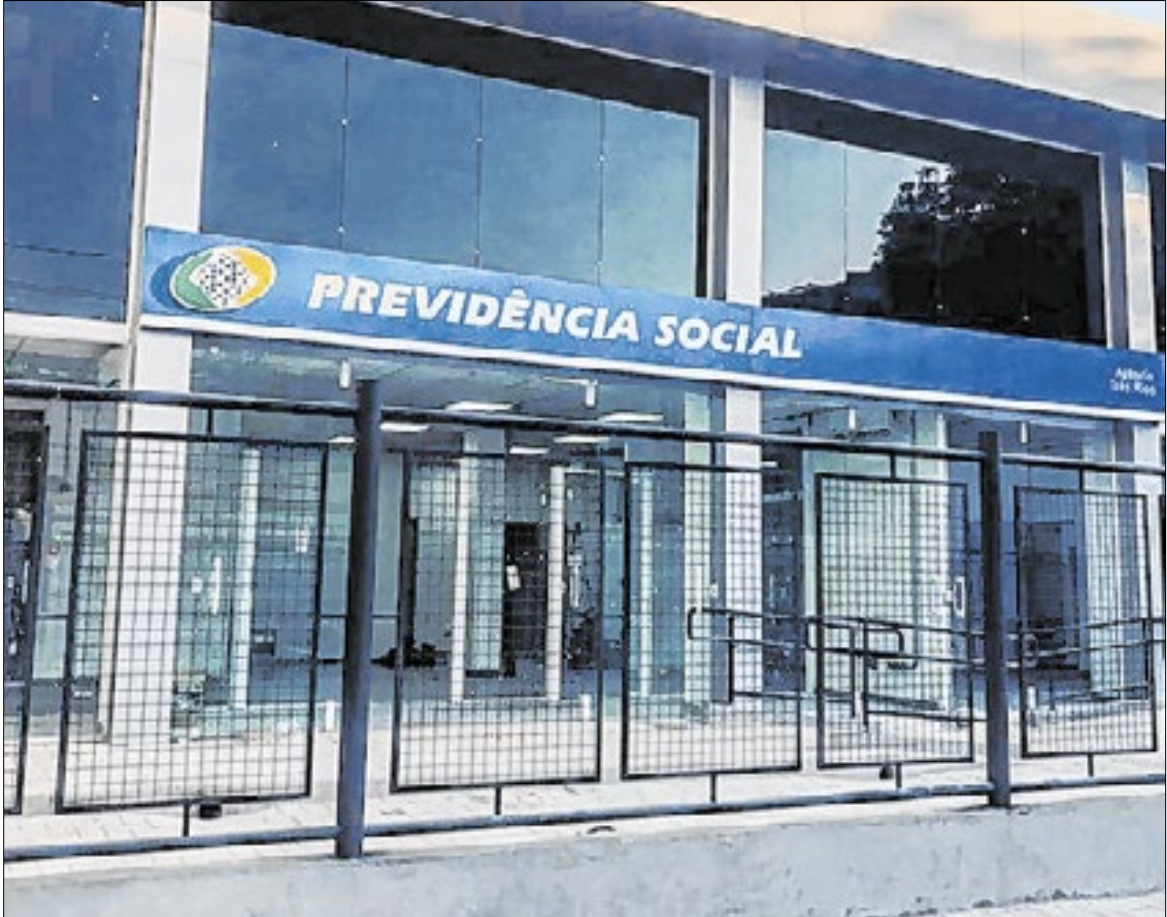
Imóvel cedido possui aproximadamente 905 m² e está localizado na Rua Presidente Vargas

futura unidade de atendimento da Previdência. As partes assumiram as responsabilidades civis e criminais relacionadas aos imóveis, declarando que não há pendências legais. Também ficou acordado que todos os impostos e taxas passam a ser de responsabilidade dos novos proprietários a partir da data da escritura. Outras medidas jurídicas e documentais foram adotadas para viabilizar a permuta. Entre elas, a renúncia, por parte da Dape Patrimonial, à indenização referente ao excesso de valor do imóvel por ela cedido. O INSS segue empenhado na preservação dos bens sob sua administração e na destinação adequada de imóveis não funcionais, com foco no uso eficiente do patrimônio público e na ampliação do atendimento à população.