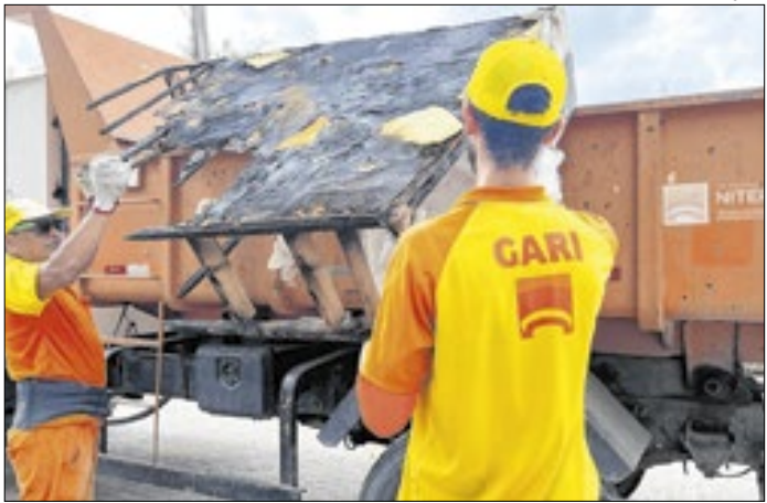
Companhia passar a contar com o cadastro de reciclagem