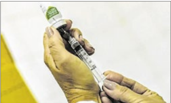
Doses encontram-se disponíveis para a população