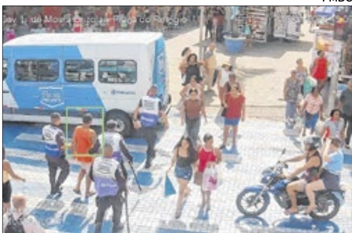
Homem foi encaminhado à delegacia de polícia