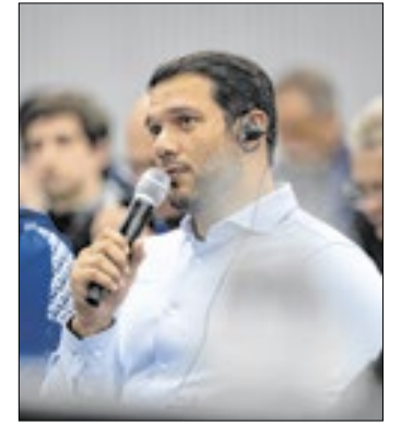
Samir Xaud, presidente da CBF, participou de evento

Será outra oportunidade para Vini Jr. voltar a fazer as pazes com o gol e, quem sabe, conseguir um pouco de paz junto à torcida me-rengue.