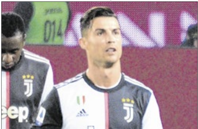
Clube cobrava cerca de R$ 61 milhões de CR7 na Justiça