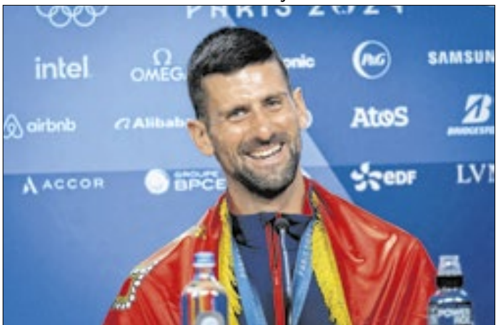
Djokovic quer fazer história mais uma vez na Austrália