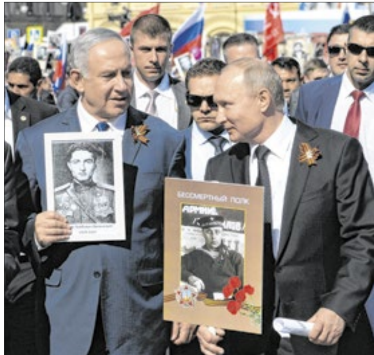
Líderes em guerra podem integrar grupo que governará Gaza

Um incêndio em um shopping na cidade de Karachi, no Paquistão, que começou no sábado (17), matou ao menos 21 pessoas e deixou 80 feridos. Outras 58 seguem desaparecidas. Bombeiros realizaram na segunda (19) o resgate dos corpos das vítimas entre os escombros ainda fumegantes devido ao calor das chamas.