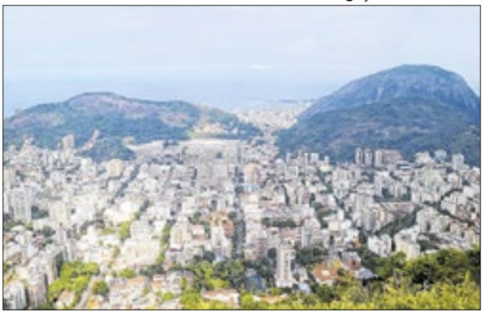
Apesar da queda do IGP-M, setor fechou com alta de 9,44%