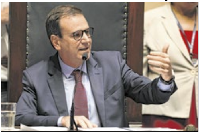
Em 2014, Paes proibiu derrubada das árvores