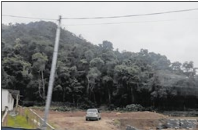
Local segue desde setembro sem obras