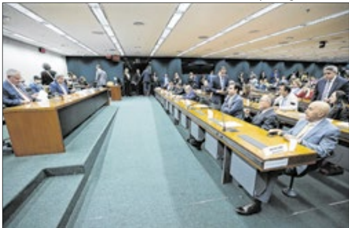
Comissão de Orçamento: daí que se azeita a máquina