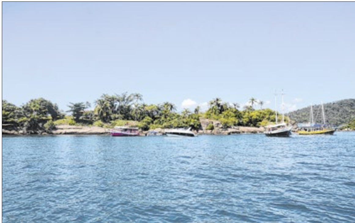
Com cerca de 65 ilhas, a baía de Paraty demanda de embarcações para ser visitada

Também há relatos de cobrança em estacionamentos e no comércio. No último dia 13, após reportagem da Folha mostrar a expansão do CV em Paraty, a 2ª