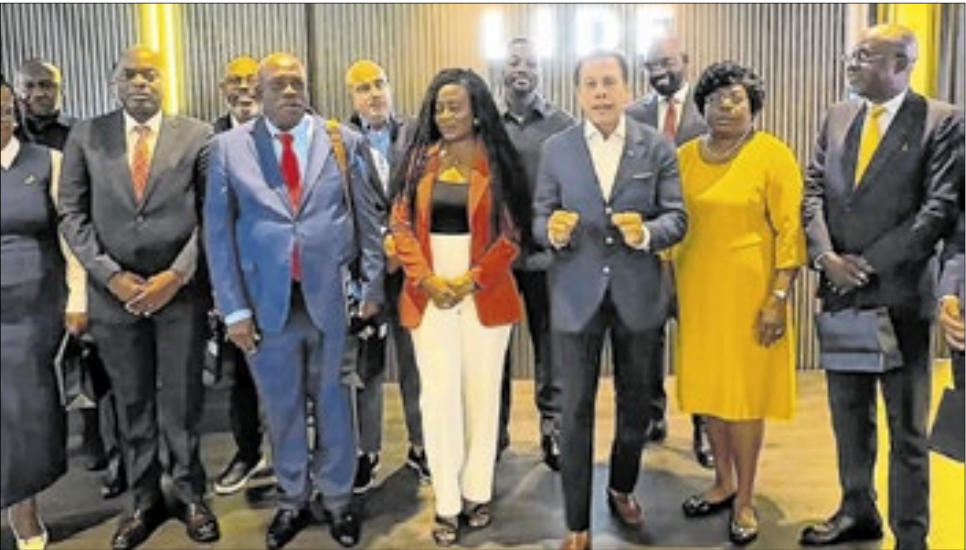
O anfitrião João Doria com a delegação angolana na Casa Lide, em São Paulo