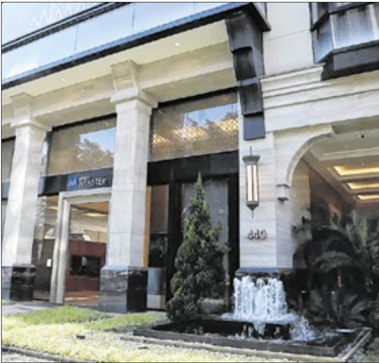
600 mil solicitações de ressarcimento já foram feitas

“Os políticos passam a viver, assim, nessa eterna troca de favores”, conclui Melillo Dinis. “E hoje eles só têm os bônus desse processo”, embolsem ou não o dinheiro das emendas. O projeto do MCCE visa colocar algum ônus nesses expedientes. A coleta das assinaturas deve começar logo depois de 4 de fevereiro.