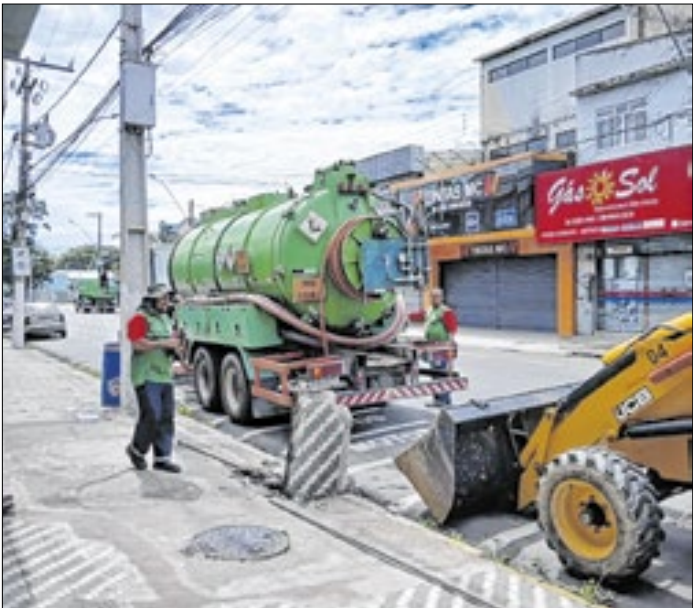
Serviço foi executado após a pavimentação asfáltica