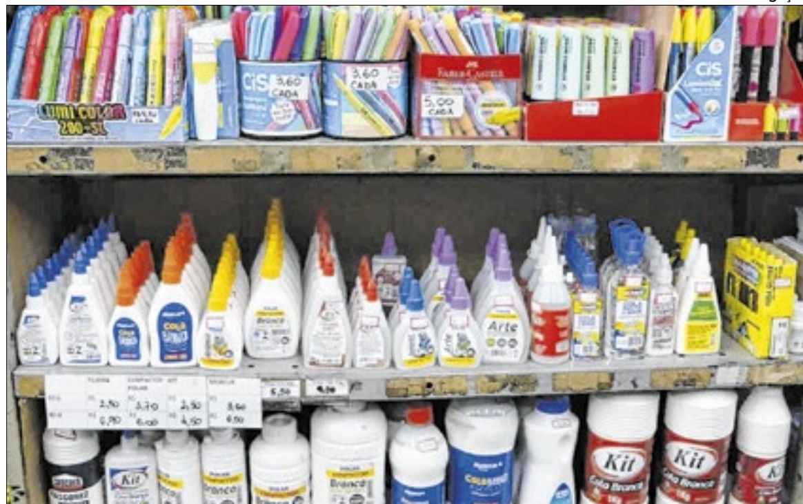
Entre janeiro de 2023 e janeiro de 2026, os preços de material escolar acumularam alta de 29,5%

“O descolamento evidencia pressões específicas de custos — como papel, logística, insumos importados e câmbio — e reforça o caráter regressivo do gasto educacional”, explica a Ibevar.