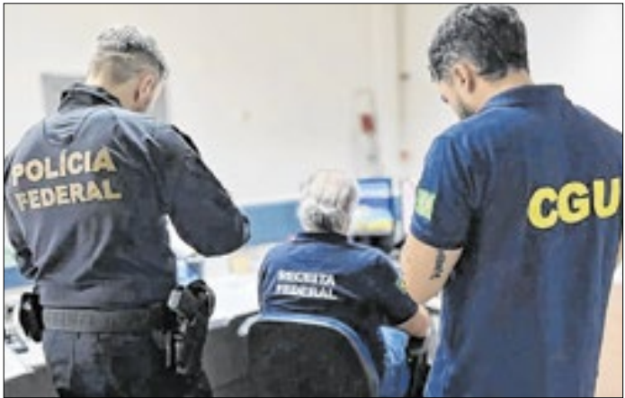
Operação Overclean vai descobrindo o que parecia óbvio