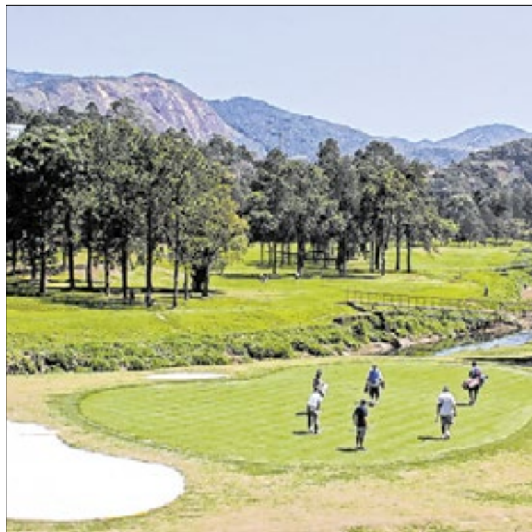
Terreno pertence ao Teresópolis Golf Club

Na área da Saúde, o teto mensal passa a ser de 36 horas a 100% e 90 horas a 50%. Nas demais secretarias, o limite será de 36 horas a 100% e 60 horas a 50%. Em situações excepcionais, apenas servidores da Saúde e da Guarda Municipal poderão ultrapassar esses limites, desde que haja justificativa formal.