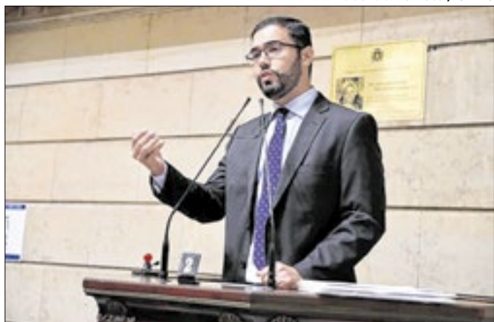
Vereador entrou com ação popular em Teresópolis