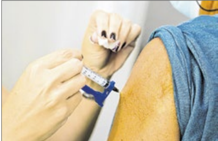
Imunizante liberado para quem tem entre 10 e 20 anos