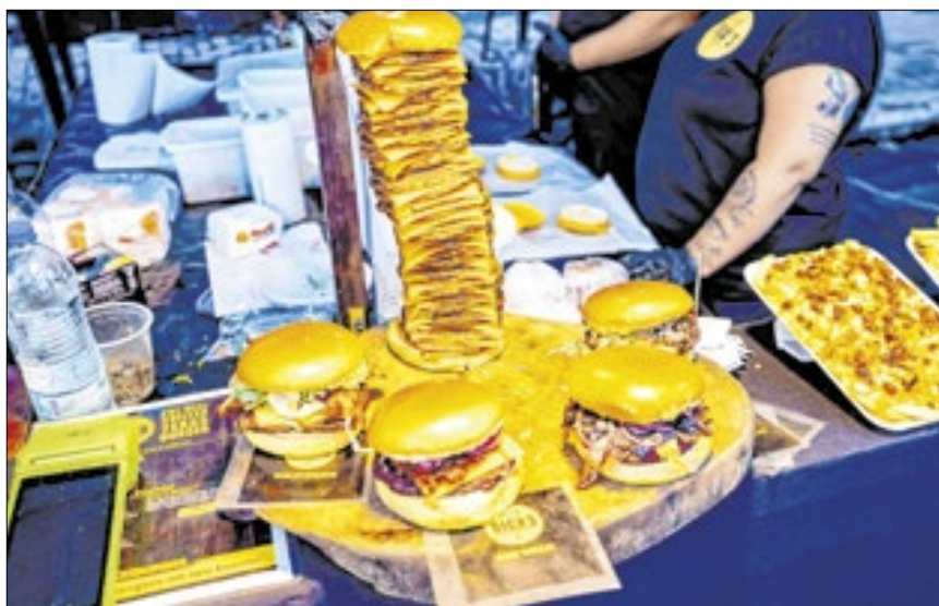
Feira levará para Caxias três dias de muita diversão, boa comida e atividades gratuitas

“A nossa parceria com a Feira Nacional do Podrão vai garantir a realização de mais uma edição de sucesso na nossa cidade. Vai ser um fim de semana de muita cultura, gastronomia, família reunida e muita animação para o povo caxiense. Nossos moradores