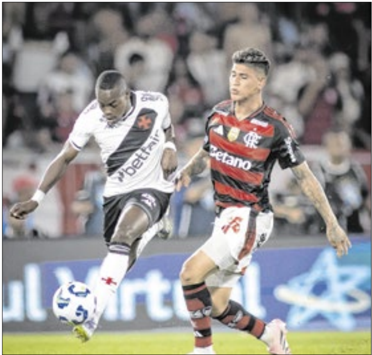
Clássico dos Milhões terá jogadores titulares do Flamengo