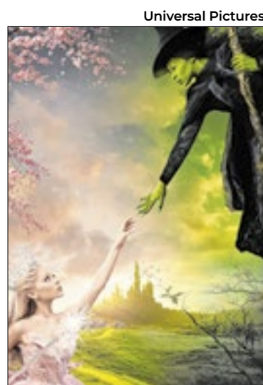
Wicked, produção da Universal Pictures, foi isca

Assim que as vítimas entram no site falso, eles são direcionados a “criar uma conta gratuita” para visualizar o conteúdo. Essa