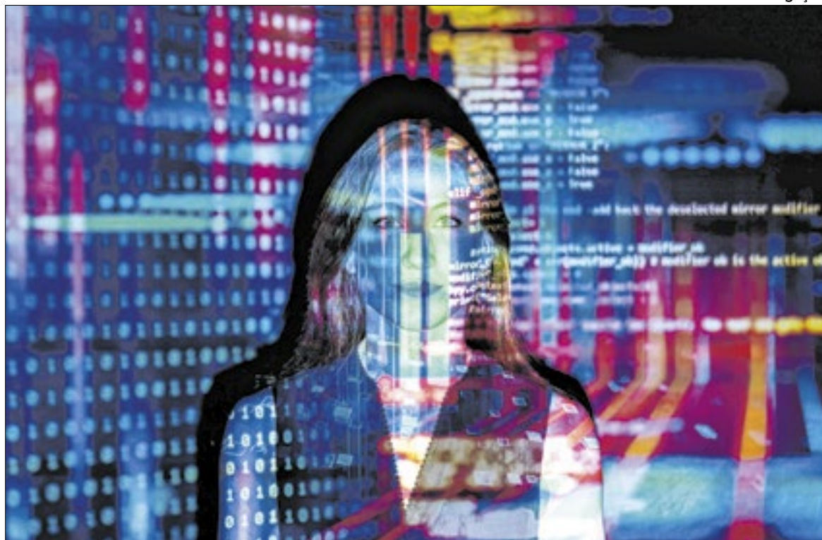
Atenção redobrada para não cair em golpe financeiro usando nomes de cartórios